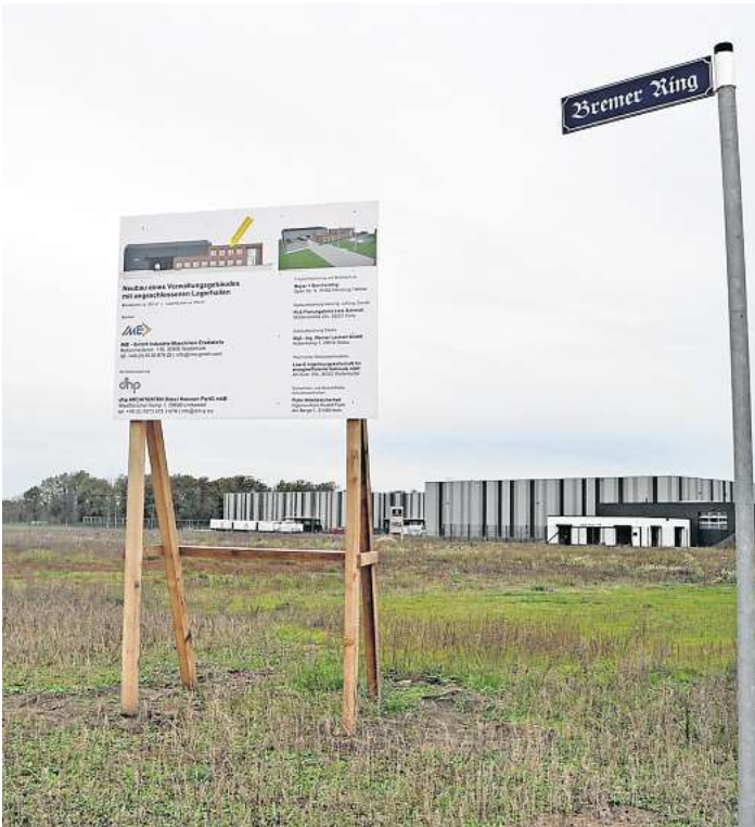
Noch sind Parzellen zu haben: Bislang sind elf der 18 Grundstücke im künftigen Gewerbegebiet südlich der Lekkerland-Hallen verkauft.

Bei der Bebauung der Flächen müssen klare Kriterien eingehalten werden. Die Grundflächenzahl von 0,6, die den Anteil der maximal zu bebauenden Fläche des Grundstücks angibt, muss eingehalten werden, und auch die Außenlagerflächen sind be-