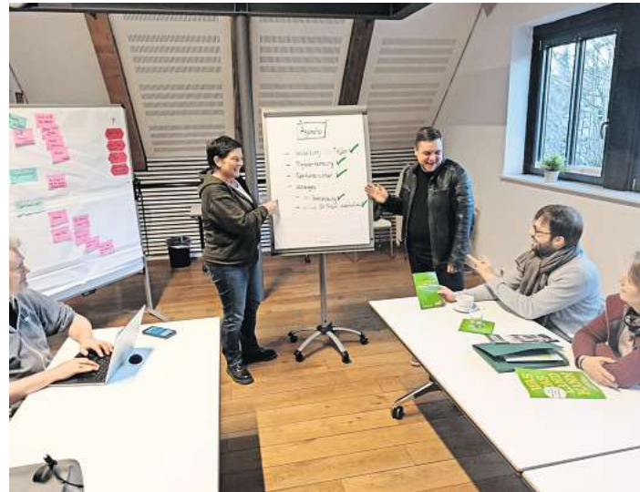
Die Grünen haben sich jetzt zur ihrer Klausursitzung im Bürgerhaus in Bissendorf getroffen.

Ein weiterer Schwerpunkt wird die Fortsetzung der Diskussion über den geplanten Windpark sein. Trotz des positiven Feedbacks auf unsere Podiumsdiskus-