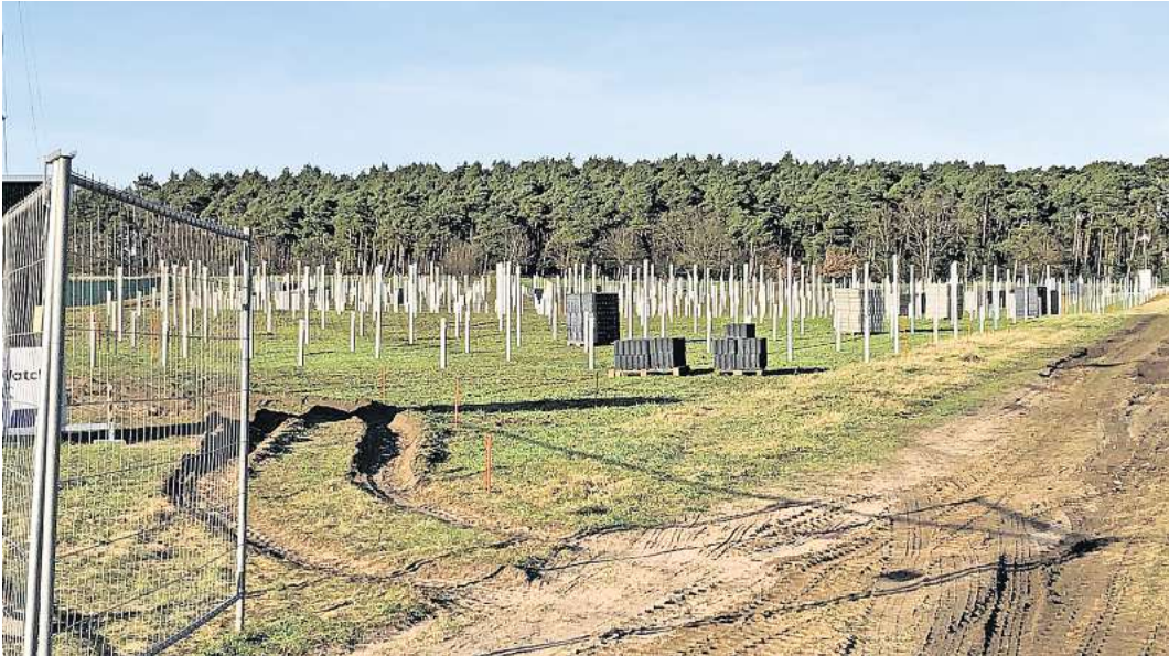
Rund 20 Gutachten mussten für den Bau des Solarparks angefertigt werden.

Im Vergleich zu den vorherigen Erfordernissen ist das aber laut dem Investor gar kein Problem. Denn Bäßmann benötigte für sein Projekt eine Baugenehmigung – und da hatten viele