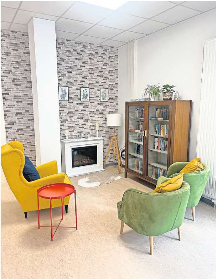
Kamin und Bücherregal: Auch diese Sitzecke in der Agora des Mehrgenerationenhauses lädt zum Verweilen ein.

Abkommender Woche starten im MGH wieder die Computerkurse für Seniorinnen und Senioren. Es gibt sie seit mehr als 20