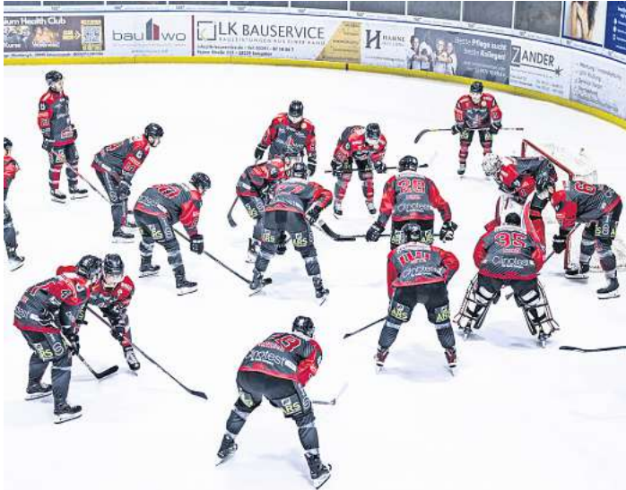
Die Scorpions biegen mit Blick auf die Playoffs auf die Zielgerade ein.

Bedenkt man, dass am Sonntagvormittag, als die Scorpions vor dem Eisstadion in der Wedemark den Bus zur Auswärtsfahrt nach Erfurt bestiegen, sowohl Dylan Wruock als auch Davis Koch und Ralf Rinke eine Trainingseinheit im Stadion absolvierten, um sich für ihren baldmöglichsten Einsatz im Scorpions Team fit zu machen, wird deutlich, dass sich die Scorpions auch personell auf die bald beginnenden Playoffs gut vorbereitet haben.