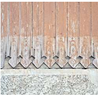
Welches Motiv wird im Februar gesucht?

Zur Lösung für Januar: Wieviel Mühe sich die Bauern vor 400