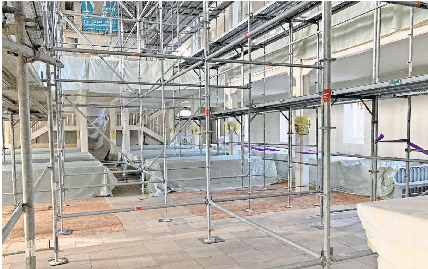
Ein Blick vom Altar: So sieht die Kirche St. Martini derzeit innen aus.

Deckensanierung im Brelinger Gotteshaus neigt sich dem Ende zu. Danach geht es an die Orgel.