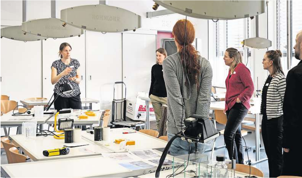
Klimawandel im Unterricht: Lehrer hören bei einem Workshop zu.