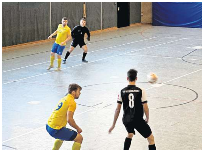
Ein spannender Hallenkick wurde in Brelingen geboten.

Durch einen 1:0-Sieg zog der Gastgeber ins Halbfinale ein, wo dann eine Niederlage gegen die 1. Herren des Mellendorfer TV folgte. Im zweiten Halbfinale trafen die I.Herrenmannschaften des SV Resse und der SG Baugelb Elze aufeinander. Die Elzer entschieden dieses Duell deutlich mit 5:1 für sich. Auch das Finale entschieden die Blaugelben für sich mit 1:0 gegen den Mellendorfer TV und feierten den Turniersieg. Den dritten Platz auf dem Treppchen erreichte der 1.FC Brelingen, die das kleine Finale mit 4:0 gegen den SV Resse gewann. Bester Torschütze des Turniers wurde Finn Jadischke vom Mellendorfer TV und als bester Torhüter wurde Marvin Schrader von der SG Resse/Brelingen gewählt. „Eine gelungene Veranstaltung und perfekter Startschuss für den Auftakt der Rückrunde“, resümierte Martin Schröter vom 1.FC Brelingen.