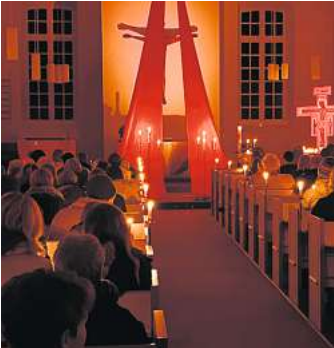
An drei Abenden wird in Bissendorf eifrig geprobt.