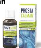
Abbildung Betroffenen nachempfinden PROSTACALMAN. Wirkstoffe: Serenoa repens a, Pariara brava b, Populus tremuloides Dil. DZ. Prostaocalman wird angewendet entsprechend den homöopathischen Arzneimittelbildern. Dazu gehören: Blasenentzündungen und Beschwerden beim Wasserlassen, bei vergrößerter Prostata. www.prostaocalman.de • Zu Risiken und Nebenwirkungen lesen Sie die Packungsbeilage und fragen Sie Ihre Ärztin, Ihren Arzt oder in Ihrer Apotheke • PharmaSPG GmbH, 82166 Grafelfing

Für Ihre Apotheke: Prostacalman (PZN 13588549)