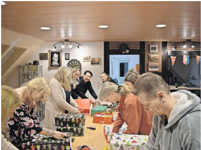
Die Jugendfeuerwehr Hellendorf freut sich über die großzügigen Spenden.

Zusätzlich konnte die Jugendfeuerwehr noch eine Geldspende von 355 Euro an die Obdachlosenhilfe überreichen, die von den Kunden bei Edeka Poppe in Brelingen, Schönhoff's Hofladen und Forellenhof in Hellen-dorf gespendet wurden. Zusätzlich zu den Sach und Geldspenden hatte die Jugendfeuerwehr dieses Jahr auch wieder Kleiderspenden angenommen. Es sind mehr als 15 Säcke mit Decken, Jacken, Kleidung, Handschuhe sowie Mützen und Schals die teilweise extra gestrickt wurden zusätzlich zusammen gekommen.