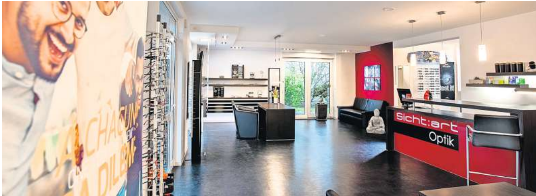
Klar strukturiertes und gemütliches Ambiente bei Sicht:art Optik in der Mittelstraße 34.

„Ihre Zufriedenheit ist unser Maßstab“ wird die Maxime des Teams von Sicht:art Optik ganz bestimmt auch in den nächsten 15 Jahren und darüber hinaus lauten!