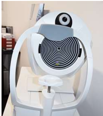
Der Wave analyzer liefert hochauflösende Daten.

Aus diesem Grund haben die Inhaberinnen sich auch zur Anschaffung eines Wave analyzers entschlossen: Denn je präziser die Vermessung der Augen, desto präziser