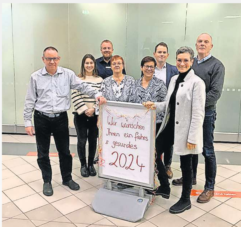
Die Mitarbeiterinnen und Mitarbeiter der Sparkasse in der Wedemark sind in allen Fragen kompetente Ansprechpartner für ihre Kunden.

Zunächst analysieren Sie Ihre aktuelle Situation und finden heraus wie gut Sie bereits abgesichert sind. Danach ermitteln Sie Ihre persönlichen Risiken und somit Ihren Absicherungsbedarf. Auch können Sie erfahren, wo Sie möglicherweise zu viel zahlen.