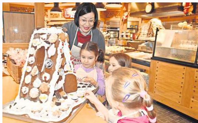
Nach getaner Arbeit dürfen die Kinder am Lebkuchenhaus knabbern.