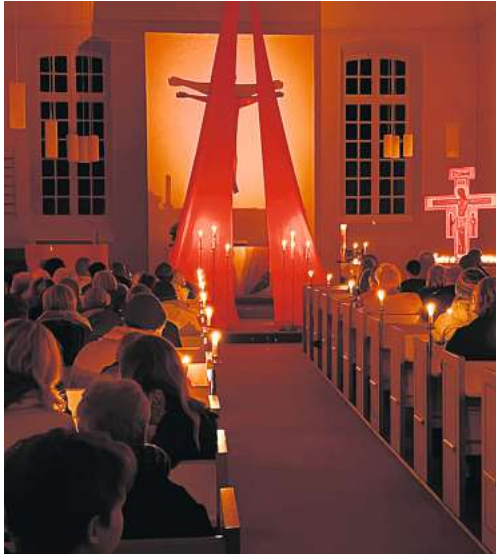
In Bissendorf steht am morgigen Sonntag die Lichternacht auf dem Programm.

Friedenslicht aus Bethlehem entzünden und verteilen – nach und nach wird das Licht den Raum erhellen. Die Flamme wurde auch in diesem Jahr in Bethlehem, der Geburtsstadt Jesu, entzündet und hat von dort eine Reise quer durch Europa angetreten. Pfadfinderinnen und Pfadfinder verteilen es und wollen damit ein Zeichen setzen für den Frieden. Wer das Licht mit nach Hause tragen möchte, bringt eine Kerzenlaterne mit. Anschließend wird das Friedenslicht in einer Kerzenlaterne vor dem Pfarrhaus brennen – auch dort kann es gerne als besonderes Geschenk für jemanden abgeholt und weitergegeben werden.