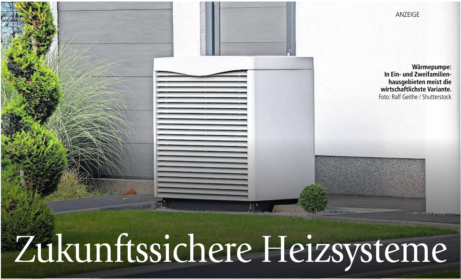
ANZEIGE Wärmepumpe: In Ein- und Zweifamilienhausgebieten meist die wirtschaftlichste Variante.

Es gibt verschiedene Varianten. Die häufigste ist die Luft-Wasser-Wärmepumpe, die der Umgebungsluft die Wärme entzieht und in die Heizkörper bringt. So benötigen die Anlagen nur 1 kWh Strom, um gut 3 kWh Wärme zu gewinnen. Zudem ist der Strom von der CO2-Abgabe befreit und stammt idealerweise nur aus Wind und Sonne. Andere Wärmepumpen nutzen Erd- und Grundwasserwärme, brauchen weniger Strom,