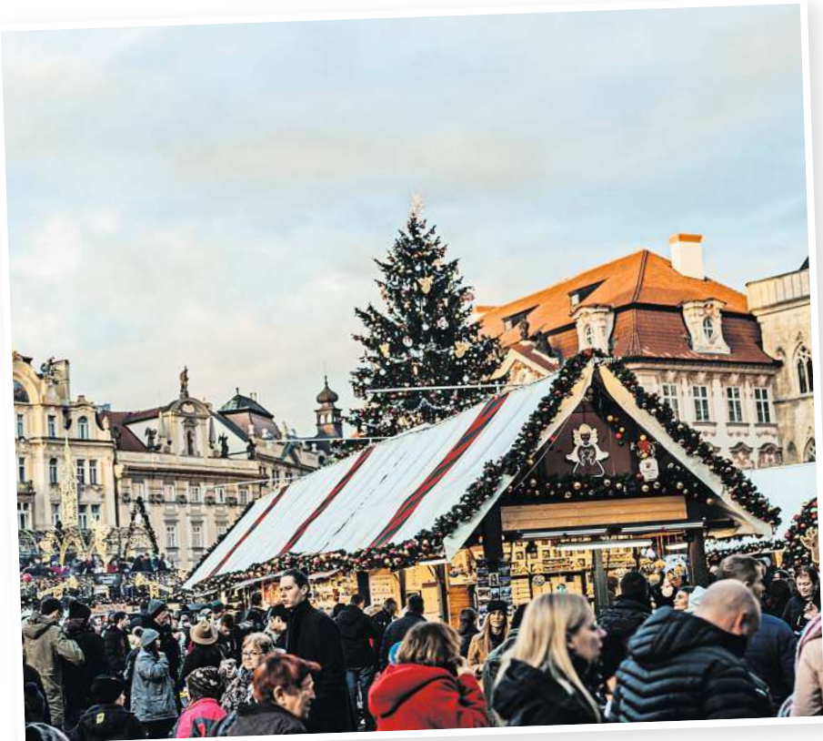
Der Weihnachtsmarkt gehört zu den beliebtesten Attraktionen in der Adventszeit.