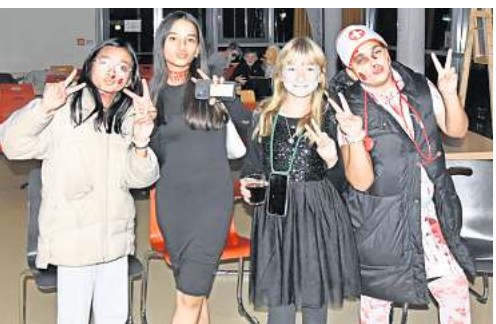
Die Klasse 7G1 und Friends hatten selbst ein Theaterstück geschrieben.