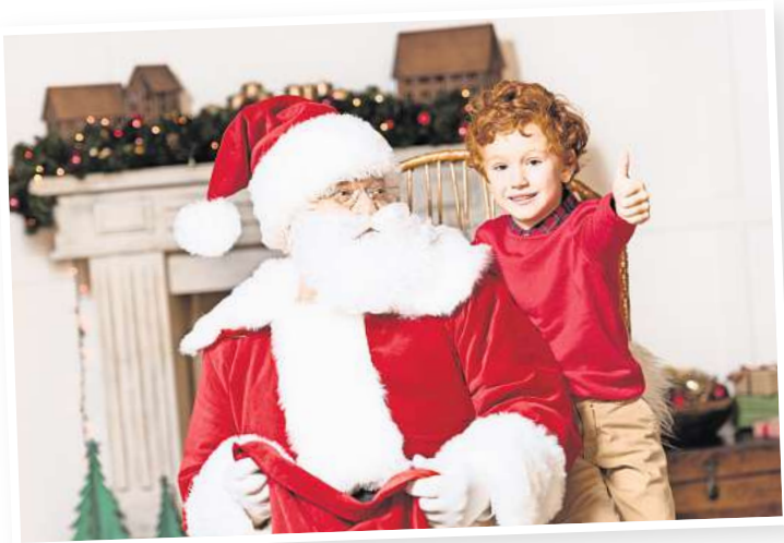
Der Besuch vom Weihnachtsmann ist ein Highlight für Kinder.

sche gibt, sollten diese im Vorfeld mit der Agentur kommuniziert werden, damit sie noch berücksichtigt werden können. So können beispielsweise individuelle Briefe vorgelesen oder besondere Erfolge aus dem vergangenen Jahr vom Weihnachtsmann gelobt werden.