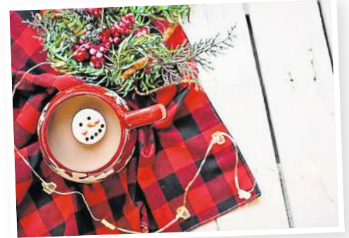
Ein Heißgetränk erwärmt Körper und Seele.