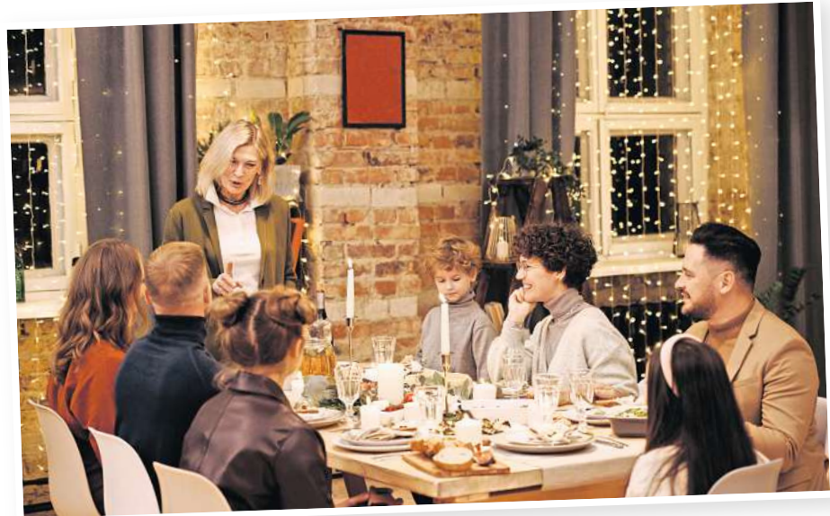
Kommunikation und Kompromissbereitschaft sorgen für Harmonie.

Während in Kindertagen Weihnachten noch voller Zauber und wunderbarer Überraschungen steckt, sind diese im Erwachsenenalter leider zu oft von Stress und Streitigkeiten überschattet. Mit ein paar Verhaltenstricks kann dies allerdings vermieden werden. Vor allem, wenn die Verwandtschaft an einem Tag im Jahr aufeinanderprallt, ist Kommunikation entscheidend. Eigene Wünsche und Bedürfnisse zu äußern, ist wichtig, denn die andere Person kann leider keine Gedanken lesen. Eng damit verbunden ist jedoch die Bereitschaft zu Kompromissen, sodass die Vorstellungen aller respektiert werden und man sich am besten in der Mitte trifft. Häufig führen aber schon allein zu hohe Erwartungen zu Enttäuschungen und schlechter Laune. Mit einer realistischen Einschätzung der bevorstehenden Situation können die Erwartungen angepasst werden. Will einem das selbst nicht gelingen, kann ein Gespräch mit dem Partner oder der Partnerin, die die aufkommende Lage gut kennt, helfen, diese zu relativieren. Perfektionismus ist eine Illusion und Missgeschicke passieren. Solange man darüber lachen und improvisieren kann, wird dies niemandem den Abend verder-