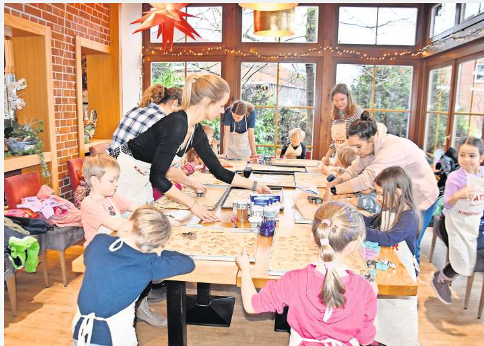
Viel Spaß hatten die Kinder der Kinnerstuuv beim Backtag in der Bäckerei Vatter.