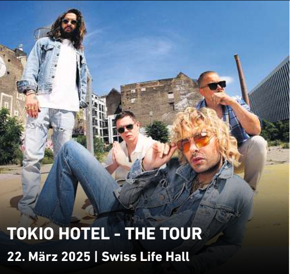
TOKIO HOTEL - THE TOUR 22. März 2025 | Swiss Life Hall

Telefonische Bestellannahme: 0511 12123333, online: tickets.haz.de // tickets.neuepresse.de