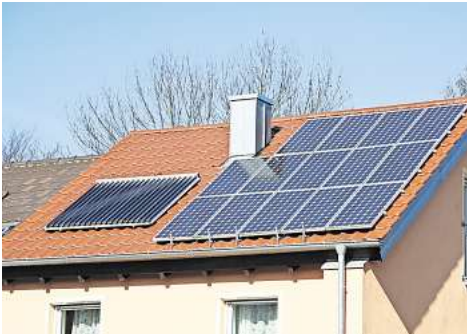
Solarthermie ergänzt im Bestand meist eine Öl- oder Gasheizung. 33603201_002623