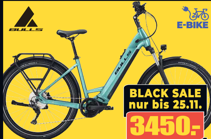
BULLS E-Trekkingrad SUV ICONIC EVO 1 Breitreifen für alle Wege & 750 Wh Bosch-Kraft in jeder Lage