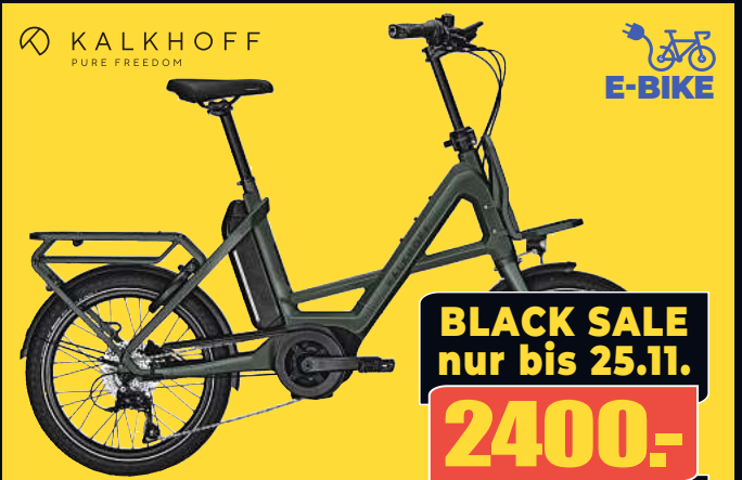
KALKHOFF PURE FREEDOM