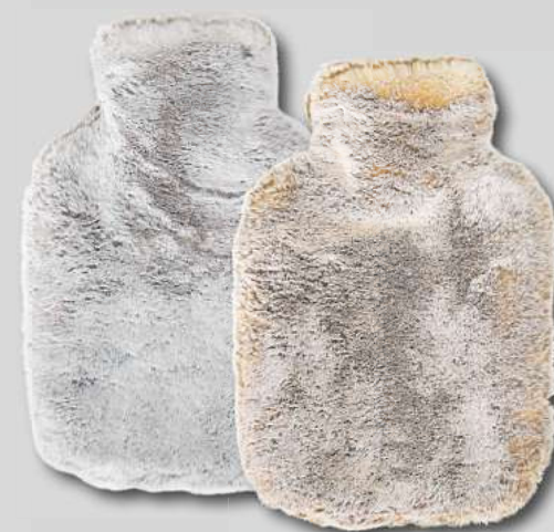
WÄRMFLASCHE „BÄR“ ODER „SILBERFUCHS“ 85% Polyacryl/15% PES, ca. 35 x 23 cm. 41730028-01, 41730029-01-F001, 41730028-02

GILT NUR FÜR NEUBESTELLUNGEN GEGEN VORLAGE DIESES COUPONS