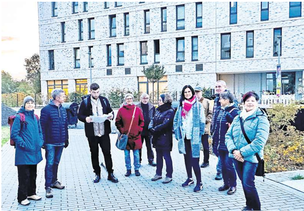
Vorzeigeprojekt: Der Klimabeirat besuchte das klimaschonend errichtete Wohngebiet Herzkamp in Hannover-Bothfeld.

Klimaangepasstes Bauen aber bedeute vor allem auch Verzicht auf Baumaterialien mit einem hohen CO 2 -Abdruck wie insbesondere Beton. Alternativen wie Holz und Lehm dürften da in Zukunft eine größere Rolle spielen, aber auch recycelte Materialien. Bei Letzterem seien allerdings die Bauvorschriften oft noch hinder-