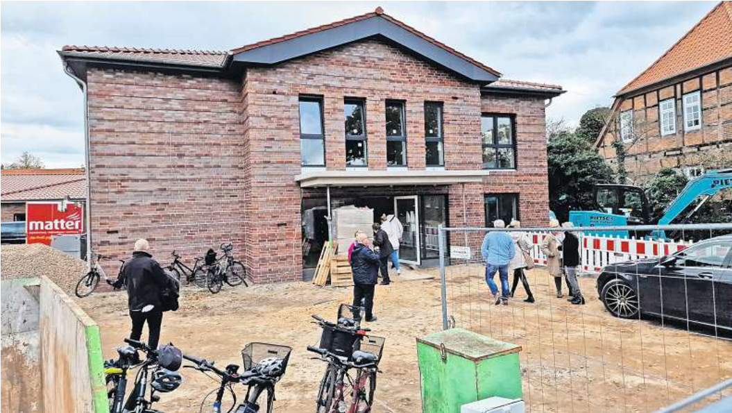
Soll im Februar eröffnen: Das Infinitas-Palliativzentrum in Fuhrberg.