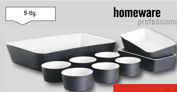
HOMEWARE PROFESSIONAL AUFLAUF- FORMEN-SET „PERFECT COOKING“ Steinzeug, geeignet bis 180 °C. 72490011