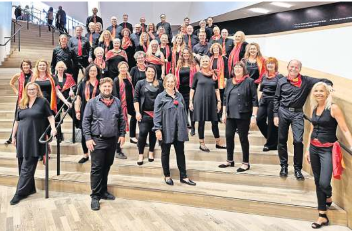
Der Langenhagener Chor „Choir under Fire“ gibt am Sonntag, 3. Dezember, ein Gastspiel in Mellendorf.