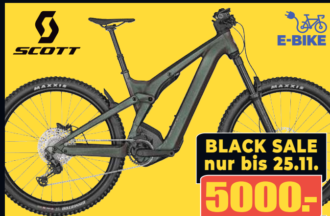
SCOTT E-MTB PATRON ERIDE 920 Mod. 23 Legendäres 160mm Fully mit 750 Wh Bosch CX-Power