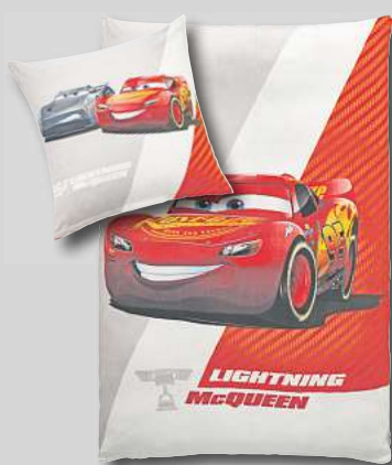
Disney HOME DISNEY HOME FLANELL-BETTWÄSCHE- GARNITUR „CARS“ 100% Baumwolle, mit Reißver- schluss, ca. 135 x 200 und 80 x 80 cm. 62310167-01