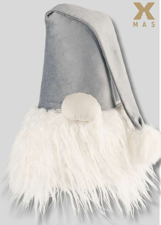
X-MAS ZIERKISSEN 100% Polyester, ca. 22 x 14 cm. 36210233-01