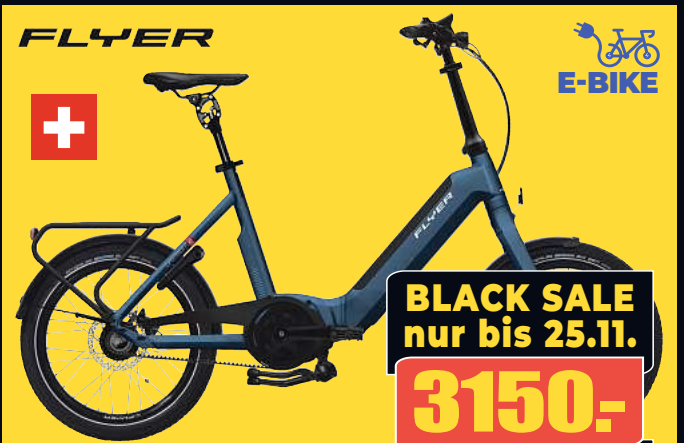
FLYER E-Bike Faltrad UPSTREET 2.5 40 Faltbares E-Bike allerhöchster Güte