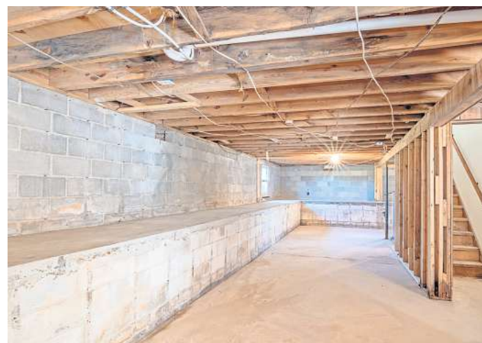
Ein Kellerausbau hat viele Vorteile: Viel Platz ist einer davon.

Denn sobald der Keller zum Wohnraum werden soll, werden Nutzungsänderungen vorgenommen, die genehmigt werden müssen. Darüber hinaus ändern sich die Anforderungen an den Brandschutz. Auch hier müssen bestimmte Vorschriften beachtet werden. Der Bauantrag für einen Kellerausbau wird gemeinsam mit einem Planer und einem Architekten erarbeitet. Der Architekt erstellt das Raum- und Beleuchtungskonzept, wahren der Planer