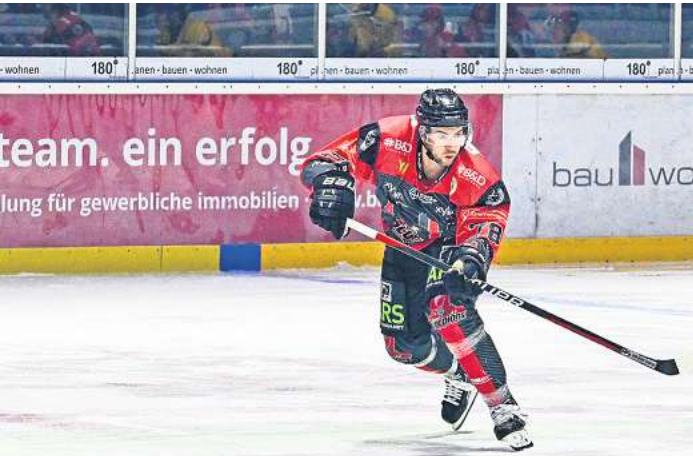
Die Scorpions fegten die Tilburg Trappers jetzt mit 7:0 vom Eis.

Am nächsten Sonntag, 19. November, um 19 Uhr empfangen die Scorpions auf eigenem Eis die Füchse Duisburg. Füchse Duisburg – da war doch was! Die bisher schlechteste Saisonleistung, der damals noch sehr jungen Saison, lieferten die Scorpions am 13. Oktober in Duisburg ab, als sie die Begegnung völlig unnötig mit 4:6 verloren. Sicher ist, am kommenden Sonntag werden Kevin Gaudet und seine Scorpions mit Sicherheit alles daran setzen, diese Scharte wettzumachen und sich für diese völlig unnötige Niederlage zu revanchieren.