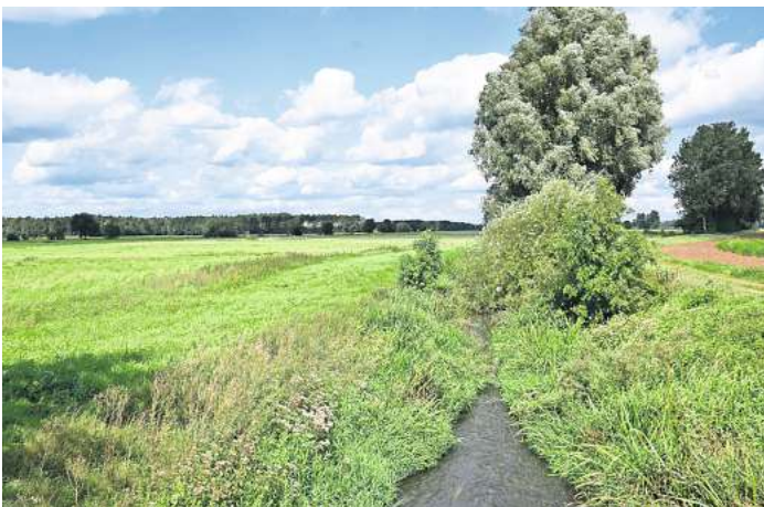
Offene Landschaft: Im Bereich der Wietze in der Wedemark hat bei Fachleuten in Sachen Windenergie ein Umdenken stattgefunden.

Richtig ist, dass sie hinsichtlich der vom Land Niedersachsen vorgegebenen 0,63 Prozent der Regionsfläche, die künftig für den Bau von Windenergieanlagen vorzusehen sei, nicht berücksichtigt werden. Bei dem deutlich ambitionierteren Flächenziel von 2,5 Prozent, das sich die Region