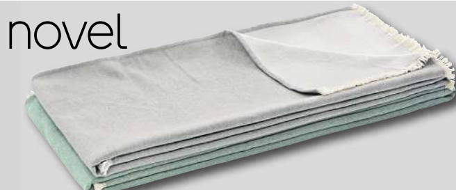
NOVEL WENDEDECKE 100% Baumwolle, braun/grün oder grau/ dunkelgrau, ca. 140 x 210 cm. 57170010-01, 02 Ca. 220 x 240 cm 60,- 57170011-01, 02