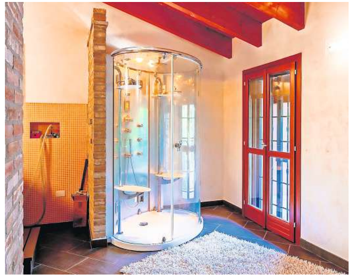
Dampfduschen garantieren luxuriöse Spa-Momente.