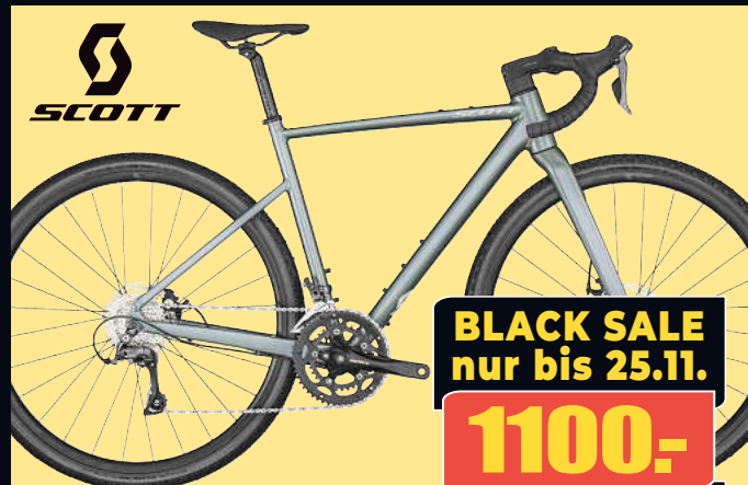
SCOTT Gravel Bike CONTESSA SPEEDSTER GRAVEL 35 Schön, schnell und mit Gravel-Spaßgarantie!