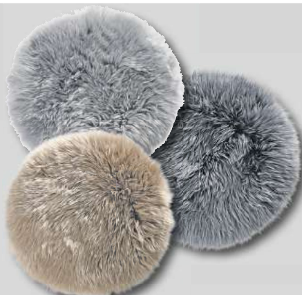
ESPOSA SITZKISSEN „OTAGO“ 100% echtes Schaffell, verschiedene Farben, Ø ca. 34 cm oder ca. 34 x 34 cm. 89820159-01 BIS 04, 89820160-01-F002, 89820160-02-F001, 89820160-03-F001, 89820160-04-F001 89820160-01 BIS 04