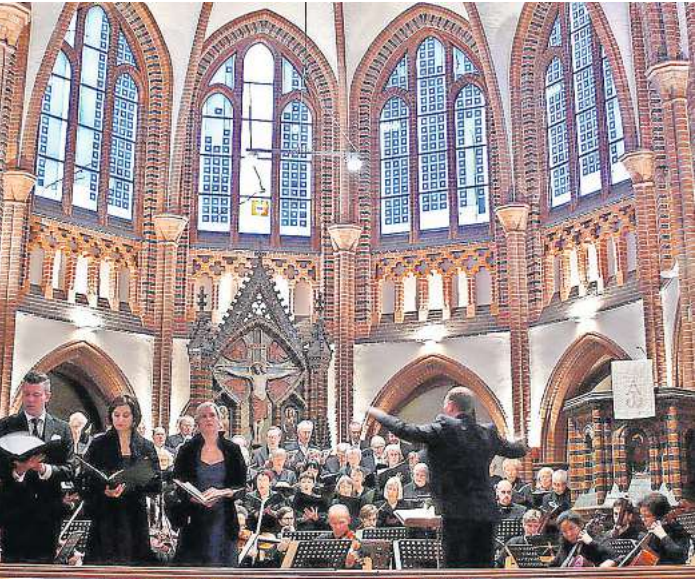
Das traditionelle Kantoreikonzert findet am 19. November statt.