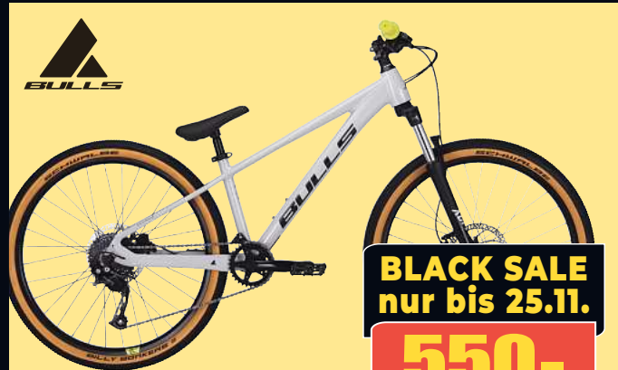
BULLS Pumptrackbike 26" DURO DJ DIRTBIKE Robustes Fahrwerk und moderne Geo für echten Fahrspaß