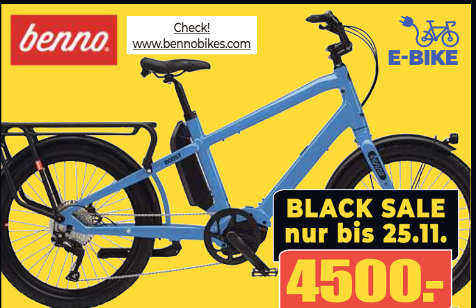
BENNO BIKES E-Bike Spezialrad BOOST-E 10D CX EVO Multifunktionales Cargo-/Family-Bike