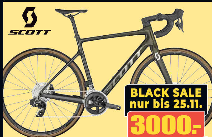
SCOTT Rennrad ADDICT 10 Mod. 23/24 Topklasse Carbonrahmen mit 24 Gang Sram Rival AXS wireless-Schaltung