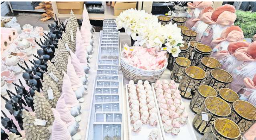
Die Auswahl bei der Adventsausstellung ist groß.

Interessierte können sich von vorgefertigten Gestecken und Kränzen inspirieren lassen oder das nötige Material für ein individuelles Gesteck bekommen. Festliches Licht spenden Lichterketten mit warmen LED-Leuchten, oder „Mini