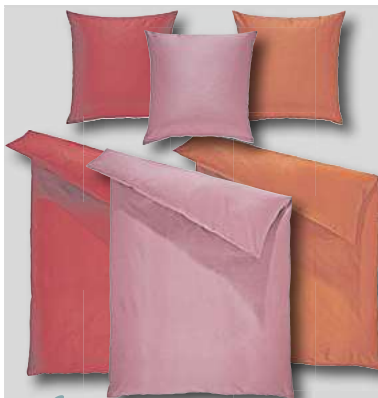
BIO:VIO SATIN-BETTWÄSCHE- GARNITUR 100% Baumwolle (Bio), CU 854856, mit Reißverschluss, ca. 135 x 200 und 80 x 80 cm. 43780111-03, 04, 08 30,- Ca. 155 x 220 und 80 x 80 cm 43780113-03, 04, 08 40,- Ca. 200 x 200 und 80 x 80 cm 43780114-03, 04, 08 50,-