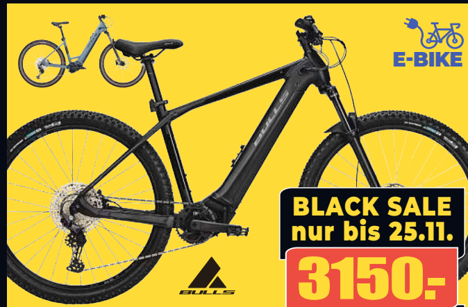
BULLS COPPERHEAD EVO 2 Mod. 23/24 Robust und stark in jedem Terrain mit 750 Wh Bosch CX Motor