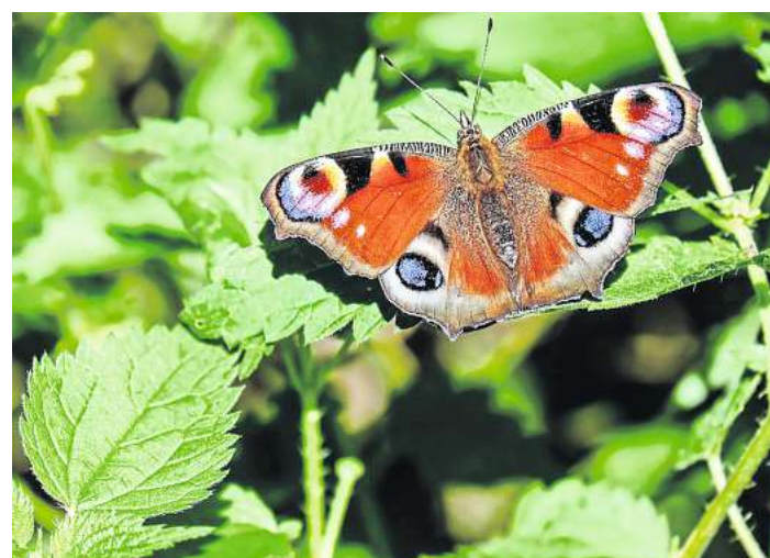
Ein naturnaher Garten bietet heimischen Arten einen Lebensraum.