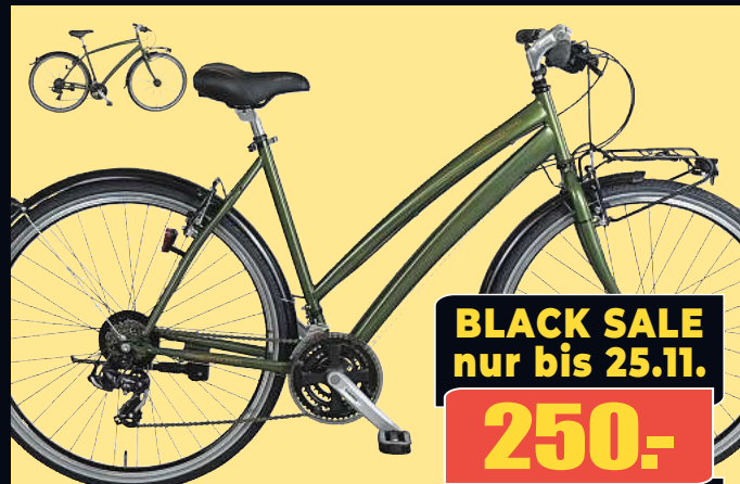
DASISTMEINRAD Trekkingrad 28" Elegantes Stadtrad - komplett ausgestattet und alltagstauglich