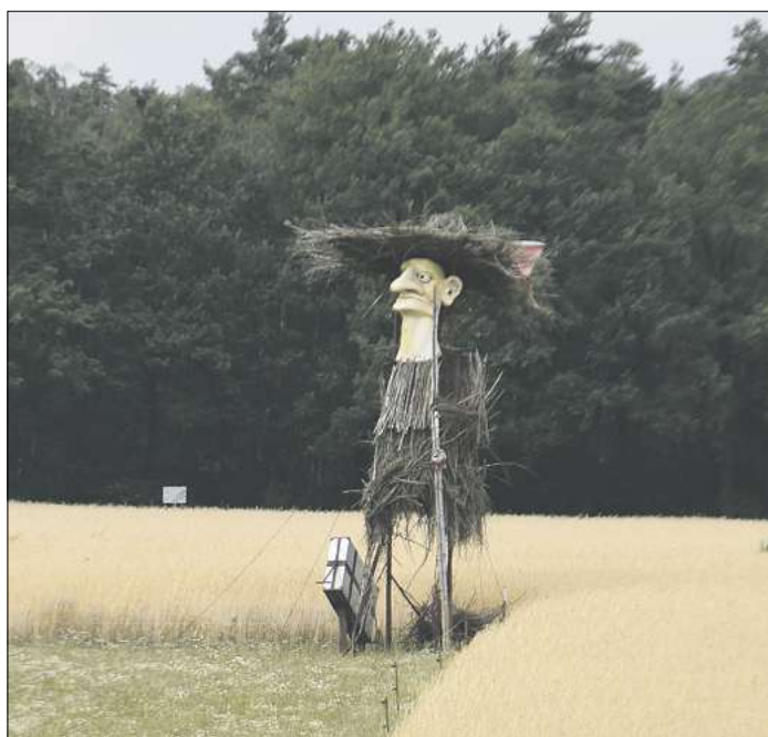
Der Brelinger Riese ist weiter gewandert, einige hundert Meter in Richtung Bennemühlen vom Ortsausgang Richtung Brelingen. Jetzt wartet er auf sein dringend notwendiges Bodylifting.