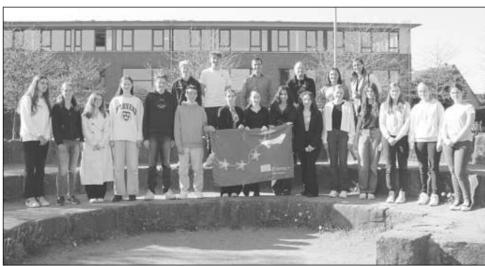
Zu Besuch: Die Schülerinnen und Schüler aus Frankreich räumten ein paar Vorurteile aus.

Zwei französische Lehrkräfte begleiteten ihre acht Schüler aus dem Lycée Henri Darras, die dort derzeit die 10. Klasse besuchen. Gemeinsam wurden am Gymnasium in Mellendorf an fünf Schultagen die gängigen Klischees über Deutsche und Franzosen thematisiert und das mit vielen amüsanten Ergebnissen. Beim gemeinsamen Kochen in der Schulküche wurde