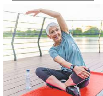
„Ich nutze das Produkt wegen meiner Ischiasschmerzen. Meine Nervenschmerzen haben spürbar nachgelassen.“ (Dagmar K.)

Aus medizinischer Sicht ist es wichtig, für eine erfolg-