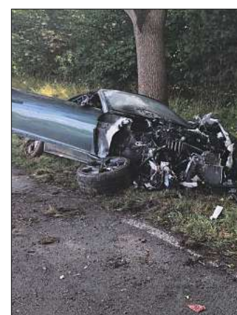
Der Fahrer konnte sich aus den Trümmern retten.

Zeugen hätten berichtet, dass der Wagen, der auf der K102 in Richtung Wiechendorf unterwegs war, am Ortsausgang der Siedlung Buchholz übermäßig beschleunigt habe, so Polizeisprecherin Andrea Gottschalk. Möglicherweise hatte der Fahrer das Beschleunigungsvermögen der PS-starken Luxuskarosse unterschätzt. An dem neuwertigen Wagen, der erst im Februar 2023 erstmals zugelassen worden war, entstand Totalschaden. Der Neupreis eines solchen Wagens, der mit Motorleistungen zwischen 300 bis 575 PS angeboten wird, liegt zwischen