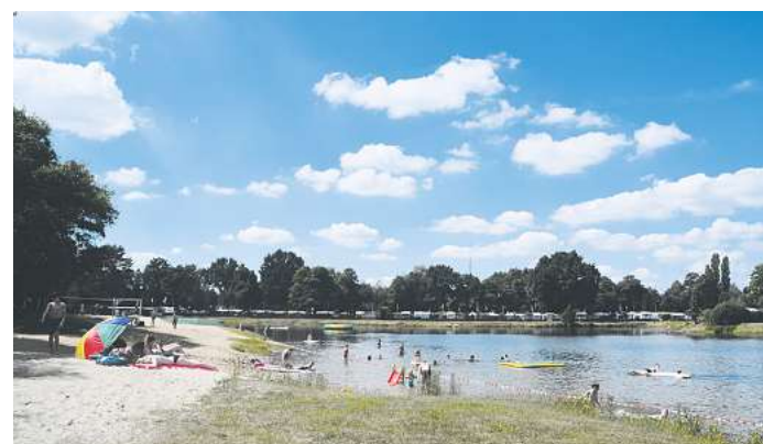
Badespaß im Natelsheidese steht im Sommer hoch im Kurs.

Hier ist der Badespaß für alle garantiert, die gerne in einem Natursee baden und planschen. Die Region bescheinigt dem Natelsheidese am Regeldamm in Bissendorf-Wietze von Campingplatzbetreiberin Anja Krüger auch in diesem Jahr eine hohe Wasserqualität. Das Mähboot hat dafür gesorgt, dass die Wasserpflanzen im Zaum gehalten werden. Hier kann man am weißen Strand relaxen, mit den Freunden Beachvolleyball spielen oder sich im aktuell 25 Grad warmen Wasser ausbaden: Auf dem nagelneuen Trampolin in der Seemitte oder mit Schwimmtieren, Surfbrettern, Luftmatratzen und Schlauchbooten. Hier ist alles erlaubt, denn gegenseitige Rücksichtnahme setzt Anja Krüger bei ihren Gästen voraus. Die können