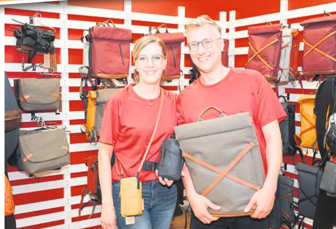
aunts & uncles stellt seine urbane Kollektion „a/u“ vor.