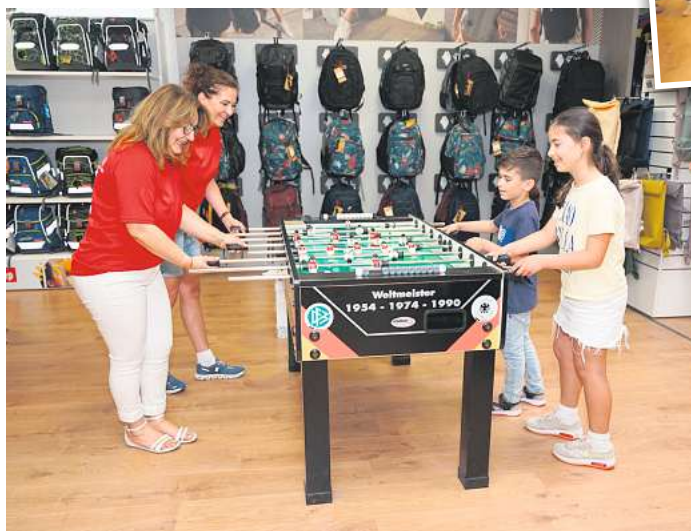
Beim Ranzen-Tag kommt auch der beliebte Kicker zum Einsatz!

Die smarten Taschen und Schulrucksäcke von Satch lassen sich mit Graffiti individualisieren.