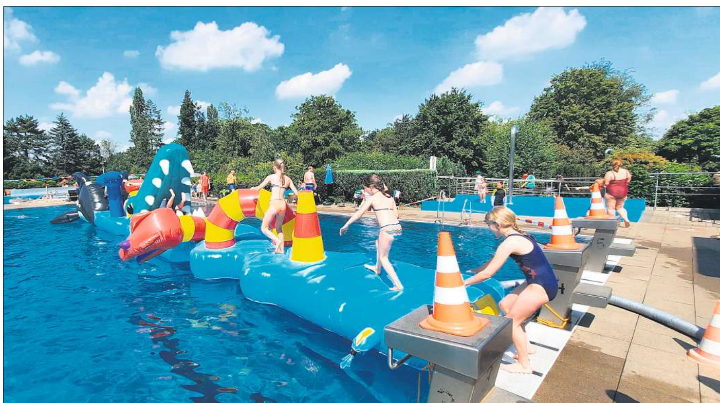
Mit Spaß für die Kinder: Die jüngsten Besucher des Sommerfestes toben sich aus.

DLRG-Ortsgruppe feiert 60. Geburtstag mit Sommerfest im Spaßbad