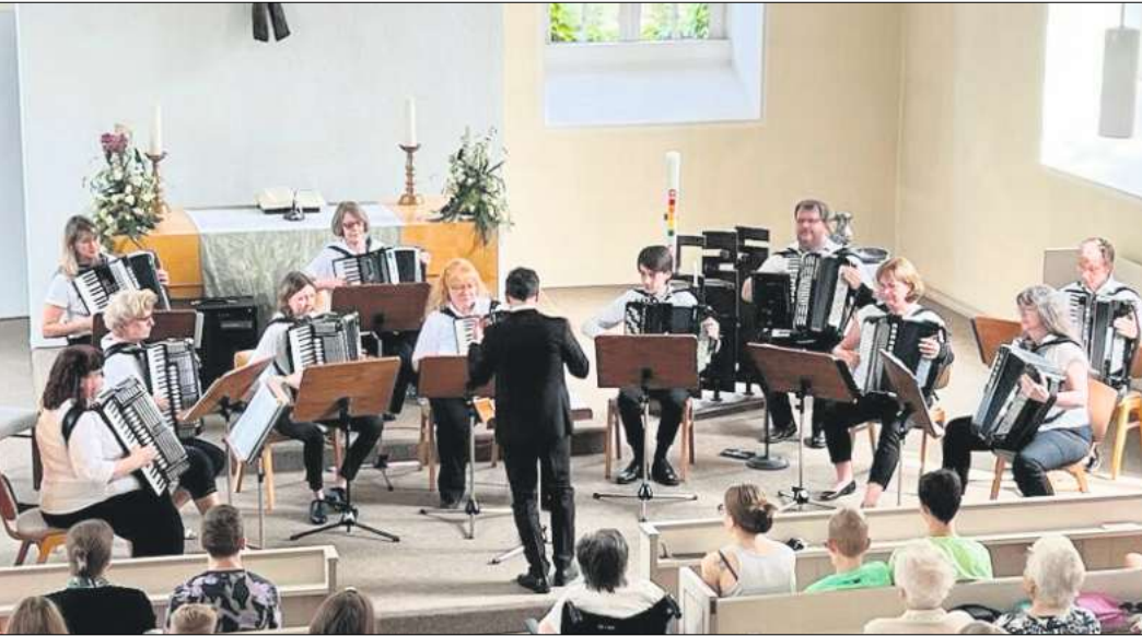
Erst nach zwei Zugaben entließ das Publikum das Orchester.