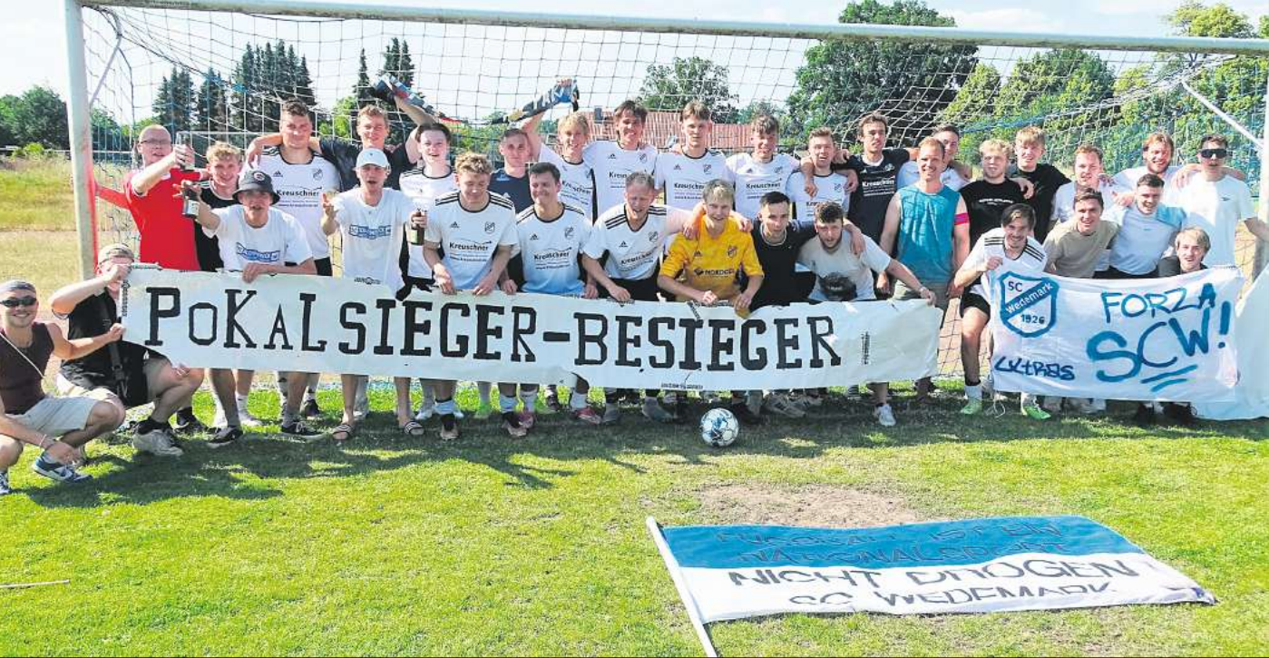
Eine eingeschworene Gemeinschaft: die Spieler der 1. Herren des SC Wedemark und ihre Fans.