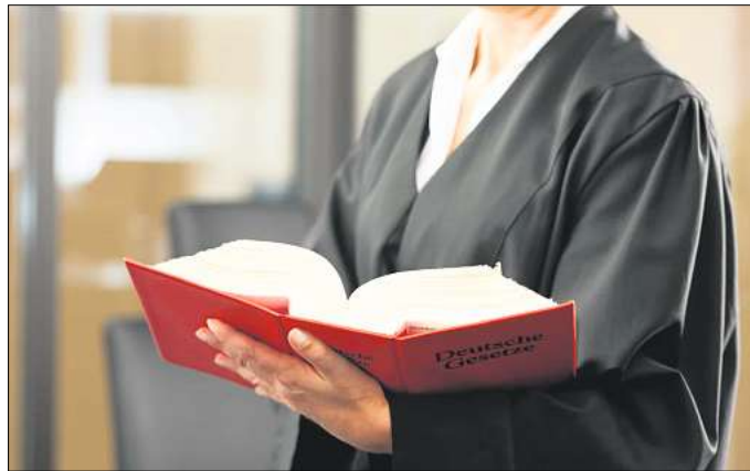
Rechtspfleger kümmern sich beispielsweise um verschiedene Bereiche bei Gericht.

Ips/AM. Rechtspfleger sind die rechte Hand bei Gericht, der Staatsanwaltschaft und auch in Justizvollzugseinrichtungen. Die Beamten des gehobenen Justizdienstes erledigen Aufgaben, die vor 1945 von Richtern bearbeitet wurden. Nach 1945 erhielten Rechtspfleger deutlich mehr Verantwortung, trafen selbständig und eigenverantwortlich Entscheidungen in rechtlichen Angelegenheiten – bis heute. Das Aufgabengebiet von Rechtspflegern ist breit gefächert, denn es reicht von Familien- und Betreuungsverfahren über Zwangsvollstreckungen bis hin zu Grundbuch- und Nachlassangelegenheiten. Da die Work-Life-Balance und die Chancen auf dem Arbeitsmarkt gut sind, ist der Beruf des Rechtspflegers beliebt. Um in diesem Tätigkeitsfeld Fuß zu fassen, benötigt man die Allge-