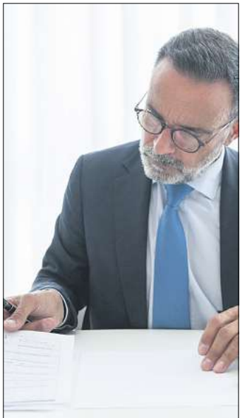
Die Kosten für einen Zivilprozess können in die Steuererklärung einfließen.

Was allerdings nie von der Steuer absetzbar ist, sind Scheidungen und Erbstreitigkeiten. Hierfür eignet sich eine solide Rechtsschutzversicherung.