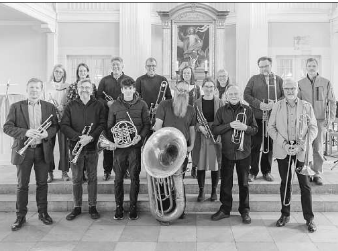
Das Programm ist als bunter Blumenstrauß arrangiert.

2. Juli: Sommer-Brass in der Brelinger Kirche