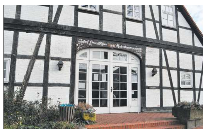
Das Richard-Brandt-Heimatomuseum wird ehrenamtlich betrieben - wohl aber auf einem anerkannt hohen Museumsstandard. Der Haupteingang führt nicht nur in die Gemeindebibliothek in Bissendorf, sondern auch zum Richard-Brandt-Museum Wedemark im Obergeschoss.

Ins Rollen gebracht hatte die Suche ein Antrag der CDU, dem der nicht öffentlich tagende Verwaltungsausschuss des Wedemärker Rates kürzlich seine Zustimmung gegeben hatte. In Gesprächen mit dem Team des Heimatmuseums, der Verwaltung und Vertretern der Politik waren zuvor die akuten Probleme und Vorstellungen über die künftige Arbeit erörtert worden. Da eine Sanierung des Amtskrugs „kurzfristig und finanziell sicherlich nicht darstellbar“ sei, bat die CDU-Fraktion daher die Verwaltung, ergebnisoffen zu prüfen, ob es zeitnah alternative Standorte für das Heimatmuseum gebe. Gleichzeitig solle kontrolliert werden, wie