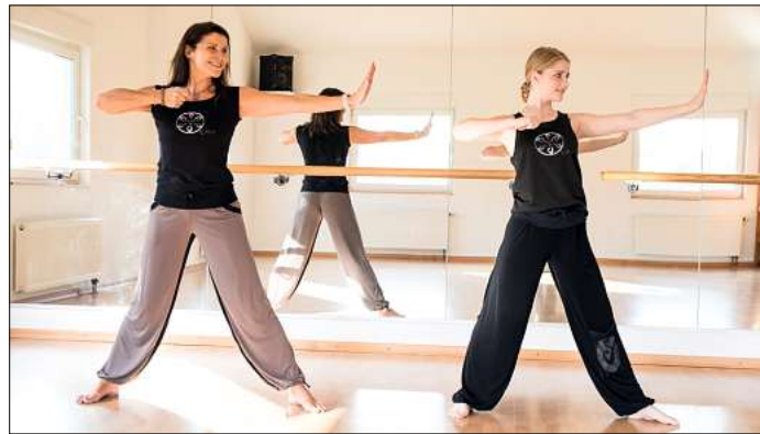
Bei der SG Blau-Gelb Elze startet jetzt ein neuer Aroha-Kursus.

Elze. Aroha ist seit mehr als 15 Jahren im Angebot von Blau-Gelb-Elze und ist ein unkomplizierter Gesundheitskurs im Dreiviertel-Takt, der Körper und Seele in Einklang bringt. Die Ziele sind verbesserte Ausdauer, Stärkung des Herz-Kreislauf-Systems, besseres Körpergefühl, Balance und Muskelflexibilität sowie Stressabbau und Entspannung. Aroha ist ideal für Einsteiger und Wiedereinsteiger jeden Alters.