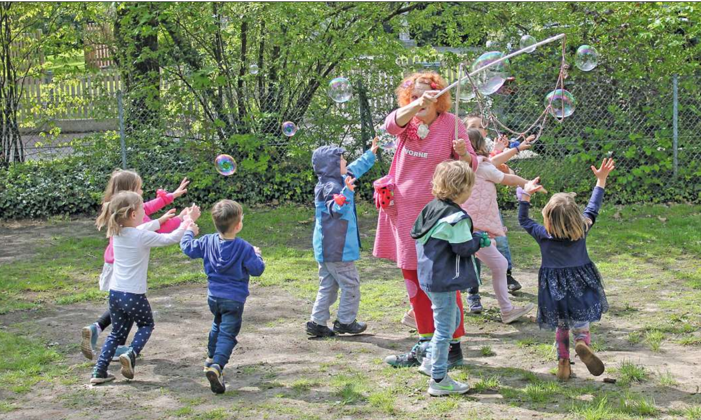
Seifenblasen sind immer begehrt.