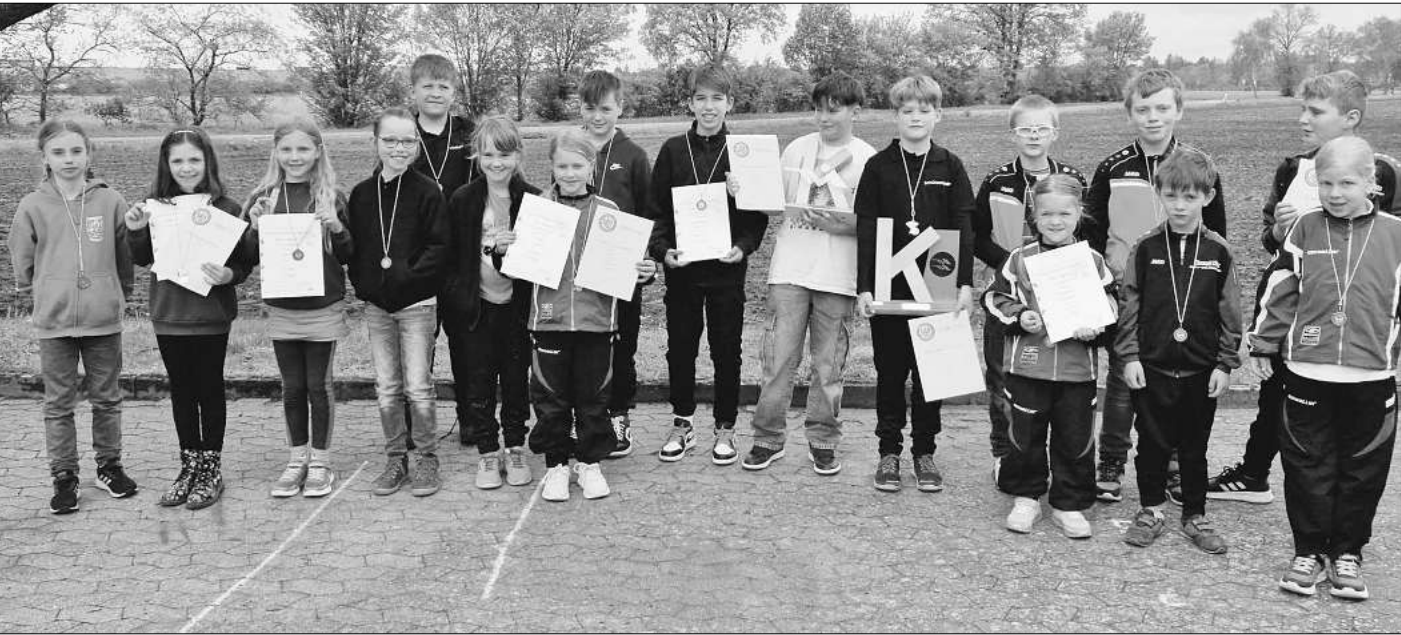
Die erfolgreichen Teilnehmer des Wettbewerbs.

Wedemark/Langenhagen. Im Mai veranstaltete die Kreisjugendleitung vom Kreisverband Wedemark-Langenhagen einen Wettkampf für die jungen Schützen ab sieben Jahren unter dem Motto Kinderbestenschießen. Es wird mit dem Lichtpunktgewehr geschossen, das den frühen Einstieg zum Sportschießen ermöglicht. Das Lichtpunktgewehr ist ein modernes Sportgerät, keine Waffe, und dennoch wird das Schießen