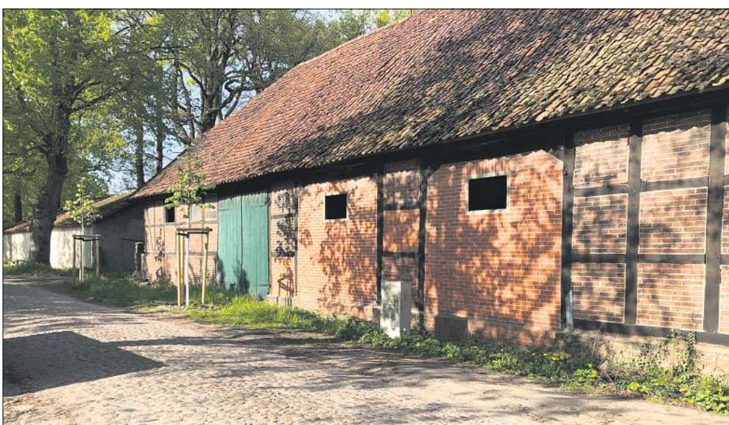
Denkmalgeschützte Straße: Bei 25 Wohnungen befürchten Einwohner 50 zusätzliche Autos, für die es auf dem Grundstück Abstellmöglichkeiten geben soll.