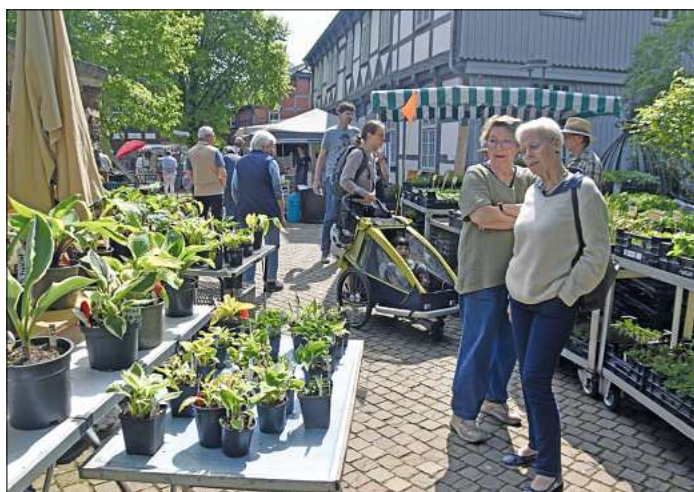
Die Qual der Wahl: Kräuter und Pflanzen stehen beim Ökomarkt in großer Vielfalt bereit.