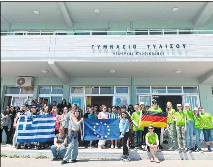
Die Schüler wollen die griechische Sprache und Kultur näher kennenlernen.