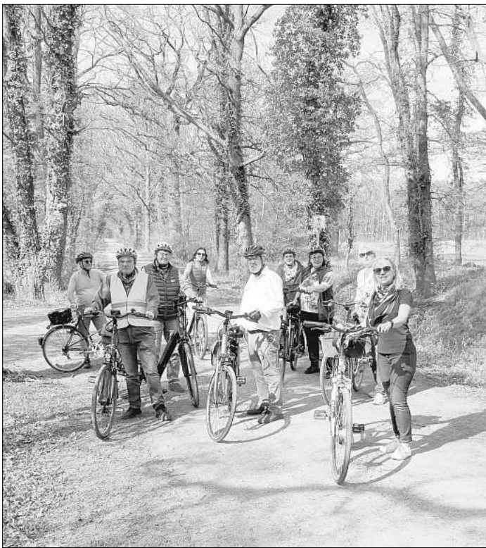
Die Nachbargemeinschaft der Bohlwiese war auf Erkundungstour.