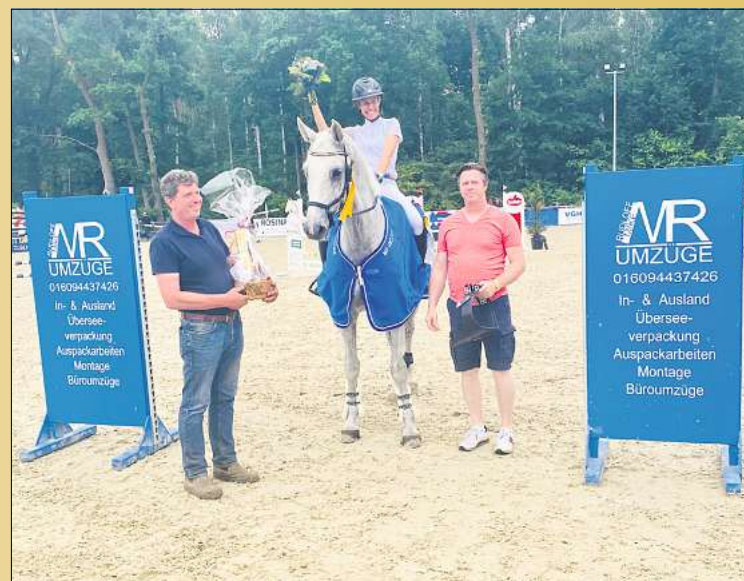
Die Siegerin der Hauptprüfung, dem S*-Springen mit Stechen auf dem Springturnier im letzten Jahr.

Der Eintritt zum Turnier in Hellendorf ist an beiden Wochenenden frei. Möglich wird dieses hochkarätige Reitturnier durch das hohe ehrenamtliche Engagement des Vereins mit seinen rund 200 Mitgliedern und natürlich die großartige Unterstützung von vielen langjährigen Sponsoren.