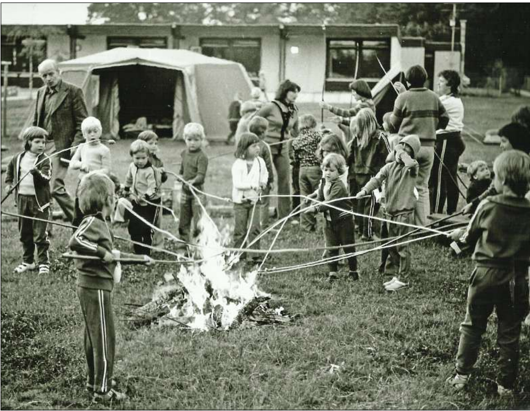
Mit Zeltlager und Stockbrotbacken feiern die Kinder zehn Jahre nach der Eröffnung der Kita. Im Hintergrund ist das Gebäude noch mit Flachdach zu sehen.