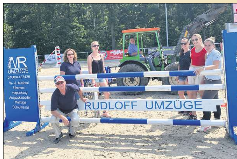
Fleißige Helfer im Parcours sind der Garant für einen reibungslosen Turnierablauf.