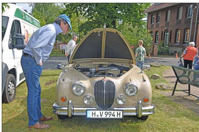
In manch einem Besucher wurden wohl beim Anblick dieses Jaguar MK Jugendträume wach.

Es sollte ein Gangsterwagen sein, mit runden Kurven und blinkendem Chrom mit ausladenden Trittbrettern, und er sollte komplett sein.