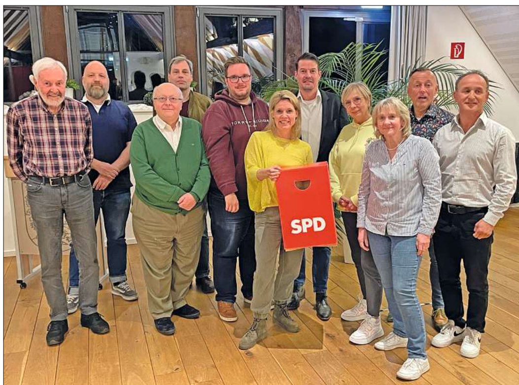
Der neu gewählte Vorstand der SPD Wedemark.