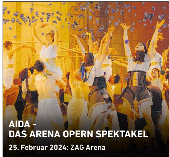
AIDA - DAS ARENA OPERN SPEKTAKEL 25. Februar 2024: ZAG Arena