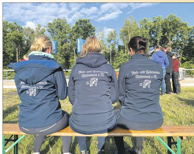
Vereinsmitglieder des RFV Wedemark erleben auf den Zuschauerrängen spannenden Sport.