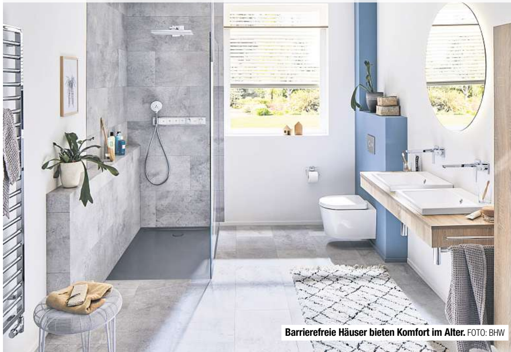
Barrierefreie Häuser bieten Komfort im Alter.

Ips/DGD. Mit zunehmendem Alter ändern sich die Bedürfnisse an das häusliche Umfeld. Alltägliche Situationen, die in jungen Jahren keinerlei Schwierigkeiten darstellen, werden im Alter nicht selten zur Herausforderung. Dies gilt es bei der Planung des Hausbaus zu berücksichtigen, um später wenige Veränderungen vornehmen zu müssen. Besonderes Augenmerk liegt dabei bei der täglichen Körperpflege. Ein altersgerechtes Badezimmer bietet auch jungen Familien Komfort und einige Vorteile. Heutzutage werden daher meist ebenerdige Duschen geplant und installiert. Der stufenlose Zugang ist praktisch und reduziert Gefahren durch Stürze. Außerdem sind diese Lösungen