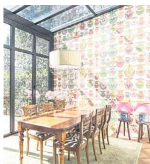
Wintergärten nutzen die Wärme der Sonne.

Ips/AM. Balkone erfreuen sich großer Beliebtheit, denn sie sind eine einfache Möglichkeit, um einen Platz im Freien im eigenen Zuhause zu bekommen. Diese offene Fläche kann sowohl mit dem Obergeschoss des Hauses als auch mit einer Wohnung verbunden sein. Je nach Größe kann ein Balkon mit Loungemöbeln und zahlreichen Pflanzen ausgestattet werden, um einen gemütlichen Außenbereich zu schaffen. Insbesondere bei Stadtwohnungen wird großer Wert auf einen Balkon gelegt, damit man sich in seine kleine Außen-Oase zurückziehen und entspannen kann. Ein Wintergarten ist dem Balkon in Vielem sehr ähnlich, er ist jedoch ein geschlossener Anbau des Hauses und besteht überwiegend aus großen Glasflächen, die man teils durch Fenster oder Türen öffnen kann. Der wesentliche Vorteil eines Wintergartens ist die Nutzungsmöglichkeit bei kühlen und kalten Außentemperaturen. Er sollte wegen der Sonneneinstrahlung daher nach Süden ausgerichtet sein. Ein Nachteil des Glasraums ist, dass die Temperatur darin im Sommer stark ansteigen kann. Beide Außenbereiche bieten dennoch einen erheblichen Wohnkomfort.