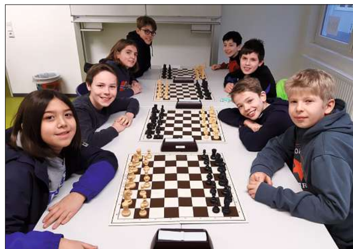
Die Schachspieler des Gymnasiums Mellendorf schlugen sich wacker.