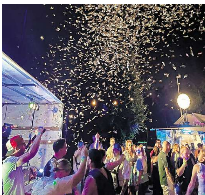
Spaß und besondere Effekte.

Das eingespielte Team, das seit vielen Jahren immer wieder für das besondere Vergnügen der Besucherinnen und Besucher sorgt, hat auch diesmal wieder alle zur Organisation einer solchen Großveranstaltung notwendigen Maßnahmen berücksichtigt, damit alle Gäste sicher und ohne Sorgen feiern können. Dazu gehört ein Sicherheitsdienst, der dafür sorgt, dass es keine unschönen Störungen gibt. Bewährt hat es sich, das Gelände für diesen Abend einzuzäunen, das ermöglicht den Si-