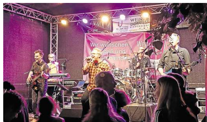
Bis in die Nacht unterhält die Band „Mix Tape“ die zahlreichen Gäste beim Open-Air-Fest.