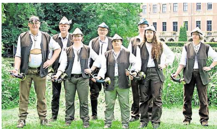
Die Jagdhornbläser bei Schloss Pfaffendorf.

wesen. Damit konnte die Gruppe ihr hohes musikalisches Niveau eindrucksvoll bestätigen. Neben dem Wettbewerb kam auch das gesellige Miteinander nicht zu kurz. Viele Teilnehmerinnen und Teilnehmer nutzten die Reise gemeinsam mit ihren Partnern zu einem Wochenendausflug. So bot die Fahrt nicht nur die Gelegenheit, sich musikalisch zu messen, sondern auch die Gemeinschaft innerhalb der Gruppe weiter zu stärken. Abseits der regelmäßigen Übungsabende blieb viel Zeit für Gespräche und gemeinsame Erlebnisse.