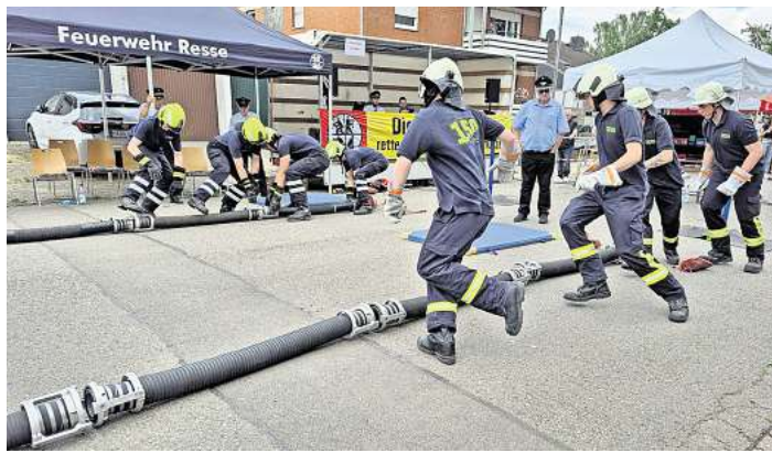
Beim Kuppel-Contest ging es darum, aus vier Saugrohren möglichst schnell eine Saugleitung zusammen zu kuppeln.