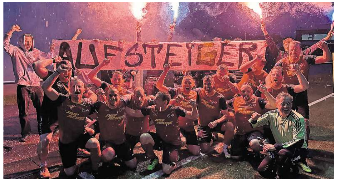
Der Aufstieg wurde tüchtig gefeiert.

Mit 53 Punkten aus 20 Partien und einem beeindruckenden Torverhältnis von 63:17 sicherte sich das Team souverän den ersten Tabellenplatz vor dem FC Burgwedel. Bereits im Saisonverlauf unterstrich die Mannschaft ihre Ambitionen mit deutlichen Erfolgen. So gelangen unter anderem ein 7:0 gegen den MTV Ilten, zwei Siege gegen den Heebeler SV (4:0 und 3:0) sowie Erfolge gegen Niedersachsen Döhren (9:3 und 4:2). Auch der wichtige 2:0-Auswärtssieg beim direkten Verfolger FC Burgwedel erwies sich als richtungweisend im Titelrennen. Überschattet wurde die Spielzeit durch einen Vorfall beim Auswärtsspiel in Rödensen.