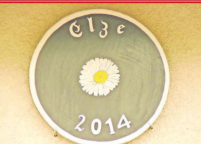
Wo könnte sich diese Motivscheibe befinden?