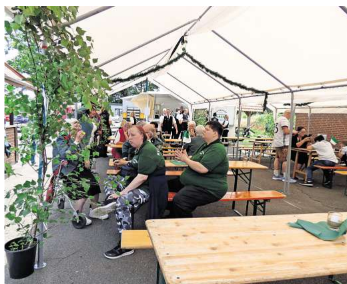
Gut bedacht lässt es sich auch bei Sonnenschein gut aushalten, hier wird an beiden Tagen eine Kaffeetafel angeboten.

Dort wartet für die jüngsten Gäste wieder ein Kinderkarussell, es gibt eine Schießbude und auch die leckeren Naschereien wird es wieder geben. Überhaupt stehen die Kinder an diesem Nachmittag im Mittelpunkt, für sie gibt es ein eigenes, kleines Kinderprogramm. Mit Musik und Tanz klingt schließlich das Schützenfest 2026 in Brelingen gegen 21 Uhr aus.