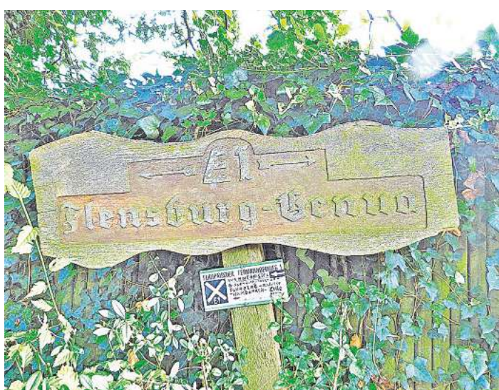
Altes Schild in Wennebostel.

Auf landwirtschaftlichen Straßen wandert man hinter dem Gailhofer Gewerbegebiet Richtung Wennebostel. Über 100