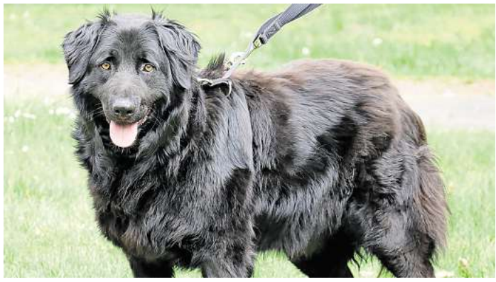
Merlin wartet auf seine neue Familie.