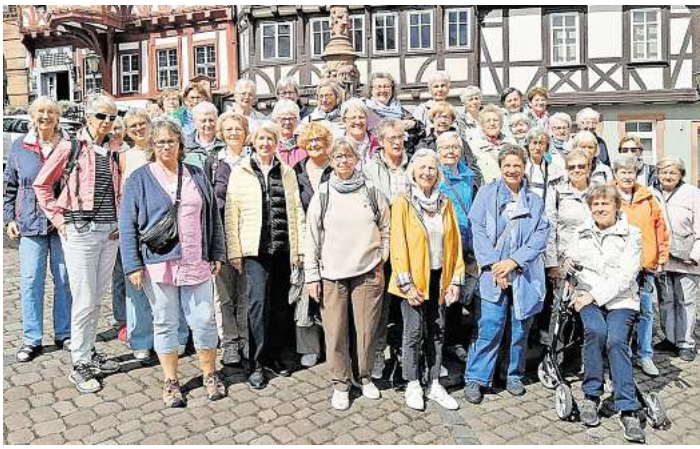
Ein schöner Ausflug begeisterte die LandFrauen.