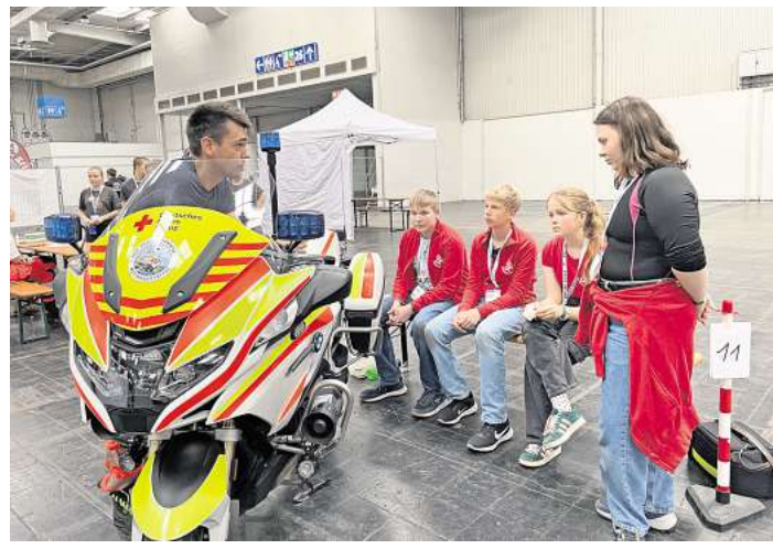
Wedemarker Jugendliche zeigten ihre Fähigkeiten

An rund der Hälfte der Stationen wurde es erstaunlich realistisch: Kunstblut, professionelle Schminke und schauspielerisch