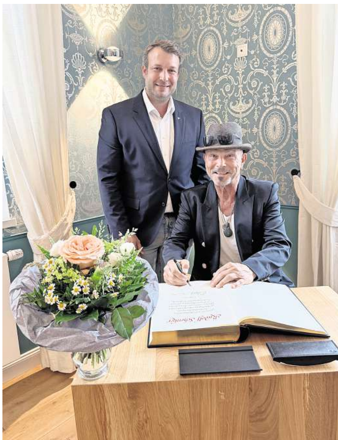
Der Eintrag ins goldene Buch: höchste Wedemärker Ehrung für Gäste.