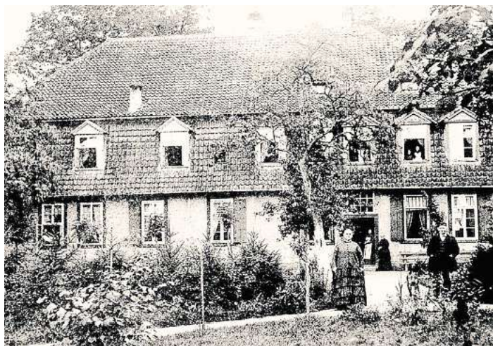
Die Villa Hausmann zur Zeit, als die Entbindungsklinik dort untergebracht war.

bindungsklinik beginnt Mitte der 60er Jahre des 19. Jahrhunderts zu florieren. Aus Bremen, Halberstadt und Heiligenstetten in Holstein kommen die ersten jungen Damen, die ihre Kinder in Wennebostel zur Welt brachten. Im Kirchenbuch finden wir illustre und weltläufige Einträge, die es in der bauerlichen Provinz zuvor nicht gab.