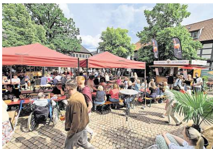
Schon am Nachmittag waren fast alle Plätze beim Wein- und Dorffest in Bissendorf besetzt.

schen Amtshauses und des Bürgerhauses zu füllen, es wurden Weine der verschiedensten Sorten gekostet und die angebotenen Leckereien genossen. In diesem Jahr waren neben Weinmüskeln auch die Teams vom Weinhof Petershof aus Rheinhessen und zum ersten Mal auch Fein & Wein als ortsansässiger Anbieter mit dabei. Neu in diesem Jahr war auch das Angebot, eine Probierkarte schon im Vorfeld zu erstellen, dazu ein 0,1l Glas mit