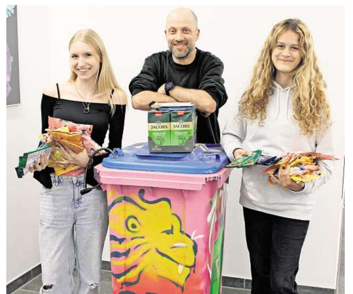
Für den guten Zweck sammeln geht einfach mit der Pfandtonne.