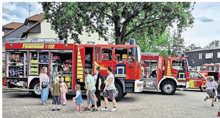
Anziehungspunkt nicht nur für die kleinen Gäste waren die ausgestellten Einsatzfahrzeuge.

Heute besteht die Aktive Abteilung aus 46 Kameraden, darunter zehn Frauen. In der Jugendfeuerwehr versehen 20 Jugendliche ihren Dienst. Hinzu kommen fünf Mitglieder der Ehren- und Altersabteilung. Und natürlich hat auch der Fahrzeugpark zugenommen, die Wehr hat neben den beiden Tanklöschfahrzeugen ein Kommandofahrzeug und ein speziell für die Tierrettung ausgestattetes Fahrzeug zur Verfügung.