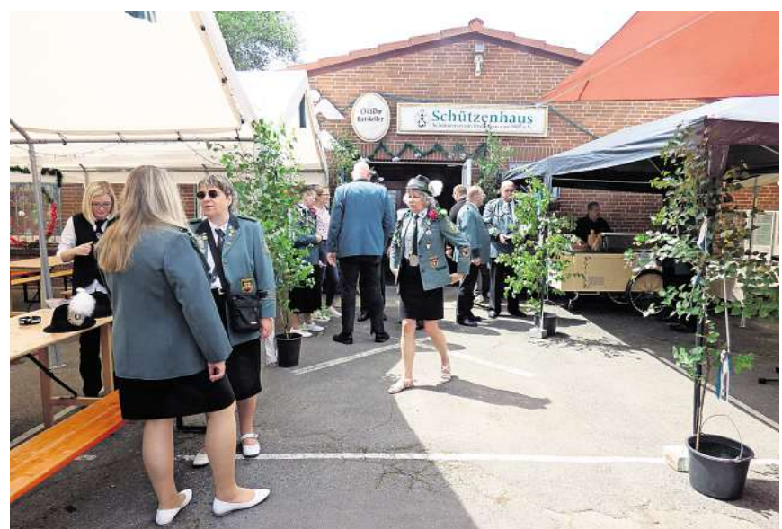
Die Brelinger Schützen feiern in und um ihr Schützenhaus neben den Sportanlagen des 1. FC Brelingen.

Ab 20.30 Uhr kann bei der Partynacht mit DJ Tim Böttcher das