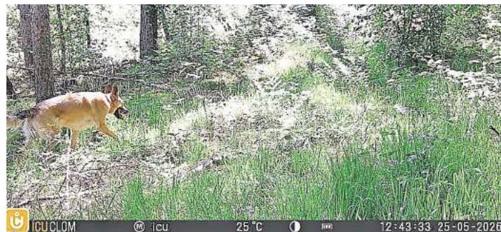
Von der Wildkamera ertappt: freilaufender Hund fernab jeden Weges.

Rehkitze verlassen sich in ihren ersten Lebenswochen auf Tarnung und bleiben bei Gefahr regungslos liegen. Freilaufende Hunde können die Tiere dennoch aufspüren. Auch Hasen, Bodenbrüter und andere Wildtiere reagieren empfindlich auf Störungen. „Viele Menschen wissen