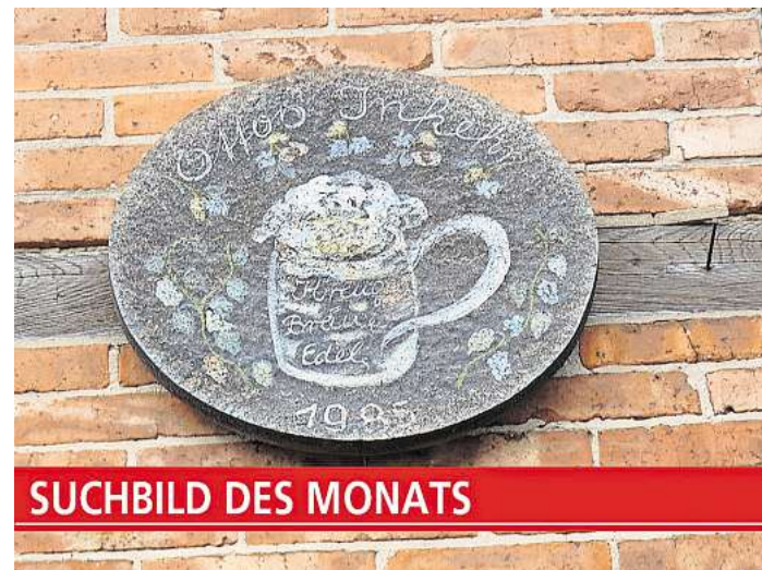
Suchbild des Monats in Elze.