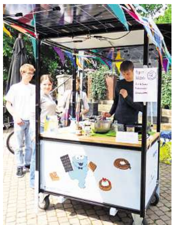
Abiturienten boten vegane Waffeln an, gebacken mit Solarstrom. Der Erlös soll für die anstehende Abi-Party verwendet werden.

cherbetrieb mehr. Eine Lösung ist bereits gefunden, der Umzug in das ehemalige Sparkassengebäude schräg gegenüber schon vorgesehen. Die Kinder- und Jugendkunstschule bot Bastelaktionen für die kleinen Gäste an, es gab handgearbeitete Keramiken zu erwerben und zahlreiche, attraktive Angebote mehr, zum Beispiel vom Naturschutzbund, am Stand der Mohlmühle mit Arbeiten ihrer Bewohnerinnen und Bewohner, der Crêperie on Tour und von den „Taschentalenten“.