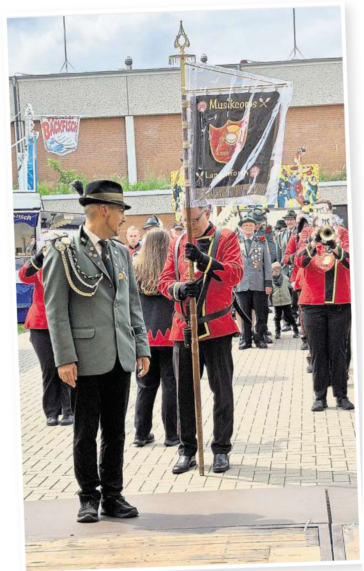
Vor dem großen Ausmarsch zum Scheibennageln werden die Gastvereine mit musikalischer Begleitung begrüßt.

Schützenkönigs die Ziele. Mit einer letzten Tanzparty zu Hits der 90er und der 2000er Jahre endet das Mellendorfer Schützenfest 2026.