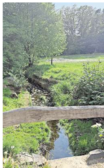
Malerischer Zulauf.

stoßen wir auf ein gemauertes Häuschen, das einen besonderen Zweck hat: Es ist ein Fledermausquartier. Ein Stück weiter führt eine kleine Brücke über den Zulauf, der zeigt, wo das Wasser herkommt, dass im Rückhaltebecken bei hohen Niederschlagsmengen gesammelt wird: Aus den nordwestlichen Gebieten Mellendorfs.