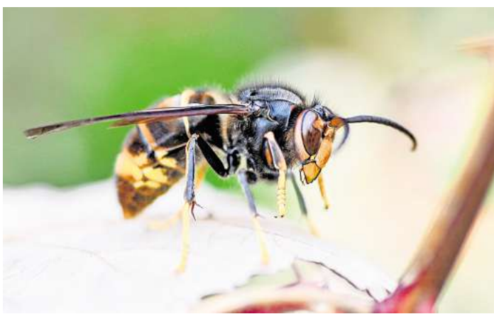
Die asiatische Hornisse

Da die Hornisse sich in Niedersachsen noch in der Ausbreitung befindet, beteiligt sich die Region Hannover daran, die flächendeckende Besiedlung durch eine aktive Bekämpfung so lange wie möglich zu verzögern. Die Europäische Kommission hat die Asiatische Hornisse 2016 auf die Liste der „invasiven gebietsfremden Arten von unionsweiter Bedeutung“ aufgenommen. Sie ernährt ihre Brut mit tierischen Proteinen in Form von Spinnen und Insekten