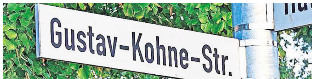
In der Nähe des Hofes, wo er aufwuchs, befindet sich die Gustav-Kohne-Straße.