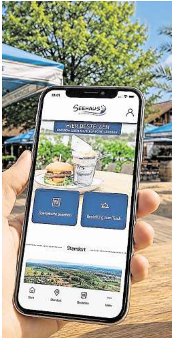
Online bestellen – ab 22. Mai möglich.

Abholung am Pickup Point. Das Ziel: Mehr Entspannung statt Warteschlange – und mehr Zeit,