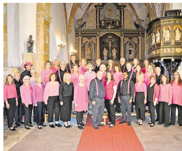
Der Chor AnySingElse.

Tipp: Im Rahmen eines Workshops mit dem Künstler „Kira – funkeln Insekten“ am Sonntag, 17. Mai, von 16 bis 18 Uhr, können aus Glasperlen, Sicherheitsnadeln und Draht künstlerische Insekten geschaffen werden. Arbeiten von Künstlerinnen und Künstlern, die sich an der Intraregionale beteiligen, sind in zehn weiteren Kunstvereinen zu sehen. Hinweise über die einzelnen Standorte sind auf der Website www.intraregionale.org zu finden. Entsprechende Info-Flyer sind auch beim Imago Kunstverein erhältlich. Öffnungszeiten: Mittwoch bis Freitag von 11 bis 13 Uhr und 15 bis 18 Uhr, Samstag von 11 bis 13 Uhr und 15 bis 17 Uhr, Sonntag von 15 bis 17 Uhr, an Feiertagen geschlossen.