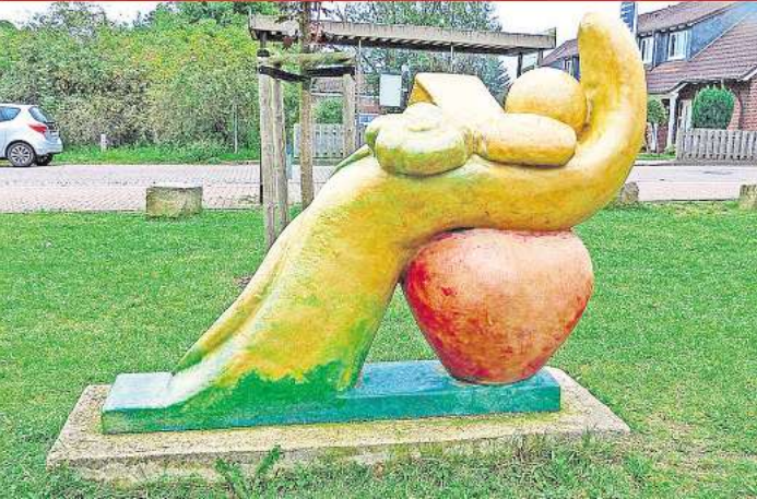
Hand auf's Herz