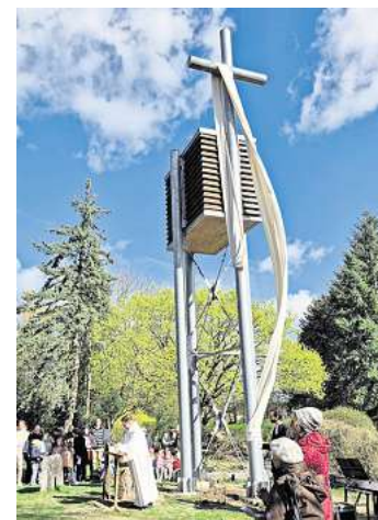
Am Ostermontag wurde der Glockenturm auf dem Bissendorfer Friedhof eingeweiht, sein Geläut erklang dort zum Auftakt des Familiengottesdienstes.

auf einen zentralen Platz des Friedhofsgeländes konnte dank der Stiftung finanziert werden. Die Glocke hat eine eingeprägte Darstellung des Heiligen Christophorus und erinnert damit an den ursprünglichen Aufstellungsort, der für viele Menschen in der Wedemark eine geistliche Heimat gewesen ist. Aufgeprägt ist darüber hinaus der Spruch Römer 12,12: „Seid fröhlich in Hoffnung, geduldig in Trübsal, beharrlich im Gebet.“