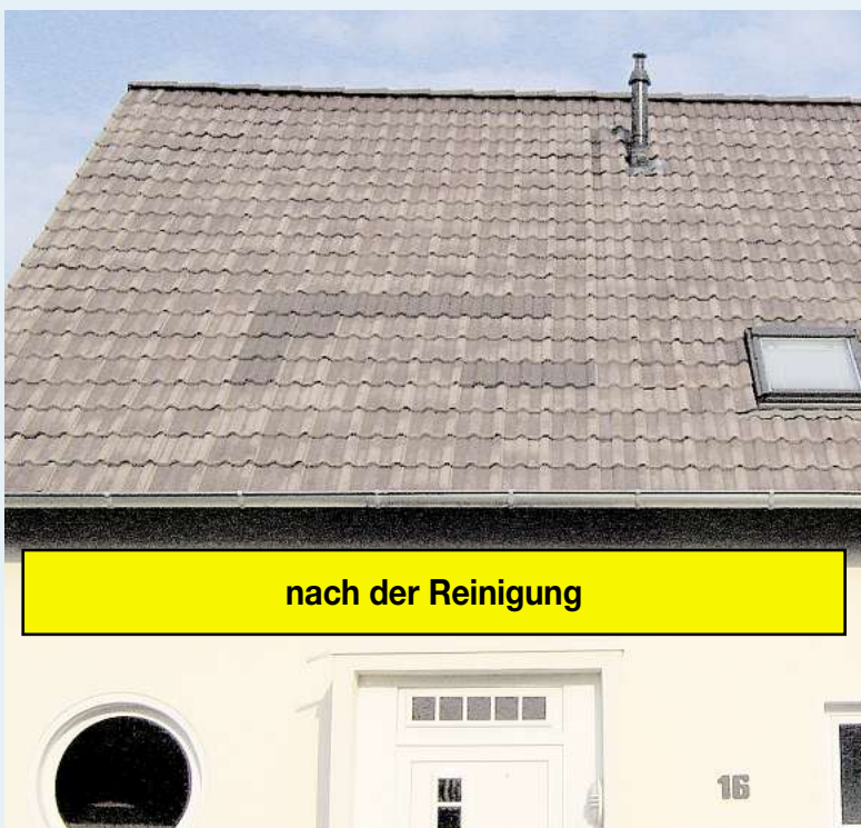
nach der Reinigung

Mitglied der Handwerkskammer Hannover seit 2004: Nr. 030 1690