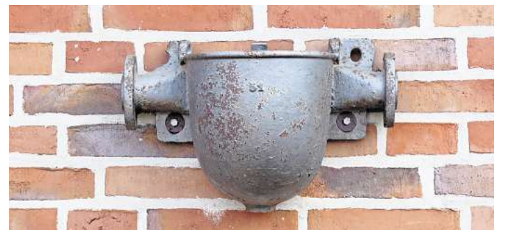
Wo findet man dieses Motiv.

Der Dank des Vereins gilt den vielen Helfern, die die Veranstaltung ermöglichen haben, sowie insbesondere den örtlichen Unternehmen Schönhoff und Kochservice Schmidt für Ihre Unterstützung.