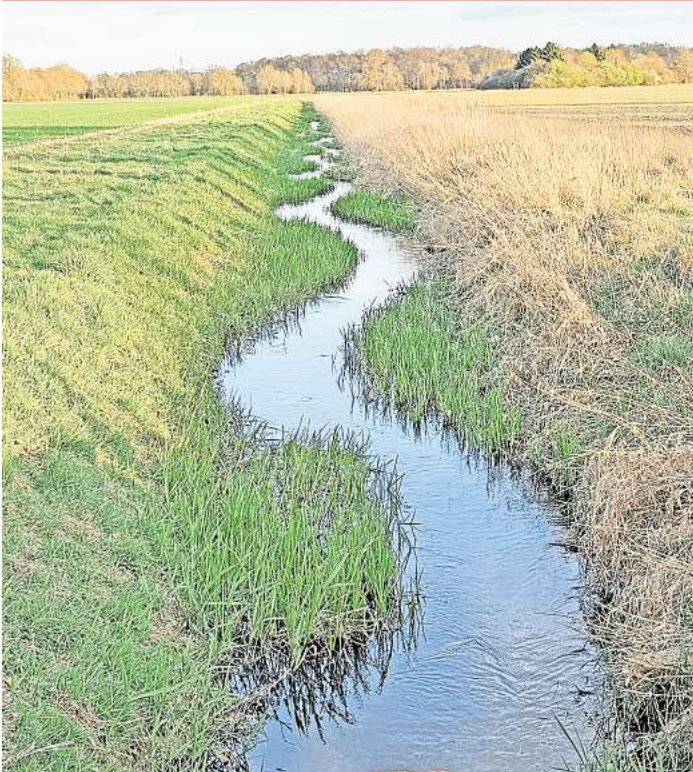
Bennemühler Mühlenbach zwischen Bestenbostel und Plumhof.