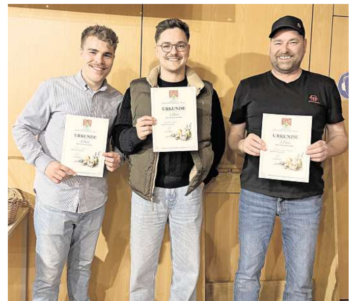
Die Sieger beim Eierpreisschießen.