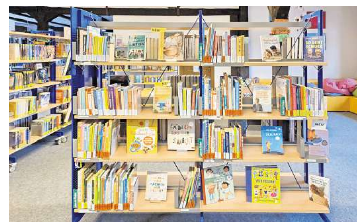
Übersichtlich gesammelt: Bücher zum Thema „Leben mit Kindern“

► Ev.-luth. Auferstehungs-Kirchengemeinde Elze-Bennewald, So., 12.04., 17 Uhr: Bibelteilen in Elue, Präd. Klabunde ► Christliche Gemeinde Bissendorf, Langer Acker 6, So., 12.04., 10 Uhr: Gottesdienst ► Bekennende Ev. Gemeinde Hannover, Mellendorf, Industriestraße 36, So., 12.04., 10.30 Uhr: Gottesdienst und Kindergottesdienst ► Ev.-luth. Kirchengemeinde Helstorf-Abbensen, So., 12.04., 11 Uhr: Gottesdienst in Helstorf, Lktn. Niehoff