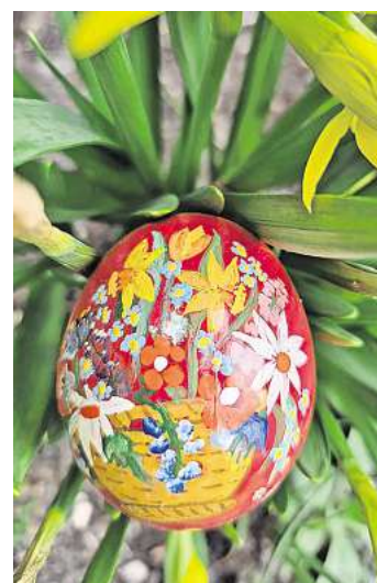
Bunt bemalte Eier - ein schöner Schmuck.