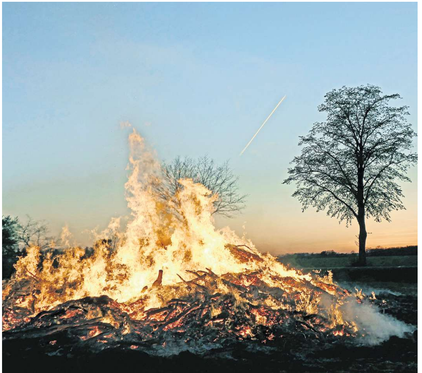
Osterfeuer in Berkhof - und ein Kondensstreifen wird vom Licht der untergehenden Sonne bestrahlt - stimmungsvoll!