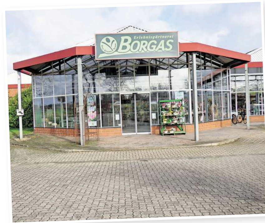
1995 wurde der Neubau an der Brelinger Straße am Ortsausgang Mellendorf eröffnet.