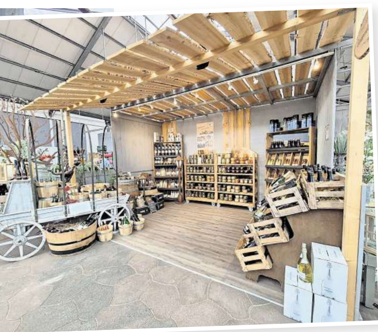
Auch ein Delikatessenbereich gehört zum Einkaufserlebnis.