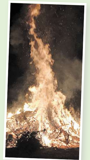
Wärmen am Osterfeuer.

Am Ostersonntag wird bei Einbruch der Dämmerung (gegen 19 Uhr), das Osterfeuer in Scherenbostel abgebrannt. Für das leibliche Wohl wird gesorgt. Am Vortag darf Brennmaterial (reiner Baum- und Strauchschnitt, keine Stücken) auf der markierten Fläche angefahren werden.