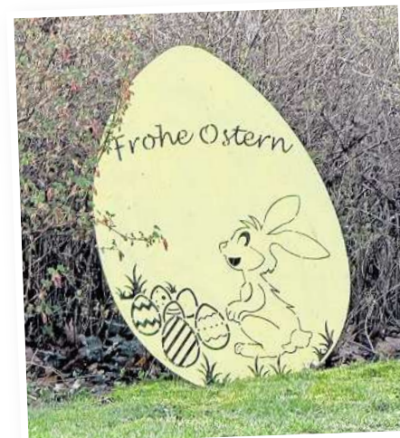
Ostergruß in Meitze in der Kurve.

Die bekannten Autoaufkleber mit stilisierten Fischen greifen diese Tradition bis heute auf. Der Verzehr von Fisch am Karfreitag lässt sich deshalb als Gedenken an Jesus Christus deuten. Fleisch hingegen galt von jeher als Zeichen eines besonderen Genusses. Dieser Luxus widerspricht dem Charakter des Karfreitags, an dem Gläubige des Leidens und Sterbens Jesu gedenken. Aber gehören Fische nicht auch zum Fleisch? Nach traditioneller kirchlicher Auffassung nicht: Als ektotherme Lebewesen, die sich der Umgebungstemperatur anpassen, galten Fische nicht als warmblütige Fleischtiere und waren daher erlaubt.“