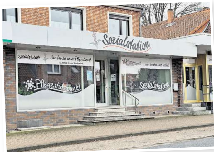
Auch die Sozialstation in Mellendorf soll in die Genossenschaft Seniorenhaus überführt werden. Am Umfang der Dienstleistung wird sich nichts ändern.