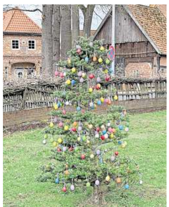
Fröhlich geschmückte Tanne in Elze.