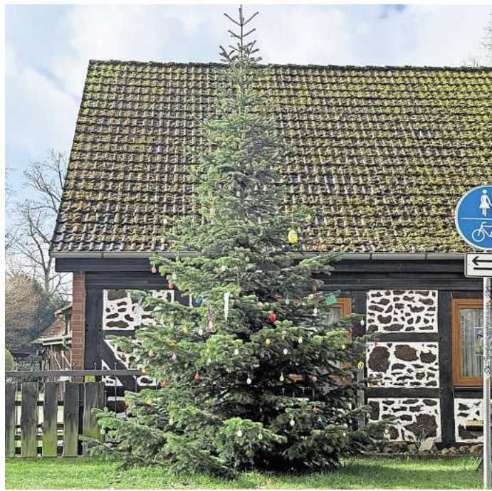
Osterbaum in Meitze.