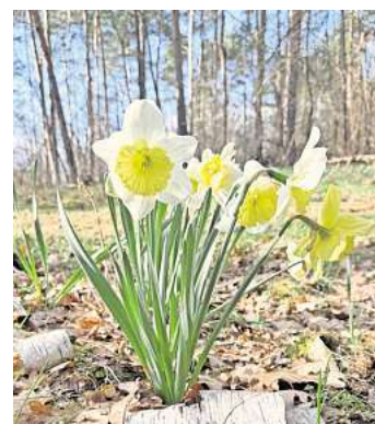
Farbtupfer im noch unbelaubten Wald: Osterglocken nahe der Autobahn östlich von Elze.

ten der Haushalte und in der Natur. Die herrlich gelben Forsythien tragen dazu bei und natürlich das erste Blattgrün an den Bäumen. Ist es nicht wunderbar, wenn an den Ästen der Straßenbäume, die gerade noch kahl waren, der erste grüne Schimmer erscheint?