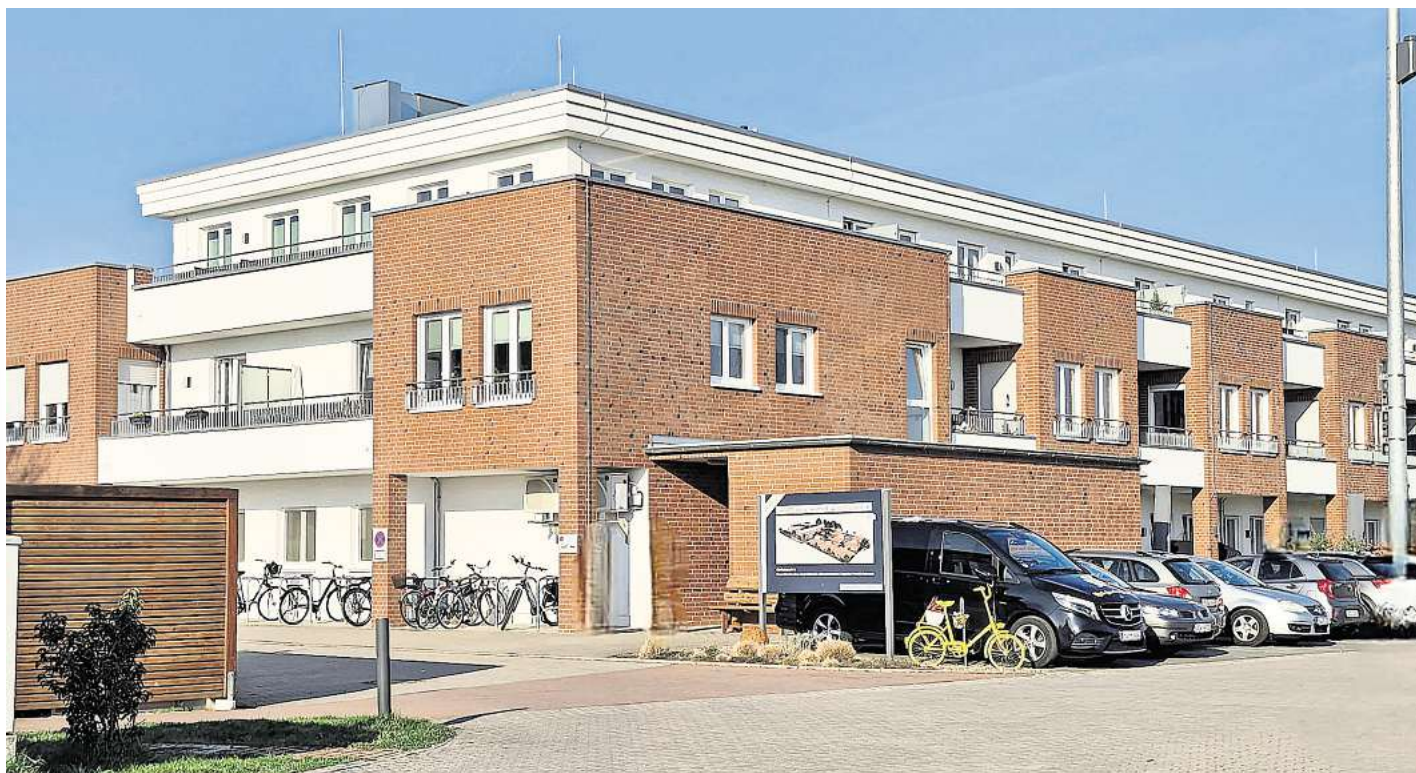
Der Seniorenpark „Alte Festwiese“ in Elze.