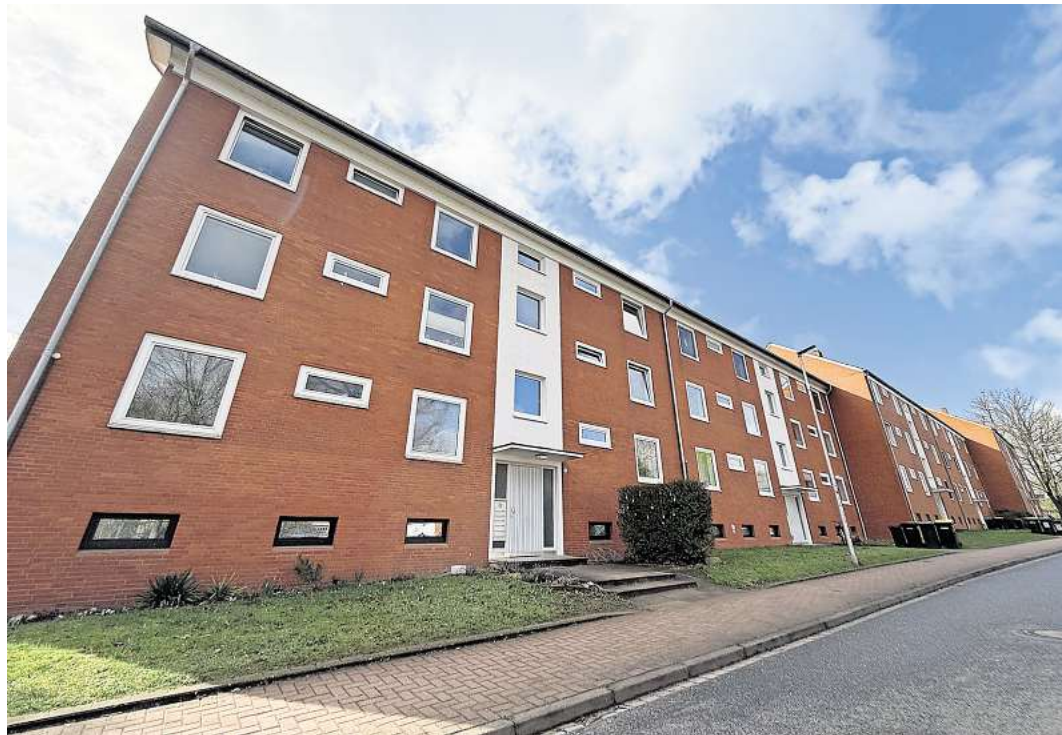
Traditionelles Mietwohnungsgebiet in Mellendorf an der Berliner Straße.

Betrug die Nettokaltmiete zum 1. Januar 2021 noch durchschnittlich 7,96 Euro pro Quadratmeter, waren es zum Sichtzeitpunkt 1. April 2025 bereits 9,71 Euro, eine Steigerung um 22 Prozent. Damit lebt es sich von allen Umlandkommunen in der Wedemark am teuersten. Bei der Nettokaltmiete schlägt die Wohlfühlkommune sogar Isernhagen (9,60 Euro) und Burgwedel (9,23 Euro). Wieder sehen wir, dass die Region Hannover keinen Speckgürtel, sondern ein „Speckek“ hat, denn diese drei sind die einzigen Kommunen mit einem Wert über 9 Euro. Am günstigsten wohnt man in der Region durchschnittlich in Uetze mit 7,10 Euro pro Quadratmeter. Langenhagen liegt mit 8,57 Euro pro Quadratmeter – und damit deutlichem Abstand zu den drei Wohlstandskommunen – an vierter Stelle im Regionsvergleich. Die Wedemark – man muss sie sich leisten können!