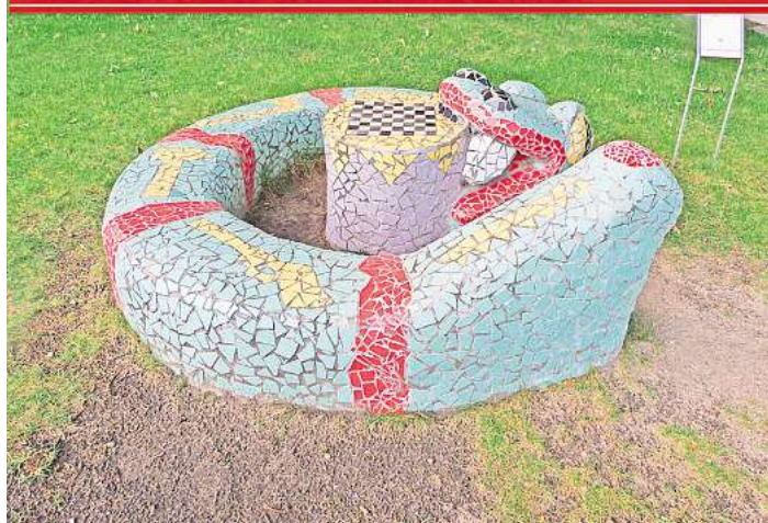
Kinderrechts-Kunstwerk in Resse