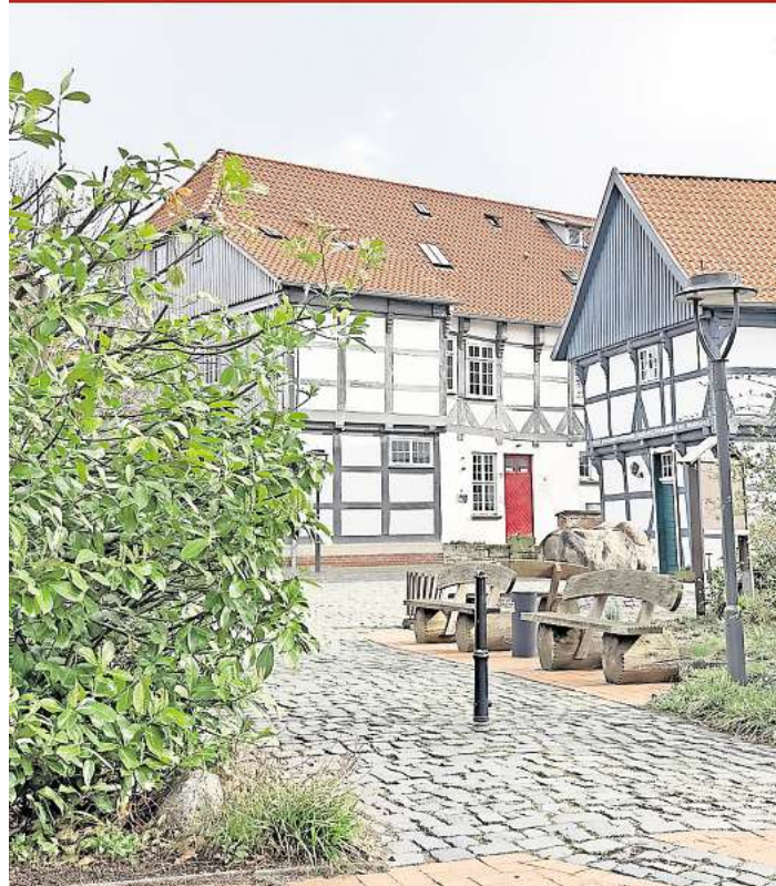
Zwischen Bibliothek, Amtshof und Kavaliershaus.