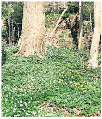
Frühlüher im Bockmer Holz.