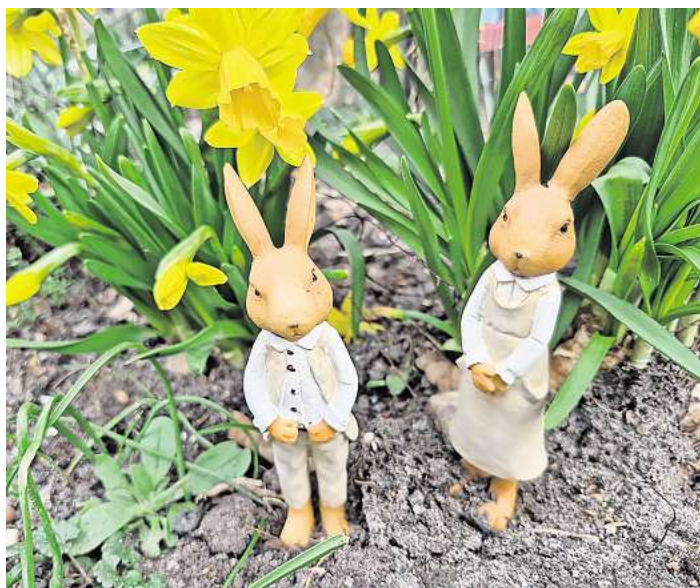
Osterschmuck in einem Wedemärker Garten.

Manche Familien haben die Oster-Tradition bewahrt, dass einige Tage vorher schon Polstermaterial draußen in der Natur gesucht wird, damit man kleine Nester zum Beispiel im Garten oder aber auch im Haus vorbereiten kann. Wenn alles klappt, dann sollten sie am Ostermorgen wohl gefüllt wieder gefunden werden. Denn gute Verstecke müssen es schon sein, schließlich ist der Osterhase in der Nacht von Ostersonntag auf Ostersonntag in streng geheimer Mission unter-