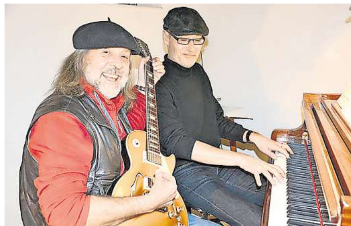
Das Duo Blue Mood.