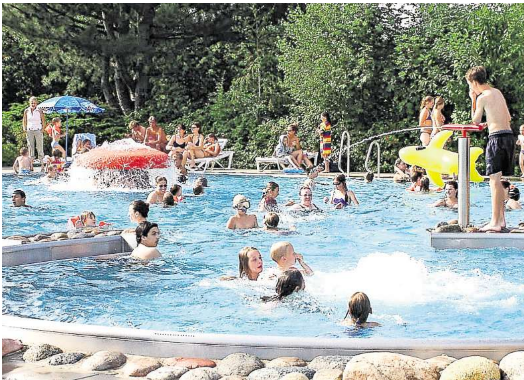
Sommerfreude voraus: Spaßbaderöffnung angekündigt.

MELLENDORF. Die Badesaison steht vor der Tür. Bereits am Samstag, 2. Mai, geht's los. Dann heißt es für die Wedemärker endlich wieder „Schwimmen, Planschen, Volleyball spielen und Sonnenbad auf ihrem einladenden Spaßbadgelände mit garantiert angenehmen Wassertemperaturen bei hoffentlich schönem Wetter.“ Auch in diesem Jahr geht das Spaßbad mit einer Rabatt-Aktion in den Vorverkauf der Saisonkarten: Bis zum Eröffnungstag am 2. Mai gibt es 5 % Rabatt auf alle Saisonkarten. Wer also für den kommenden Sommer das Spaßbad mit einer sehr günstigen Saisonkarte nutzen will, bekommt diese im Spaßbad bis dahin zum Sonderpreis. Die Preise für Saisonkarten bleiben unverändert. Gerne einfach Formular auf der Homepage ausdrucken, ausfüllen und zurückmailen: Homepage: www.spasbadwedemark.de (im Menü unter „Saisonkarten“) Email: info@sportundfreizeit.net .