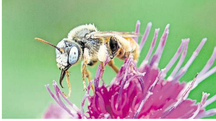
Wildbienen: wichtig für unsere Umwelt.

Der Vortrag ist für NABU-Mitglieder kostenlos. Gäste werden um eine Spende gebeten.