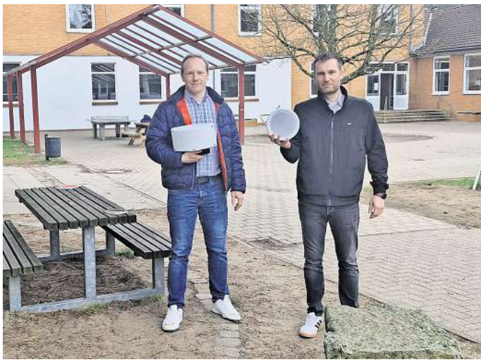
Ein neues Radarsystem an der Realschule im Kampf gegen Vandalismus.

Das System wird nur außerhalb der Öffnungszeiten des Campus W genutzt. „Uns ist wichtig, Sicherheit zu erhöhen und gleichzeitig die Persönlichkeitsrechte