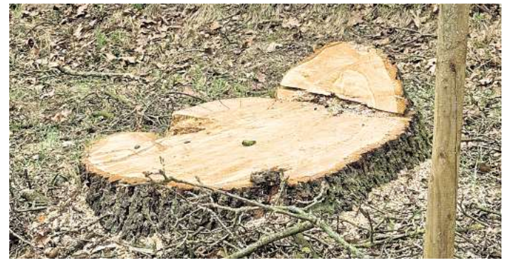
Hier stand eine Esche - doch sie war krank.