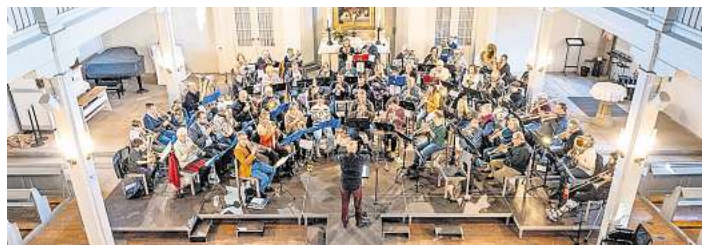
Tag der Posaunenchor in Brelingen.