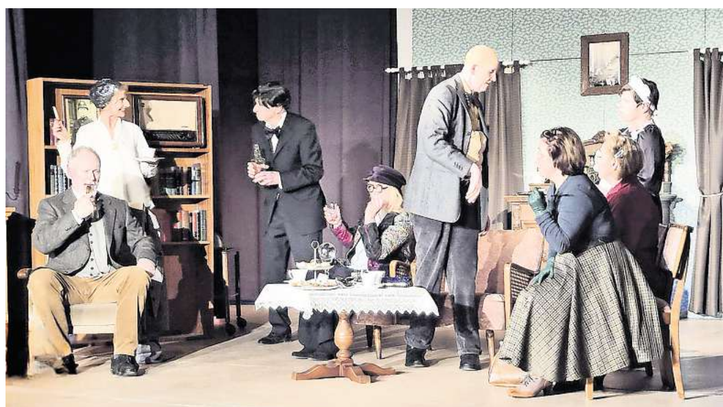
Talentierte und spielfreudige: Die Mitglieder der Theatergruppe Wedemark.

Am heutigen Sonnabend, 14. März, um 18 Uhr ist die letzte Chance, das Stück anzuschauen. Ob noch Karten an der Abendkasse erhältlich sind, ist bei Redaktionsschluss offen.