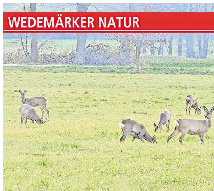
Rehwild vor Wennebostel.