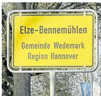
An der Pappelallee - aus Richtung Helledorf: Ah ja, hier beginnt ein Doppelort!

Der Doppelort, der laut Schild an der Einbiegung Pappelallee der L 190 beginnt, gibt uns Rätsel auf. Und dann noch dieses Kilometerhinweisschild, nur 100 Meter weiter auf Höhe der Tischlerei Bombeck in Benne-mühlen! Das besagt, es sei noch ein Kilometer bis Elze Richtung Norden und gen Westen noch ein Kilometer bis Bennemühlen! Wenn man dem Hinweis Richtung Elze folgt, ist man nach einem Kilometer ungefähr bei EDEKA angekommen, am Ortsausgang. Und naja, dieses Hinweisschild steht definitiv in Bennemühlen.