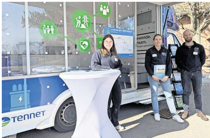
Infomobil von TenneT in Elze.