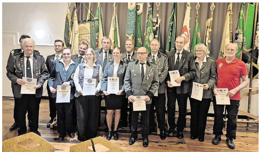
Mit Ehrennadeln ausgezeichnet wurden zahlreiche Schützinnen und Schützen des Kreisverbandes.

Vor dem offiziellen Teil standen zunächst die Ehrungen im Mittelpunkt, auch in diesem Jahr wurden wieder zahlreiche Schützinnen und Schützen für ihr langjähriges und besonderes Engagement mit den unterschiedlichen Ehrennadeln ausgezeichnet, ebenso wurden die Trophäen für sportliche Leistungen verliehen. Den Wanderadler für den Verein, der im vergangenen Geschäftsjahr den größten Zuwachs ver-