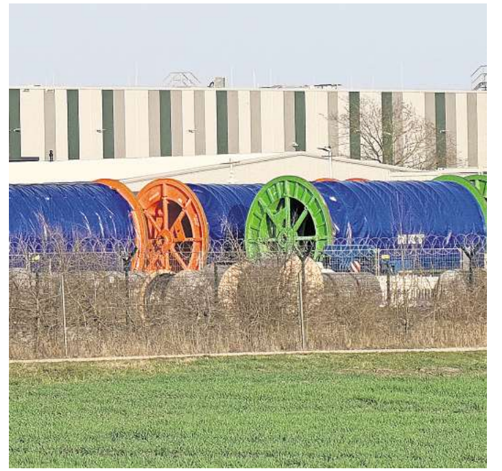
Kabellager für Suedlink - in Berkhof - die Trasse läuft anderswo.

Für die Wedemark ist die deutlich umstrittenere Trasse „Suedlink“ glücklicherweise nur noch insofern ein Thema, dass TenneT nahe Berkhof Kabel dafür lagert. Sie sind knapp 100 Tonnen schwer, circa 12 Meter lang und etwa vier Meter hoch. Platz bietet das Lager für insgesamt 220 Trommeln. „Die Kabel aus Berkhof werden sowohl im 66 km langen Abschnitt in der Region Hannover sowie im nördlich-gelegenen Abschnitt im Heidekreis verlegt. Hierfür werden sie nach Abschluss der Tiefbauarbeiten zu den jeweiligen Abspalplätzen in den Sektionen transportiert“, heißt es bei TenneT.