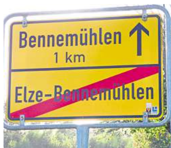
Am Kaffeedamm in Bennemühlen erfahren wir: Das war's mit Elze-Bennemühlen, aber da hinten, da ist dann Bennemühlen.