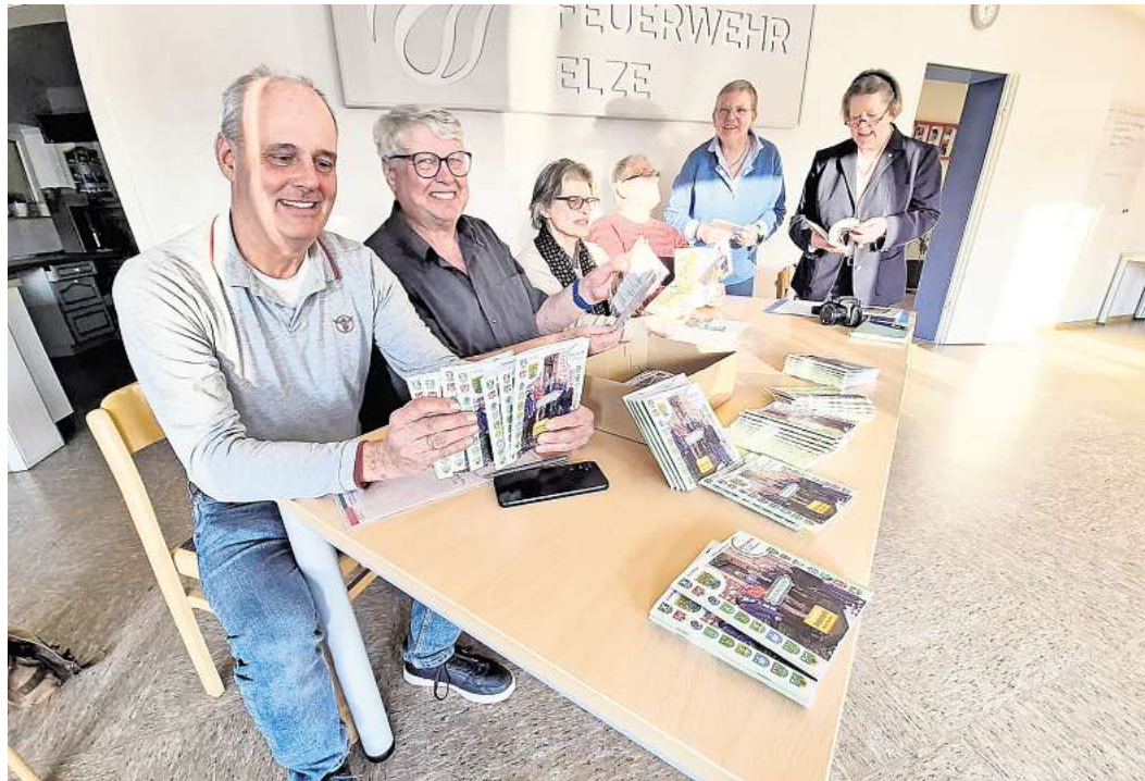
Der neue Seniorenwegweiser wurde vorgestellt und ist ab sofort an vielen Auslagestellen – unter anderem im Rathaus – zu bekommen.

verbands Wedemark. Er konnte aus Sicht des Deutschen Roten Kreuzes bereits einige nützliche Informationen liefern, die auf großes Interesse stießen. Ein neuer Termin mit Maik Plischke wird rechtzeitig in der Presse bekannt gegeben.