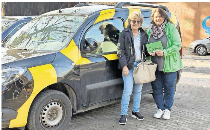
Unterstützung für das Projekt WedeBiene.

selbst einen Stand bei der Veranstaltung, die von 11 bis 14 Uhr dauert, anmelden möchte. Unter basarrundumskind@dghellendorf.de ist dies möglich.