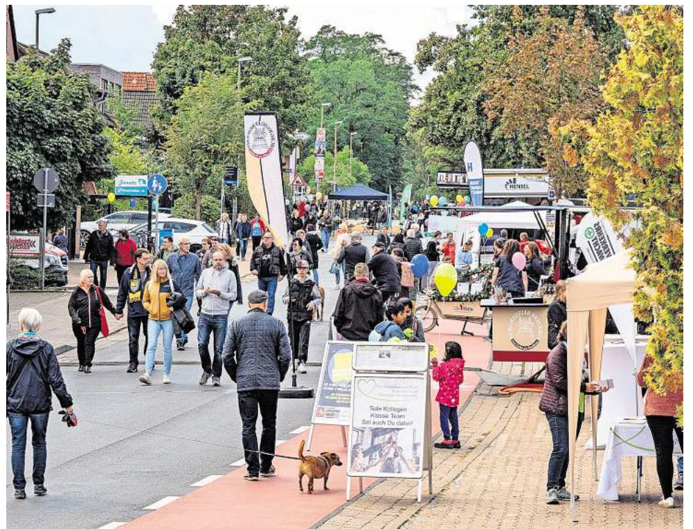
Vielleicht findet sich ein anderes Gremium, das sich für das Konzept des Bissendorfer Sonntags interessiert und die Organisation verantwortlich übernimmt.

Der Vorstand lädt darin dazu ein, sich Gedanken zu machen, wer sich vorstellen kann,