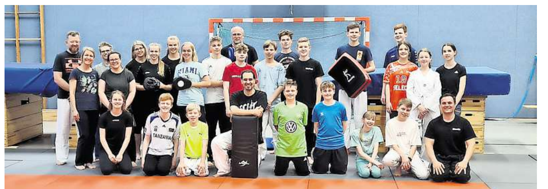
Selbstverteidigungstraining für alle wird angeboten.