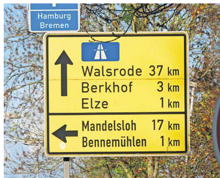
Auf Bennemühler Boden, keine 100 Meter vom Elzer Ortseingang erfahren wir, dass beide Ortsteile noch einen Kilometer weit weg sind.

der ostwärts. Und wenig später ist man da. Das Wietzewasser sprudelt hier über Steine, die je nach Wasserstand mal mehr, mal gar nicht herausragen. Bäume spenden im Sommer Schatten - und am Ufer kann man sich für ein Picknick niederlassen. Allerdings schon in der Gemeinde Wietze, denn zu ihr gehört das Ostufer. Egal: Es ist einfach schön dort.