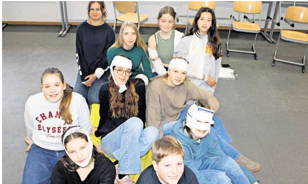
15 Schulsanitäter komplettieren jetzt das Team.

Das Ergebnis kann sich sehen lassen: 15 neue Schulsanitäter wurden vom Jugendrotkreuz ausgebildet und verstärken ab sofort das Team am GM. Mit dabei waren engagierte Schüler aus den Jahrgängen 7, 8, 9 und 10 – und das Interesse war so groß, dass es inzwischen sogar eine Warteliste für die nächsten Kurse gibt. Offenbar gilt am GM nicht nur „Wer Hilfe braucht, bekommt sie“, sondern auch: „Wer helfen will, steht Schlange.“ Die Schulsanitäts-AG ist am Gymnasium Mellendorf ein Ganztagsangebot, das von Klasse 5 bis 13 getragen wird. Aktuell sind sechs Schulsanitäter aktiv im Einsatz – und mit den frisch ausgebildeten Neuzugängen wächst die Gruppe nun kräftig weiter. Die Kursinhalte gingen dabei weit über einen klassischen Erste-Hilfe-Kurs hinaus. Denn Schulsanitäter sollen im Schulalltag schnell und sicher handeln können: ob bei