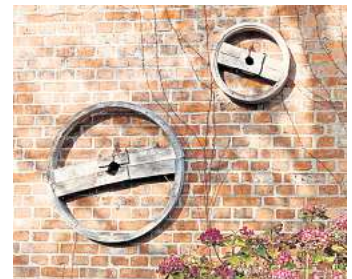
Was suchen wir für den Februar?