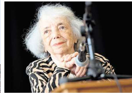
Die Holocaust-Überlebende Margot Friedländer liest am 24.4.2017 in Berlin im Hans-Carossa-Gymnasium Schülern aus ihrem Buch "Versuche, dein Leben zu machen" vor.