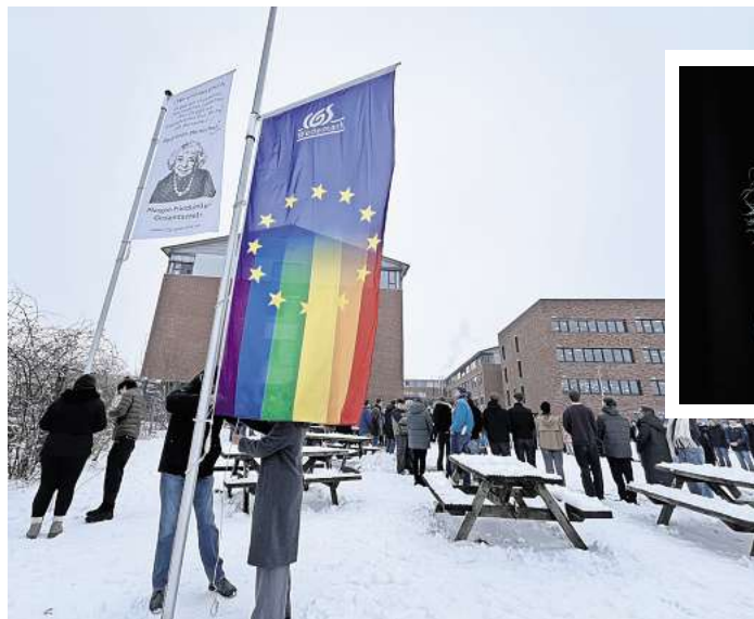
Zwei neue Flaggen: Die Schulfahne rechts trägt neben dem Schullogo den europäischen Sternkreis und den Regenbogen. Und Namenspatin Margot Friedländer ist mit einem Zitat abgebildet: "Wir sind alle gleich. Es gibt kein christliches, muslimisches, jüdisches Blut. Es gibt nur menschliches Blut. Ihr habt alle dasselbe (...) Seid doch Menschen!"

Die kleine Feierstunde zu ihrem neuen Namenstag am Dienstag nutzte die Schule auch für eine weitere symbolische Geste: Am Schulgarten vor dem Gebäude wehen jetzt zwei neue Fahnen im Wind. Eine zeigt das Gesicht Margot Friedländers und ein Zitat von ihr. Die zweite trägt das Schullogo, den Sternenkreis der Europaflagge und einen Regenbogen. Aus diesen drei Symbolen haben die Schüler ihre Schullflagge selbst gestaltet. Sie stehe für Offenheit und diskriminierungs-