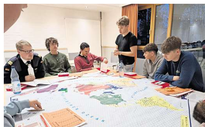
Die Teilnehmer diskutieren die richtige Strategie am Kartentisch.