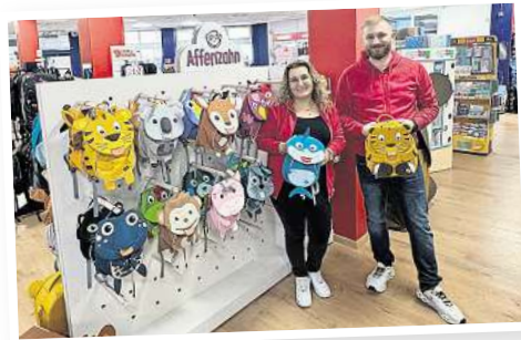
Große Vielfalt an Affenzahn Kinder-rucksäcken.