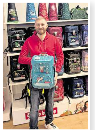
Neues Lieblingsmodell: CLOUD Turtle Josie von Step by Step.

Der „Große Schulranzentag“ soll am Sonnabend, 3. Januar, zwischen 10 und 16 Uhr zu einem großen Familien-Event an der Walsroder Straße 78 werden. Es laufen viele Aktionen wie etwa Waffelbacken oder Glücksrad.