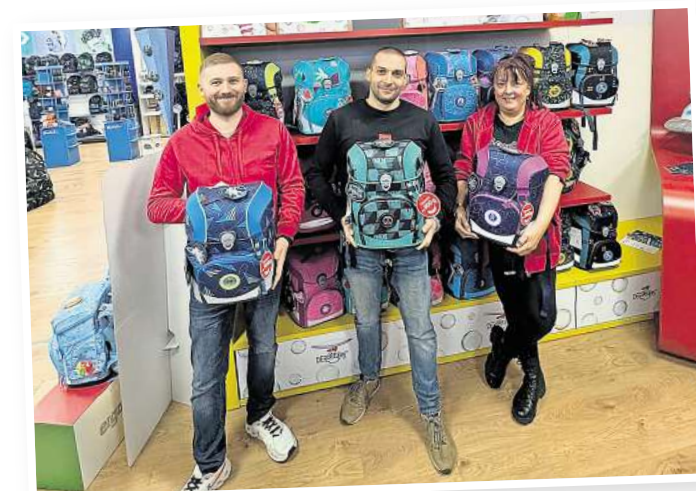
Unsere Favoriten von DerDieDas