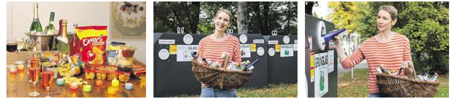
Wohin mit der blauen Flasche? So entsorgen Sie Altglas von der Silvesterparty richtig.

Wer nach der Silvesterparty Sektflaschen, leere Chipstüten oder abgebranntes Tischfeuerwerk richtig entsorgt, schont die Umwelt.