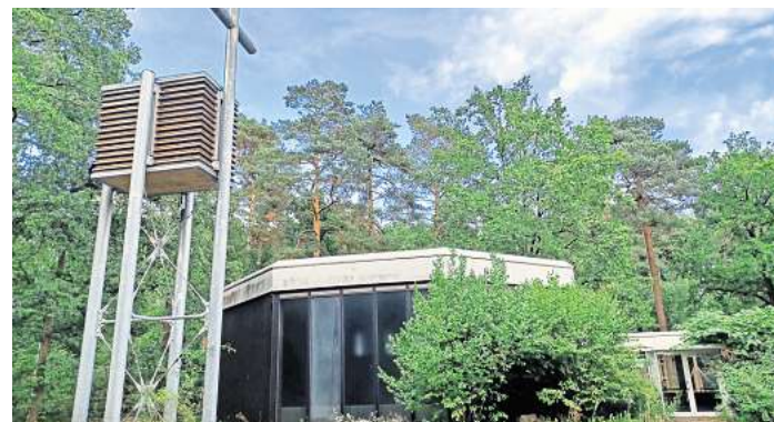
Außer Betrieb: Die entwidmete Christophoruskirche - im Vordergrund der Turm, der nun demontiert und in Bissendorf neu aufgebaut werden soll.

Bauwerk wird in Bissendorf-Wietze demontiert und auf Bissendorfs Friedhof wieder aufgebaut