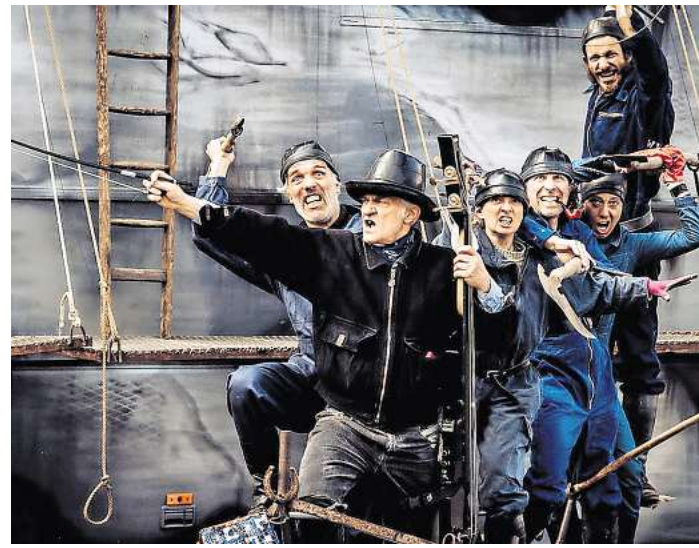
Moby Dick Pressefotos, Theatertage Wedemark

Und das ist für die Theatertage 2025 im Einzelnen geplant: Den Auftakt gestaltet die Band Backyard Hipstett am Mittwoch, 10. September, 18 Uhr, in der Grundschule Mellendorf am Røye-Platz. Der Eintritt ist kostenlos