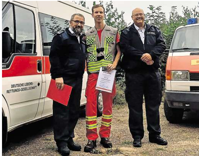
Eien besondere Ehrung stand bei der DLRG Wedemark auf dem Programm.