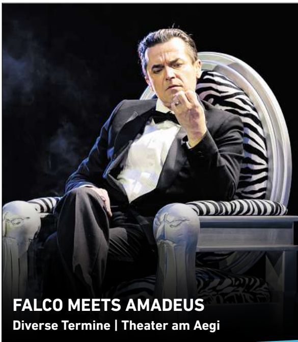
FALCO MEETS AMADEUS Diverse Termine | Theater am Aegi

fach ins Gesicht, woraufhin dieser sich ebenfalls mit Schlägen zur Wehr setzte. Alle drei Personen wurden leicht verletzt. Die alarmierten Polizeikräfte stellten bei drei der vier Personen durch Atemalkoholtests erhebliche Alkoholbeeinflussungen fest und leiteten Strafverfahren wegen Körperverletzung und gefährlicher Körperverletzung ein. Zwei Personen erhielten für den Bereich einen Platzverweis.