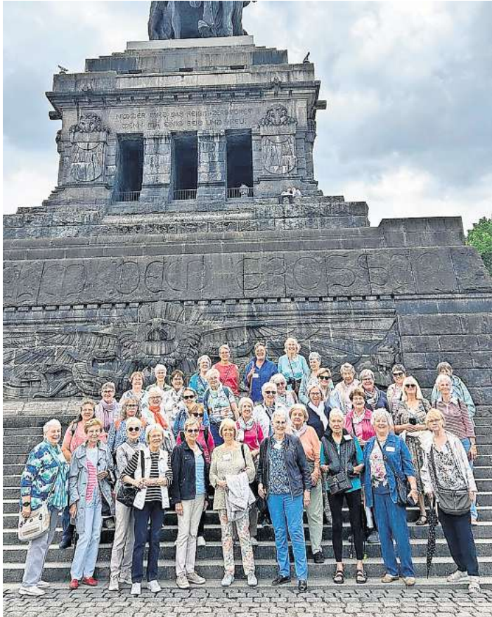
Trier und Luxemburg waren die Ziele, die der Verein angestreut hat.

den vielen Sehenswürdigkeiten ist die älteste Stadt Deutschlands eine Reise wert. Am nächsten Morgen ging es pünktlich, trotz Weinprobe am Vorabend, mit dem Bus nach Luxemburg. Die LandFrauen besuchten die Stadt Luxemburg mit ihren modernen Geschäftszentren inmitten historischer Festungsanlagen. Diese Mischung verleiht der Stadt ein besonderes Flair. Besondere Wichtigkeit erlangt die Stadt auch durch ihren Verwaltungssitz der Europäischen Union. Am letzten Tag der Reise führen wir Richtung Heimat, nicht ohne Die Mosel noch mit dem Schiff von Cochem bis Beilstein zu befahren. Vier Tage mit vielen Informationen, Spaß und Unterhaltung waren schnell vorüber und die Reise wird bei den Teilnehmerinnen noch lange in Erinnerung bleiben.