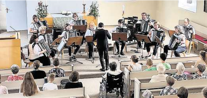
Konzert des Langenhagener Akkordeonorchesters in der St. Michaeliskirche.

Weitere Informationen zum Musizieren beim ACL, Akkordeon Club Langenhagen, bietet die Internetseite http://www.akkordeon-club-langenhagen.de .