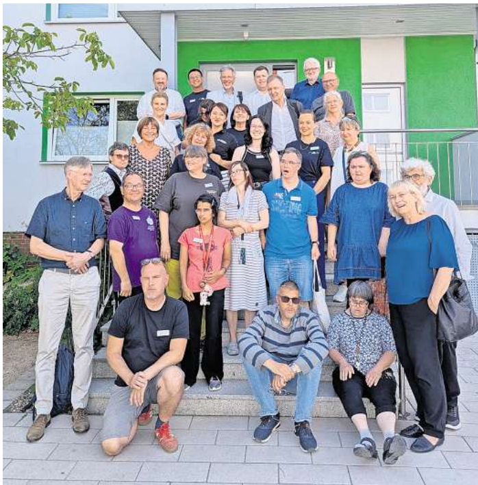
Der Bundesvorstand der Lebenshilfe mit Mitarbeitenden der Lebenshilfe Langenhagen-Wedemark sowie der Selbstvertretung.

MAJA – Jugendarbeit dort, wo sie gebraucht wird. Besonders im Fokus stand die Arbeit von MAJA – die mobile aufsuchende Jugendarbeit der Lebenshilfe. Ihr Ziel: Jugendlichen zwischen zwölf und 24 Jahren im öffentlichen Raum zu begegnen, Konflikte zu entschärfen und ihnen dabei zu helfen, soziale Verantwortung zu übernehmen. Ob