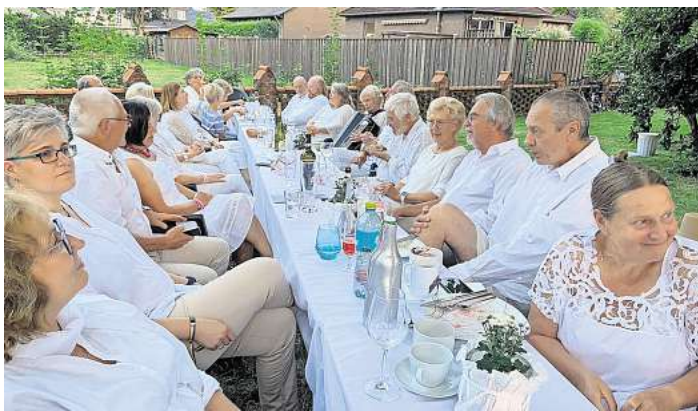
Ein kulinarischer Abend steht am 25. Juli in Abbensen auf dem Programm.