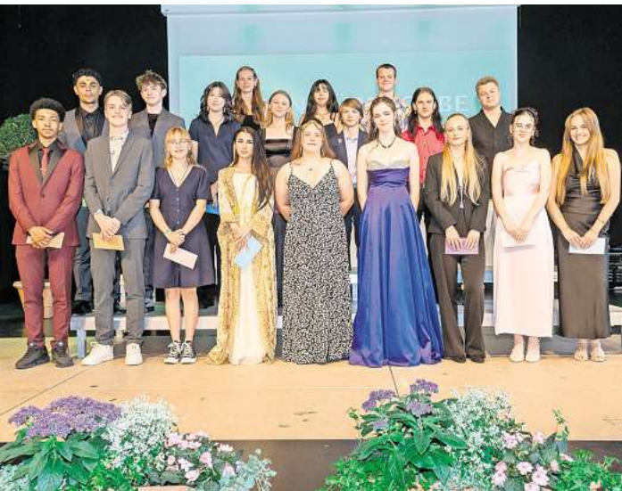
Die Geehrten der IGS Wedemark.