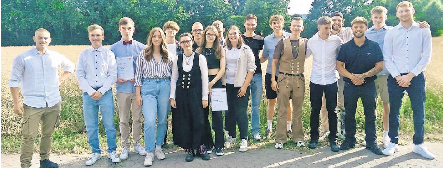
17 neue Gesellen hat die Tischler-Innung Burgdorf freigesprochen.

Starker Jahrgang 2025 überzeugt mit handwerklicher Qualität