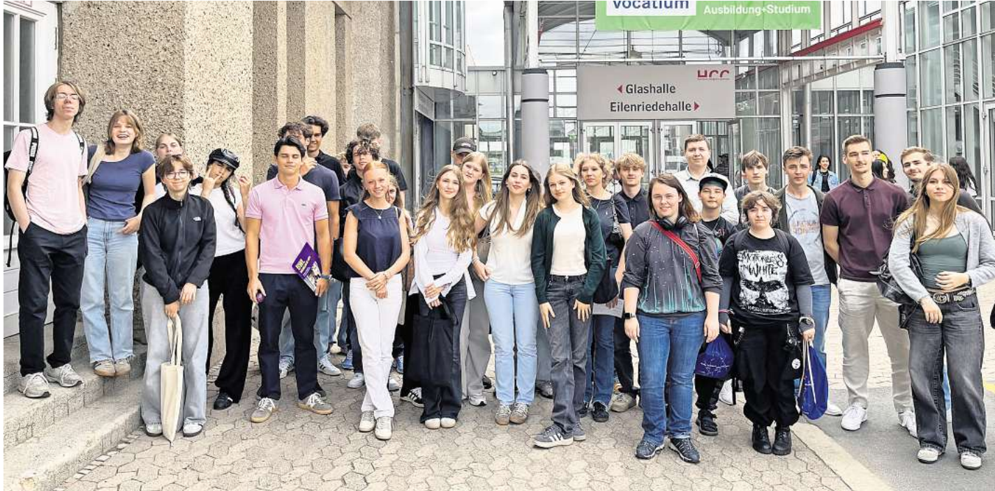
Die Schülerinnen und Schüler der zwölften Klasse orientierten sich in Sachen Berufsausbildung und Studium.

Zwölftklässler des Gymnasiums Mellendorf auf der Vocatium in Hannover