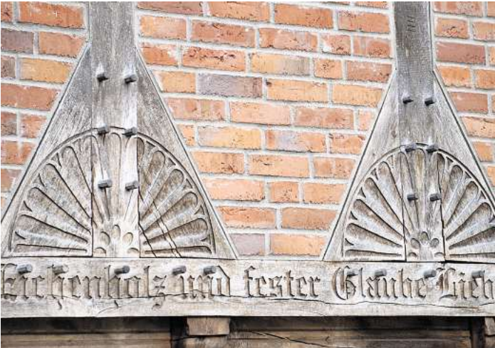
Was suchen wir in diesem Monat?

Jona hat mir schwere Vorwürfe gemacht. Er fand es unauthentisch. Er hat nicht an die Veränderung der Menschen geglaubt. Ich denke, er fand es einfach ungerecht.“ Ich trinke einen Schluck und denke darüber nach. „Aber müsste Jona nicht dankbar darüber sein, dass du nett bist? ‚Gnädig‘? Denn Jona profitiert doch selbst davon. Immerhin musstest du ihm diesen Auftrag zwei Mal geben! Beim ersten Mal hat sich Jona deinem Wunsch widersetzt. Er wollte vor dir weglaufen. Nein, er IST vor dir weggelaufen. Er musste erst drei Tage und drei Nächte in einem Wahl verbringen, bevor er nur Vernunft kam. Erst da hat