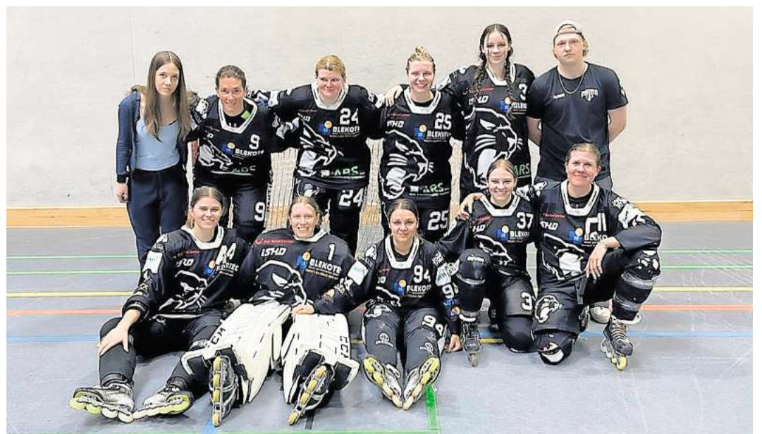
Die Pink Panther schickten die Miners mit 13:0 nach Hause.