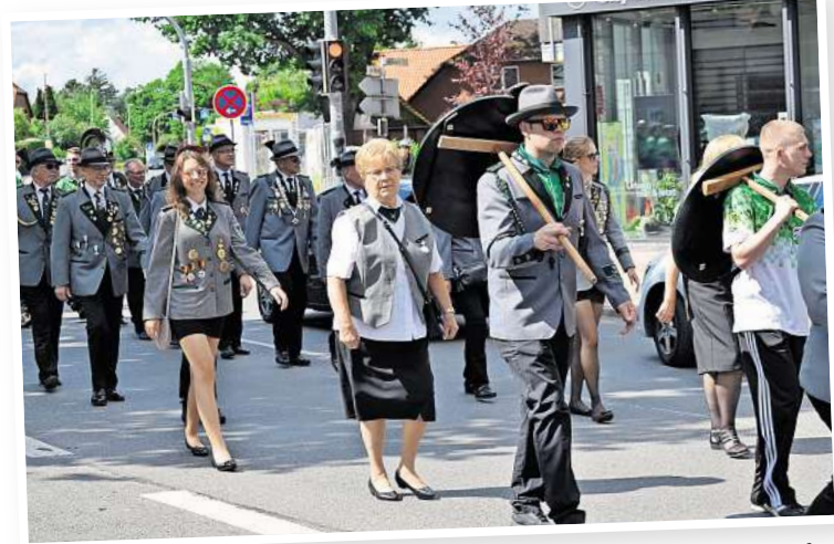
Das Austragen der Ehrenscheiben gehört in jedem Jahr beim Ausmarsch dazu.

Schließlich geht dann das diesjährige Fest seinem Ende entgegen, nach dem Platzkonzert der Festzugskapellen wird das Schützenfest gegen 21 Uhr ausklingen. Essenmarken für das Festessen mit Suppe, Schnitzel (Schwein/Pute), Champignon-Rahmsuppe, Sauce Hollandaise, Buttergemüse, Kräuterkartoffeln oder alternativ einer vegetarischen Lasagne sind bis bar im Gartencenter Klippbahn, im Bistrorante Edessa, bei Christa van Geldern, Tel. (05130) 84 76 oder bei Waltraud und Dirk Pluschke, Tel (0172) 544 0311 und im Schützenhaus Bissendorf, montags und donnerstags von 19 bis 20.30 Uhr zu erhalten. Sie kosten pro Person ab 14 Jahren 23 Euro, sieben bis dreizehn Jahre 12 Euro, jüngere Kinder sind kostenfrei. (JO)