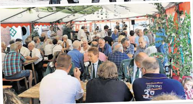
Die Brelinger Schützen freuen sich, wenn sie auch in diesem Jahr wieder mit zahlreichen Gästen feiern können.