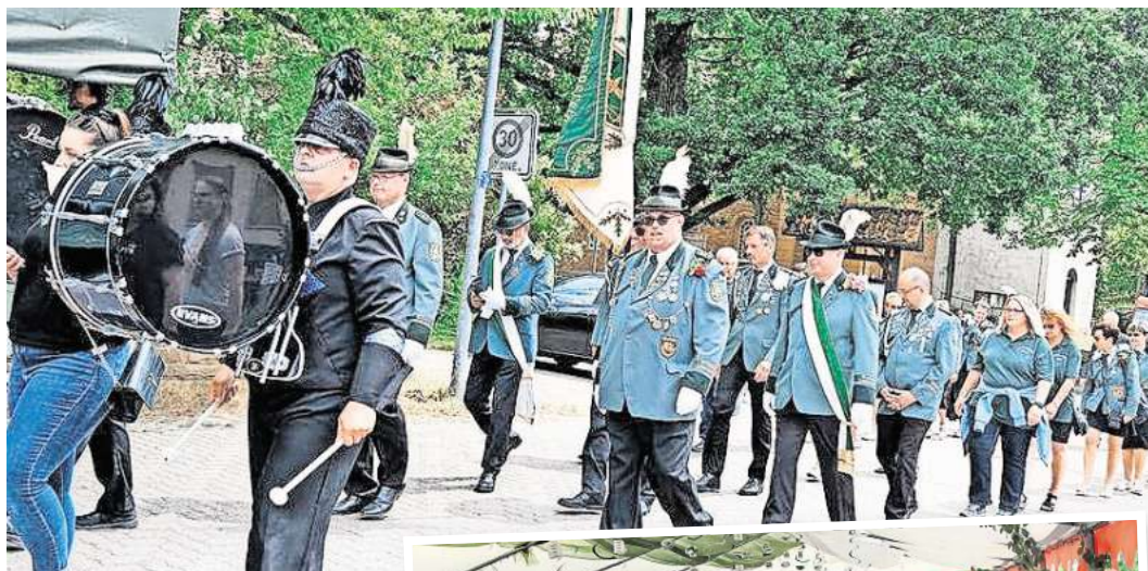
Traditionell marschieren die Schützen von der Dorfmitte gemeinsam zum Festplatz um dort ihre neuen Majestäten zu proklamieren.

Die Schützen laden zu ihrem Fest mit einem bunten Rahmenprogramm ein, zu dem auch wieder die