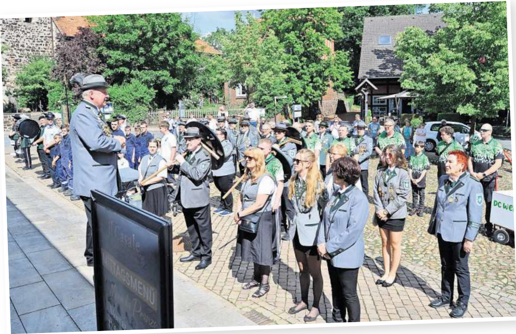
Traditionell versammelt sich die Schützengesellschaft zur Proklamation auf dem Amtshof mitten im Dorf.

Die Vorbereitungen für das diesjährige Schützenfest in Bissendorf laufen, am Wochenende 14. und 15. Juni erwarten die Schützen ihre Gäste im Zelt auf dem Festplatz gleich neben der Mehrzweckhalle. Auch in diesem Jahr wird dabei an alte Traditionen angeknüpft, die Proklamation der neuen Würdenträger für das Jahr 2025 wird wie eh und je auf dem Amtshof mitten im Dorf stattfinden. Dazu treffen sich die Vereinsmitglieder am Samstag um 15 Uhr auf dem Festplatz, von dort geht es etwa eine halbe Stunde später mit musikalischer Begleitung zu Fuß zum Amtshof, der den passenden Rahmen für die Ehrung der besten Schützinnen und Schützen des Jahres bildet. Nach einem Umtrunk und einer kurzen Rast setzt sich die Festgesellschaft schließlich wieder in Bewegung, um die Ehrenscheiben zu ihren neuen Besitzern zu bringen und sichtbar an deren Wohnhäusern anzunageln. Gegen 18 Uhr ist die Rückkehr zum Festplatz vorge-