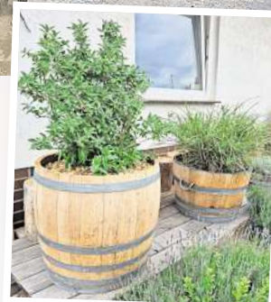
Aktuell haben die unterschiedlichen Pflanzgefäße Saison.

Noch betreibt der junge Geschäftsmann sein kleines Unternehmen im Nebenerwerb. Ziel ist es aber, damit