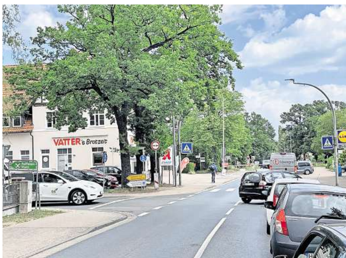
Hier gibt es viele kleinere Unfälle: Die Einmündung der Schaumburger Straße in die Wedemarkstraße.

Ein Straßenzug tauche allerdings recht häufig in den Unfallberichten auf, berichtet Bühr-