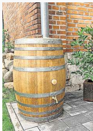
Aktuell stark gefragt sind die attraktiven Regefässer für den Garten.

auch den Lebensunterhalt zu sichern: „Ich habe noch eine Menge Ideen, unter anderem möchte ich gerne eine kleine Weinhandlung einrichten, in der man eben nicht nur die Accessoires sehen und erstehen kann, sondern auch gleich den Wein dazu. Kontakt zur Terminvereinbarung mit der Fassmanufaktur ist entweder telefonisch unter der Nummer 0173 – 62 53 494 oder per Email unter moin@weinkram-shop.de möglich. Weitere Infos gibt es im Internet unter www.weinkram-shop.de