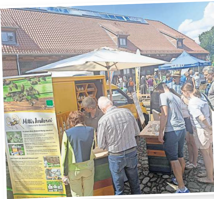
Imker zeigen, wie Honig von den Bienen erzeugt wird

Als prominenten Gast erwarten die Wedemärker Grünen ihre Landtagsabgeordnete Djenabou Diallo-Hartmann. Als Motto ihres eigenen Stands auf dem Öko-Markt stellen die Grünen die Frage: „Was sind Ihre Wünsche für unsere Wedemark?“ (JO)