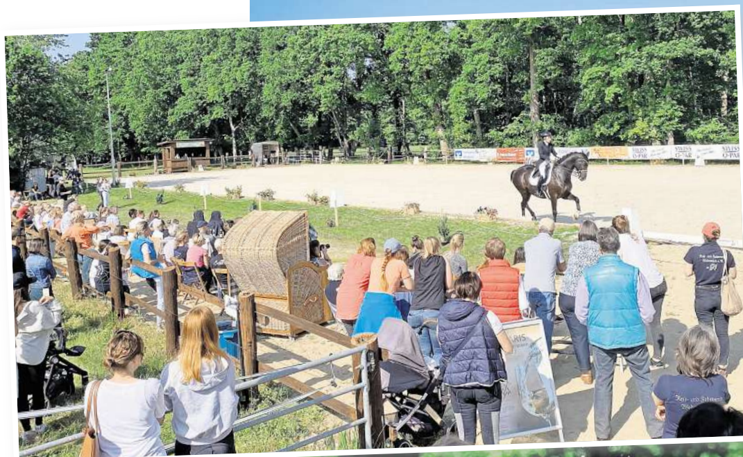
Am Wochenende 17. und 18. Mai stehen ausschließlich die Dressurreiterinnen und -reiter beim Turniergehen im Mittelpunkt.

Bewährt hat sich bei der Ausrichtung der beiden Turniere die Trennung zwischen Dressur- und Springreiten. Nachdem es zunächst einen jährlichen Wechsel gegeben hat, stimmen die ehrenamtlichen Helferinnen und Helfer aus den Reihen des Vereins mit einer gehörigen Portion Engagement das Arbeitspensum an zwei aufeinanderfolgenden Wochenenden. Los geht es am Samstag, 17. Mai, mit den Dressurprüfungen von der Einsteigerklasse E bis hin zur hochrangigen S***-Prüfung. In diesem Jahr wird es dabei erstmals zwei Touren in der schweren Klasse geben. Am Sonntag findet die S*-Dressur als Qualifikation statt, die besten zehn Paare dürfen dann in der Intermediäre I, einer S**-Prüfung, an den Start gehen. Die Intermediäre II, eine S***-Dressur am Samstag ist die Qualifikation für die Hauptprüfung am Sonntag, dem „Swiss-o-Par-Kurz-Grand-Prix“, einer S***-Dressur. Ausgetragen werden die einzelnen Prüfungen auf zwei Plätzen, die natürlich auch dem reicherlichen Nachwuchs für seine Prüfungen in den verschiedenen Leistungsklassen zur Verfügung stehen werden.