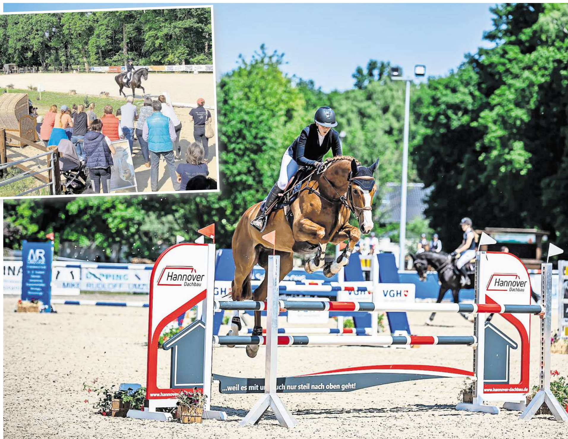
Eine Woche später, vom 23. bis 25. Mai laufen die Springprüfungen auf dem Gelände des Reitvereins Wedemark in Helledorf.

Der Sonntag soll dem Nachwuchs gehören, dann liegt der Fokus auf den Kindern und den Amateuren beim „Dr. Rimpler Family