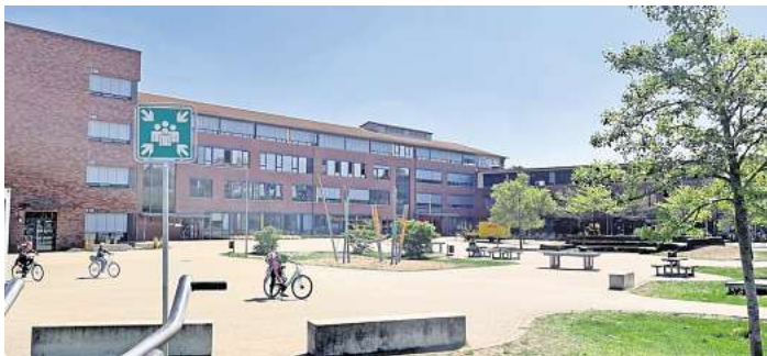
Treffpunkt in Mellendorf: Im Umfeld der weiterführenden Schulen, dem Campus W, sind auch nachmittags junge Leute unterwegs.

MELLENDORF (GÖT). Jugend redet mit: Ein neues Beteiligungsformat gibt Kindern, Jugendlichen und jungen Erwachsenen in der Wedemark die Möglichkeit, eigene Themen zu setzen und kommunalpolitisch mitzugestalten. Radwege, Müll, überfüllte Busse, zusätzliche Sitzgelegenheiten und Treffpunkte für die Abendstunden, mehr Gehör bei der Verwaltung, Mitwirkung auf Social-Media-Plattformen, Partys organisieren: All das sind Themen, die junge Leute bei den ersten drei Treffen zur Sprache gebracht haben. Dazu hatte die Gemeinde eingeladen. Wer sich angesprochen fühlt, könne bei den