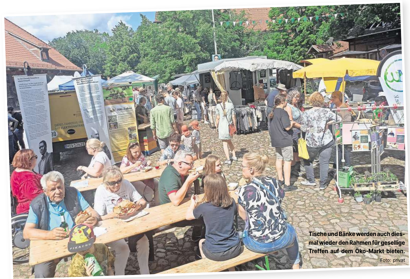
Tische und Bänke werden auch diesmal wieder den Rahmen für gesellige Treffen auf dem Öko-Markt bieten.

Bunte Budenstadt mit ökologischem Anspruch