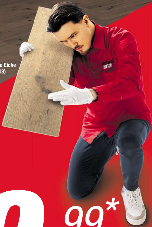
Maja Eiche (7613)

*Nur auf ausgewählte Böden bis zum 03.06.2025. Nicht kombinierbar mit anderen Aktionen. Eine Rabattierung bereits getätigter Aufträge ist nicht möglich. Abgabe nur in haushaltsüblichen Mengen bei sofortiger Mitnahme. Nur solange der Vorrat reicht.