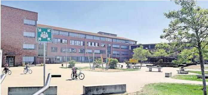
Treffpunkt in Mellendorf: Im Umfeld der weiterführenden Schulen, dem Campus W, sind auch nachmittags junge Leute unterwegs.

MELLENDORF (GÖT). Jugend redet mit: Ein neues Beteiligungsformat gibt Kindern, Jugendlichen und jungen Erwachsenen in der Wedemark die Möglichkeit, eigene Themen zu setzen und kommunalpolitisch mitzugestalten. Radwege, Müll, überfüllte Busse, zusätzliche Sitzgelegenheiten und Treffpunkte für die Abendstunden, mehr Gehör bei der Verwaltung, Mitwirkung auf Social-Media-Plattformen, Partys organisieren: All das sind Themen, die junge Leute bei den ersten drei Treffen zur Sprache gebracht haben. Dazu hatte die Gemeinde eingeladen. Wer sich angesprochen fühlt, könne bei den