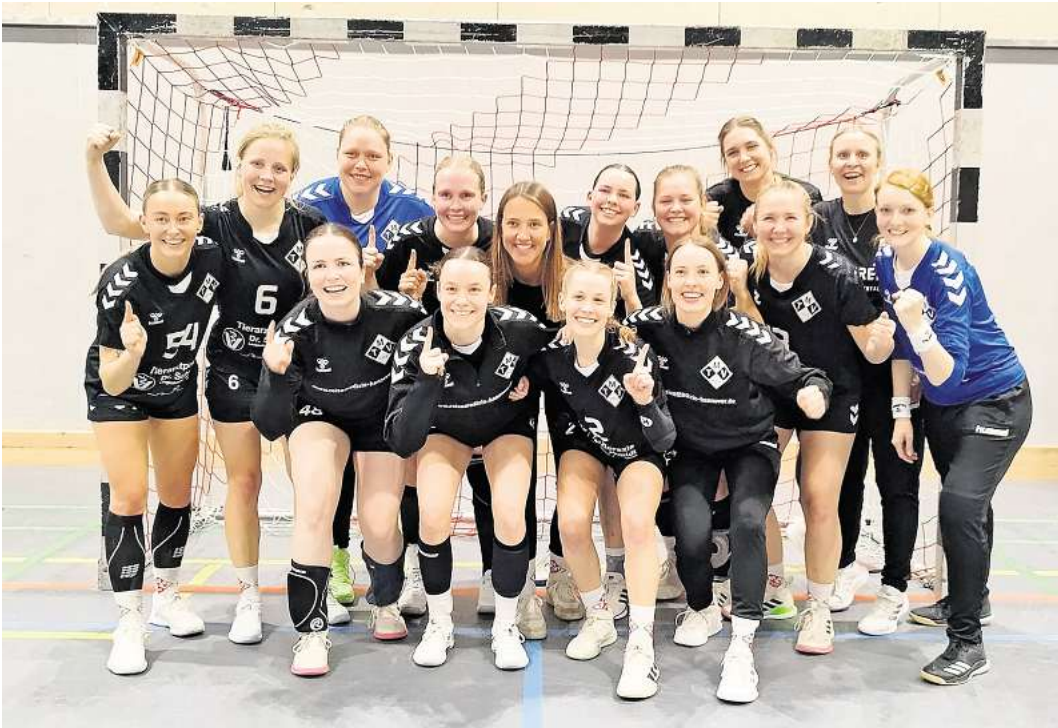
Die glückliche Mannschaft nach dem Punktgewinn gegen Schaumburg.