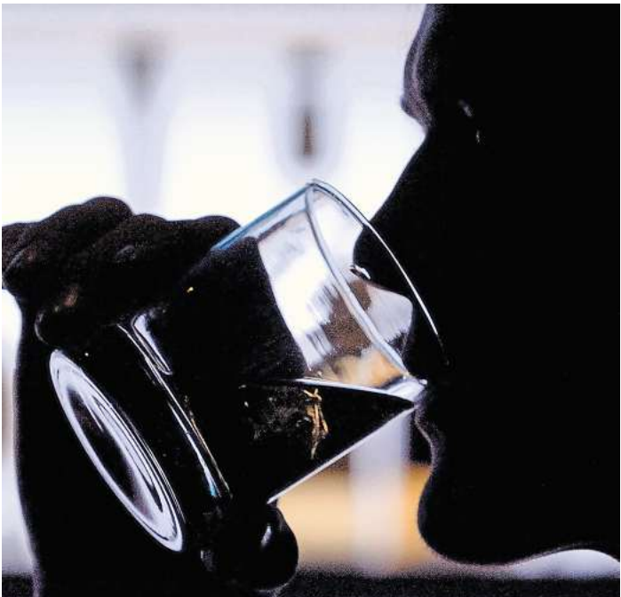
Langsam und bewusst: Wer sich für sein Getränk Zeit nimmt, trinkt im Laufe des Abends wahrscheinlich weniger Alkohol.

Die Kampagne „Alkohol? Kenn dein Limit“ gibt Tipps und Tricks