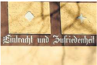
Was suchen wir?