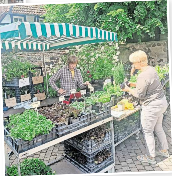
Beim 32. Öko-Markt wird es auch wieder Bio-Stauden und vorgezogene Gemüsepflanzen geben.