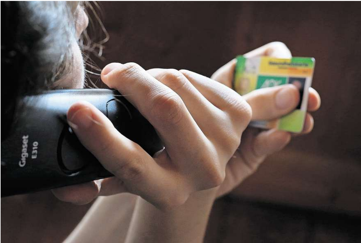
Telefonmasche: Betrüger bieten kostenpflichtige Pflegekurse oder sogenannte „Pflegeboxen“ an – meist unnötig oder völlig übersteuert.

Auch solche Boxen sollten Sie sich am Telefon nicht verkaufen lassen. Das Vorgehen ist identisch: Die Betrüger fragen nach Ihren Versichertendaten und rechnen später mit der Kasse ab, den Inhalt der Box brauchen Sie aber womöglich gar nicht. Besonders bitter wird es für Verbraucher, wenn sie keinen anerkannten Pflegegrad haben. Denn dann bleiben sie selbst auf den Kosten sitzen.