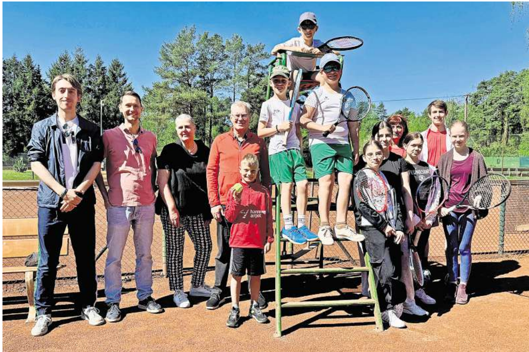
Die Jugendlichen waren eifrig bei der Sache.

TC Resse: Kinder- und Jugendteams standen im Mittelpunkt