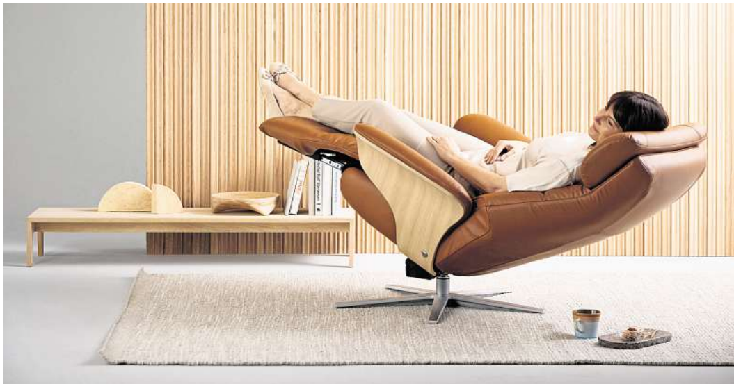
Einfach mal die Füße hochlegen: Die Herz-Waage-Funktion kann zur tiefer Entspannung beitragen.

Experten raten dazu, bei einem Gefühl der Erschöpfung die sogenannte Herz-Waage-Position einzunehmen. Dabei kommt der Körper in eine fast waagerechte Lage, die Füße befinden sich höher als das Herz. Dies kann zur Entlastung des Herz-Kreislauf-Systems beitragen und kann nicht nur Personen gut tun, die nach einem langen Tag über schwere Beine klagen.