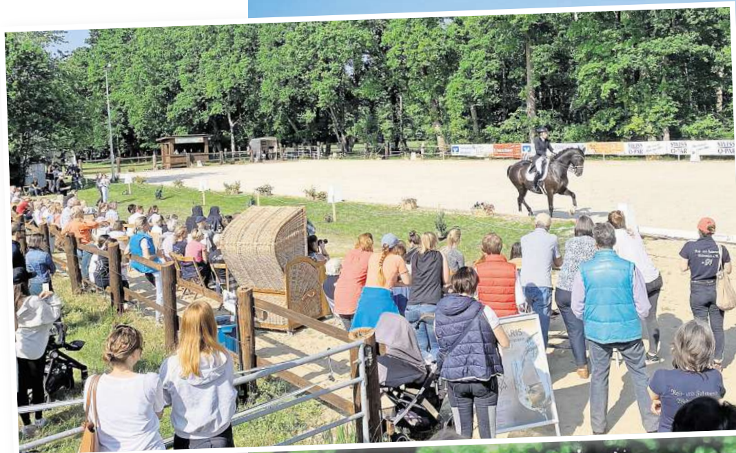
Am Wochenende 17. und 18. Mai stehen ausschließlich die Dressurreiterinnen und -reiter beim Turniergehen im Mittelpunkt.

Bewährt hat sich bei der Ausrichtung der beiden Turniere die Trennung zwischen Dressur- und Springreiten. Nachdem es zunächst einen jährlichen Wechsel gegeben hat, stemmen die ehrenamtlichen Helferinnen und Helfer aus den Reihen des Vereins mit einer gehörigen Portion Engagement das Arbeitspensum an zwei aufeinanderfolgenden Wochenenden. Los geht es am Samstag, 17. Mai, mit den Dressurprüfungen von der Einsteigerklasse E bis hin zur hochrangigen S***-Prüfung. In diesem Jahr wird es dabei erstmals zwei Touren in der schweren Klasse geben. Am Sonntag findet die S*-Dressur als Qualifikation statt, die besten zehn Paare dürfen dann in der Intermediäre I, einer S**-Prüfung, an den Start gehen. Die Intermediäre II, eine S***-Dressur am Samstag ist die Qualifikation für die Hauptprüfung am Sonntag, dem „Swiss-o-Par-Kurz-Grand-Prix“, einer S***-Dressur. Ausgetragen werden die einzelnen Prüfungen auf zwei Plätzen, die natürlich auch dem reicherlichen Nachwuchs für seine Prüfungen in den verschiedenen Leistungsklassen zur Verfügung stehen werden.