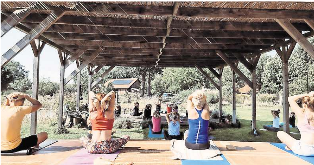
Körperbewusstsein und ganzheitliche Gesundheit auf dem Yogakongress 2025.

Ein ganzheitliches Programm wie Yoga berücksichtigt neben dem körperlichen und mentalen Stressabbau über Bewegung und Entspannung auch Bereiche wie Lebensgestaltung, der Kommunikation, der ganzheitlichen Gehirngesundheit und Ernährung. Insofern steht dieser Yogakongress auch im Zeichen des Ayurveda. Beide Systeme gelten als altindische Übungs- und Heilwege, die auf Beobachtung und Erfahrung basieren und an den Ursachen ge-