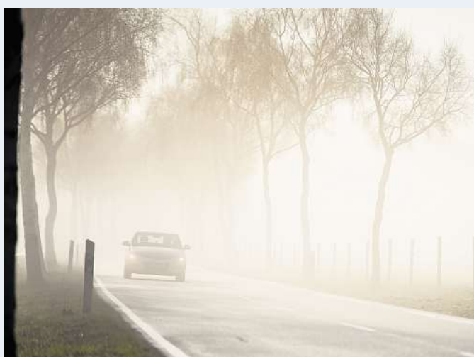
Besonders in ländlichen Gebieten oder Senken kann es am frühen Morgen neblig sein.

Besonders in ländlichen Gebieten oder Senken kann es am frühen Morgen neblig sein. Durch die eingeschränkte Sicht sind verzögerte Reaktionszeiten einzuplanen, so dass das Tempo zu reduzieren und der Abstand zum vorausfahrenden Fahrzeug zu vergrößern ist. Die korrekte Nutzung der Fahrzeugbeleuchtung ist für mehr Durchblick bei Nebel essenziell. Hierbei sollte man sich nicht auf die Lichtautomatik verlassen, da diese mit Nebel und Regen Schwierigkeiten haben kann. Viele Fahrzeuge verfügen über Nebelscheinwerfer, die bei Nebel, Regen oder Schnee eingeschaltet werden dürfen, zusätzlich kann das Standlicht eingeschaltet werden. Sobald die Sichtweite weniger als 50 Meter beträgt, ist zudem die Nebelschlussleuchte einzuschalten und das Tempo auf 50 km/h zu drosseln – auch auf der Autobahn. Verbessern sich die Sichtverhältnisse – was im Frühjahr schnell gehen kann – müssen sowohl Nebelscheinwerfer als auch Nebelschlussleuchte umgehend wieder ausgeschaltet werden, um