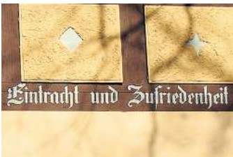
Was suchen wir?