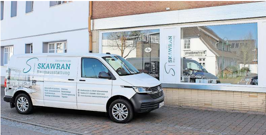
Skawran Raumausstattung gestaltet die Räume nach den Wünschen der Kunden.

SCHWARMSTEDT. 55 Jahre Handwerkskunst - Skawran Raumausstattung bietet Ihnen bereits jahrzehntelang individuelle Wohnkonzepte aus einer Hand. Inzwischen befindet sich das Schwarmstedter Familienunternehmen in dritter Generation. Ob stilvolles Wohnen, modernes Arbeiten oder behagliches Entspannen - Skawran Raumausstattung gestaltet Ihre Räume nach Ihren Wünschen. Als erfahrene Raumausstattermeister bringen wir Kreativität, Qualität und Liebe zum Detail zusammen. Ob stilvolle Bodenbeläge, maßgeschneiderte Vorhänge und Gardinen, moderne Möbel und hochwertige Polsterarbeiten oder exklusive Wandgestaltungen - wir helfen Ihnen dabei, das perfekte Ambiente für Ihr Zuhause oder Ihr Büro zu schaffen. Wir, als erfahrene Raumausstattermeister beraten Sie individuell und professionell, von der Planung bis zur Umsetzung. Böden - Die Basis für Stil und Komfort Ein