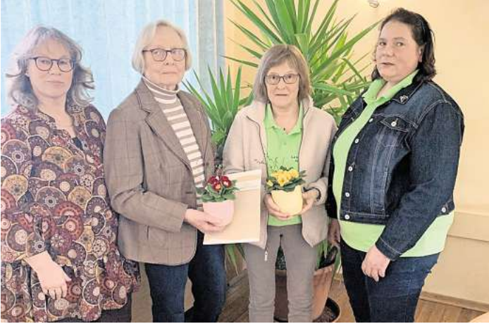
Ehrung bei den Landfrauen Wedemark