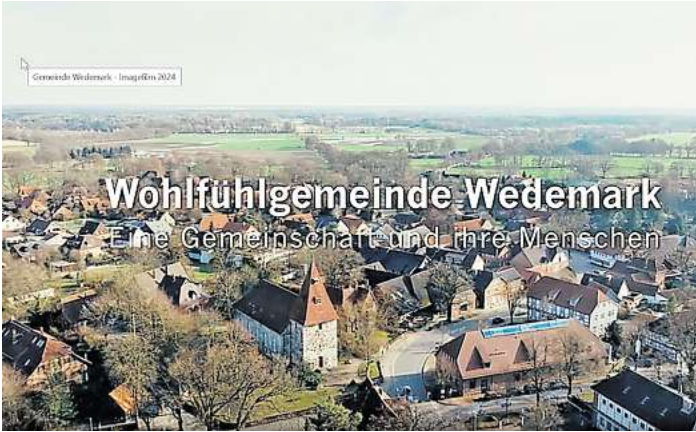
Blick auf Bissendorf: Im Imagefilm zeigt die Wedemark ihre schönsten Seiten.

8:15 Minuten umfasst der Film. Er zeigt Menschen, die farb-stark in Zeitlupe durch Wald und Felder spazieren, zur Arbeit gehen, Kultur genießen oder selbst gestalten. Die Botschaft: Die Gemeinde hat reichlich Pfunde, mit denen sie wuchern kann. Zu sehen sind ein Familienunternehmen, das kurz zuvor eine Halle in Gailhof errichtet hat, eine Schülerin des Gymnasiums, ein junger Feuerwehrmann, eine Auszubildende bei Sennheiser, dazu Fachwerkhäuser, Schützenumzüge, Hügel und Seen. Waldkindergarten und Seniorenheim haben die Macher nicht vergessen, und