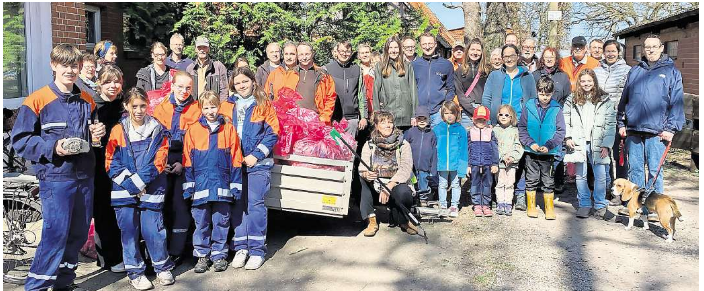
Viele fleißige Helfer sammelten am vergangenen Sonnabend Müll in Gailhof.

gutschein vom Ortsrat. Abgerundet wurde die Aktion mit einem gemeinsamen Mittagessen im Dorfgemeinschaftshaus, wo sich bei einem Teller Erbsensuppe anschließend gestärkt wurde.