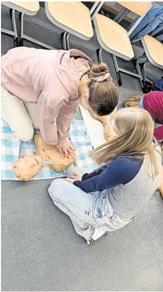
„Prüfen, Drücken, Retten“ heißt das Motto des Laienreanimationskurses.

Besondere Unterstützung erfährt das Projekt durch die Zusammenarbeit mit Doc Caro,