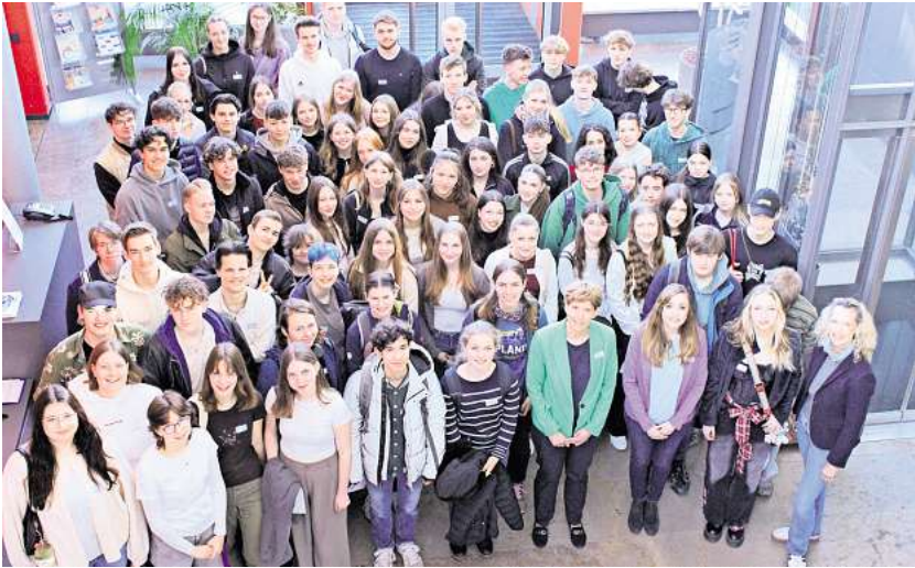
Das Gymnasium Mellendorf legt auf eine fundierte Berufsorientierung Wert.

Berufsinformationstag am Gymnasium Mellendorf