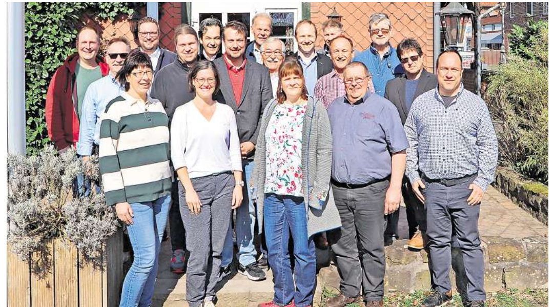
Barrierefreiheit, Zusammenhalt und Umwelt: Das waren die Themen beim 22. Bürgermeisterfrühstück.