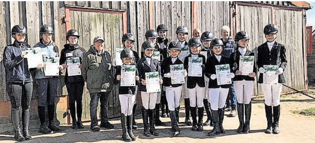
Beim RFV Berkhof wurden zahlreiche Reitabzeichen verliehen.