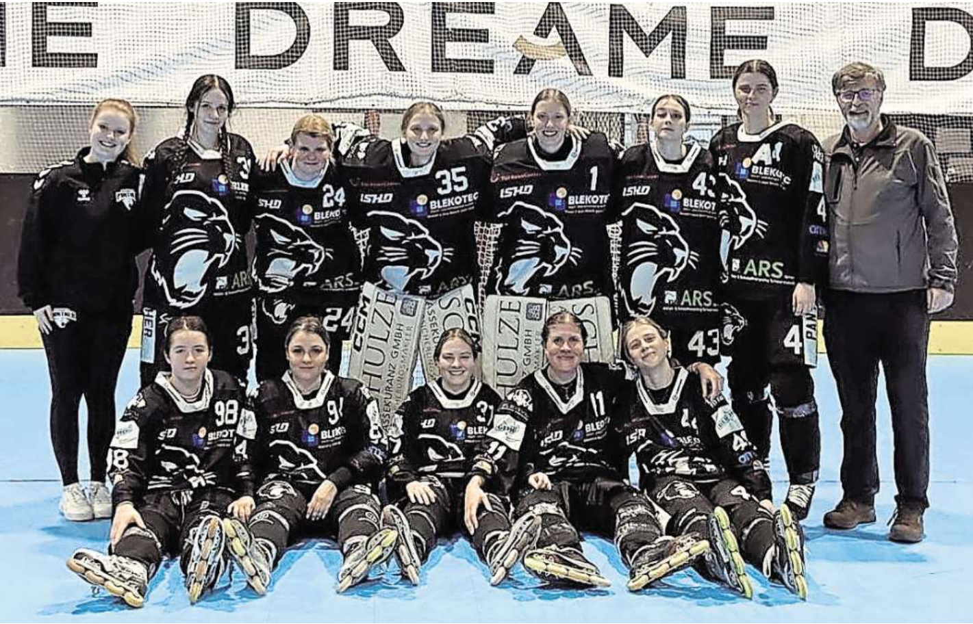
Die Pink Panther siegten mit 5:0.

Teams der Bissendorfer Panther im Einsatz