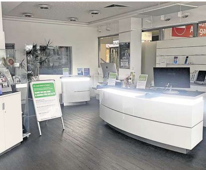
Wird am Gründonnerstag, 17. April ins Internet verlegt: Die gemeinsame Geschäftsstelle von ECHO, HAZ und NP im CCL.

Gemeinsam mit den Kolleginnen und Kollegen der Hannoverschen Allgemeinen Zeitung und der Neuen Presse, mit denen wir