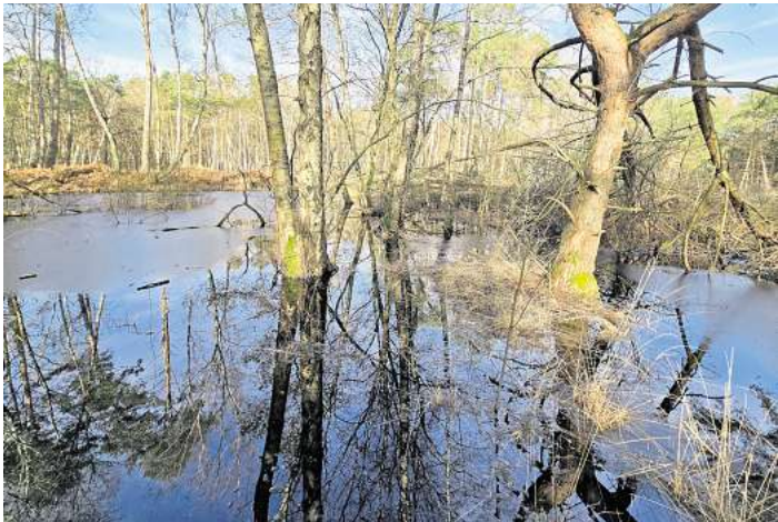
Auf dem Moorerlebnispfad in Resse hat sich einiges verändert.

RESSE. Der NABU Wedemark weist auf die für dieses Jahr erste Führung über den Moorerlebnispfad in Resse am Sonntag, 13. April, um 10.30 Uhr hin. Durch die Renaturierungsmaßnahmen im Otternhagener Moor hat sich auf dem Moorerlebnispfad in Resse einiges verändert. Über den deutlich gestiegenen Wasserstand, über den neuen Steg auf dem großen Rundweg, über Torfmoosum-