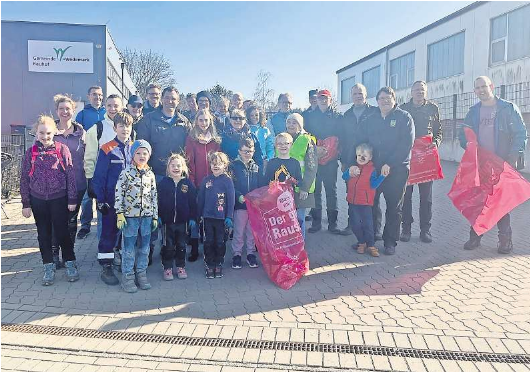
Nach gut zwei Stunden war die Aktion beendet.

war nach gut zwei Stunden alles wieder sauber und Groß und Klein traf sich zum Ausklang bei Suppe, Getränk und Klönschnack vor dem Feuerwehrgerätehaus.