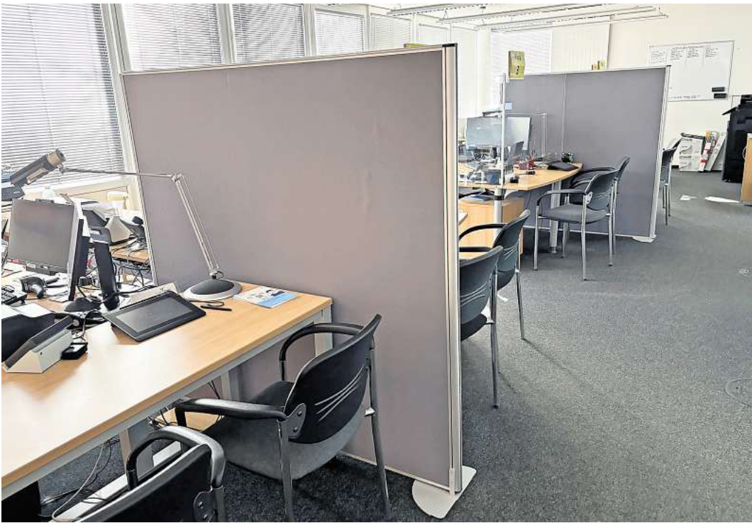
Das Bürgerbüro im Rathaus in Mellendorf vor dem Umbau.

Mit der geplanten Umstrukturierung wird das Bürgerbüro funktionaler und kundenfreundlicher gestaltet. Neben einer verbesserten Raumaufteilung mit klar getrennten Arbeits- und Aufenthaltszonen wird auch die Beleuchtung optimiert. Durch Still-