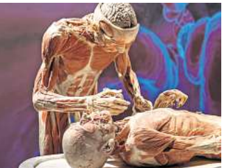
Ein Herzchirurg bei der OP.