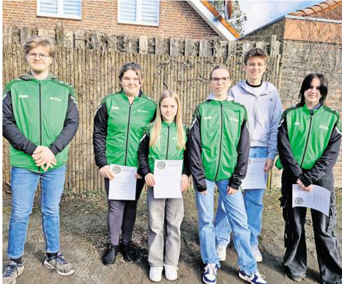
Die erfolgreichen Schützen...

Es folgte die Kreismeisterschaft der kleinen Schützen im Alter von sieben bis zwölf Jahren, die mit dem Lichtpunktge-