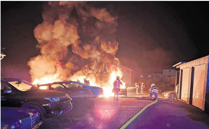
Die Autos schlugen schon fast auf das angrenzenden Gebäude über.

BISSENDORF/WENNEBOS-TEL. Am Montagmorgen gegen 1.17 Uhr wurden die Feuerwehren Bissendorf und Wennebostel zu einem Auto-Brand in das Gewerbegebiet alarmiert. Bereits auf der Anfahrt wurde gemeldet, das es sich um mehrere Wagen handelte. Beim Eintreffen brannten sieben Autos lichterloh, und die Flammen schlugen bereits auf ein angrenzendes Gebäude über. Die Feuerwehr begann sofort mit den Löschmaßnahmen, und ließ die Alarmstufe auf Brand2 erhöhen, somit wurde die Ortsfeuerwehr Mellendorf nachalarmiert. Im weiteren Verlauf wurde das Gebäude durch Atemschutzgeräteträger betreten, um eventuell Flammenüberschlag zu bekämpfen. Hierfür wurde die Ortsfeuerwehr Brelingen mit weiteren Atemschutzgeräteträgern nachalarmiert. Mit Hilfe der