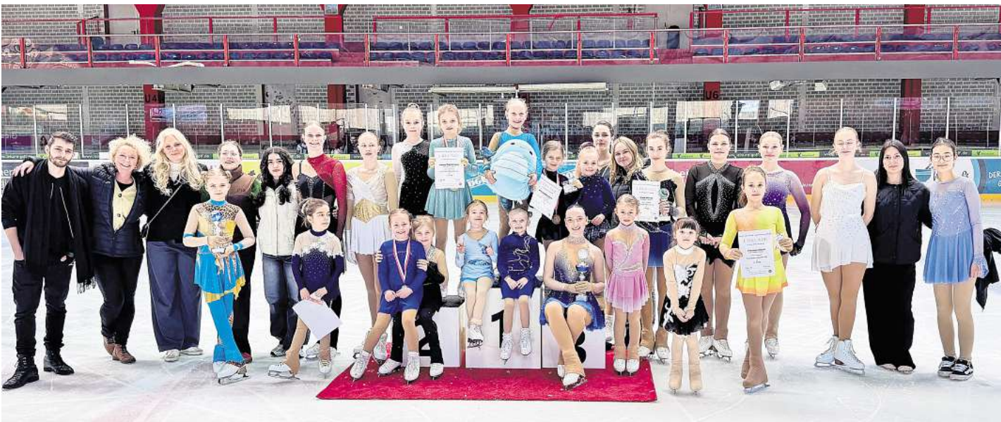
Mitglieder und Trainer der Eiskunstlaufsparte des ESC Wedemark Scorpions.

Der ESC Wedemark Scorpions bedankt sich bei allen Helferin-nen und Helfern, die die Durch-führung der Landesmeister-