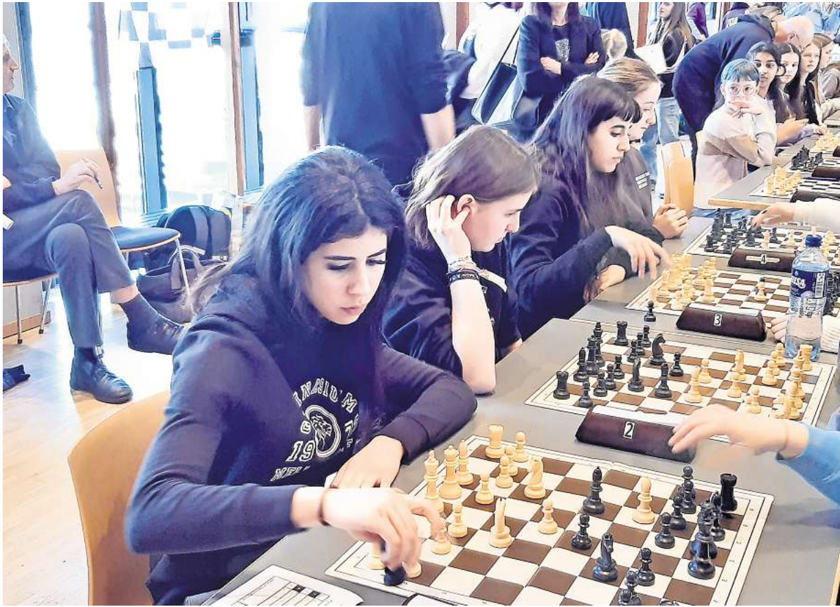
An den Tischen rauchten die Köpfe.