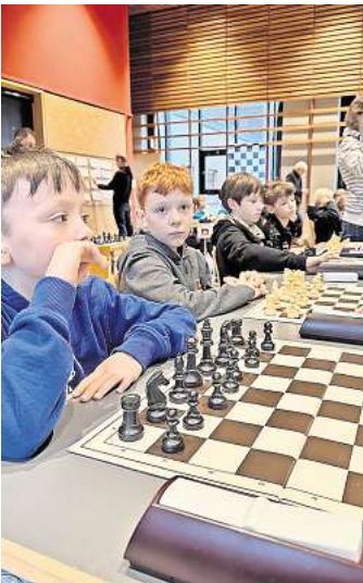
An den Schachbrettern liefen spannende Partien.

Bei den Niedersächsischen Schulschachmeisterschaften schaffte es ein Team der Grundschule Bissendorf bis in die Bezirksendrunde. An dem Turnier, das jetzt im Stadtteilzentrum Krokus in Bemerode ausgetragen wurde, nahmen 22 Mannschaften aus dem Bezirk Hannover teil. Die Bissendorfer erreichten dort einen respektablen elften Platz. Dabei spielten pro Team immer vier Kinder gleichzeitig gegen ein gegnerisches Team. Ein Sieg brachte Punkte für die Mannschaftswertung ein. Der nächste Gegner wurde mit dem so genannten Schweizer System ermittelt. Dadurch wird sichergestellt, dass immer gleich starke Gegner gegeneinander antreten. Eine Schach-AG an der Grundschule Bissendorf fördert die Begeisterung für das Schachspiel.