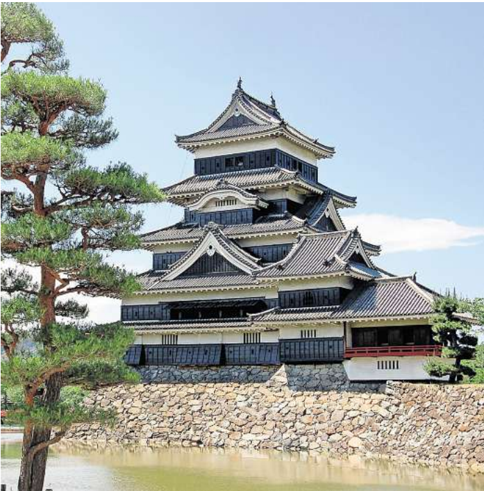
Zahlreiche Burgen legen Zeugnis ab von der fast 700 Jahre währenden Ära der Samurai.

kultureller Errungenschaften vom ostasiatischen Festland. Der Vortrag stellt die wichtigsten historischen Etappen von dessen legendärer Entstehung bis an die Schwelle der Neuzeit vor und zeigt anhand von Quellentexten exemplarisch kulturelle Eigenheiten auf, die Japan in den jeweiligen Epochen prägten. Die Teilnahmegebühr beträgt 12 Euro. Um Anmeldung wird unter www.vhs-langenhagen.de gebeten.