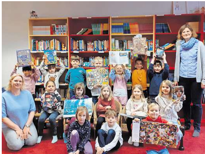
Die Freude an Büchern stand bei der Lesewoche im Vordergrund.

Abwechslungsreiches Programm an der Grundschule Mellendorf