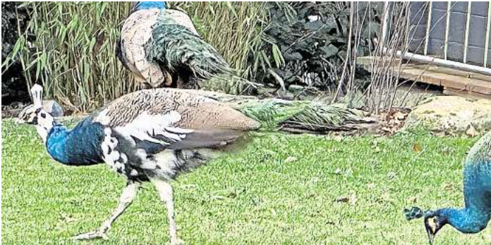
Pfauen Trio macht Resse unsicher: Mirjam Stünkel fotografierte die Tiere in ihrem Garten im Blumenviertel.

Almut Melcher aus Neustadt hält selbst Pfauen in Poppenhagen. Sie hatte bereits angeboten, die in Resse umherstreifenden