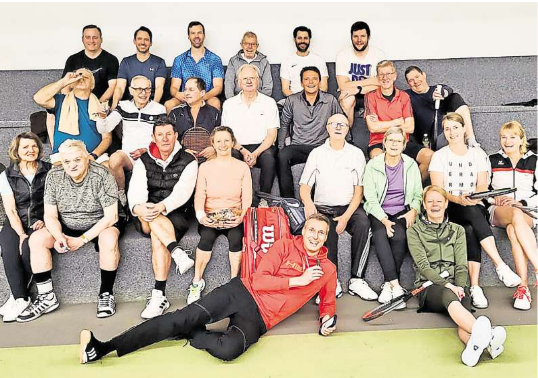
Die Mitglieder des TC Bissendorf haben die Zeit bis zum Beginn der Sommersaison mit dem Hallen-Fun-Turnier überbrückt.

nander an. Es wurde viel gelacht, gespielt und dieser sportliche Tag fand mit einem gemeinsamen Abend bei Currywurst und Schnitzel/Pommes frites einen gelungenen Abschluss.