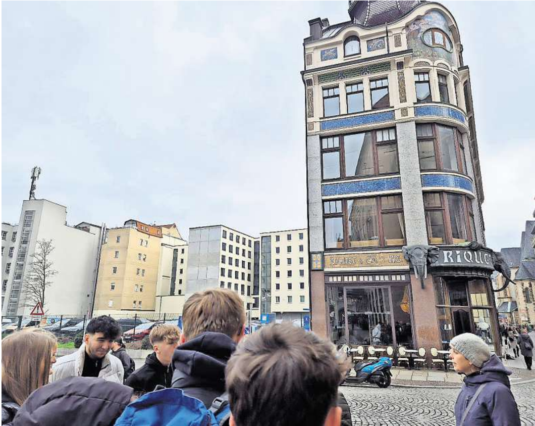
Die zehnte Klasse der IGS Wedemark hat sich zwei Tage lang in Sachsen umgesehen.