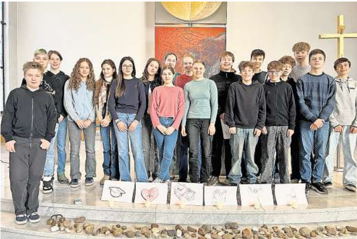
Die Religionsgruppe des achten Jahrgangs.