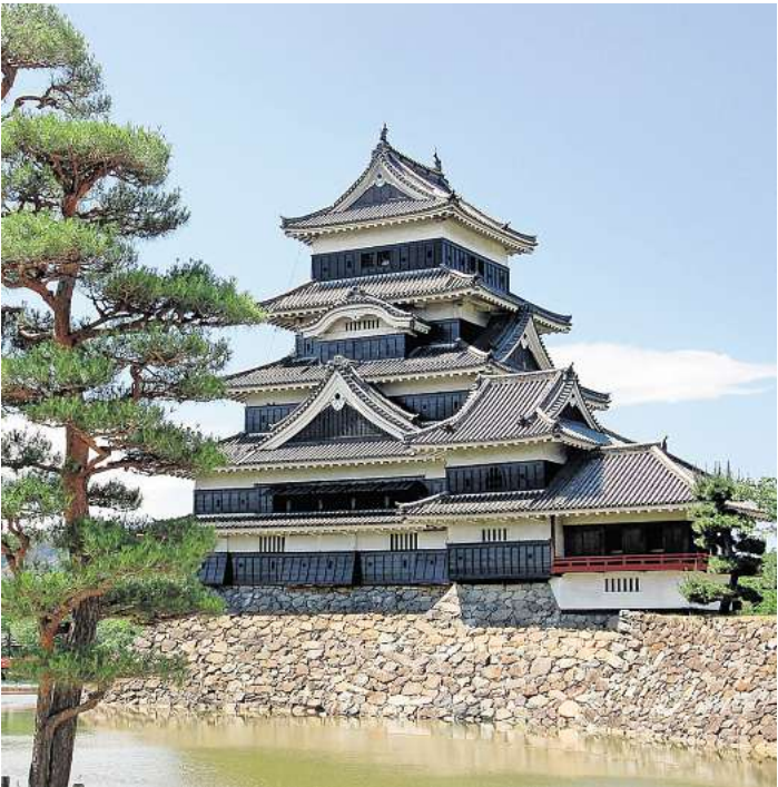
Zahlreiche Burgen legen Zeugnis ab von der fast 700 Jahre währenden Ära der Samurai.

kultureller Errungenschaften vom ostasiatischen Festland. Der Vortrag stellt die wichtigsten historischen Etappen von dessen legendärer Entstehung bis an die Schwelle der Neuzeit vor und zeigt anhand von Quellentexten exemplarisch kulturelle Eigenheiten auf, die Japan in den jeweiligen Epochen prägten. Die Teilnahmegebühr beträgt 12 Euro. Um Anmeldung wird unter www.vhs-langenhagen.de gebeten.