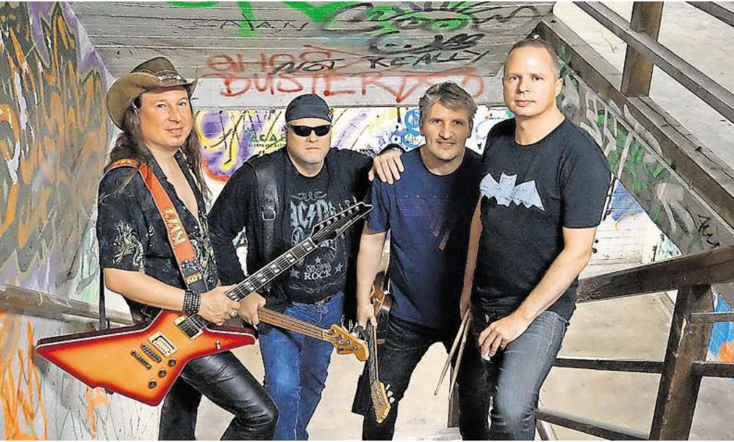
Hard'n Blue liefern erstklassige Classic Rock-Coverversionen. Absolut partytauglich!