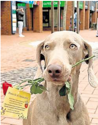
Auch die Hunde werben eifrig.