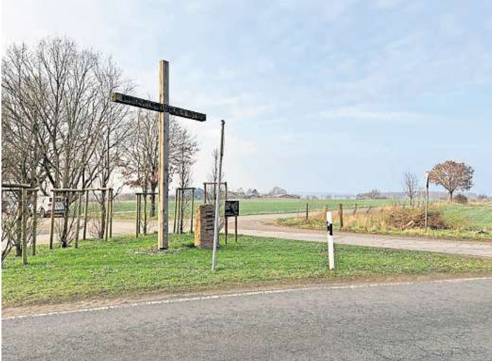
Das Grundstück, auf dem das neue Feuerwehrhaus gebaut werden soll, liegt nahe dem "Kreuz des deutschen Ostens"

MELLENDORF (GÖT). Der alte Standort in der Ortsmitte wird für die Feuerwehr Mellendorf auf die Dauer zu eng. Ein neues Gerätehaus soll her – aber wo soll es stehen? Nach langer Suche nach einem geeigneten Standort sind Verwaltung, Politik und Feuerwehr jetzt fündig geworden: Ein Brachgrundstück am westlichen Ortsrand soll es werden. Das Grundstück liegt nahe der Hermann-Löns-Straße und dem dortigen Neubaugebiet gegenüber – zwischen dem „Kreuz des deutschen Ostens“ und der Biogasanlage am Salhop. Ganz einfach sei die Grundstückssuche in dem beliebten und teilweise dicht besiedelten zentralen Orts- teil nicht gewesen, berichtet Je-an-Pascale Schramke (SPD), der Vorsitzende des Feuerschutz-Ausschusses. Bei der Jahresdienstversam- lung seiner Feuerwehr wies Orts- brandmeister Cord Hanebuth vor allem auf die Vorteile des Stand- orts hin. Allem voran gibt es dort reichlich Platz für ein neues Ge- rätehaus und zugehörige Alarm-