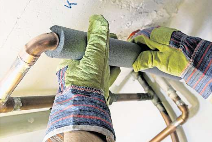
Die Rohrisolierung kann den Energieverbrauch der Heizung deutlich reduzieren.

Zugluft an den Türfugen lässt sich mit Dichtungen aus Gummi