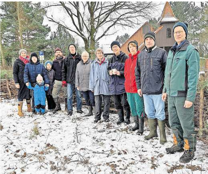
Zahlreiche engagierte Bürgerinnen und Bürger hatten sich zur Aktion eingefunden.

Das locker gelagerte Totholz bietet Lebensraum für zahlreiche Lebewesen, darunter Vögel, Insekten, Kleinsäuger und Reptilien. Die Tiere finden in der Hecke Schutz und Nahrung. Zudem ermöglicht der Samenanflug auf dem sich langsam zersetzenden Totholz die Ansiedlung neuer Pflanzen, die die Hecke weiter stabilisieren und zur Artenvielfalt beitragen.