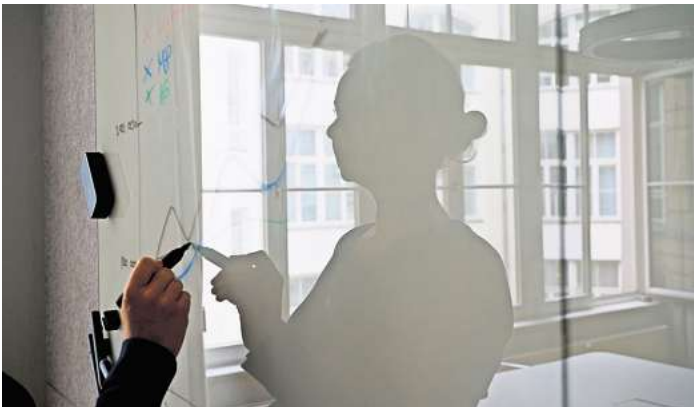
Zusätzliche Vorsorge: 2025 ist per Entgeltumwandlung mehr privater Aufbau der Altersvorsorge möglich.

Und: In der Regel steuert der Arbeitgeber selbst 15 Prozent zum Vorsorgebeitrag hinzu. Dazu ist er gesetzlich verpflichtet, wenn er durch die Entgeltumwandlung Sozialversicherungsbeiträge einspart und das Geld in einen Pensionsfonds, eine Pensionskasse oder eine Direktversicherung fließt. Manche Arbeitgeber zahlen freiwillig mehr als vorgegeben – ein Blick in den Arbeits- oder Tarifvertrag bringt Aufschluss.