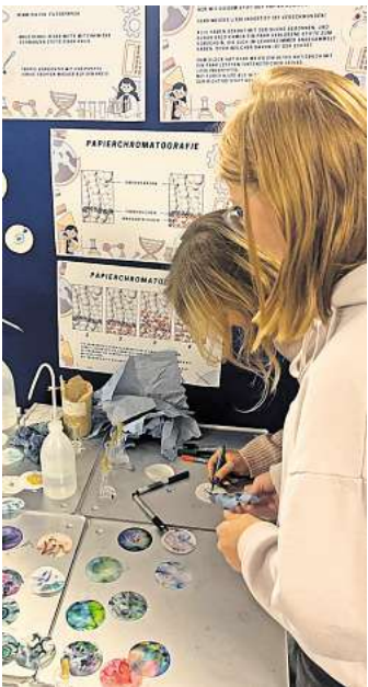
Die IGS Wedemark präsentiert ihr vielfältiges Programm.