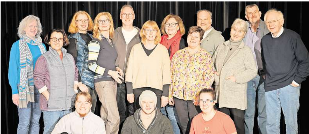
Die Theatergruppe Wedemark freut sich auf viele Besucherinnen und Besucher bei den drei Aufführungen.