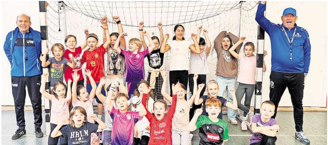
Die Kinder hatten beim Fußball viel Spaß miteinander.

sioneller Anleitung verschiedene Geschicklichkeitsübungen mit dem Fußball und kleine Übungsspiele absolviert. Die ganze Gruppe war dabei richtig motiviert.