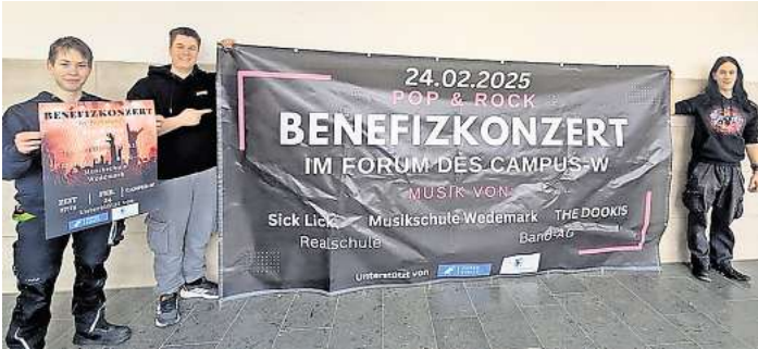
Nachhaltige Projekte stehen beim Benefizkonzert im Fokus.

Band-AG „Irgendwie geht's schon“, die Newcomer-Band „Sick Lick“ aus Hannover und „The Dookies“ aus Langenhagen. Vier Mitglieder der Schülerfirma „Rebalance“ haben das Konzert geplant und organisiert. Die Spenden des Abends werden für nachhaltige und zukünftige Projekte der Schülerfirma verwendet.