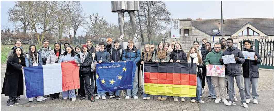
Das Gymnasium Mellendorf hat die deutsch-französische Freundschaft vertieft.