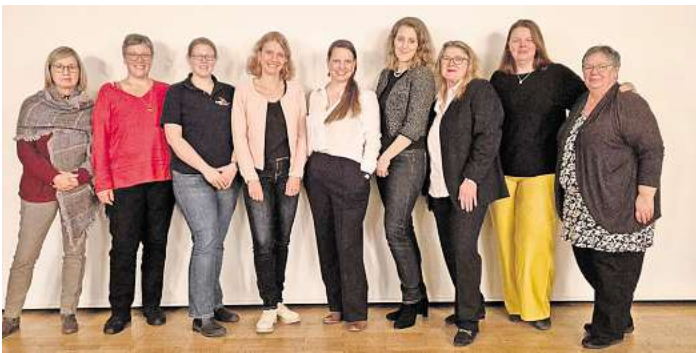
Vorstandswahlen standen auch auf der Tagesordnung der Landfrauen Mandelsloh.

Im Rahmen der Versammlung wurde auch das Programm für das Jahr 2025 vorgestellt. Die Landfrauen Mandelsloh haben ein abwechslungsreiches und spannendes Jahresprogramm zusammengestellt, das für jeden Geschmack etwas bietet. Unser Programm gibt es online auf der Website der Landfrauen Mandelsloh: https://wp.landfrauen-mandelsloh.de/neues-programm-2025/