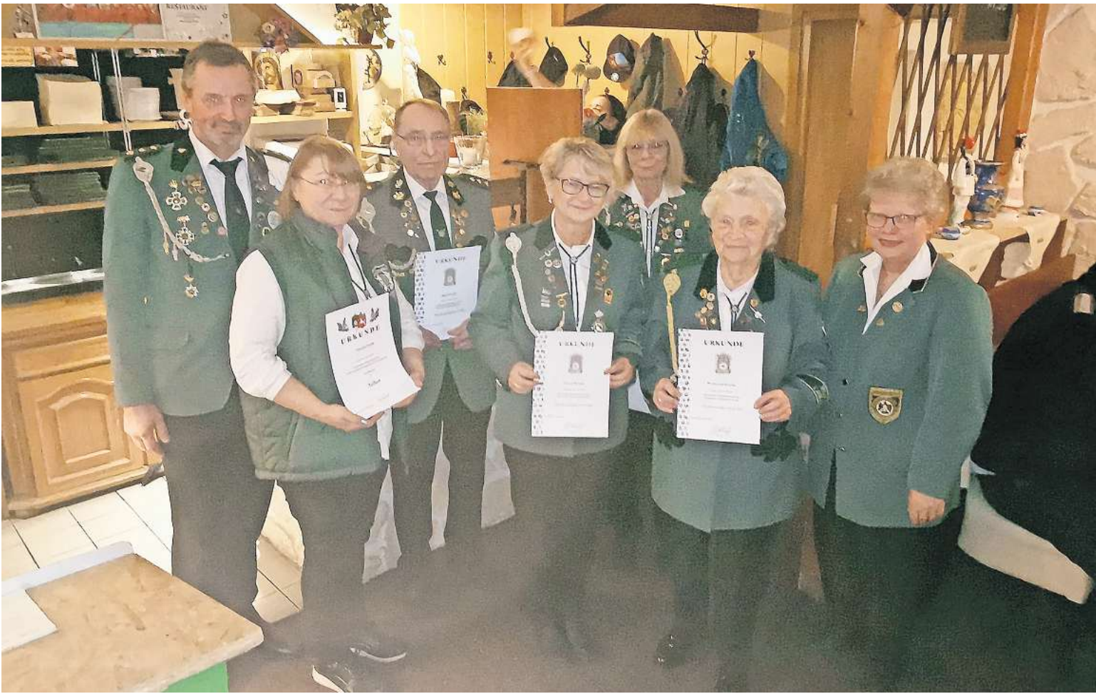
Der Schützenverein Resse ehrte auf seiner Jahreshauptversammlung langjährige Mitglieder.