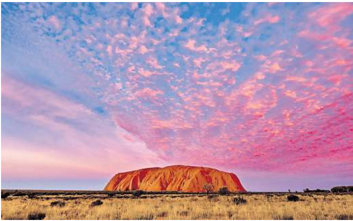
Australien ist ein faszinierendes Reiseziel.

Doch es sind nicht nur die Bilder, die fesseln. Aneta und Dirk teilen mit viel Humor und Fachkenntnis ihre Erlebnisse. Von Geländewagen über Flugzeuge bis hin zu Wanderungen - sie nehmen mit auf eine Reise voller Insider-Tipps und faszinierender Geschichten. Gekrönt wird dieses außergewöhnliche Erlebnis durch brillante Fotografie, die