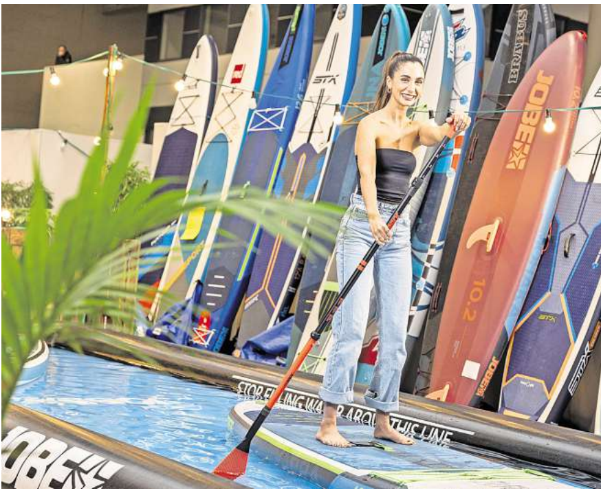
Standup-Paddeling ist auch 2025 einer der Trends beim Wassersport.

Die Themenwelt Reisen & Urlaub der ABF steht 2025 ganz im Zeichen Kanadas. Gemeinsam mit den Urlaubs-Profis von „America Unlimited“ präsentiert sich das Land in Halle 19 in seiner vollen Schönheit. Unter anderem stellen sich die Regionen Yukon, Manitoba, Saskatchewan, Nova Scotia und Ontario vor, außerdem kann man sich über unvergessliche Reiseerlebnisse mit dem Rocky Mountaineer und Air Canada informieren. Aber auch andere Urlaubsziele lassen sich auf der ABF direkt vor Ort buchen. Zum Beispiel auf der Fläche der „Nordischen Länder“. Hier erfährt man Wissenswertes über Skandinavien und das Baltikum. Nicht vergessen: Die Sonderfläche „Harz erleben“, mit VR-Abenteuer-