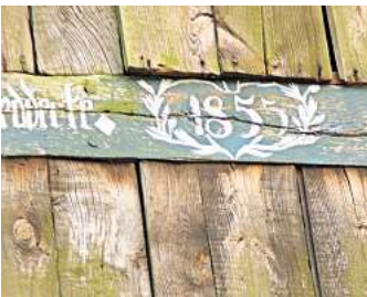
Was suchen wir in diesem Monat?

Dieses Merkmal ist von der Straße aus zu erkennen, sodass das jeweilige Grundstück nicht betreten werden muss. Das Suchbild hängt auch im Schaukasten des Vereins Dorfbild Elze, Wasserwerkstraße 21/21a. Die richtige Lösung kann bis zum Monatsende per E-Mail an etheil-mann@dorfbild-elze.de geschickt oder in den Briefkasten an der Wasserwerkstraße 21a oder 23 eingeworfen werden. Die Gewinnerin oder der Gewinner werden unter allen Einsendern durch Los bestimmt und bekommen einen kleinen Preis (Naturalien aus Elze). Die schwer zu lesende Inschrift lautet D. Belsmei-