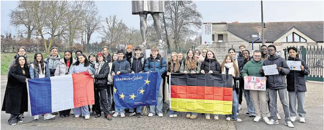
Das Gymnasium Mellendorf hat die deutsch-französische Freundschaft vertieft.