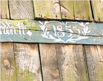
Was suchen wir in diesem Monat?

Dieses Merkmal ist von der Straße aus zu erkennen, sodass das jeweilige Grundstück nicht betreten werden muss. Das Suchbild hängt auch im Schaukasten des Vereins Dorfbild Elze, Wasserwerkstraße 21/21a. Die richtige Lösung kann bis zum Monatsende per E-Mail an etheil-mann@dorfbild-elze.de geschickt oder in den Briefkasten an der Wasserwerkstraße 21a oder 23 eingeworfen werden. Die Gewinnerin oder der Gewinner werden unter allen Einsendern durch Los bestimmt und bekommen einen kleinen Preis (Naturalien aus Elze). Die schwer zu lesende Inschrift lautet D. Belsmei-