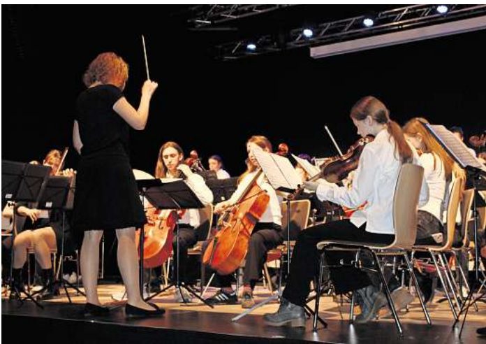
Die Musiker zeigten eine große Bandbreite.