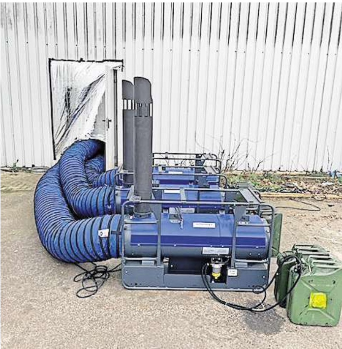
THW-Gerätschaften der technischen Hilfeleistung für die Transdev.

versorgung und Notinstandsetzung aus Wunstorf mit weiteren Heizlüftern. In der Nacht vom 18. zum 19. Januar waren 20 ehrenamtliche THW-Helferinnen und Helfer damit beschäftigt, die Beheizung der Halle sicherzustellen. Nach einer technisch bedingten Unterbrechung wurde der Einsatz von Heizlüftern und