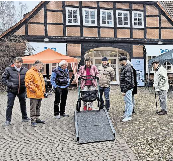
Intelligente Rollatoren, die Steigungen mit E-Motor-Unterstützung meistern und bei Gefälle eigenständig bremsen, konnten genauso ausprobiert werden, wie E-Scooter und E-Rollstühle.

gierten Mitarbeiterinnen und Mitarbeiter sorgten an diesem Tag auch für das leibliche Wohl der Besucherinnen und Besucher und verwöhnten sie trotz kalter Witterung mit frisch gebackenen Waffeln oder einer Bratwurst vom Grill. Wer die Hausmesse verpasst hat, kann sich über die technischen Innovationen rund um alle die neuen Hilfsmittel auch während der Geschäftszeiten informieren. Das Sanitätshaus an der Wedemarkstraße 79a hat montags bis freitags von 9 bis 13 Uhr und montags, dienstags, donnerstags und freitags von 14 bis 18 Uhr sowie samstags nach Vereinbarung geöffnet. Telefonisch zu erreichen ist es unter der Nummer (05130) 60 90 464.