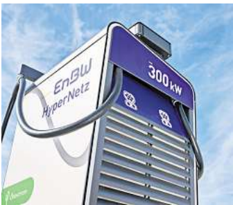
Schnellladen im EnBW HyperNetz jetzt auch in Wedemark.

„Unser engmaschiges Schnellladernetz ermöglicht es Fahrern ihr E-Auto dort zu laden, wo es schnell weitergehen soll oder wo das