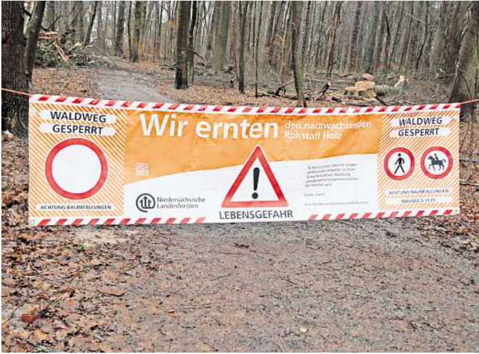
Das Forstamt Fuhrberg appelliert an alle Waldbesucher, die Sperrungen zu beachten, um sich nicht in Gefahr zu bringen.