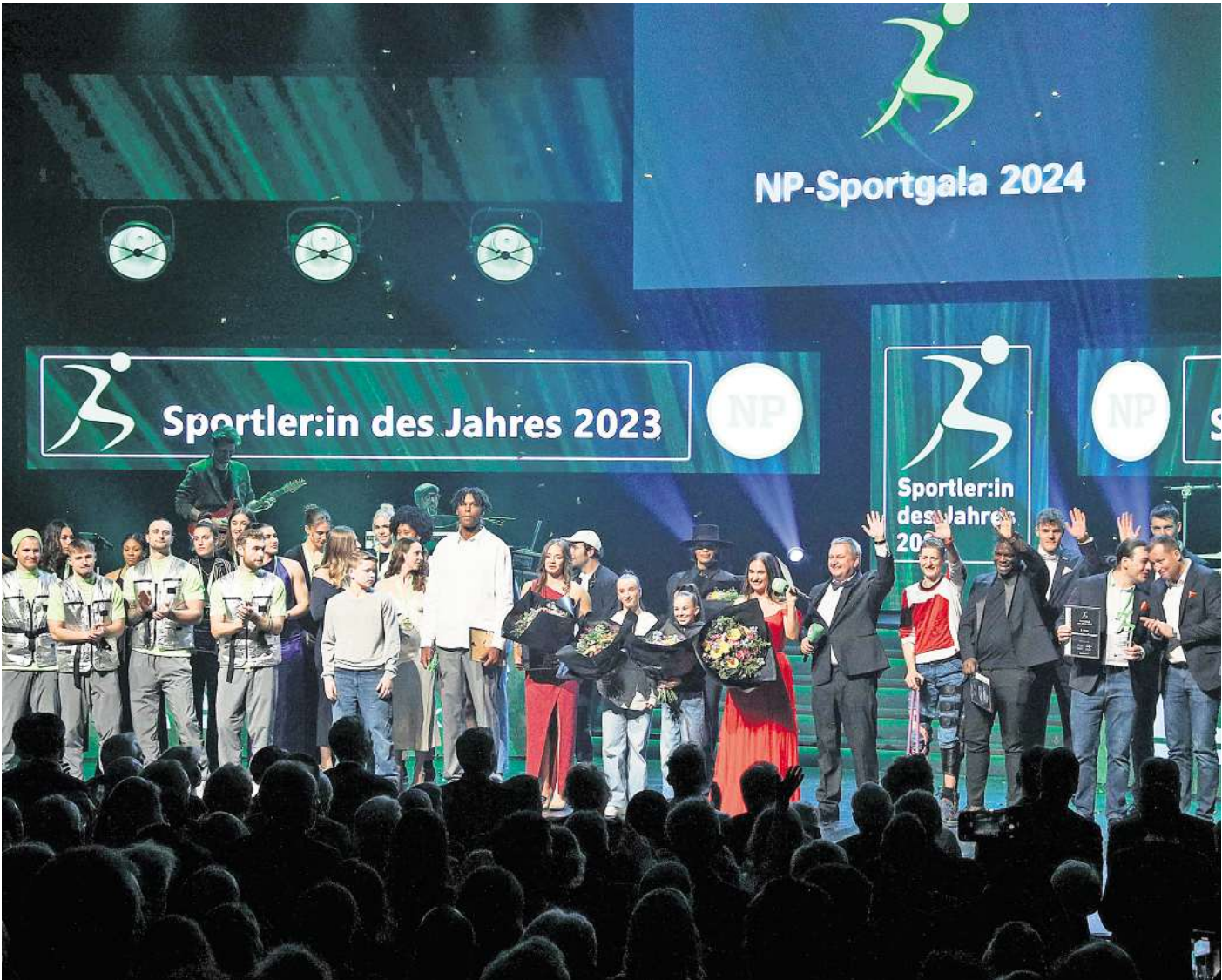
Nächste Woche haben wir ein Jubiläum: Am 28. Januar feiern wir die 30. NP-Sportgala.