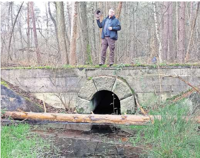
Das Brückenbauwerk für den Todtbruchgraben ist noch vollständig erhalten.