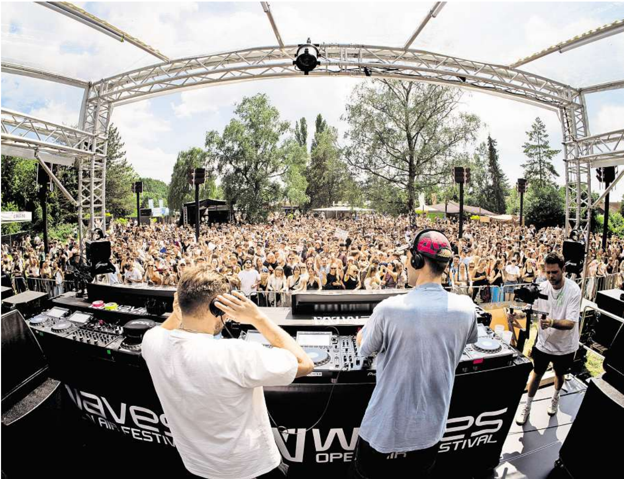
Feiern mit den DJs: Blick von der Bühne des Waves-Festivals 2024.

Zwölf Stunden lang läuft das Programm, von 12 Uhr mittags bis Mitternacht gibt es reichlich Ablenkung vom schnöden Alltag: Zur Musik laufen bunte Lichtanimationen, die Bühnen werden ebenso farbenreich gestaltet, dazu gibt es interaktive Dekoration, Feuershows, Kleinkunst und Walking Acts.