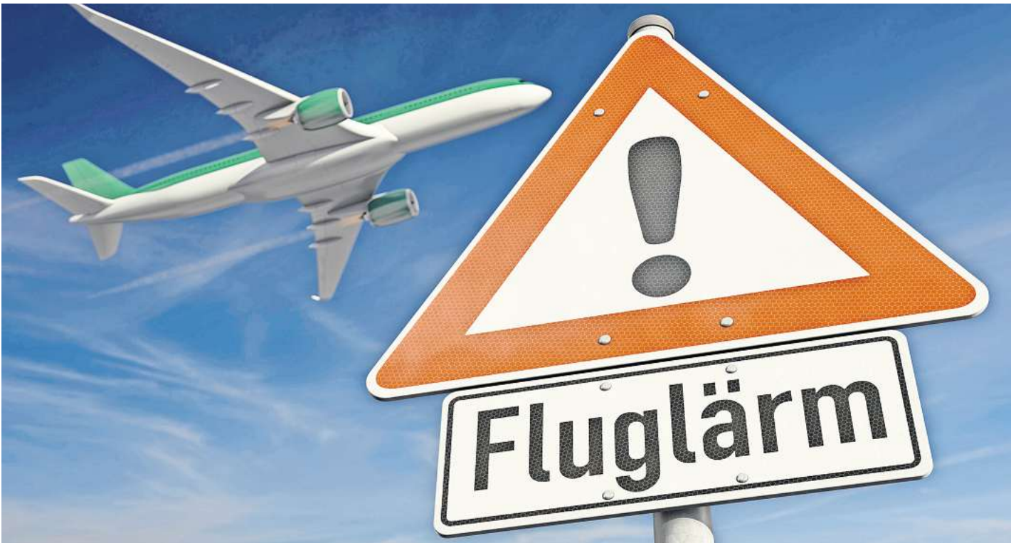
Viel Fluglärm im Sommer 2024 in Hannover: Wegen Bauarbeiten wurden in den Hauptflugzeiten des vergangenen Jahres extremer Lärm gemessen. Doch der betraf Garbsen viel stärker als Langenhagen.

Doch obwohl der Abstand der Messstationen in Langenhagen ähnlich zum Flughafen ist wie der in Garbsen, blieben die Werte in Langenhagen im Sommer 2024 im grünen Bereich. Es gab nur einen Fall, an dem der Lärmpegel