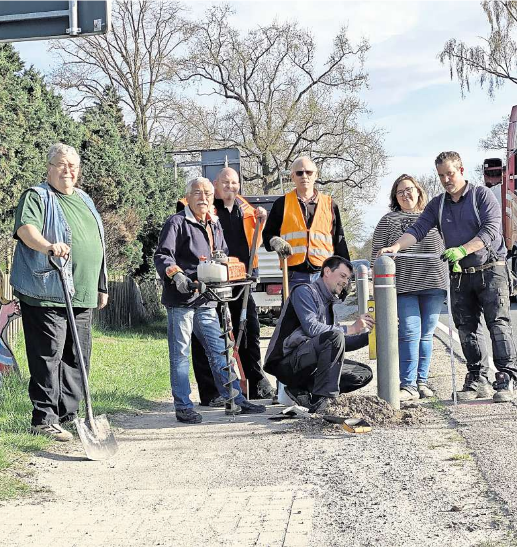
Beispiel für Bürgerengagement vor Ort: Der Ortsrat Wedemark III setzt im April 2022 Pfähle, um den Fuß- und Radweg in Berkhof sicherer zu machen.

In elf Ortsräten leisten Ehrenamtliche wichtige politische Arbeit