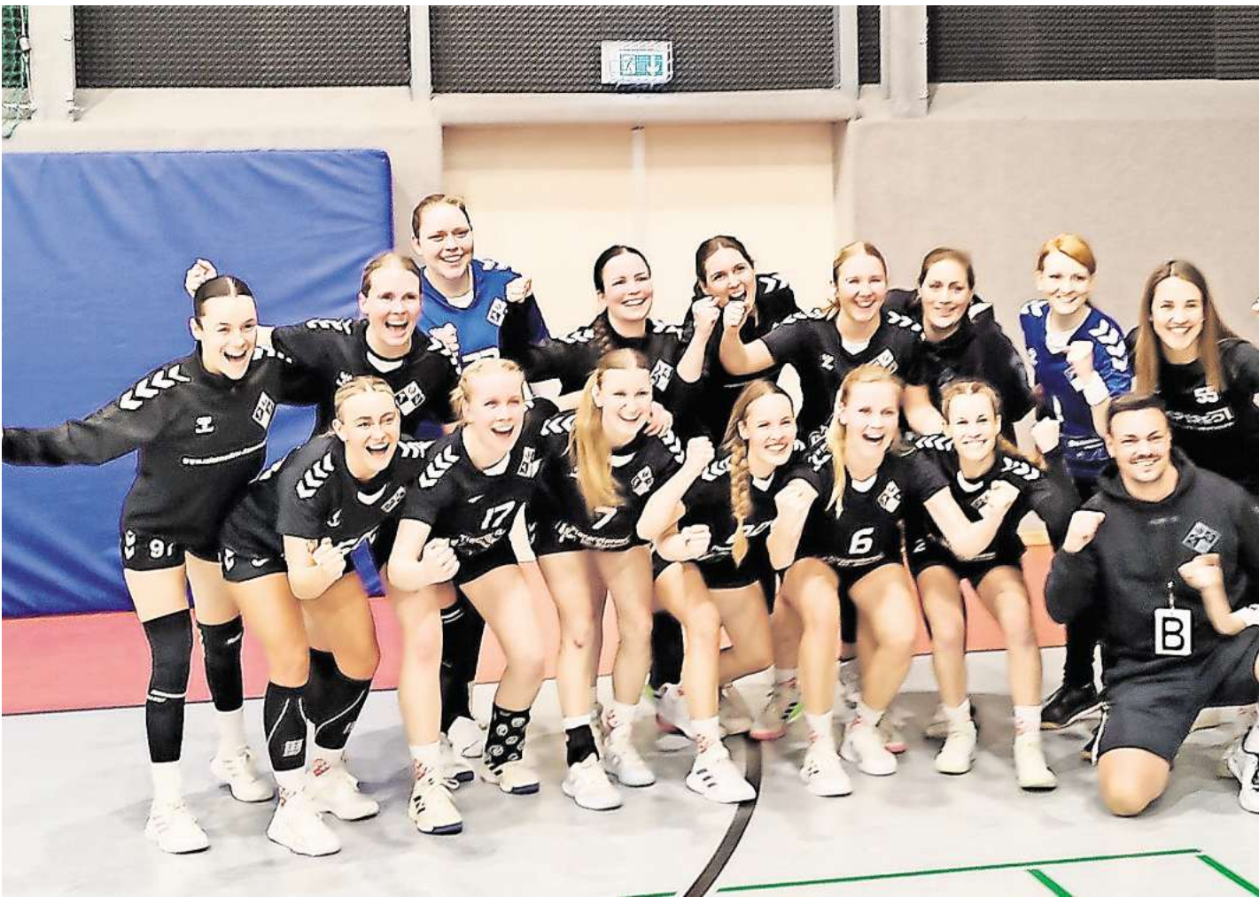
Die siegreiche Mannschaft nach dem Spiel.

MELLENDORF (R/BS). Die Zuschauer standen und zählten die letzten 10 Sekunden herunter. Der letzte Freiwurf wurde nicht mehr ausgeführt, die Spielerinnen des Mellendorfer TVs fielen sich in die Arme und hüpften vor Freude im Kreis. Soeben hatten die 1. Damen des MTVs in der Handball-Oberliga Süd einen, vor allem in der Höhe nicht zu erwartenden 33:25-Sieg gegen die HSG Plesse-Hardenberg eingefahren. Vor Beginn des letzten Hinrundenspiels war die Favoritenrolle klar verteilt. Plesse-Hardenberg stand auf dem 4. Tabellenplatz, wogegen der MTV nach dem vor Weihnachten errungenen ersten Oberligasieg den vorletzten Platz belegte. Doch die Zuschauer in der sehr gut gefüllten MTV-Halle sahen ein Spiel auf Augenhöhe. In der Anfangsphase wechselte die Führung ständig und es stand nach 15 Minuten 9:9. Danach konnten sich die Mellendorferinnen einen Zwei-Tore-Vorsprung erarbeiten, der trotz doppelter Unterzahl ab der 29. Minute bis zur Halbzeit hielt. So ging man mit einem 15:13 in die Pause. Nach der Pause erwarteten die Zuschauer nun, dass die Gegnerinnen in doppelter Überzahl schnell ausgleichen würden, doch die Mellendorferinnen kämpften und ihre Torhüterin konnte den nächsten Wurf abwehren, so dass der MTV sogar mit 16:13 in Führung ging. Wer nun erwartete, dass der