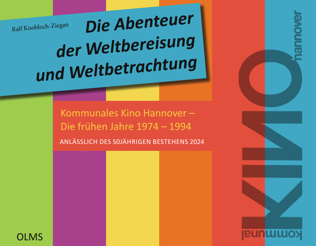
Das Buch ist im Kino im Künstlerhaus und im Buchhandel erhältlich.