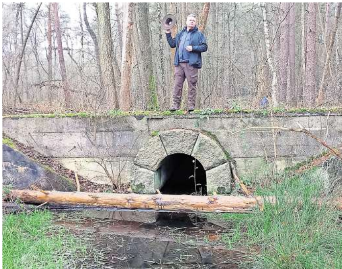
Das Brückenbauwerk für den Todtbruchgraben ist noch vollständig erhalten.