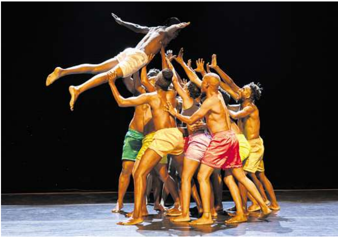
Szene aus VAGABUNDUS von Idio Chichava.

Engeladen sind diesmal fünf Bühnenproduktionen. Das Team um Festivalleiterin Melanie Zimmermann freut sich besonders,