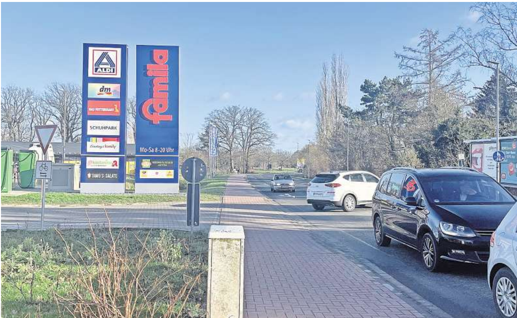
Fachmarktzentrum Mellendorf Verkehrssituation.