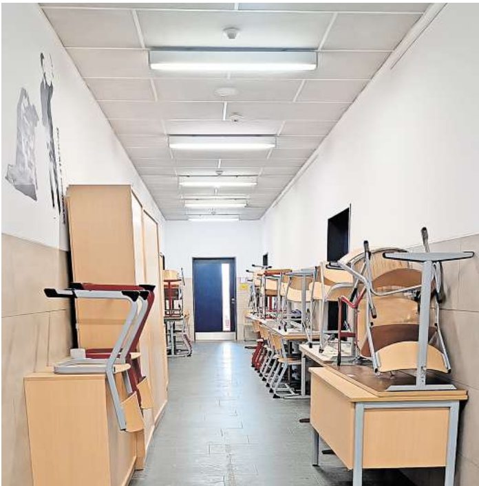
Engpass: Tische und Stühlen versperren im Gymnasium Mellendorf den Fluchtweg.

Schulleiterin Katrin Meinen widerspricht dieser Darstellung, es habe sehr wohl eine Alarmierung gegeben: „Das Schulgebäude unterteilt sich in mehrere Brandabschnitte. Es muss nicht überall Alarm gegeben werden, zumal der Brandschaden nur marginal war.“ Laut Feuerwehr war tatsächlich nur der betroffene Papierkorb beschädigt worden. Der Unterricht hatte schon nach kurzer Zeit wieder aufgenom-