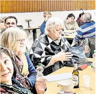
Das Tablequiz erfreute sich auch in diesem Jahr wieder großer Beliebtheit.

gen gesammelt, damit in 2026 wieder die Köpfe rauchen.