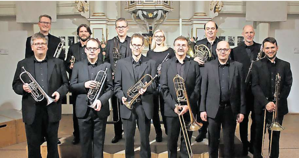
Das Norddeutsche Blechbläser Collegium ist zu Gast in Brelingen.

Sonntag, 26. Januar, 17 Uhr: Neujahrskonzert in St. Martini Brelingen