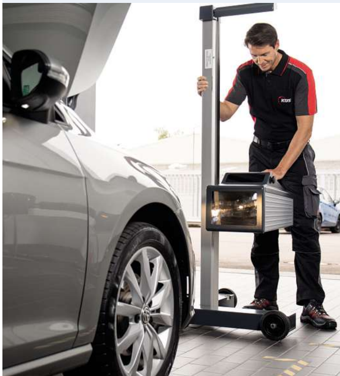
Die funktionierende Beleuchtung am Auto ist für alle Verkehrsteilnehmer lebenswichtig.

Warum der Umtausch notwendig ist: Bis 2023 sollen alle Führerscheine in der EU ein einheitliches und fälschungssicheres Scheckkartenformat besitzen. Wichtig: Der neue Führerschein hat eine Gültigkeit von 15 Jahren und muss danach erneuert werden. Ohne gültigen Führerschein droht ein Verwarngeld in Höhe von 10 Euro.