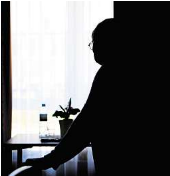
Im Tagesverlauf schwanken die Symptome eines Delirs und verschlimmern sich oft in den Abendstunden.

Fakt 2: Pflegebedürftige sind eine Risikogruppe Ältere pflegebedürftige Menschen sind besonders gefährdet, Delirien zu erleben. Auslöser ist laut ZQP in vielen Fällen eine Veränderung.