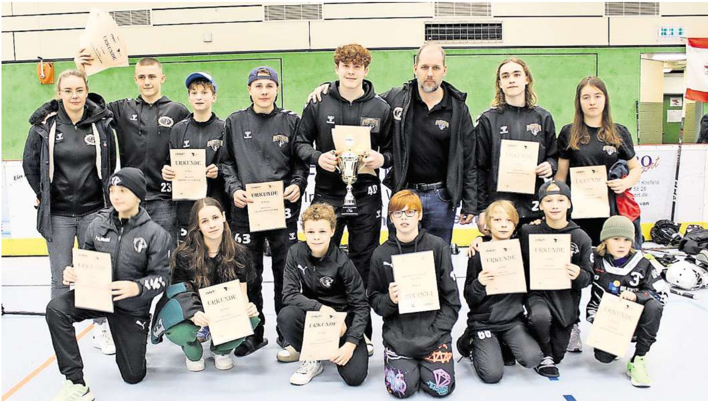
Die Bissendorfer Panther mussten sich mit dem undankbaren vierten Platz zufrieden geben.