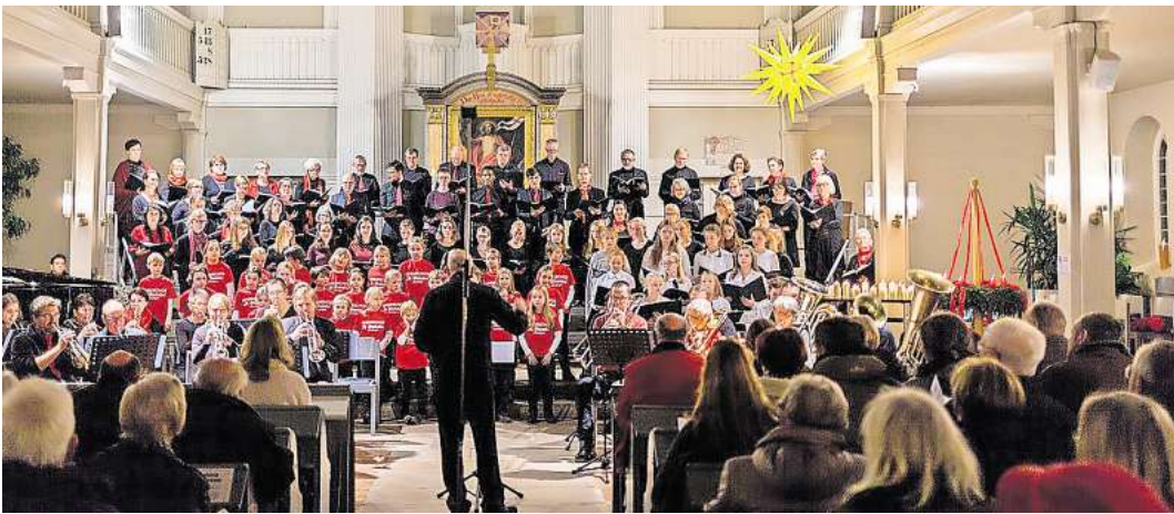
Die Chöre laden für den 3. Advent zum Weihnachtskonzert in Brelingen ein.

BRELINGEN. Einstimmen auf Weihnachten mit leiser wie festlicher Musik, mit bekannten und neuen Melodien – Innehalten im Weihnachtstrubel. Es singen die Jungen Chöre und der Chor St. Martini, es musizieren der Posaunenchor und die Orgel. Das Publikum ist eingeladen einige bekannte Weihnachtslieder mitzusingen. Im Anschluss ist Gelegenheit, die frisch erschienene Chronik der Brelinger Kirchen zu erwerben.