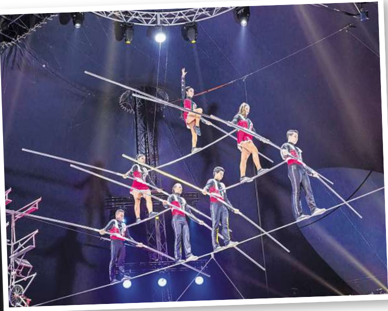
The Robles aus Kolumbien brauchen Nerven aus Drahtseilen.

nerinnen haben die gute alte – und schon fast vergessene – Kunst des Zopfhangs neu belebt. Da muss die Frisur sitzen. Ungewöhnlich und noch nie im Weihnachtscircus zu erleben, ist die Power-Show von Lift. Die vier Akrobatinnen und Akrobaten aus Frankreich und Kanada sind Spezialisten auf dem Fangstuhl.