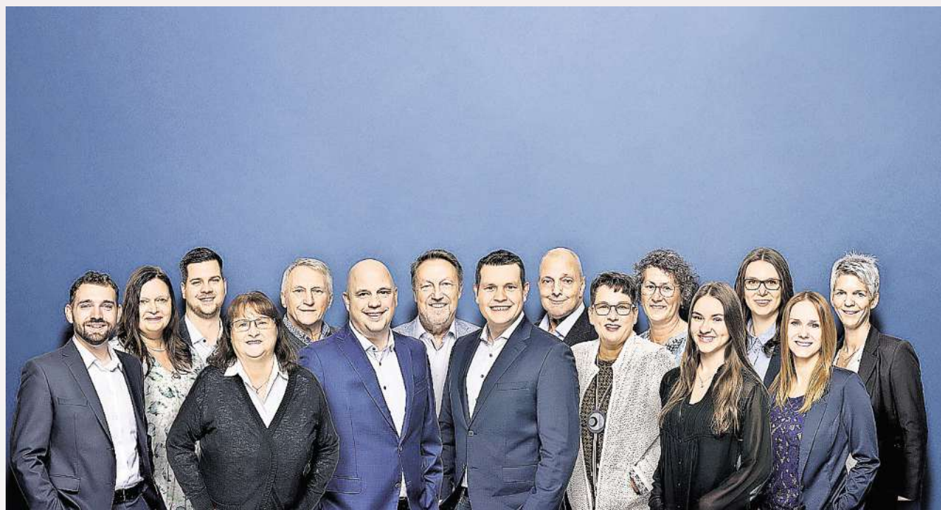
Mehr als 15 Mitarbeitende zählen jetzt zur Fechner & Schwolow OHG.

VGH-Versicherungsbüro unter neuer Führung