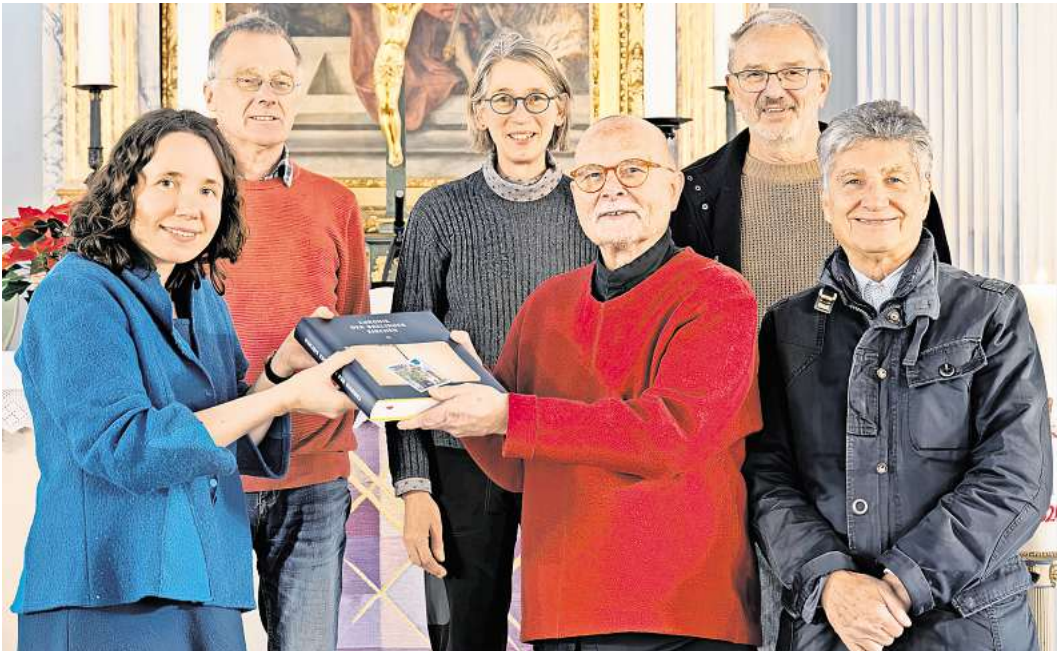
Das Projektteam stellt die Brelinger Kirchenchronik am 3. Adventssonntag vor.