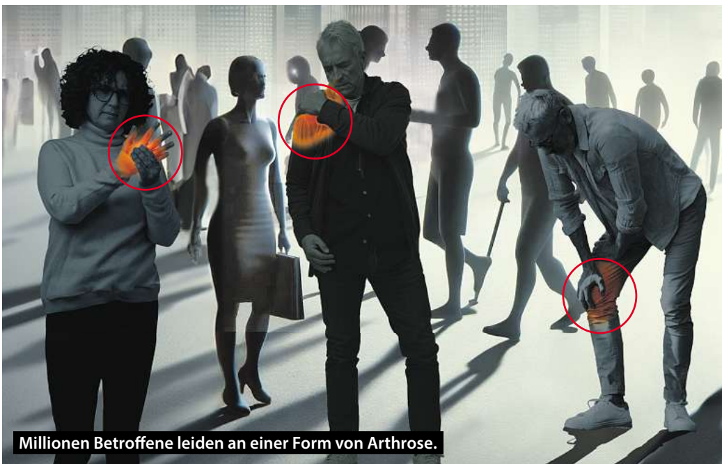
Millionen Betroffene leiden an einer Form von Arthrose.

Zunächst fällt es schwer, das Knie ganz durchzudrücken. Knack- und Reibegeräusche werden hörbar. Treppensteigen verursacht Schmerzen, die sich unter Belastung langsam steigern, aber auch plötzlich einschließen