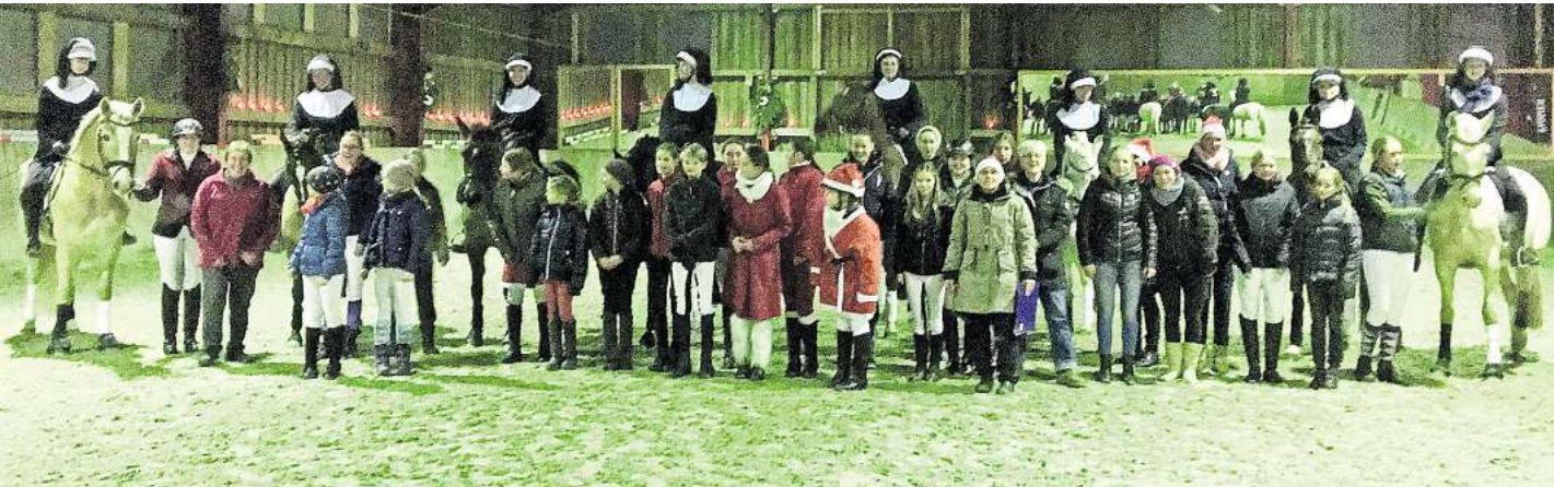
Das traditionelle Weihnachtsreiten geht am Sonnabend, 14. Dezember, in Berkhof über die Bühne.

Gäste, jeder ist herzlich willkommen einen weihnachtlichen Nachmittag auf dem Hof Bertram in der Reithalle in Berkhof zu verbringen. Infos zum Verein finden Interessierte unter www.rfv-berkhof.de .