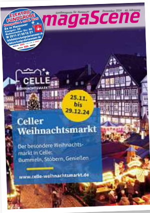
Stadtmagazin für Hannover magaScene

➤ Weitere Informationen und Tickets: www.weihnachtscircus-hannover.com