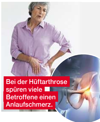
Bei der Hüftarthrose spüren viele Betroffene einen Anlaufschmerz.

Erste Anzeichen sind eingeschränkte Beweglichkeit und Schmerzen in der Leiste und im Gesäß. Mit fortschreitender Erkrankung beginnen die Betroffenen zu hinken, um das schmerzende Gelenk zu entlasten. Die Schmerzen machen einfache Handlungen wie das Binden von Schuhen zu einer Herausforderung.