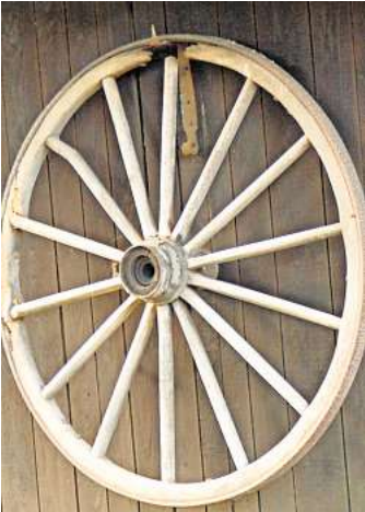
Was suchen wir dieses Mal?

ELZE. Damit alle in Zukunft mit noch offeneren Augen durchs Dorf laufen, veröffentlicht der Verein Dorfbild Elze jeden Monat ein Suchbild mit einem Detail eines Hauses oder einer Hofanlage. Dieses Merkmal ist von der Straße aus zu erkennen, sodass das jeweilige Grundstück nicht betreten werden muss. Das Suchbild hängt auch im Schaukasten des Vereins Dorfbild Elze, Wasserwerkstraße 21/21a. Die richtige Lösung kann bis zum Monatsende per E-Mail ehtheilmann@dorfbild-elze.de geschickt oder in den Briefkasten von Wasserwerkstraße 21a oder 23 eingeworfen werden. Der Gewinner oder die Gewinnerin wird unter allen Einsendenden durch Los bestimmt und bekommt einen kleinen Preis (Naturalien aus Elze). Die 1737 erbaute Scheune steht auf Warken Hof (Familie Reichenbach). 4 Elzer haben das Suchbild gefunden. Das Los fiel auf Ingrid Nitsch. Als Preis gab es Plätzchen von Sievers Hof.