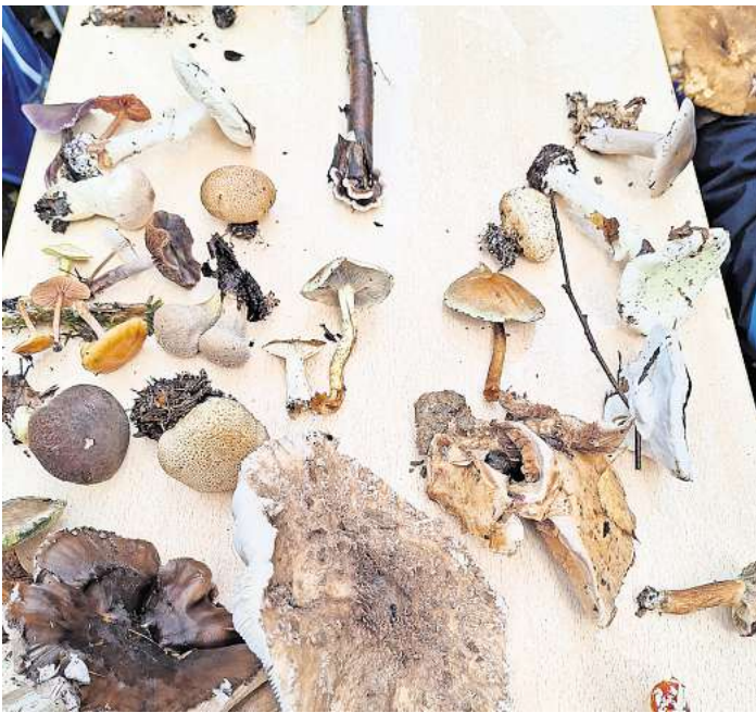
Fast jeder Pilz hat einen Verwechslungspartner. Deshalb wird beim Pilze sammeln zu Vorsicht geraten.

Anlässlich einiger aktueller Vergiftungen wurde darum gebeten, insbesondere den Grünen oder Gelben Knollenblätterpilz mitzubringen, damit diese dann eindeutig identifiziert werden konnten. „Anfassen von Giftpilzen macht nichts; sie sollten nur nicht mit essbaren Pilzen in Be-