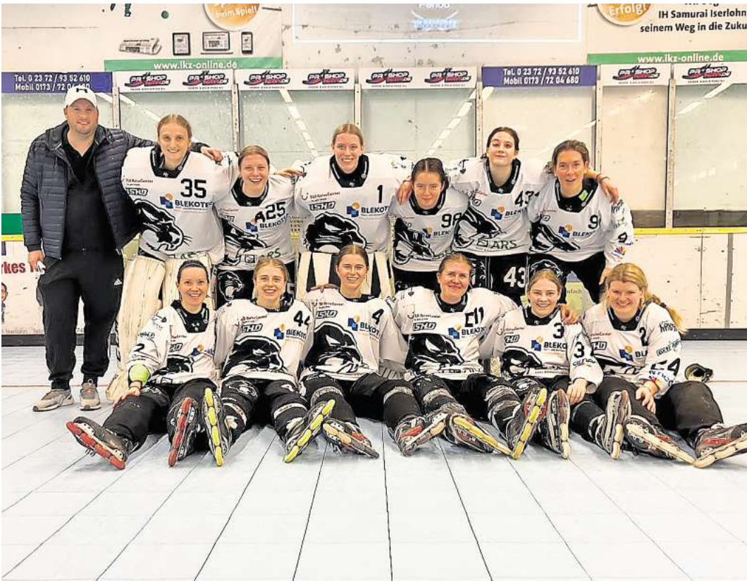
Die Pink Panther sind gut in die Saison gestartet.

Das Rückspiel findet bereits am Sonntag, 10. November, um 13 Uhr in der Wedemark-Sporthalle statt.