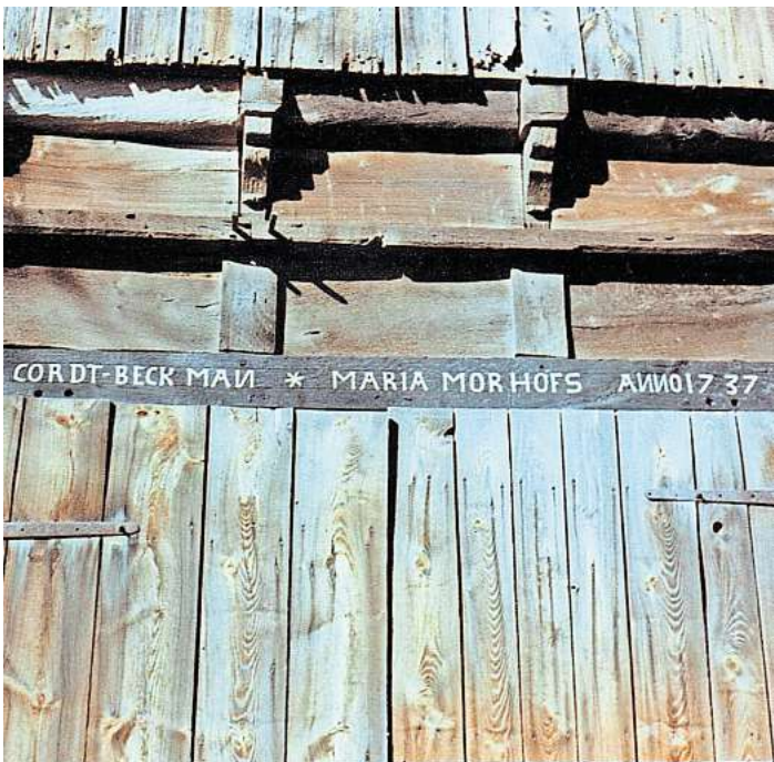
Was suchen wir in diesem Monat?