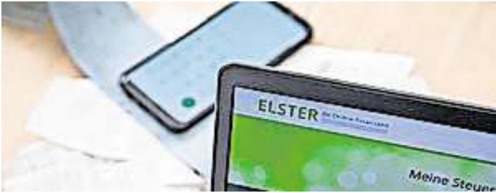
Eine freiwillige Steuererklärung kann Erstattungen bringen: Bis zum 31. Dezember 2024 werden noch rückwirkend eingereichte Erklärungen ab dem Steuerjahr 2020 akzeptiert.

Vielmehr können Steuerzahlerinnen und Steuerzahler selbst entscheiden - und in Jahren mit hohen abzugsfähigen Kosten, die zu einer Erstattung führen, eine Erklärung abgeben und in den Folgejahren, in denen ihnen keine steuerbaren Kosten entstanden sind, auf die Abgabe verzichten.