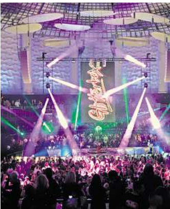
Ausgelassene Stimmung bei der Glitterbox.