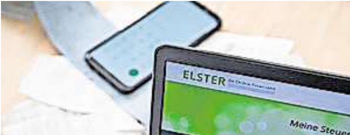
Eine freiwillige Steuererklärung kann Erstattungen bringen: Bis zum 31. Dezember 2024 werden noch rückwirkend eingereichte Erklärungen ab dem Steuerjahr 2020 akzeptiert.

Vielmehr können Steuerzahlerinnen und Steuerzahler selbst entscheiden - und in Jahren mit hohen abzugsfähigen Kosten, die zu einer Erstattung führen, eine Erklärung abgeben und in den Folgejahren, in denen ihnen keine steuerbaren Kosten entstanden sind, auf die Abgabe verzichten.