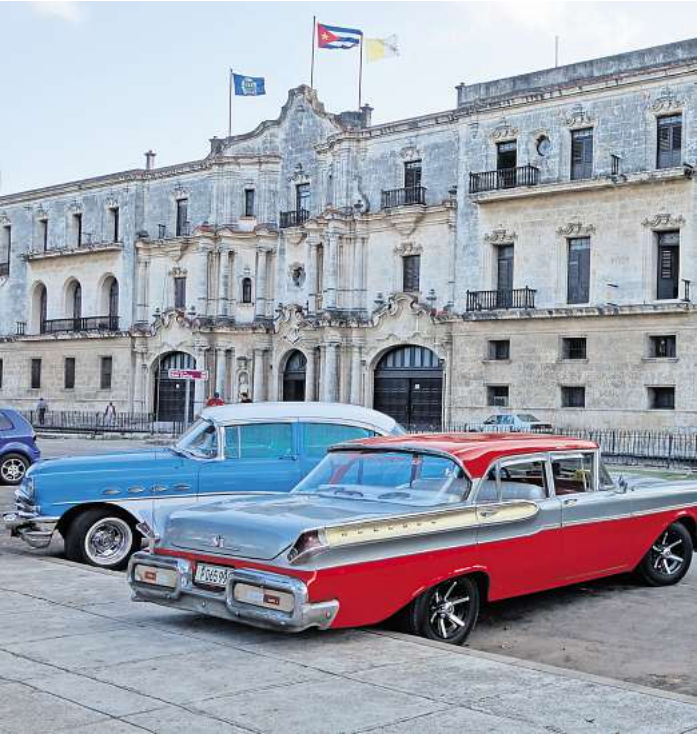
Kuba: ein faszinierendes Land zwischen Nostalgie und Nichts geht mehr.

magaScene: 6. Kubanische Visionen und 30. Buchlust