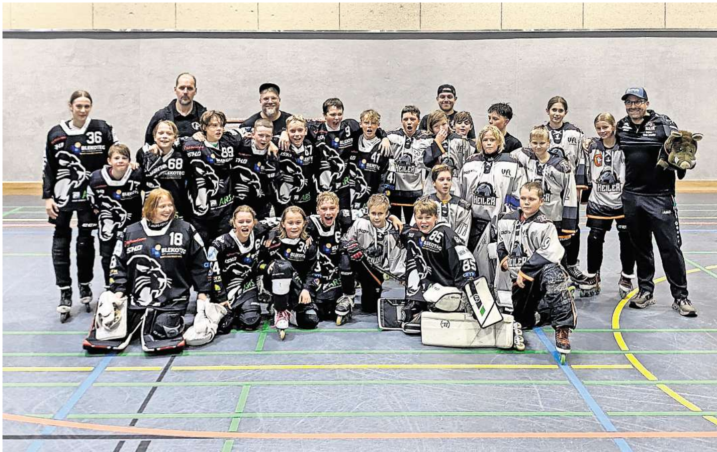
Die Bissendorfer Panther setzten sich im entscheidenden Relegationsspiel durch.

Entscheidendes Relegationsspiel gegen Lüneburg mit 22:1 gewonnen