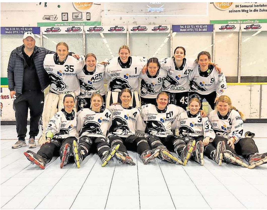
Die Pink Panther sind gut in die Saison gestartet.

Das Rückspiel findet bereits am Sonntag, 10. November, um 13 Uhr in der Wedemark-Sporthalle statt.