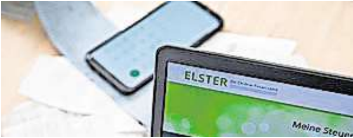
Eine freiwillige Steuererklärung kann Erstattungen bringen: Bis zum 31. Dezember 2024 werden noch rückwirkend eingereichte Erklärungen ab dem Steuerjahr 2020 akzeptiert.

Vielmehr können Steuerzahlerinnen und Steuerzahler selbst entscheiden - und in Jahren mit hohen abzugsfähigen Kosten, die zu einer Erstattung führen, eine Erklärung abgeben und in den Folgejahren, in denen ihnen keine steuerbaren Kosten entstanden sind, auf die Abgabe verzichten.