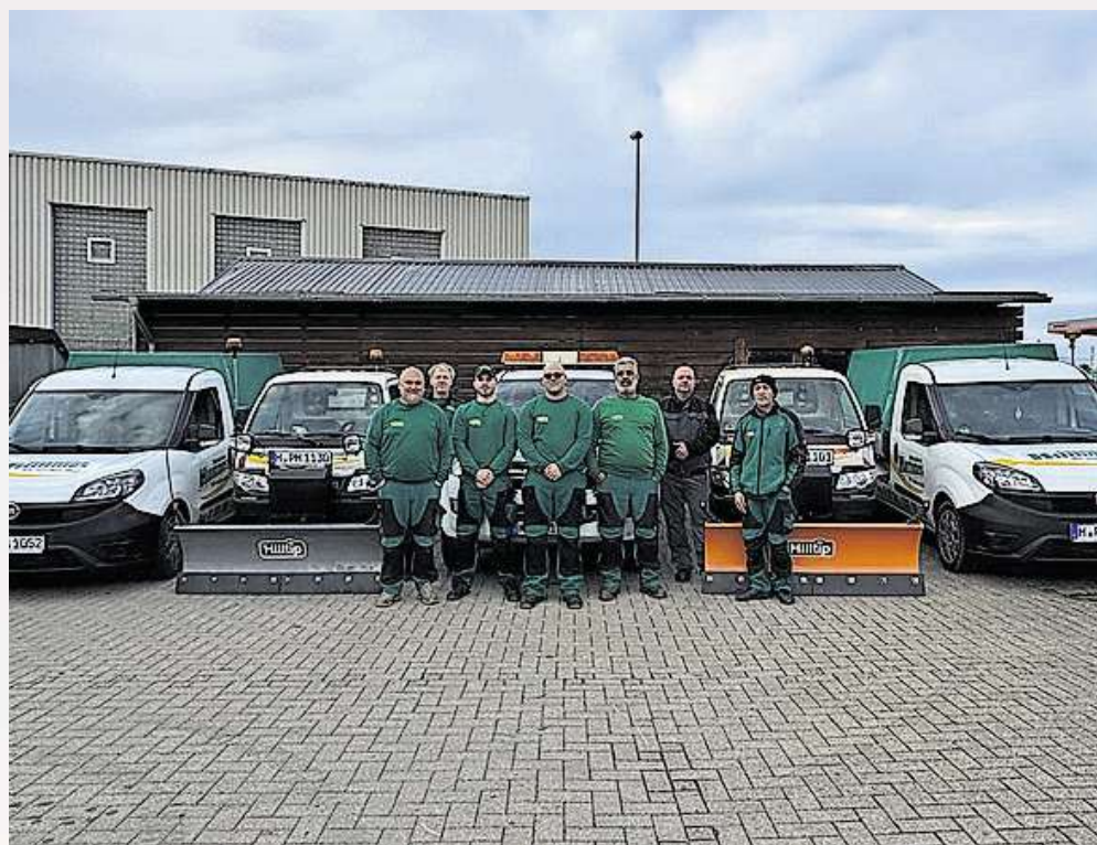
Insgesamt gehören rund 40 Mitarbeiterinnen und Mitarbeiter zur Firma Gebäudedienste Hummes aus Bissendorf. Hier nur ein kleiner Teil des Teams.

Die Gebäudedienste Hummes GmbH ist sowohl im Stadtgebiet als auch überregional tätig und bedient eine breite Kundschaft in der ge-