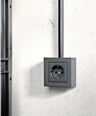
Designobjekt im Raum: Steckdose im Schalterprogramm Graphit-schwarz matt.

In den matten Farbtönen Graphitschwarz und Schneeweiß verleiht die Lackierung den Schaltern, Tastern und Steckdosen zudem eine ganz besondere samtige Haptik. Das Programm überzeugt durch seine Optik und durch Funktionsvielfalt: Die Rahmen können mit allen Abdeckungen von ande-