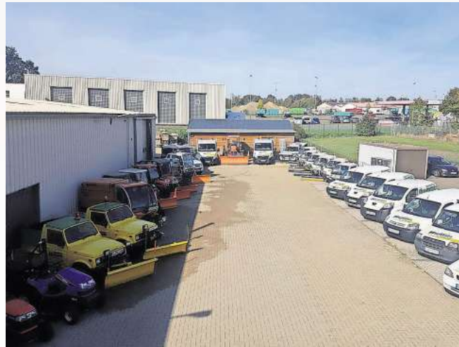
Die Kunden der Firma Hummes sind im Umkreis von rund 50 Kilometern zu finden – entsprechend groß ist der Fuhrpark.

Weitere Infos: Hummes GmbH Denecken Heide 5, Bissendorf Telefon: (05130) 79 58 6 Mail: info@hummes-dienste.de Web: www.hummes-dienste.de