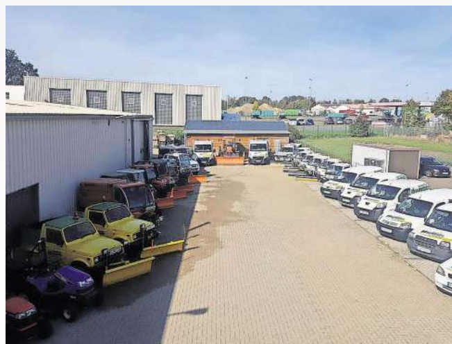
Die Kunden der Firma Hummes sind im Umkreis von rund 50 Kilometern zu finden – entsprechend groß ist der Fuhrpark.

➤ Weitere Infos: Hummes GmbH Denecken Heide 5, Bissendorf Telefon: (05130) 79 58 6 Mail: info@hummes-dienste.de Web: www.hummes-dienste.de