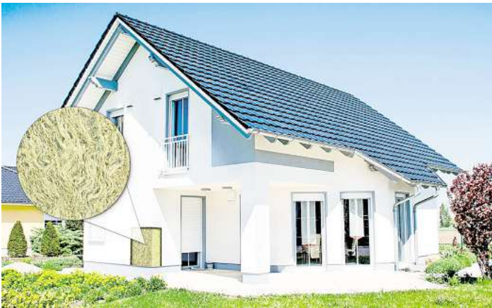
Schon nach kurzer Zeit macht sich eine energetische Sanierung bezahlt. Sinnvoll ist eine Kombination aus der Dämmung mit Mineralwolle und anschließender Optimierung der Heizanlage

Neben einer effizienten Heizanlage und der Nutzung erneuerbarer Energien spielt die Dämmung des Gebäudes eine entscheidende Rolle, um langfristig Energie und Geld zu sparen. Die Dämmung der Immobilie ist ein nachhaltiger und wichtiger Schritt auf dem Weg zum