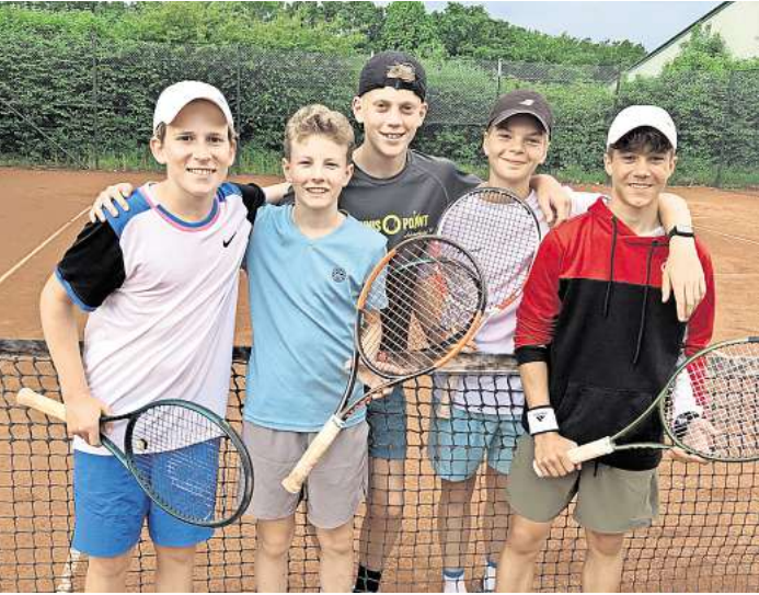
Die siegreichen jungen Sportler