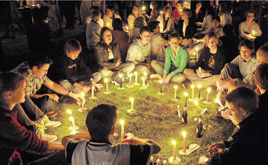
Stimmungsvoll: Ein „Lichtermeer“ – wie hier bei der Kirchentagseröffnung am 25. Mai 2005 am Hohen Ufer in Hannover – soll es auch im kommenden Jahr wieder geben.

gottesdienst, der zeitgleich vor dem Neuen Rathaus und auf dem Opernplatz stattfindet, sollen bis zu 40.000 Menschen dabei sein. Beim anschließenden „Abend der Begegnung“ gibt es am 30. April in der kompletten Innenstadt rund 200 Bühnen und Stände von Kirchengemeinden und anderen Einrichtungen. Nahe der Leinewelle ist ein großer Sportparcours geplant, auf dem Ballhofplatz soll eine Tanzfläche entstehen. Ein Straßenfest der Superlative. „Anfang Oktober war dafür Anmeldeschluss – und jetzt wird gepuzzelt“, sagt Behr. Welche Acts werden wo ihren Platz haben? Was passt thematisch zusammen? „Wir haben noch viel Arbeit vor uns“, erklärt der Pastor. „KINDERKATHEDRALE“ FÜR FAMILIEN IN DER KREUZKIRCHE Beim bislang letzten Kirchentag in Hannover waren 2005 noch schätzungsweise 350.000 Menschen beim kostenlosen Begegnungsabend dabei, der für alle offen ist; diesmal sollen es mindestens 100.000 werden. „Der Kirchentag ist nicht mehr so ein Selbstläufer wie noch vor 20 Jahren“, sagt Behr. In Nürnberg wurden 2023 noch 70.000 Tickets verkauft – deutlich weniger als in früheren Jahren. Doch noch immer können die evangelischen Events mit einer beispiellosen Fülle von Veranstaltungen punkten.