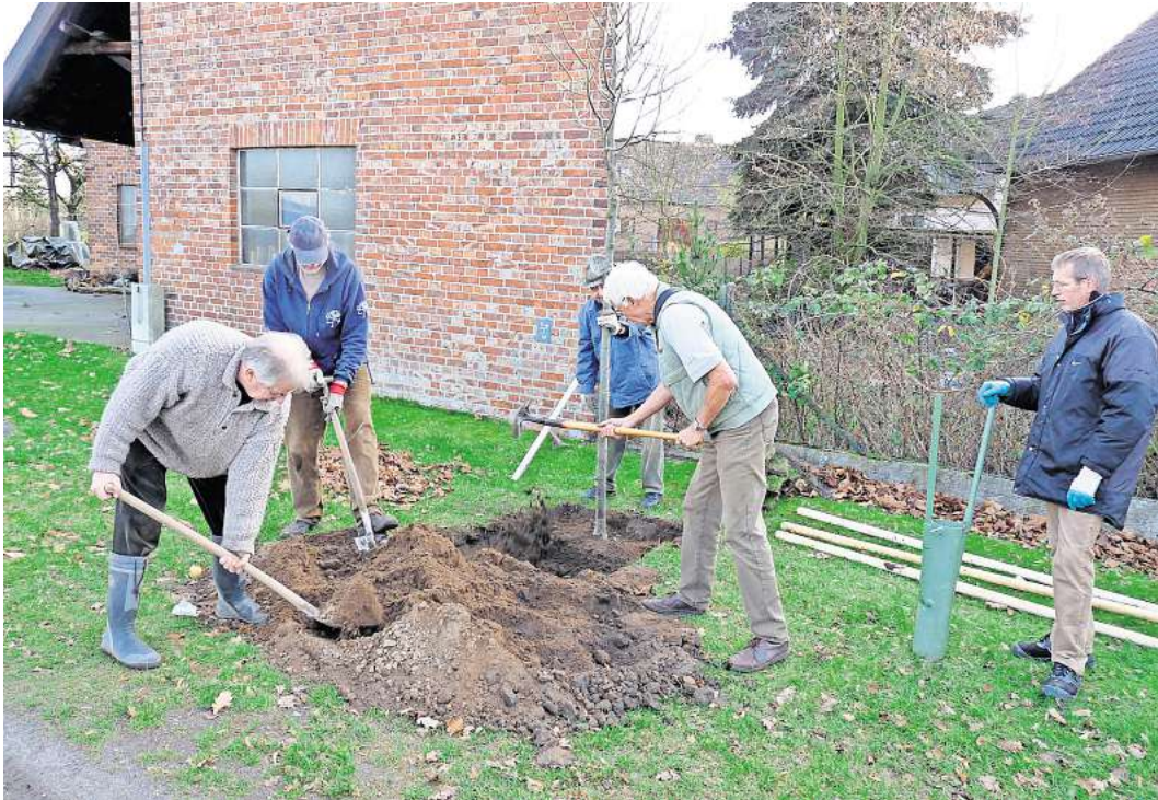
Baumpflanzung am Bruchweg: Der Erhalt ortstypischer Laubbäume ist dem Verein Dorfbild ein wichtiges Anliegen.