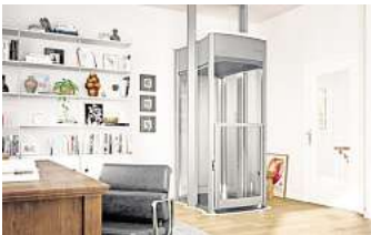
Ein privater Aufzug in den eigenen vier Wänden.

Wird das Treppensteigen mit zunehmendem Alter zum Problem, geht der erste Gedanke meist in Richtung Treppenlift. Eine gute Idee, aber es geht noch besser: mit einem hochwertigen Home-lift. Die clevere Alternative zum Treppenlift lässt sich ebenfalls nachträglich einbauen – ohne viel Schmutz und in der Regel innerhalb von 48 Stunden. Benötigt werden lediglich ein Deckenausschnitt und eine Steckdose in der Nähe, eine Baugenehmigung ist nicht erforderlich. Und die Kosten? Sie liegen weit unter dem Preis eines Schachtlifts und können durch Fördermaßnahmen von KfW, Pflegekasse & Co. deutlich gesenkt werden. (HLC)