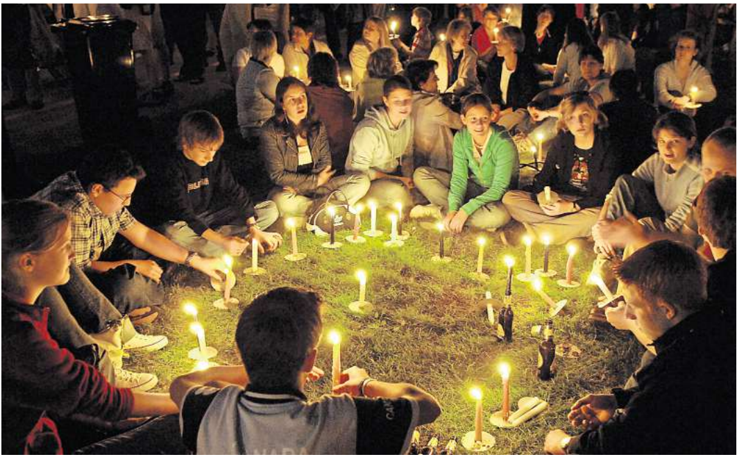
Stimmungsvoll: Ein „Lichtermeer“ – wie hier bei der Kirchentagseröffnung am 25. Mai 2005 am Hohen Ufer in Hannover – soll es auch im kommenden Jahr wieder geben.

Beim bislang letzten Kirchentag in Hannover waren 2005 noch schätzungsweise 350.000 Menschen beim kostenlosen Begegnungsabend dabei, der für alle offen ist; diesmal sollen es mindestens 100.000 werden. „Der Kirchentag ist nicht mehr so ein Selbstläufer wie noch vor 20 Jahren“, sagt Behr. In Nürnberg wurden 2023 noch 70.000 Tickets verkauft – deutlich weniger als in früheren Jahren. Doch noch immer können die evangelischen Events mit einer beispiellosen Fülle von Veranstaltungen punkten.