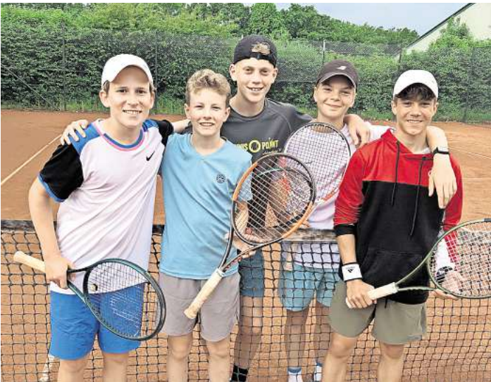
Die siegreichen jungen Sportler