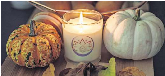
Für die Herstellung von Duftkerzen benötigen Sie nur wenige Zutaten.

Wachs schmelzen: Erhitzen Sie das Wachs im Wasserbad, bis es vollständig geschmolzen ist. Achten Sie darauf, das Wachs nicht direkt auf die Herdplatte zu stellen, da es sich entzünden kann.