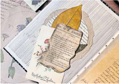
Von kleinen Foto-Collagen bis hin zum mehrseitigen Fotoalbum ist alles möglich.

Die bunten Herbstblätter, die warmen Farbtöne und die stimmungsvollen Herbstfeste schaffen eine perfekte Kulisse für herbstliche Scrapbook-Seiten. Getrocknete Blätter lassen sich gut in das Scrapbook integrieren und geben den Seiten eine natürliche Textur.