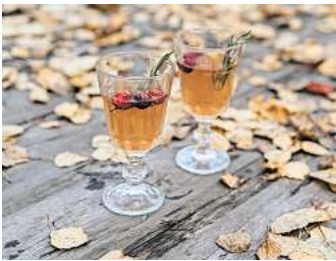
Viel Spaß beim Genießen dieses herbstlichen Punsch!

1. Schwarzen Tee zubereiten: Das Wasser zum Kochen bringen und die Teebeutel etwa 3-4 Minuten darin ziehen lassen.