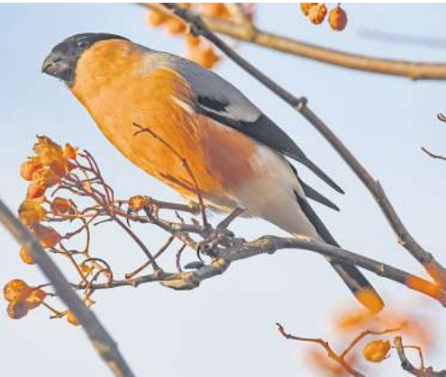
Beerensträucher wie die Eberesche liefern Vögeln im Winter Nahrung.

Beliebte Nahrungsquellen sind außerdem Zierlauch, Schneeglöckchen oder Traubenhyazinthe. Die gute Nachricht für alle mit Balkon oder Terrasse: Diese Pflanzen brauchen nicht viel Platz und fühlen sich daher auch in Balkonkästen oder Pflanzkübeln wohl. Was kann man sonst noch tun? Stauden sollte man stehen lassen. Sie werden erst im Frühjahr geschnitten. In den Blütenständen können Vögel noch Futter finden. (DPA)