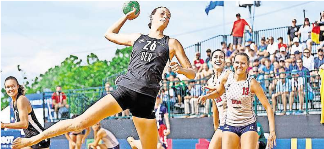
Unter freiem Himmel: Auch Beachhandball gehört zum Programm der World Games

Auch Regionspräsident Steffen Krach (SPD) ist empört. „Die