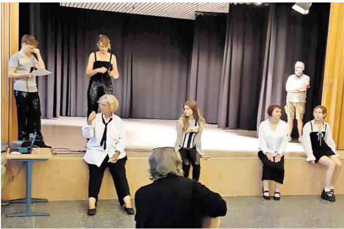
„Kultur selber machen“ lautet die Devise der Probebühne.

„Kultur selber machen – das ist bei der Probebühne unsere Devise“, schwärmt die Kulturbeauf-