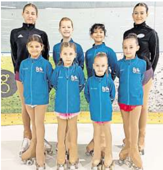
Die erfolgreichen Läuferinnen der REG Wedemark

Trotz der Herbstferien und der Sperrung des Elbtunnels an dem Wochenende fuhrten acht Läuferinnen und ihre Eltern schon früh in die q.beyond Arena nach Stellingen. Dort traten außerdem noch Vereine aus Schleswig-Holstein, Mecklenburg-Vorpommern, Berlin, Sachsen-Anhalt