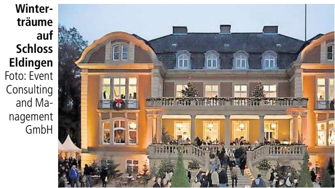
Winterträume auf Schloss Eldingen