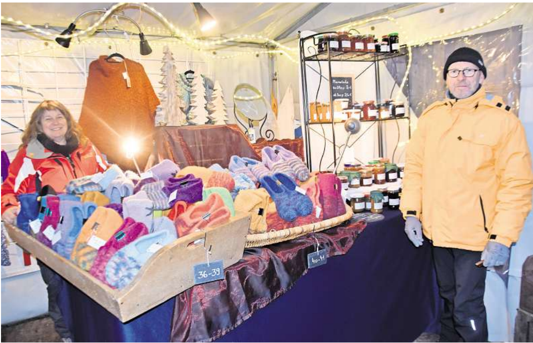
Zu Gast auf vielen Ausstellungen und Märkten: Uve und Regina Sehne mit Strickwaren, Filzschuhen und Holznistkästen.

Geboten werden am neuen Standort am 20. Oktober rund um das Dorfgemeinschaftshaus Handgemachtes und Unikate