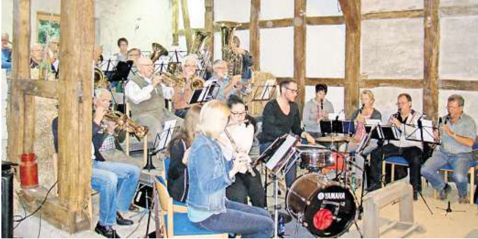
Der Musikzug der Freiwilligen Feuerwehr ist mit von der Partie.