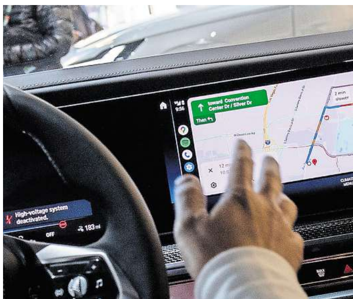
Welcher Weg zur Arbeit ist der kürzeste? Denn das ist in der Regel der, den Beschäftigte steuerlich geltend machen können.

Die knappe Antwort: grundsätzlich die kürzeste. Es gibt aber Ausnahmen, wie der Bund der Steuerzahler mitteilt. Denn staut sich etwa der Verkehr auf der kürzesten Strecke regelmäßig oder kosten viele Ampeln oder Bahnübergänge Zeit, können Arbeitnehmerinnen und Arbeitnehmer auch eine längere Strecke nutzen und in ihrer Steuererklärung angeben, sofern sie ihre