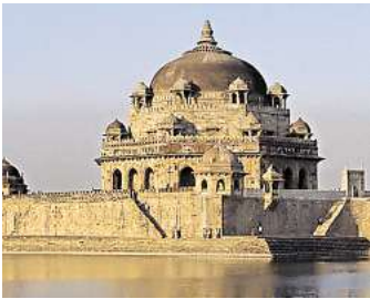
Indien steht im Mittelpunkt der ersten Veranstaltung.

spannende Vorträge. Von Afrika und Australien über Italien auf die Kanaren. Beginn der Veranstaltungen ist jeweils um 19.30 Uhr, Einlass ab 19 Uhr. Tickets gibt es online auf und im Erlebnis-Shop auf der Airport Plaza. Der Eintrittspreis beträgt 15,90 Euro. Ermäßigt 13,90 Euro. Alle Vorträge finden im „Cockpit“ statt. Der Veranstaltungsraum ist über die Glas-Aufzüge der Airport Plaza (Abflugebene zwischen Terminal A und B) erreichbar. Empfehlung als Parkmöglichkeit: das Parkhaus 1 (P1). Parkpreis für alle „Planetview“-Gäste: vier Stunden Parken für vier Euro (nähere Infos vor Ort beim Veranstaltungseinlass). Natürlich stehen auch die öffentlichen Verkehrsmittel zur Anreise zur Verfügung. Weitere Infor-