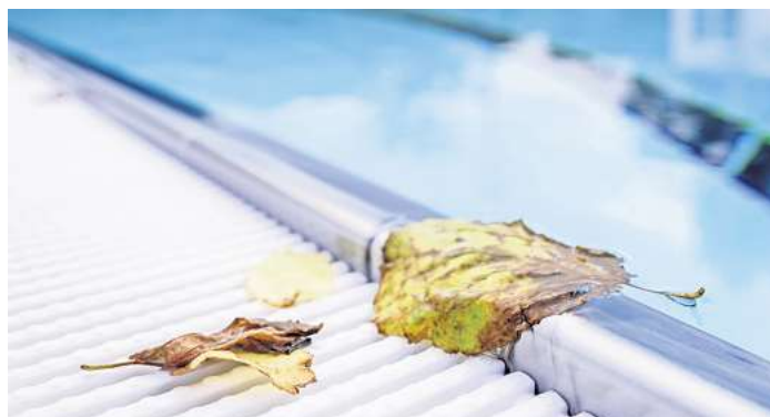
Wer einen Pool unter Nachbars Eichen baut, kann keine Entschädigung für den Laubfall verlangen.

- Laub von Bäumen auf dem Grundstück nebenan gilt meist als Teil der ortsüblichen Bepflanzung.