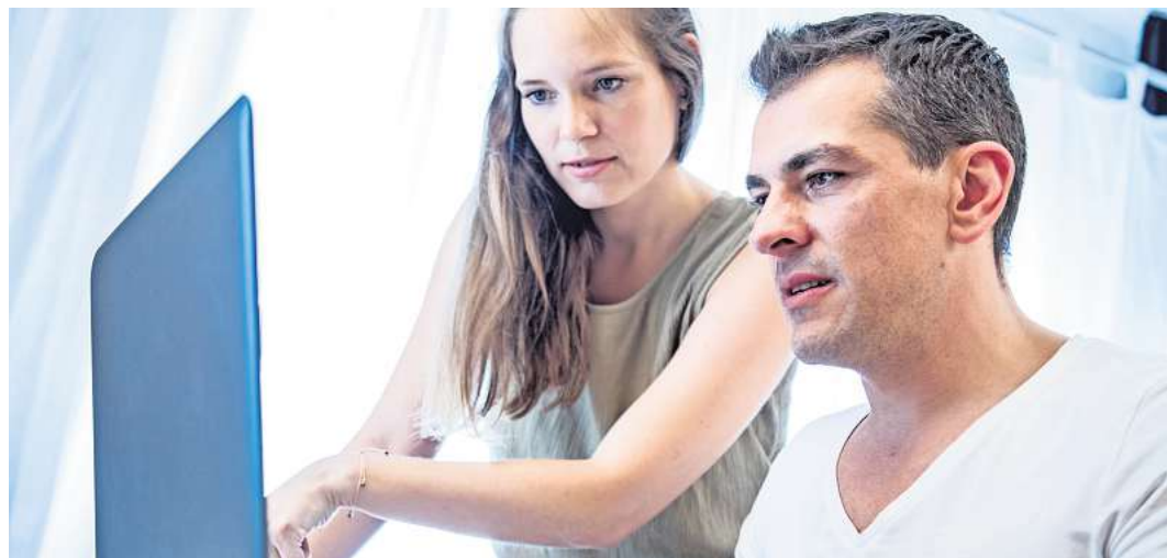
Genau hinschauen: Ehepaare, die steuerlich immer optimal fahren möchten, sollten Jahr für Jahr neu prüfen, ob die Einzel- oder Zusammenveranlagung für sie günstiger ist.

Selbst wenn das Finanzamt einen Steuerbescheid ausgestellt hat, können Paare ihre Veranlagungsart noch ändern - allerdings nur so lange, wie der Bescheid nicht bestandskräftig ist. (DPA)