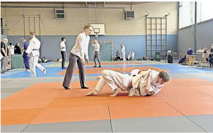
ID-Judoka traten gegen Judoka ohne Beeinträchtigung an.

Neben viel Erfahrung sammeln die Judoka auch Punkte für ihren Verein, denn am letzten Tag gibt es die begehrten Vereinspokale und damit die Auszeichnung für die erfolgreichsten Vereine in der Region Hannover. In diesem Jahr war es unter den ersten fünf Plätzen sehr eng und es gab auch noch am letzten Tag Platzwechsel. Am Ende des zweiten Kampftages stand das Ergebnis wie gefolgt fest 5. Platz Samurai Burgdorf, 4. Platz Mellendorfer TV, 3.