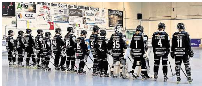
Die Panther-Damen waren von Sekunde eins an hellwach.