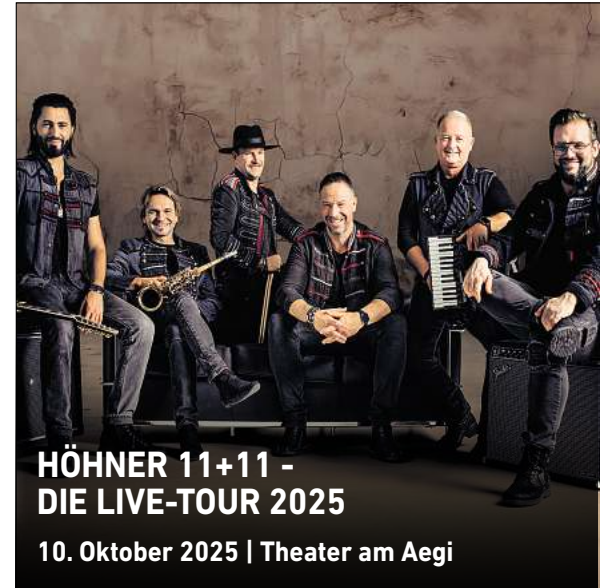
HÖHNER 11+11 - DIE LIVE-TOUR 2025 10. Oktober 2025 | Theater am Aegi

(Sonnabend, 7. Dezember, 19 Uhr) Einlaufkinder, die dabei sein wollen. Sie erleben nicht nur diesen einzigartigen Moment auf dem Spielfeld, sondern haben auch freien Eintritt und können sich über eine exklusive Hallenführung freuen. Kinder aus Schulen und Vereinen, die den TuS Vinnhorst auf seinem Weg durch die Saison unterstützen wollen, sind herzlich willkommen. Anfragen und Anmeldungen bitte unter einlaufkinder@tus-vinnhorst.de .