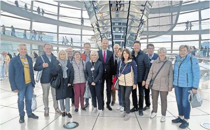
Die Wedemärker erfuhren eine Menge Wissenswertes über das politische Geschehen in der Hauptstadt.