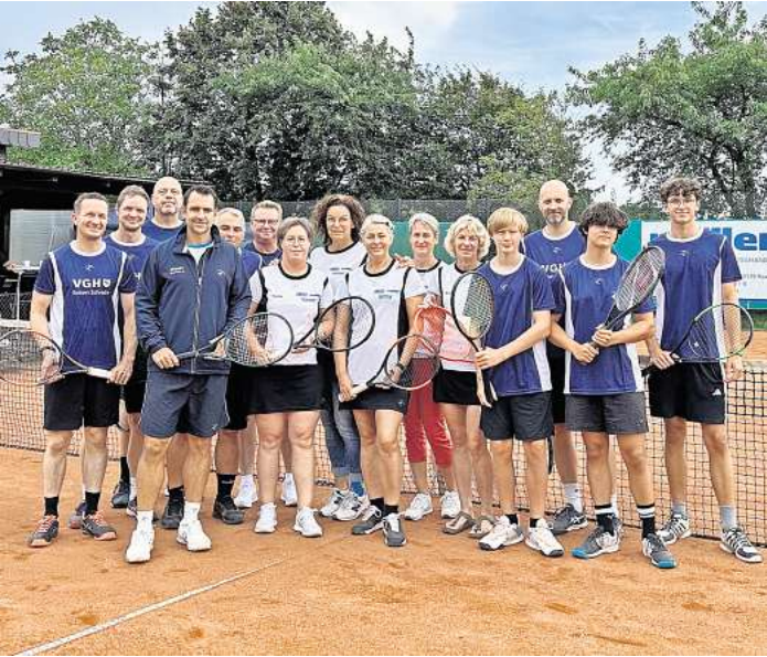
Gab viel von seinem Können auf dem Court weiter: der ehemalige Welt-ranglistenvierte Nicolas Kiefer.

Ex-Tennisstar Nicolas Kiefer war zu Gast in der Wedemark