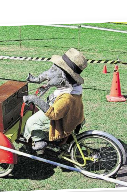
Ein ganz besonderer Gast wird sich seine Wege durch die Besucherinnen und Besucher mit seinem Vehikel suchen: „Jochen der Elefant“ begeistert nicht nur die kleinen Gäste.

Auch in diesem Jahr wird zeitgleich der traditionellen Krammarkt entlang der Gottfried-August-Bürger-Straße stattfinden. Einer der großen Anziehungspunkte für die kleinen Gäste wird sicherlich wieder das Kinderkarussell sein aber auch die Stände mit Trödel, Herbstblumen, Keramik, Kleidung und, und, und. Auf jeden Fall ist sicher, der Bissendorfer Sonntag in diesem Jahr wird eine bunte Vielfalt des Einzelhandels, des Vereinslebens und des Ehrenamtes in der Gemeinde Wedemark zu bieten haben.