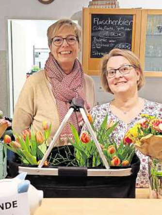
Das Dorfcafé ist zu einer beliebten Veranstaltung geworden: Mindestens drei Mal im Jahr sind alle Einwohner unabhängig vom Alter zu Kaffee und Kuchen eingeladen.