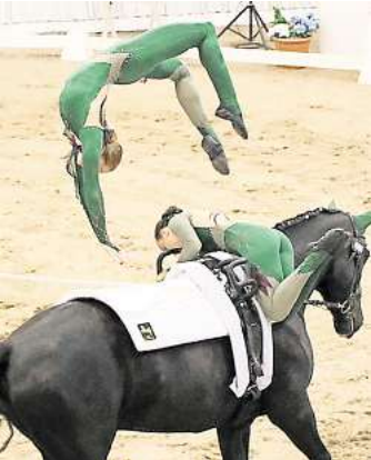
Die Kürnote war mit 8,1 herausragend.