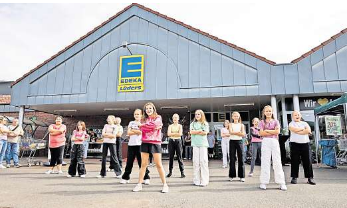
Die Kinder-Tanzgruppe des Pilates + Tanzhauses Wedemark.