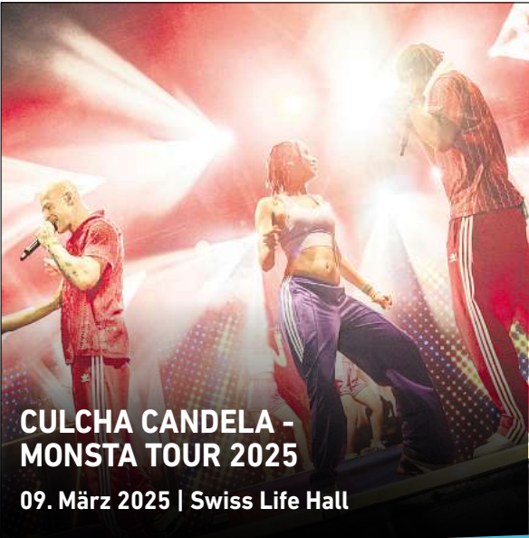
CULCHA CANDELA - MONSTA TOUR 2025 09. März 2025 | Swiss Life Hall

In der D-Jugend kann Sieben-gegen-sieben auf zwei Feldern gespielt werden, dann würden 14 Kinder pro Team immer eingesetzt. Das ist dann in etwa der spätere C-Jugend-Kader für Elf-gegen-elf. So bilden wir mehr Kinder im besseren Format aus – beide Torhüter spielen, beide Stürmer haben mehr Aktionen. Das bekommen wir allein mit Trainingsphilosophie nicht hin. Das ist übrigens sehr leistungsorientiert, um den Kritikern da wieder vorzugreifen.