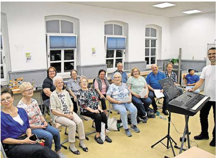
Los gehts: Der Internationale Chor in Wennebostel bei der Probe. Es werden noch Mitsstreiter gesucht.