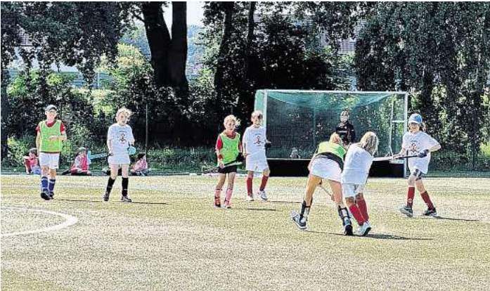
Training auf dem Kunstrasenplatz.

Nach dem gemeinschaftlichen Frühstück ging es am Freitag ein letztes Mal auf den Hockeyplatz, bevor das diesjährige Hockey-Camp des MTV am Nachmittag zu Ende war.