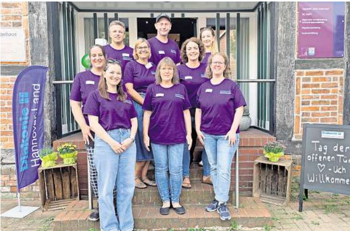
Ein engagiertes Team hält am Diakonie-Standort Burgwedel viele Angebote bereit.