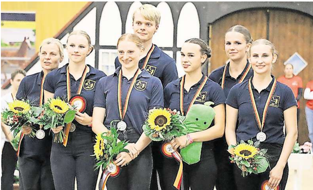
Das Wedemärker Team.