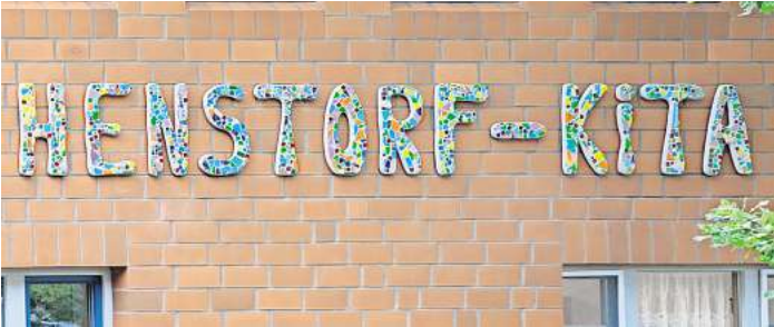
Neues Namensschild: Die Henstorf-Kita gestaltete an ihrem 50. Geburtstag ein Mosaik, das jetzt das Haus ziert.

BISSENDORF. Die Henstorf-Kita setzte zu ihrem 50. Geburtstag einen besonderen Akzent: Ein farbenfrohes Mosaik schmückt nun die Außenfassade. Das nachhaltige Kunstwerk wurde von Kindern und Eltern gemeinsam mit der Kinder- und Jugendkunstschule gestaltet. Ein buntes Kunstwerk bereichert die Henstorf-Kita: Gemeinsam mit der Kinder- und Jugendkunstschule Wedemark haben Kinder und Eltern das bunte Mosaik für die Außenfassade selbst gestaltet. Im Mai feierte die Henstorf-Kita mit einem großen Familienfest ihren 50. Geburtstag. Doch das Highlight des Festes kam von den kleinen Händen der Kita-Gäste.