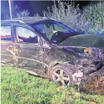
Betrunkener baut Unfall in der Wedemark: Brelingen kommend in Fahrtrichtung Negenborn.

Bei dem Beschuldigten wurde Blut entnommen. Zudem nahmen die Polizisten dem Mann den Führerschein ab – er wurde vorerst beschlagnahmt. Zeugenhinweise wären hilfreich – unter der Telefonnummer (05130) 9770.