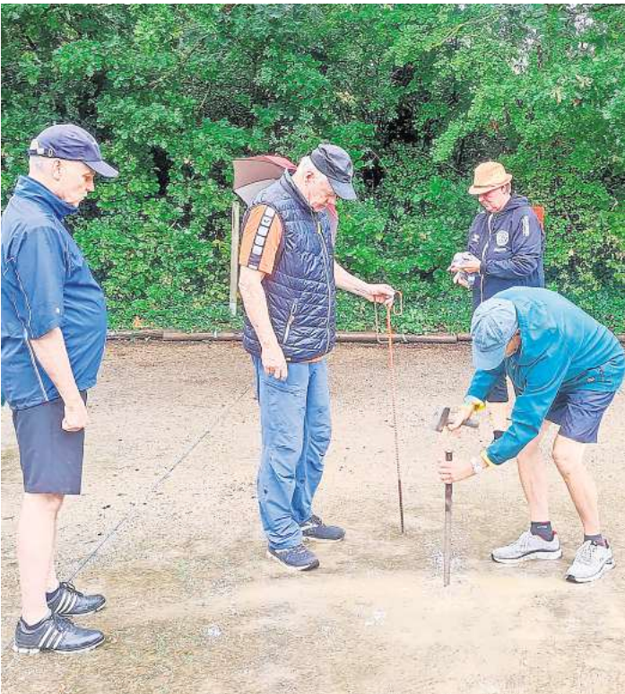
Gespielt wurde Triplet gegen Triplet.