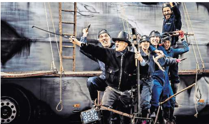
„Moby Dick“ kommt am Sonnabend, 21. September, nach Hellen- dorf.

Zum anderen ist die Inszenierung auch raumtechnisch sehr groß. Um „Moby Dick“ zum Leben zu erwecken, benötigt die Gruppe einen alten Linienbus, mehrere „Beiboote“, die ebenfalls motorisierte Gefährte sind und einen Platz, auf dem sie da-