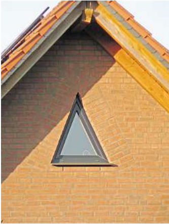
Wo ist das?