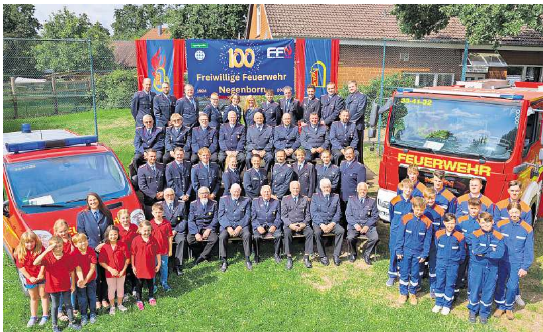
Die Negenborner Feuerwehr ist fester Bestandteil der Dorfgemeinschaft und der Gemeindefeuerwehr.

Das blieb so bis 1930, die Handdruckspritze, die Mitglieder der Freiwilligen Feuerwehr Negenborn sowie „alles was Beine hatte“ war bei manchem Brand mit Eimern mit Wasser im Einsatz. In dem Jahr fiel der Entschluss, dass die Wehrmitglieder eine einheitliche Uniform bekommen sollten, die ersten Jacken wurden vom Dorfschneider hergestellt. Zum ersten Mal zum Einsatz kamen sie, als 1930 ein landwirtschaftlicher Betrieb durch Brandstiftung den Flammen zum Opfer fiel. Vernichtet wurden dabei auch die gesamten Erntevorräte, die Männer mussten feststellen, dass auch der größte Einsatz mit der Handdruckspritze nicht ausgereicht hatte, das Gehöft zu retten. Also wurde mit der fortschreitenden