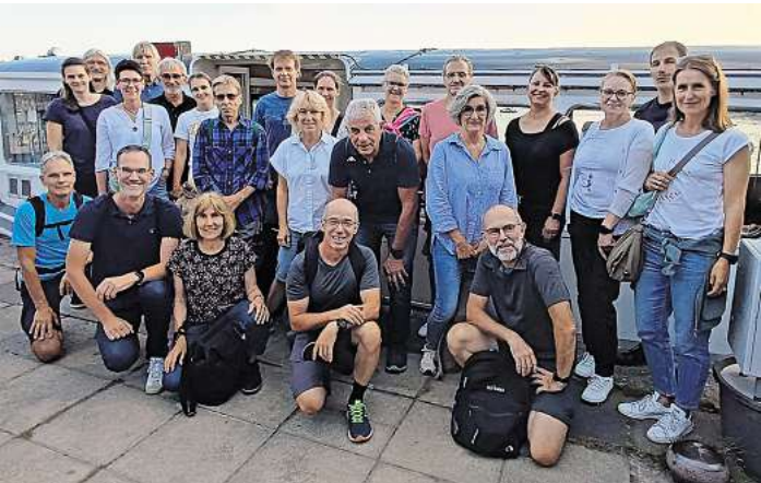
Das Gemeinschaftsgefühl macht den LAC aus.

Es gab viel Gelächter und Geschichten aus den letzten zehn Jahren wurden ausgetauscht. Der Abend auf der EMS Niedersachsen war ein gemütliches Beisammensein, bei dem die Mitglieder die Möglichkeit hatten, sich zu entspannen und die Gemeinschaft zu genießen. Der Vorstand bedankte sich bei allen für ihr Engagement und ihre Unterstützung in den letzten zehn Jahren und freut sich auf viele weitere erfolgreiche Jahre. "Wir sind mehr als nur ein Leichtathletik-Club", sagte der Vorsitzende. "Wir sind eine Gemeinschaft. Und das ist es, was die letzten zehn Jahre so besonders gemacht hat."