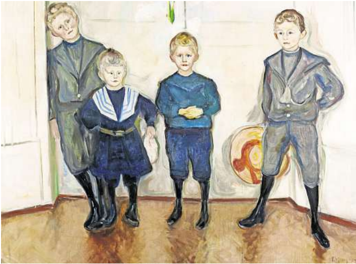
Edvard Munch: Die Söhne des Dr. Linde.

5. Oktober: imago Kunstverein fährt nach Lübeck