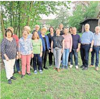
Die Michaeliskantorei lädt zum Mitsingen ein.