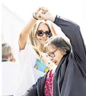
Die Mieterinnen und Mieter der LH LW sind fest im Quartier integriert.

de des SC Langenhagen an der Leibnizstraße statt. 2022 ist die Heilpädagogische Frühförderung in die Wiesenauer Straße umgezogen. Die Kindertagesstätte „Am Erdbeerfeld“ in Hellendorf mit etwa 74 Plätzen – Krippen, integrativen und heilpädagogischen Gruppen – wurde eröffnet. Als letztes Projekt