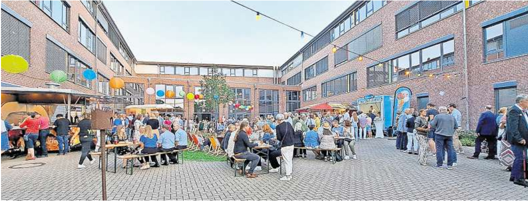
Der Innenhof am Schulzentrum war für das Sommerfest entsprechend umdekoriert.

Unter dem Motto „50 Jahre Gemeinde Wedemark“ stand auch dieser Abend, wie bereits das Bürgerfest im Juni am Bürgerhaus in Bissendorf. Mitarbeiterinnen und Mitarbeiter der Gemeinde Wedemark hatten dafür gesorgt, dass aus dem Innenhof am Schulzentrum ein ansprechender Rahmen mit ausreichend Sitzgelegenheiten entstand. Bunte Lampions leuchteten nach Einbruch der Dunkelheit über allem und die bunte Gruppe der Theater Company „Takkers Conection“ aus den Niederlanden sorgte mit ihren ausgefallenen und vor allem bunten Kostümen für gute Stimmung. Die geladenen Gäste beteiligten sich allesamt mit einem Kostenbeitrag an der Finanzierung des Abends, auch zahlreiche Sponsoren wie unter ande-