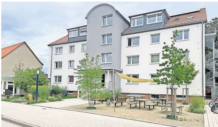
Ist zum beliebten Treffpunkt geworden: der Platz in der Liebigstraße.

Die Gründerinnen und Gründer – und teilweise heute noch Gesellschafterinnen und Gesellschafter – wollten damals das Wohnumfeld für ihre Kinder mit Beeinträchtigung selbst und anders gestalten. Seither setzen die GBA und die LH LW diese Idee von Veränderung, Innovation und Pro-Aktivität um und entwickeln sich so stetig weiter. Mittlerweile ist die Lebenshilfe Langenhagen-Wedemark eine