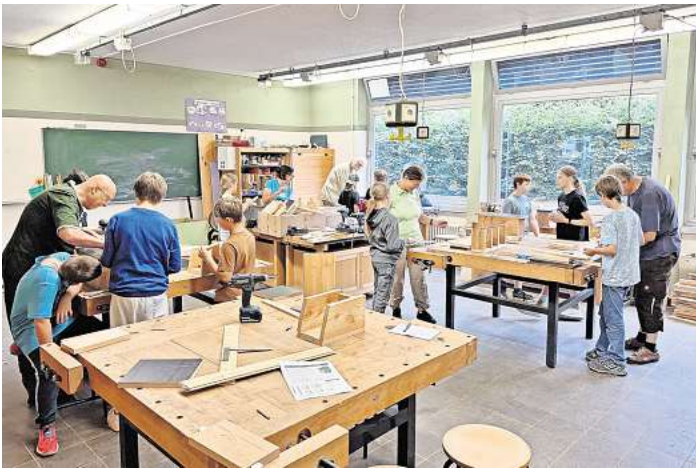
Allerlei über Werkzeuge erfuhren die Teilnehmer der Ferienpassaktion.

Mit vier weiteren Betreuerinnen und Betreuern des NABU wurden Nistkästen für Meisen, Reihenhäuser für Haussperlinge, Starenkästen, Fledermaus-Sommerquartiere, Nistkästen für Höhlenbrüter, ein Futterhäuschen und ein Insektenhotel gebaut.