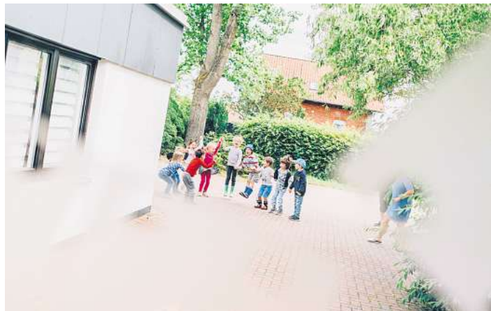
Eine der vielen Einrichtungen der Lebenshilfe: die Kita Domino in Mellen-dorf.

Teilhabe und Inklusion sind in allen Lebensbereichen der Gesellschaft ein Thema, genauso wie der Abbau von Barrieren und die Um-