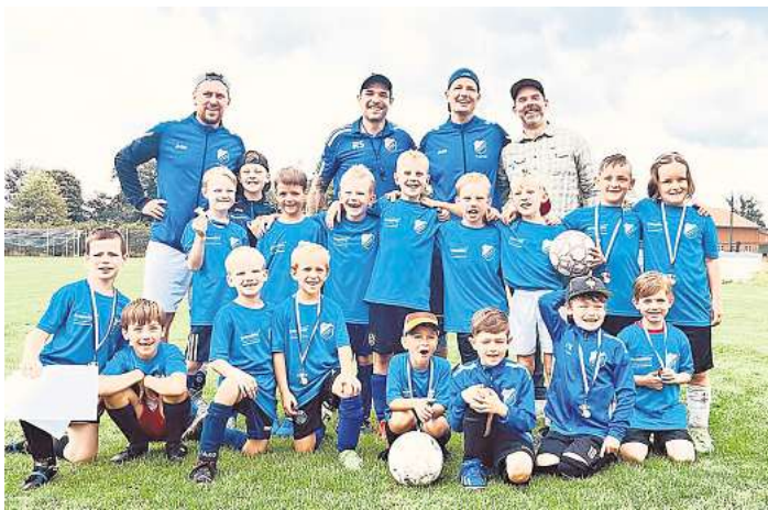
Die Kids waren begeistert über den Verlauf des Fußballcamps.