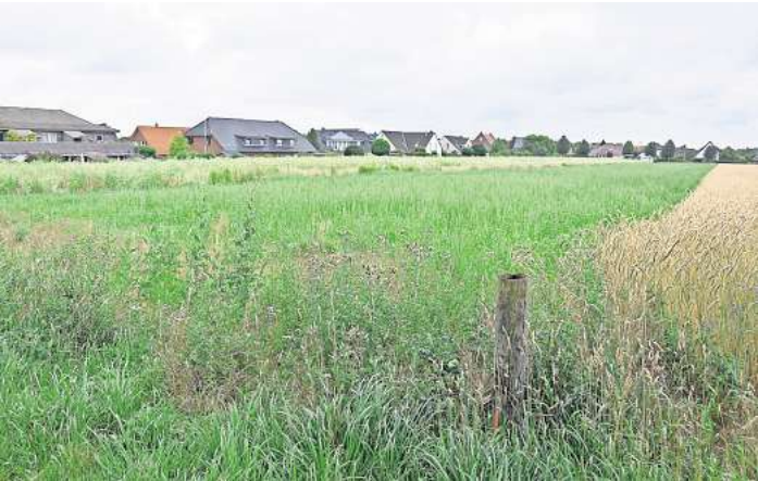
Hier soll Großburgwedel wachsen: Blick von der Straße Am Mühlenfeld auf die Fläche für die neue Ökosiedlung.

anschlüsse von der Windmü- lenbreite aus erfolgen. Diese Kri- tik griff auch der Ortsrat Groß- burgwedel im März 2024 dahin- gehend auf, dass die Haupt- erschließung möglichst über die Straßen Am Mühlenfeld und Tra- kehner Weg erfolgen sollte.