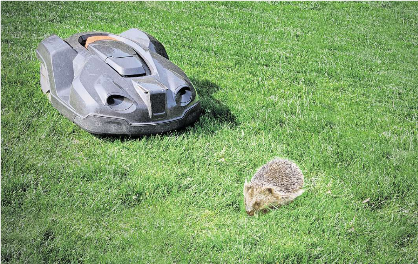
Tödliche Gefahr: Immer mehr Igel werden durch Mähroboter schwer verletzt oder getötet.

Auch ein anderes Rasentrimm-gerät kann dem Igel nach Eing-schätzung von Mendel gefährlich werden: „Der Bereich unter den Hecken wird oft mit einem Freischneider bearbeitet“, sagt sie. „Dort haben Igel aber oft ihre Tagesnester gebaut und schlafen darin. Die Wahrscheinlichkeit, entweder einen Igel zu verletzen