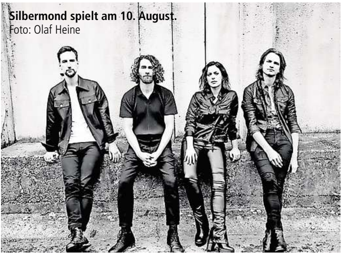
Silbermond spielt am 10. August.

eines von nur fünf Deutschland-Shows und sicherlich ein absolutes Highlight für Fans des Tigers. Am 16. und 17. August werden dann PUR im Rahmen ihrer diesjährigen Open-Air-Tour unter dem Motto „Persönlich – Unter freiem Himmel“ mit Hits wie „Lena“, „Hör gut zu“, „Wenn Du da bist“ und natürlich „Abenteuerland“ ganze zwei Tage lang das Publikum begeistern. Beide Shows sind leider schon ausverkauft. Weiter geht es am 21. August mit Jan Delay & Disko No. 1. Der Hamburger hat im Mai sein Best-Of mit dem Titel „Forever Jan (25 Jahre Jan Delay)“ veröffentlicht und befindet sich nun auf Tour damit und wird seinen Fans auf der ebenfalls bereits ausverkauften Gilde Parkbühne einige Überraschungen präsentieren. Im September geht es weiter mit Ronan Keating. Seine beeindruckende Musikkarriere begann 1994 mit der mega erfolgreichen Boyband Boyzone. Solo landete er 1999 mit „When You Say Nothing At All“ aus dem Soundtrack zum Film „Notting Hill“, seine erste eigene Nummer-Eins-Single und veröffentlichte später regelmäßig erfolgreich Solo-Alben. Hier gibt es derzeit auch noch Karten. Den Abschluss der Open Air-Saison auf der Gilde Parkbühne wird am 14. September die Band Deine Freunde bestreiten. Wer Kinder im Alter von 6 bis 12 hat,