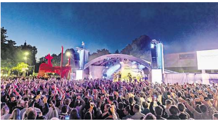
Volle Hütte: Die Veranstalter rechnen mit Hunderttausenden Besuchern zum Maschseefest.