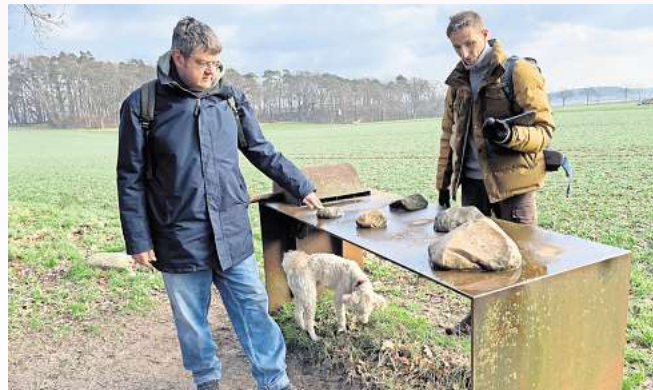
Bei eisigen Temperaturen liefen die Köpfe heiß beim gemeinsamen Ideen sammeln für den „Digitalen Geopfad“.

Wer die Qualität ihrer gemeinsamen Arbeit kennenlernen will, kann sich direkt an die Agentur mit Sitz in der Wedemark wenden: Hasenpaß 16, Bissendorf Mobil: 0176 48 63 05 26 E-Mail: martin@herrstratmann.de Internet: www.herrstratmann.de