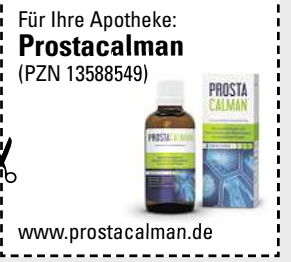
Abbildung Betroffenen nachempfunden PROSTACALMAN. Wirkstoffe: Serenoa repens, Pareira brava, Populus tremuloides. D3. Prostacalman wird angewendet entsprechend den homöopathischen Arzneimittelbildern. Dazu gehören: Blasenentzündungen und Beschwerden beim Wasserlassen, bei vergrößerter Prostata. www.prostacalman.de • Zu Risiken und Nebenwirkungen lesen Sie die Packungsbeilage und fragen Sie Ihre Ärztin, Ihren Arzt oder in Ihrer Apotheke. • PharmaSGP GmbH, 82166 Gräfelfing

Häufiger Harndrang, der Urin kommt nur noch tropfenweise oder die Blase fühlt sich nicht entleert an? Schuld daran ist oft die Prostata. Dieses sogenannte „Männerorgan“ kann mit zunehmendem Alter wachsen und dadurch die Harnröhre blockieren. Experten haben ein Arzneimittel namens Prostacalman entwickelt, das gleich drei Wirkstoffe in sich vereint: Serenoa repens, Pareira brava und Populus tremuloides. Diese Arzneistoffe sind dafür bekannt, u. a. den nächtlichen Harndrang zu reduzieren, den Urinfluss zu verstärken und den Restharn in der Blase zu verringern. Genial: Prostacalman beeinträchtigt nicht die Sexualfunktion. Das Arzneimittel ist rezeptfrei in jeder Apotheke erhältlich.