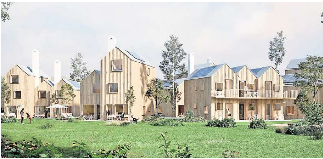
Rossmann plant Ökosiedlung für Burgwedel: So soll das geplante Wohnquartier Am Mühlenfeld nach Entwürfen des Berliner Büros Büro J.Mayer.H aussehen.