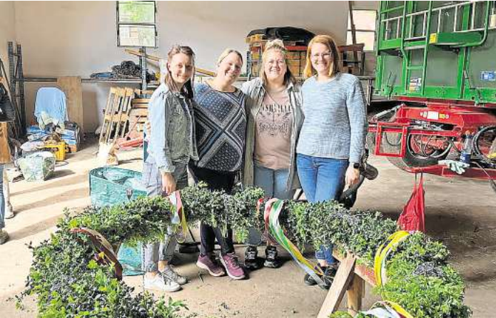
Aktivitäten für das Dorf und seine Bevölkerung organisieren: Das ist der Satzungszweck des Traditionsvereins Negenborn, den der Vorstand auch noch 45 Jahre nach der Gründung mit Ausrichtung des Osterfeuers, des Maibaumfestes und vielen anderen Aktivitäten umsetzt.

Viel Austausch läuft im Dorf auch über eine Whatsapp-Gruppe. „Was wir irgendwie hinkriegen, setzen wir um. Das ist herausfordernd, aber macht unheimlich viel Spaß“, versichert die ambitionierte Vorsitzende. „Dieses Gefühl, wenn man nach der Veranstaltung aufgeräumt hat und weiß, man hat wieder was geschafft – das gibt einen tollen Motivations Schub“, sagt sie. Helfer sind dabei immer gerne gesehen: „Wir freuen uns über jeden, der anpackt, dann können wir mehr fürs Dorf schaffen und Neues ausprobieren“, sagt auch Kleinert, und fügt hinzu: „Zum Beispiel im Winter einen Spieleabend.“