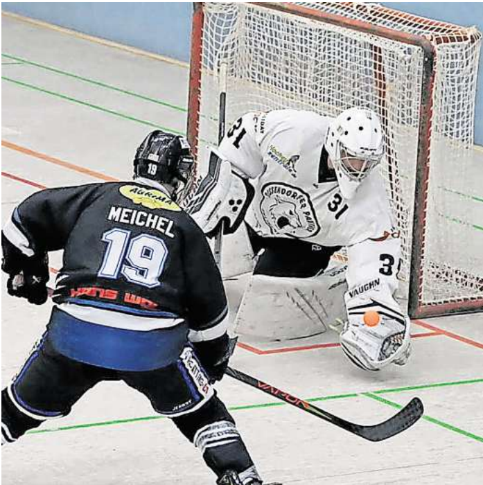
Die Bissendorfer Panther holten im jüngsten Heimspiel wichtige Punkte.