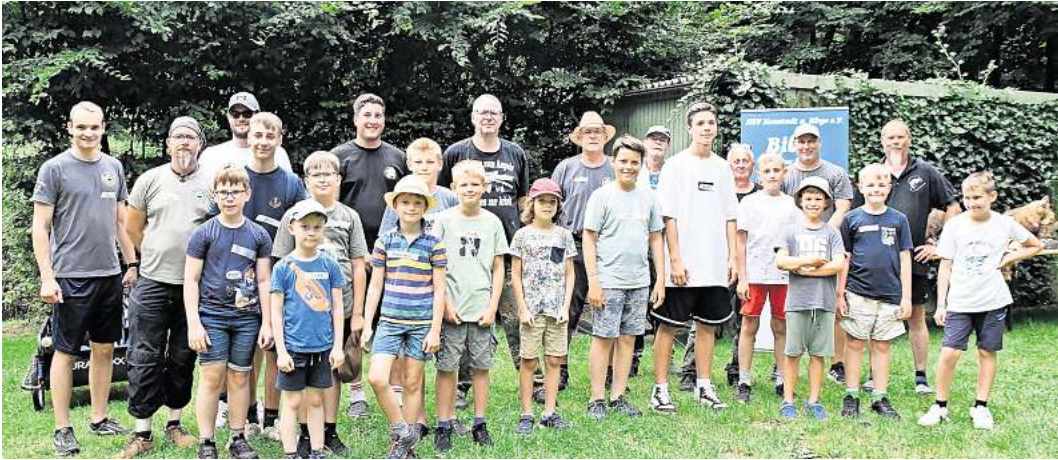
Gruppenbild mit Anglern: Zum Abschied stellt sich die Gruppe zum Erinnerungsfoto auf.