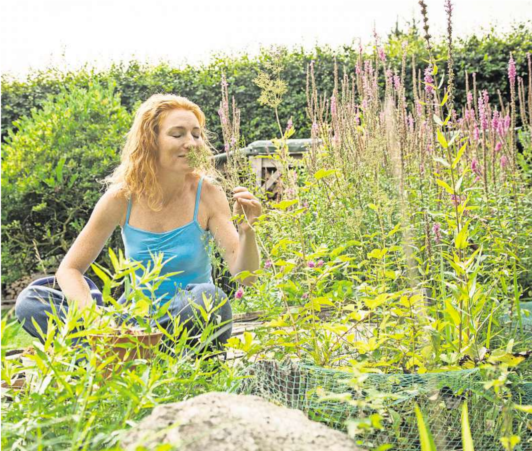
Mischkultur lautet das Zauberwort: Wo möglichst viele verschiedene Pflanzen wachsen, haben es Schädlinge schwerer.

Röde rät, die Beete etwas höher als den Rasen anzulegen und die Rasenfläche mit einem Höhenprofil anzulegen. So wird Wasser gesammelt, statt abzufließen. Schattige Bereiche helfen zusätzlich, den Wasserverbrauch zu senken und das Mikroklima durch mehr Luftfeuchtigkeit zu verbessern.