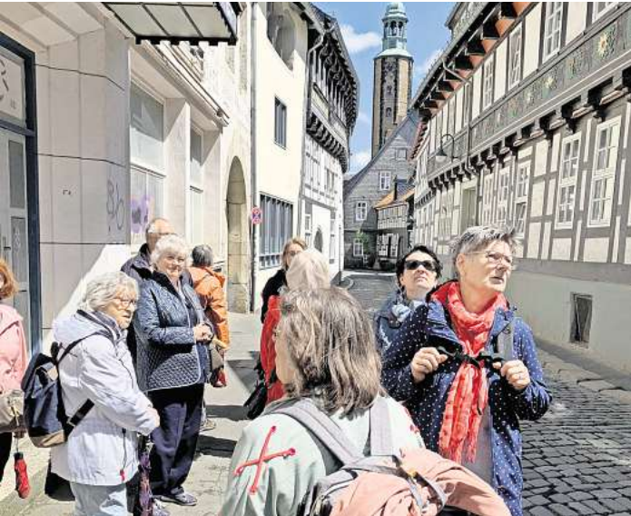
Die Goslarer Altstadt stand auch auf dem Programm.

MELLENDORF (OK). Hier wurden schon Kaiser und Könige gekrönt. Einen Ausflug nach Goslar unternahm jetzt der Bürger- und Verschönerungsverein Mellendorf. Die Reisenden erfuhren viele interessante Details über die Stadt und ihre Geschichte. Die Wassermühle, das Stammhaus der Familie Siemens und das ehemaligen Hospital waren beeindruckende Beweise der großen Bedeutung, die die Stadt Goslar schon im Mittelalter und zur Zeit der industriellen Revolution hatte. Nach dem Besuch der Altstadt ging es auf den Rammelsberg. Rammelsberg und Roeder-Stollen gehören heute zum UNESCO-Welterbe. Nach einem Abendessen in Hildesheim endete der ereignisreiche Tag.