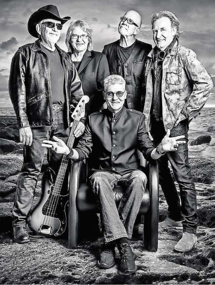
Green River Gang.