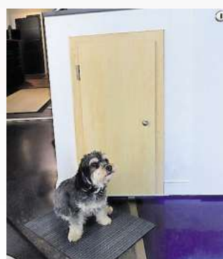
Auch Sonderanfertigen, wie diese kleine Tür – hier mit Familienhund Cooper – sind kein Problem für den Fachbetrieb.