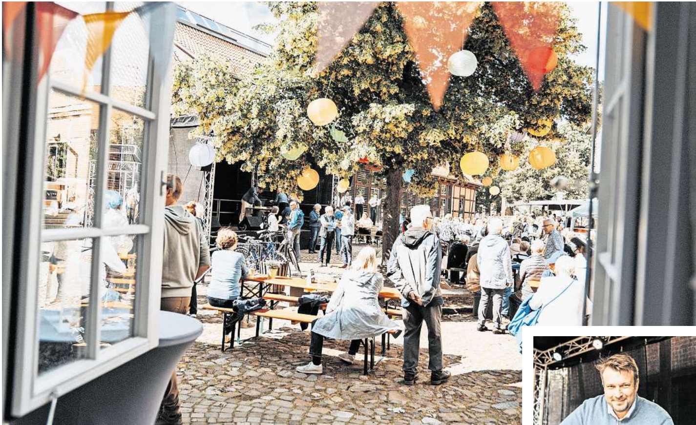
Zahlreiche Besucher kamen zur Einweihung des sanierten Amtshauses in Bissendorf.

Über 1000 Gäste genossen ein abwechslungsreiches Programm