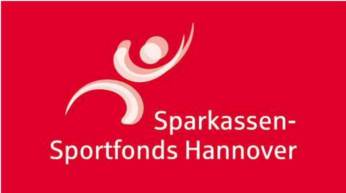
Sparkassen-Sportfonds Logo.

• RVC Wedemark im Turnclub Bissendorf: Der Verein möchte mit jungen talentierten Voltigierern und Voltigierern ein Juniorteam aufbauen, das auf Leistungssport-Niveau voltigiert. Das Team benötigt ein gutes und leistungsstarkes Pferd für den Spitzensport, da das vorhandene Voltigierpferd aus Altersgründen ausscheiden wird. Der Sportfonds unterstützt mit 2.000 Euro.