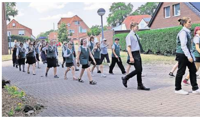
Am Sonntag marschieren die Schützen durchs Dorf.