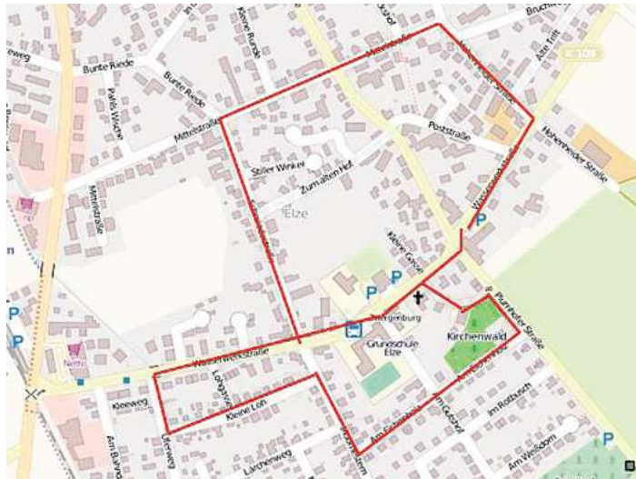
Die Marschfolge beim Festumzug des Elzer Schützenfestes am 8. Juni.

18.00 Uhr: Königsvesper und Ausklang im Gasthaus Goltermann