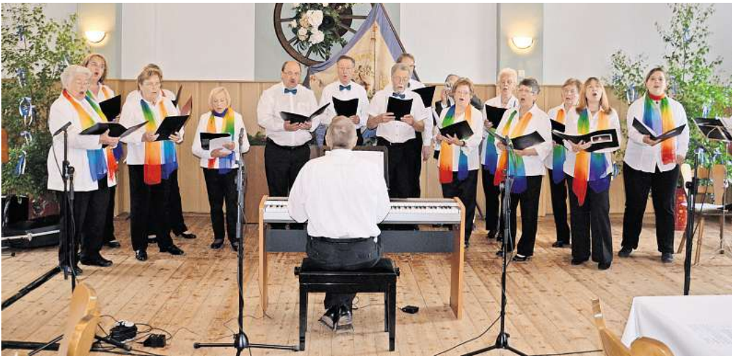
Der Wennebosteler Chor feiert seinen 120. Geburtstag mit einem Volksliedersingen.

Für die passenden Klänge sorgt das Akkordeonorchester Langenhagen. Ehrengast ist die Brelinger Sopranistin Helen Donath. Neben dem Geburtstagskind, dem gemischten Chor Wennebostel, sind auch der Mellendorfer Singkreis, der Bissendorfer Chor More Music, der Gemischte Chor St. Martini Brelingen und der Ukrainische Chor Kalyna dabei. Nach einem gemeinsamen Schlusslied aller Chören stimmen alle gemeinsam mit den Gästen das Wedemark-Lied an.