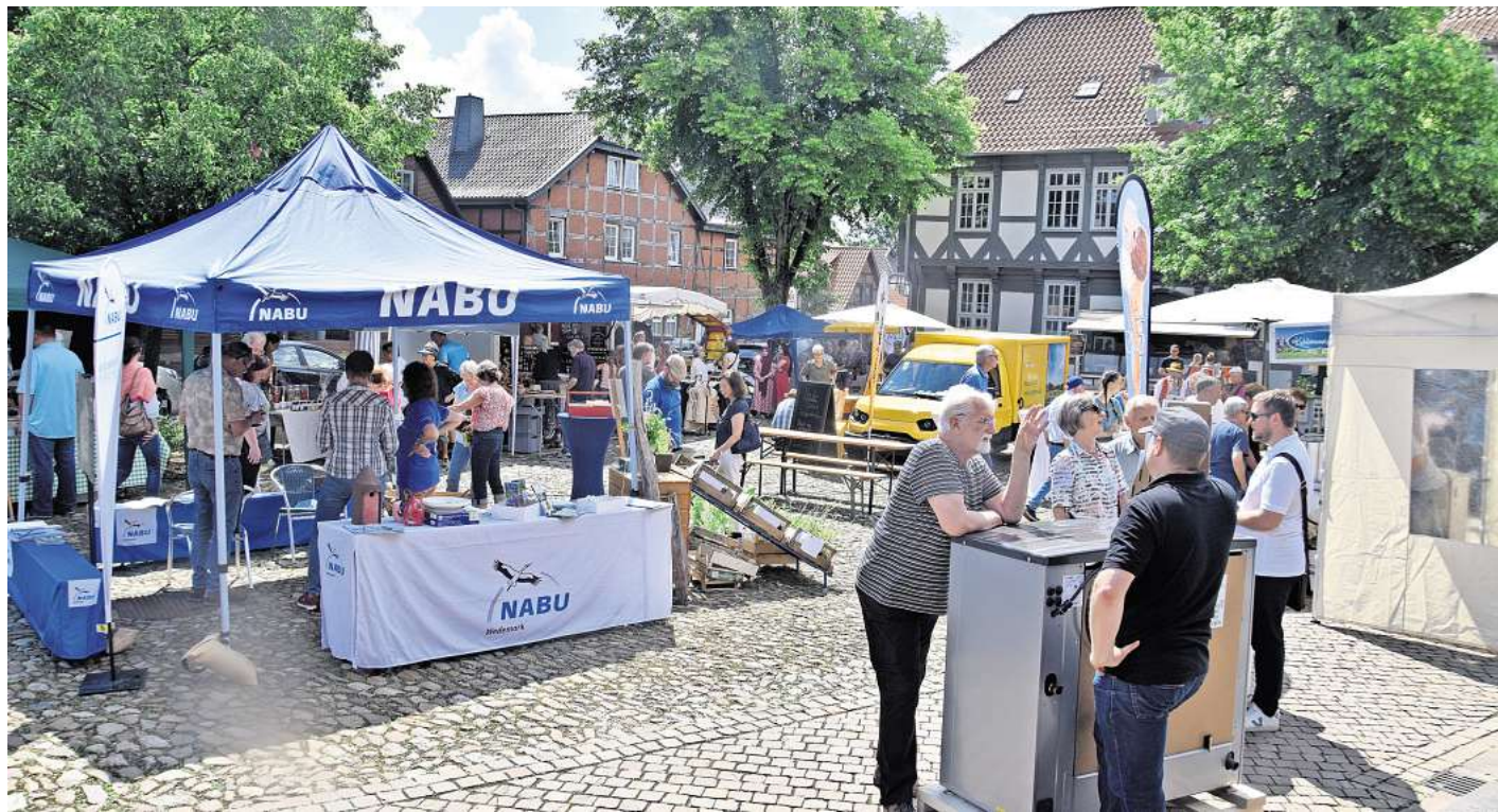
Ökomarkt auf dem Amtshof: Auch in diesem Jahr punktete die Traditionsveranstaltung von Bündnis90/ Grüne wieder mit ihrer Vielfalt bei den Besuchern.

Seit mehr als 20 Jahren lockt die Vielfalt der Traditionsveranstaltung Besucher nach Bissendorf