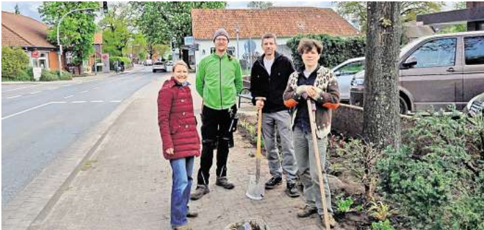
Der Bürger- und Verschönerungsverein Mellendorf hat die Beete vor der Post und der Volksbank neu bepflanzt.