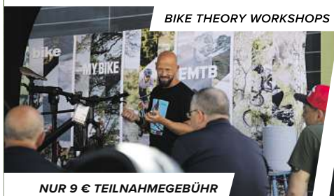
BIKE THEORY WORKSHOPS

Von Alltag bis Trail - sportliche E-MTB Power überall