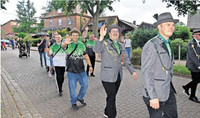
Schützenfest Bissendorf 2024