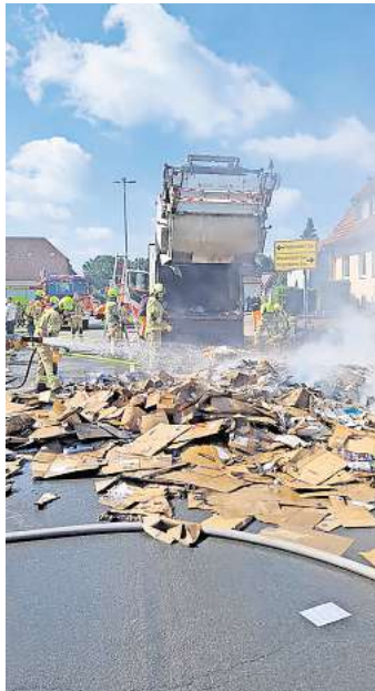
Der Müllwagen entleerte seine brennende Papierladung auf die Bennemühlener Straße, wo die Feuerwehr sie ablöschte.

BRELINGEN. Die Feuerwehren Brelingen und Mellendorf wurden am Donnerstagvormittag letzter Woche gegen 10 Uhr zu einem brennenden Müllwagen in die Bennemühlener Straße kurz vor der Kreuzung zur Hauptstraße in Brelingen alarmiert. Mitarbeiter eines Entsorgungsunternehmens hatten während der Fahrt festgestellt, dass Rauch aus dem Laderaum ihres Müllwagens aufsteigt. Das geladene Altpapier hatte sich entzündet. Die Mitarbeiter stoppten ihr Fahrzeug und entluden das Altpapier auf die Straße. So konnte eine Brandausbreitung auf das Fahrzeug verhindert werden. Durch die Feuerwehr wurde das Papier auseinandergezogen und mit Wasser abgelöscht. Nach etwa 1,5 Stunden konnten die knapp 20 Einsatzkräfte die Einsatzstelle wieder verlassen. Während der Lösch- und Aufräumarbeiten kam es zu Verkehrshinderungen im Bereich Hauptstraße/Bennemühlener Straße.