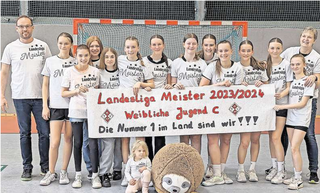
Zufriedene Gesichter bei der weiblichen Handball-C-Jugend. Mit der Meisterschaft feiert die Handballsparte des Mellendorfer TV den wohl größten sportlichen Erfolg in Ihrer 50-jährigen Geschichte.