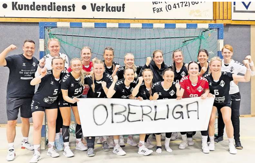
Die 1. Handballdamen des MTV Mellendorf haben es geschafft: Sie spielen die nächste Saison in der Oberliga.

MELLENDORF. Am 25. Mai fand in Eyendorf die Damen-Oberligaqualifikation des Handballverbands Niedersachsen-Bremen (HVNB) statt. Auch die 1. Damen des Mellendorfer TVs, die schon den Verbandsligaaufstieg geschafft hatten, durften durch die Vizemeisterschaft in der Landesliga Mitte daran teilnehmen. Die Damen hatte für diesen großen Tag extra einen Bus für die Mannschaft und ihre Fans organisiert und so ging es um 12 Uhr los in Richtung Eyendorf. Am Turnier in der Gerhard-Langer-Sporthalle nahmen außer dem gastgegebenen MTV Eyendorf und dem Mellendorfer TV auch die Mannschaft des Elsflether TBs teil. Die Qualifikation wurde in Turnierform jeder gegen jeden mit einer Spielzeit von je 2 x 20 Minuten gespielt. Vor dem Turnier war schon klar, dass von den drei teilnehmenden Mannschaften die ersten beiden Mannschaften die Qualifikation schaffen. Das erste Spiel bestritten der Heimverein MTV Eyendorf gegen den Elsflether TB. Die Gastgeberinnen konnten sich schnell mit 5:1 absetzen, mussten zur Halbzeit aber die Gegnerinnen auf 7:5 herankommen lassen. Allerdings war dies nur ein kurzes Strohfeuer, denn am Ende setzte sich der MTV Eyendorf mit 14:6 durch und machte damit schon einen