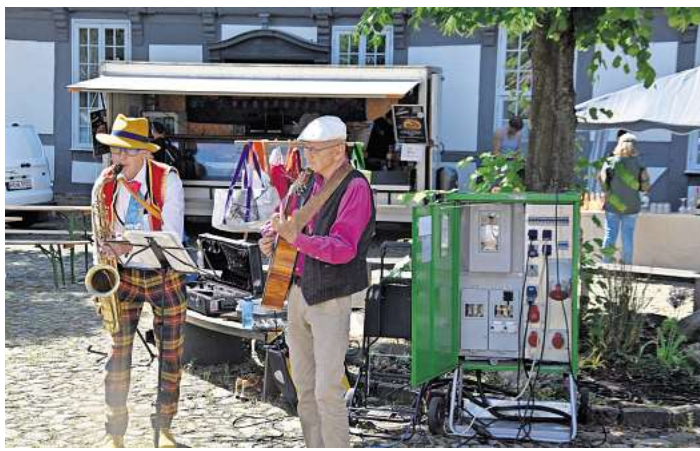
Musik darf nicht fehlen: Die beiden Saxophonisten gehören schon zum Inventar des Ökomarkts in Bissendorf, sorgen für angenehme Hintergrundmusik, bei der man sich noch unterhalten kann.

Entspannt schlenderten die Besucher über den Amtshof mit seinem alten Kopfsteinpflaster, blieben mal hier oder da stehen, fragten nach, kauften das eine oder andere und gingen nicht, ohne sich gestärkt zu haben. Ökomarkt auf dem Amtshof – das ist einmal im Jahr einfach ein absolutes Muss, waren sich alle einig.