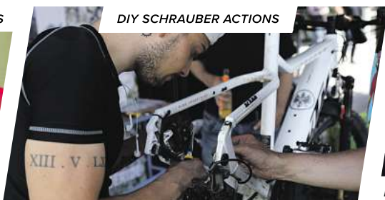
DIY SCHRAUBER ACTIONS