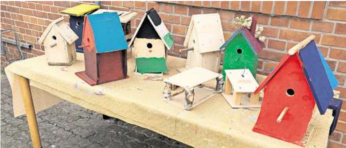
Tolle, farbenfrohe Nistkästen kamen bei der Aktion zustande.