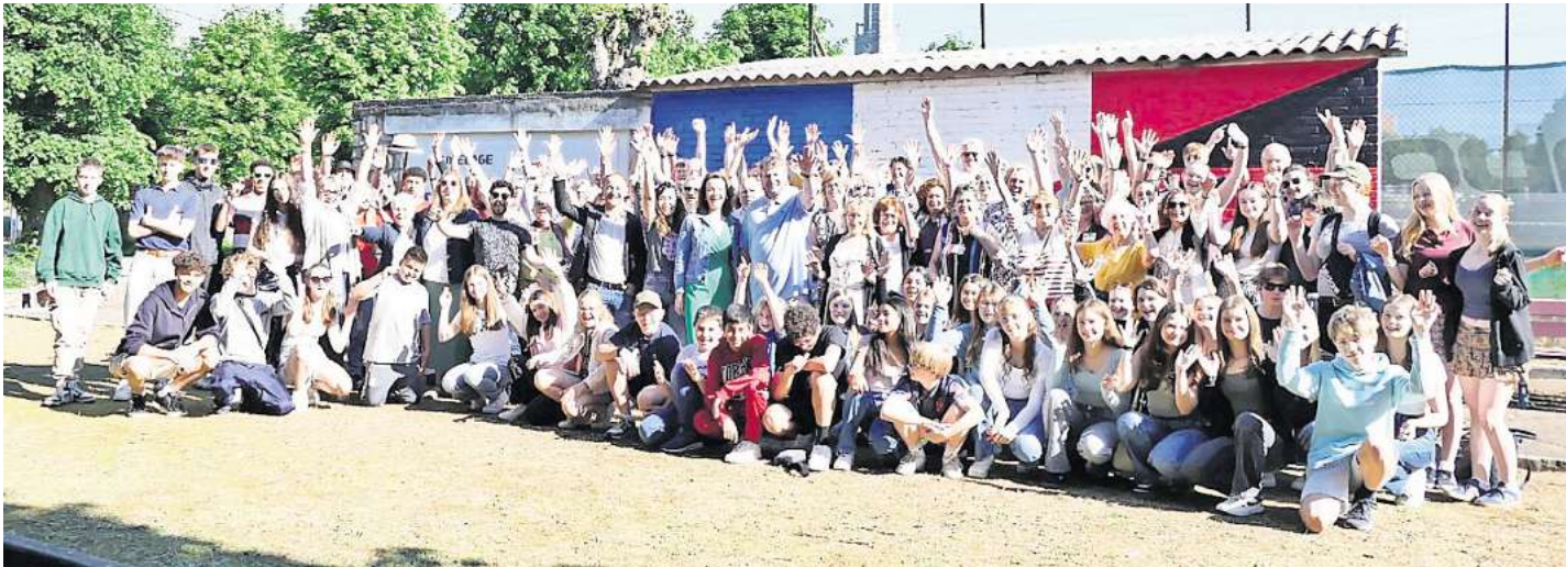
Eine große Delegation aus der Wedemark wurde in Roye herzlich empfangen.

Große Delegation reist aus der Wedemark nach Roye zur Jubiläumsfeier