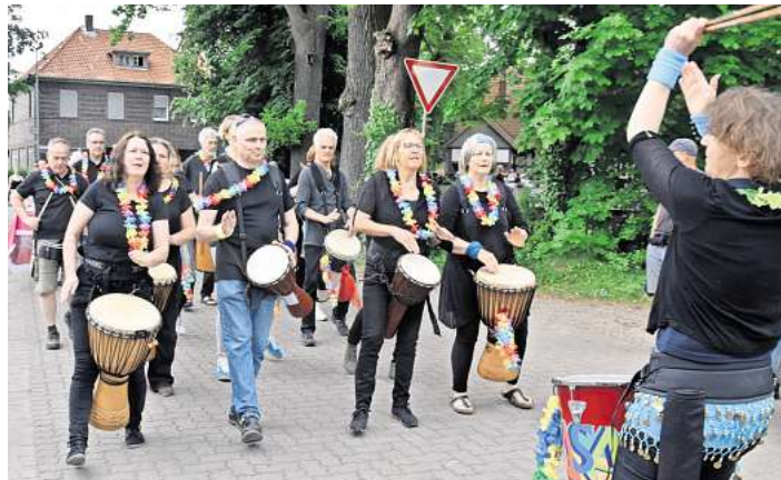
Viele Interessierte folgen: Die Karawane, die sich am Sonntagmorgen durch Brelingen zieht, ist lang.

Brelingen legt mit seiner aktuellen Pfingstveranstaltung „Kultur im Dorf“ die Messlatte noch mal ein Stück höher