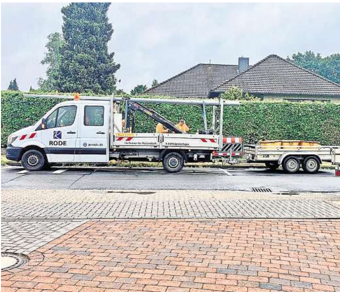
Bereits letzte Woche hat energcity Laternenmasten in der Osterbergstraße ausgetauscht.