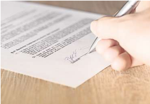
Kann man von einem Bauvertrag zurücktreten?

heitseinbehalt sowie Datum und Unterschriften des Bauunternehmers und Auftraggebers. Man sieht, ein Bauvertrag ist sehr umfangreich. Das liegt mitunter daran, dass ein Hausbau kosten- und zeitintensiv ist. Besonders deshalb sollten Rücktrittsrechte bereits im