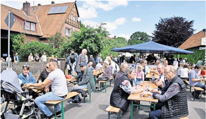
Die Wasserwerkstraße wird während des Spargelfestes zur Schlemmermeile im Ort.