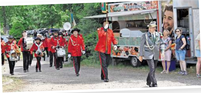
Verschiedene Spielmannszüge sorgen für den passenden Rahmen.

zelt gibt es ab 15 Uhr Kaffeeeklatsch mit leckeren selbst gebackenen Torten. Der Festumzug trifft gegen 16.30 Uhr dort wieder ein. Dann beginnt das Platzkonzert der Kapellen. Essenmarken gibt es nur im Vorverkauf bis 18. Mai an den bekannten Stellen.