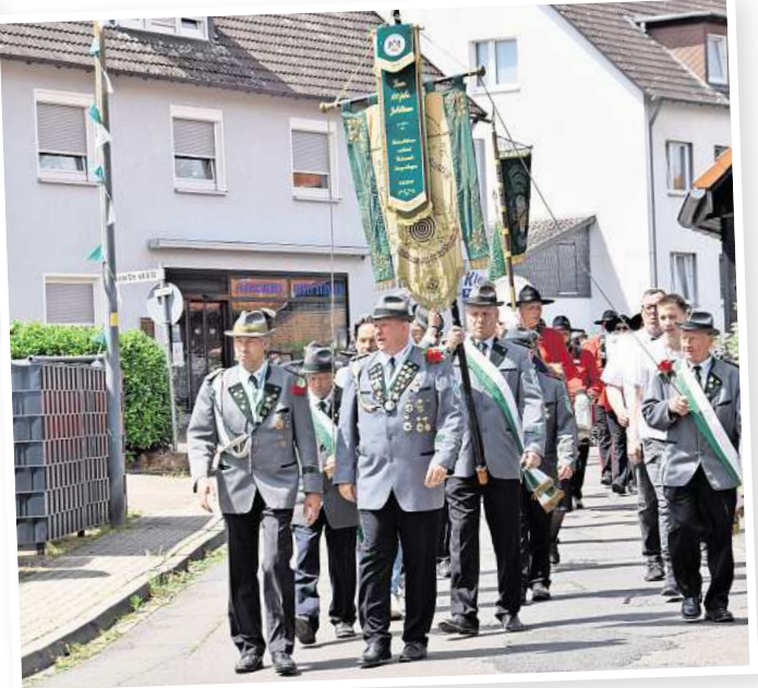
Die Schützen auf dem Weg zum Abholen des Ortsrates.