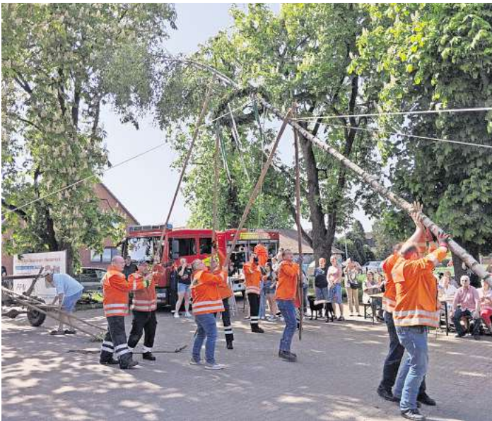
Die Feuerwehr Abbensen beim Aufrichten des Maibaums.