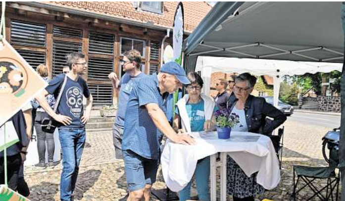
Ins Gespräch vertieft: Die BürgerEnergieWedemark wirbt beim Ökomarkt um weitere Mitsstreiter.