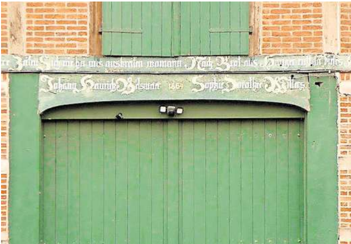
Wer weiß, an welchem Hof in Elze dieses Detail zu finden ist?

ELZE. Damit die Elzer in Zukunft mit noch offeneren Augen durch ihr Dorf gehen, wird jeden Monat ein Suchbild mit dem Detail eines Hauses oder einer Hofanlage veröffentlicht. Dieses Merkmal ist von der Straße aus zu erkennen, so dass das jeweilige Grundstück nicht betreten werden muss. Das Suchbild hängt auch im Schaukasten des Verein, Dorfbild Elze, Wasserwerkstraße 21/21 a. Die richtige Lösung kann bis zum Monatsende per E-Mail an ehtheilmann@dorfbild-elze.de geschickt oder in den Briefkasten von Wasserwerkstraße 21 oder 23 eingeworfen werden. Der Gewinner oder die Gewinnerin wird unter allen Einsendungen durch Los bestimmt und bekommt einen kleinen Preis in Form von Naturalien aus Elze. Auch die Mauern neuer Häuser werden wieder mit phantasievollen Details geschmückt. Das Motiv aus dem letzten Monat findet