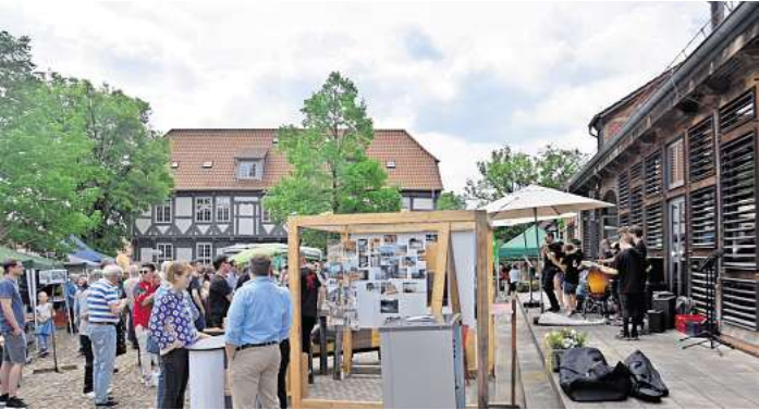
Viele Vereine und Institutionen nutzen den Ökomarkt, um ein breites Klientel zu erreichen und über ihre Anliegen zu informieren.