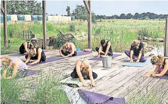
Trainieren, Natur und Genuss – TRAIN & CHILL ist ein Modus mit Schöner Aussicht.

Trainieren, Natur und Genuss – TRAIN & CHILL ist ein Modus mit Schöner Aussicht.