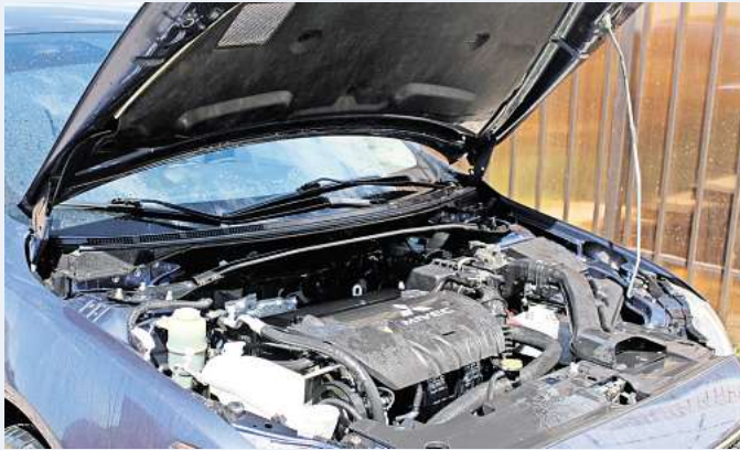
Kfz-Experten geben Auskunft, ob sich die Reparatur lohnt oder man bessere Neukauf erwägen sollte.

Die Zukunft scheint im Zeichen der Elektromobilität zu stehen. Wer bereits mit der Anschaffung eines Elektroautos oder generell eines Neuwagens liebäugelt, der sollte sich beim Frühjahrscheck in der KfzWerkstatt erkundigen, wie der Zustand des Autos von einem Experten eingeschätzt wird. Die