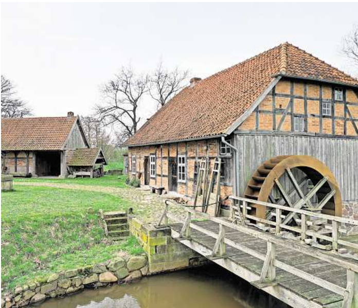
Die alte Wassermühle in Vesbeck präsentiert sich beim Mühlenfest am Pfingstmontag.

VESBECK. Am Pfingstmontag, 20. Mai, ist Mühlenfest. Dann dreht sich auch die alte Wassermühle in Vesbeck wieder. Das Fest beginnt mit einem Gottesdienst mit Taufe und Posaunenchor um 10 Uhr. Anschließend präsentieren sich rund um die Mühle die Oldtimerfreunde Schwarmstedt mit historischen Traktoren, es gibt Spinnradvorführungen und Gewürze und Öle. Kuhlmanns Eiswagen sorgt für Erfrischungen. Zur Unterhaltung tragen Seifenblasenkünstler „Roger macht Blau“, Kinderschminken und Spiele mit der Kinderfeuerwehr bei. Und natürlich können auch die Mühlen-technik und die Remise besichtigt werden. Außerdem gibt es geräucherte Forellen, gegrillte Leckereien, Kaffee und hausgemachte Tortenträume.