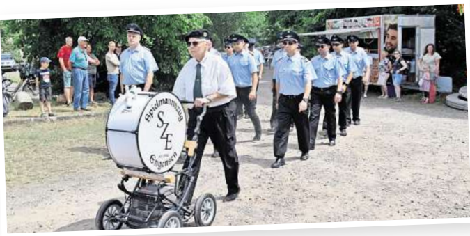
Mit Musik werden die Vereine aufs Festzelt begleitet.