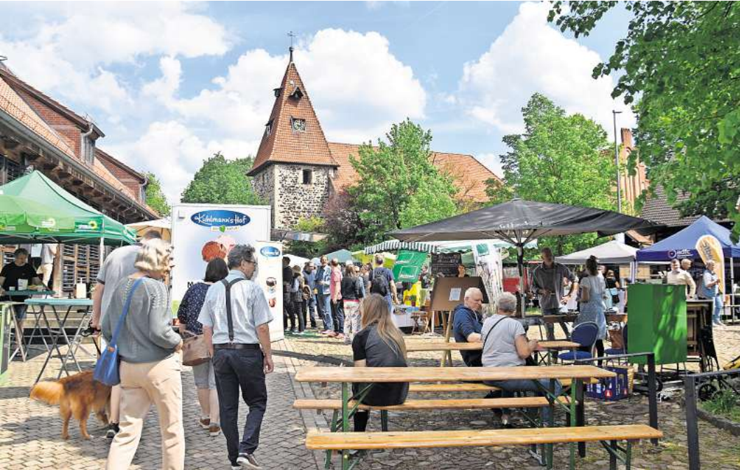
Der Amtshof bietet das perfekte Ambiente für die Präsentation ökologischer Produkte.

Traditionsveranstaltung auf dem Bissendorfer Amtshof seit mehr als 30 Jahren