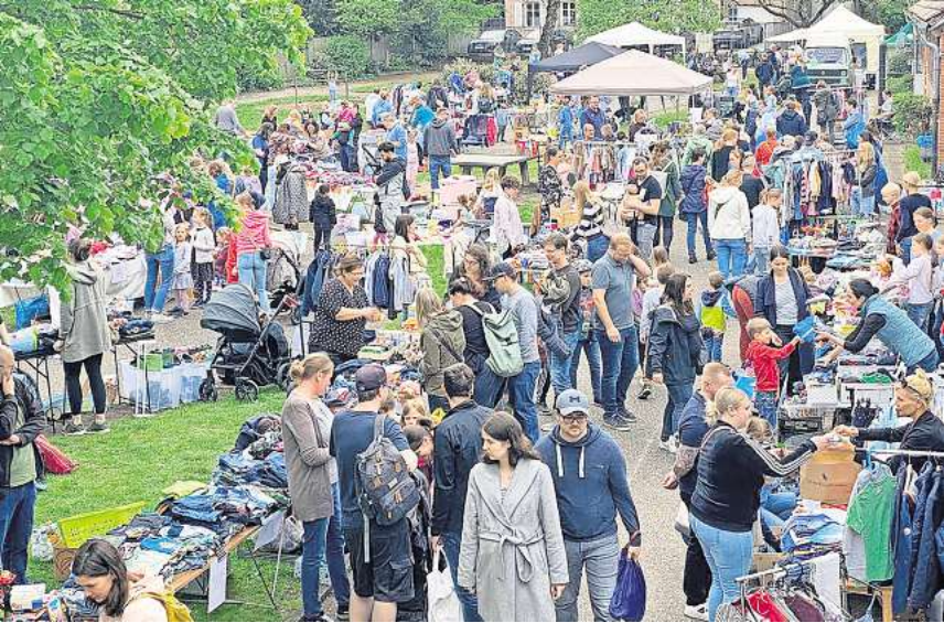
Kinderflohmarkt in der Henstorf-Kita in Bissendorf: Viele Besucher durchstöberten das umfangreiche Angebot.

von der Kinder- und Jugendkunstschule Wedemark durchgeführt wird, sowie in Gokarts, die der Hort anschaffen möchte. Der Vorstand des Fördervereins bedankt sich bei allen Verkäufern, Helfern, Muffinspendern und natürlich auch bei allen Besuchern, die zu der guten Stimmung beigetragen haben. Wer den Verein in Zukunft unterstützen möchte, kann unkompliziert über die Vereinshomepage www.foerderverein-henstorf.de Mitglied werden.