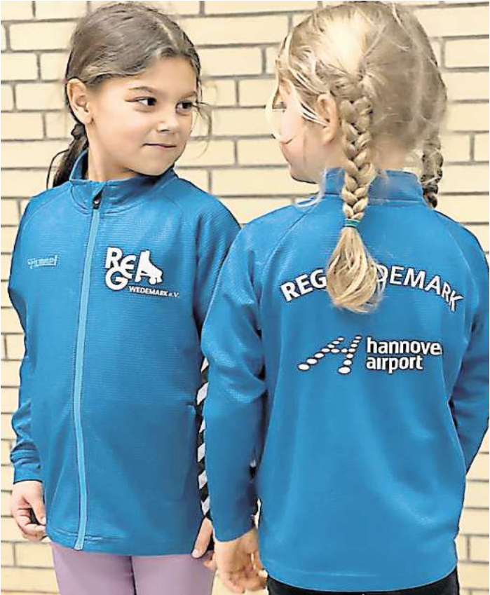
Die REG Wedemark präsentiert sich 2024 modern in neuen Vereinsjacken mit neuem Logo.

Ein großes Problem stellt weiterhin die Renovierung der Wedemarkhalle statt, die seit den Sommerferien 2021 läuft. Um Küren aufzubauen und an Wettbewerben teilzunehmen, mussten seitdem größere Hallen außerhalb der Wedemark angemietet werden. Auch der 7. Heidepokal, der nach vierjähriger Pause am 2. und 3. September letzten Jahres wieder stattfinden konnte, wurde in einer Sporthalle in Großburgwedel ausgetragen. An diesem Großereignis nahmen ca. 250 TeilnehmerInnen aus ganz Niedersachsen teil. Nur durch die Einnahmen aus der Ausrichtung dieses Wettbewerbs konnten die erhöhten Hallenmieten annähernd aufgefangen werden. Weiterhin waren die LäuferInnen der REG bei zahlreichen Wettbewerben erfolgreich. Die neue