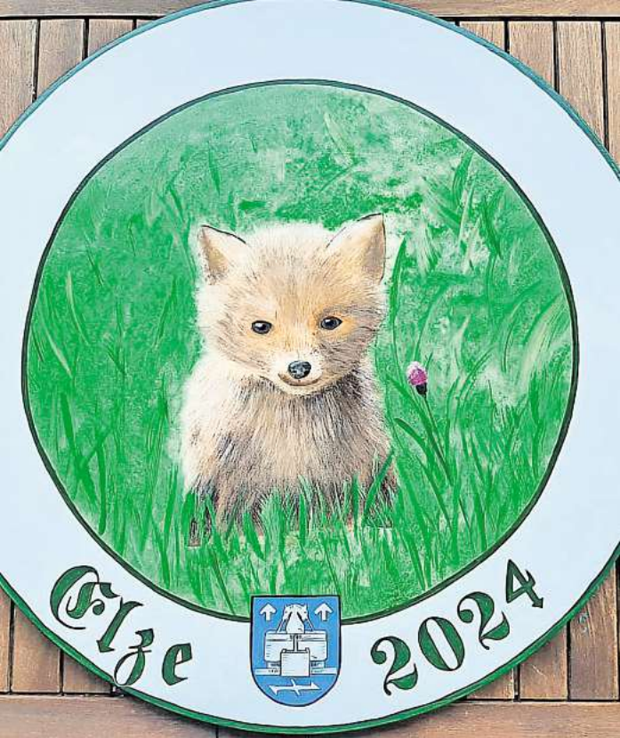
Das sind die aktuellen Scheiben, um die es beim Königsschießen in Elze geht.

ne bei der Organisation, wenn der Festumzug zum Anbringen der Königsscheibe kommt. Für Kids ab zwölf Jahren benötigt der Schützenverein eine Einverständniserklärung der Eltern, die diese auf der Homepage www.sv-elze-wedemark.de herunterladen können. Gleichzeitig findet am Sonntag, 26. Mai, von 14 bis 17 Uhr das Bürgerkönigsschießen statt, dann sind alle Elzer Bürgerinnen und Bürger herzlich willkommen um die Bürgerkönigsscheibe/-königsscheibe zu ringen. Auch für die Großen gilt Spaß, Freude und sportlicher Erfolg. Die Scheibe am Haus soll Glück und Freude bringen und alles Unheil von ihren Bewohnern fernhalten, so ist es schon seit mehr als einhundert Jahren Brauch, nicht nur in Elze. Am Sonntag erwartet Sie auch ein herrliches Kuchenbuffet. Hierfür freut sich der Schützenverein sehr über fleißige Kuchenbäckerinnen/-bäcker. Diese können sich gerne bei Renate Bulitz unter Telefon (05130) 51 80 oder Kirsten Kiegeland unter Telefon (05130) 41 75 melden. Der Schützenverein Elze freut sich auf Ihre Teilnahme am Familienschützenfest vom 8. bis 9. Juni auf dem Parkplatz des Gasthauses Goltermann in Elze.