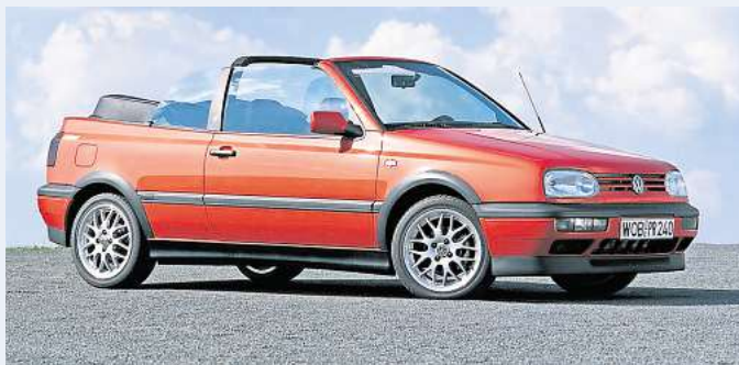
Das Golf Cabrio ist seit vielen Autogenerationen ein beliebtes Fahrzeug.