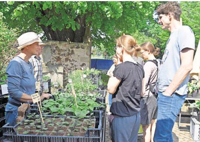
Kräuter und Pflanzen sind auf dem Ökomarkt immer ganz besonders gefragt.