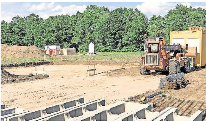
Die Wählergemeinschaft kritisiert den hohen Flächenverbrauch durch neue Baugebiete wie hier in „Neues Land“ in Resse.

WEDEMARK (kra). Es wird immer mehr gebaut, auch in der Wedemark. Doch versiegelte Flächen gefährden den Klimaschutz und begünstigen Hochwasser. Deshalb will die Wählergemeinschaft WPW den Flächenverbrauch begrenzen. Versiegelte Flächen sind klimaschädlich, denn sie erwärmen sich stärker und verhindern das Versickern von Regenwasser. Was erst jüngst im Zuge des Weihnachtshochwassers wieder stärker in Bewusstsein gerückt ist. Und obwohl in der Gemeinde Wedemark viele Ansätze zum Hochwasserschutz verfolgt werden, werden auch weiterhin viele Flächen versiegelt. Die Wählergemeinschaft Pro Wedemark (WPW) will eine deutliche Begrenzung des Flächenverbrauchs erreichen und fordert daher ein Moratorium für die Ausweisung neuer Baugebiete. Wohnraum wird dringend benötigt, auch in der Wedemark, weshalb gerade in den vergangenen Jahren immer mehr Neubaugebiete ausgewiesen wurden. „Wir wollen keinen Entwicklungsstopp“, betonte daher auch Maggie Garland, die für die WPW im Gemeinderat sitzt, „sondern die Herausforderungen besonnen und vernünftig gestalten.“ Die Herausforderungen: Zwischen 2011 und 2022 habe der Flächenverbrauch in der Wedemark laut dem Landesamt für