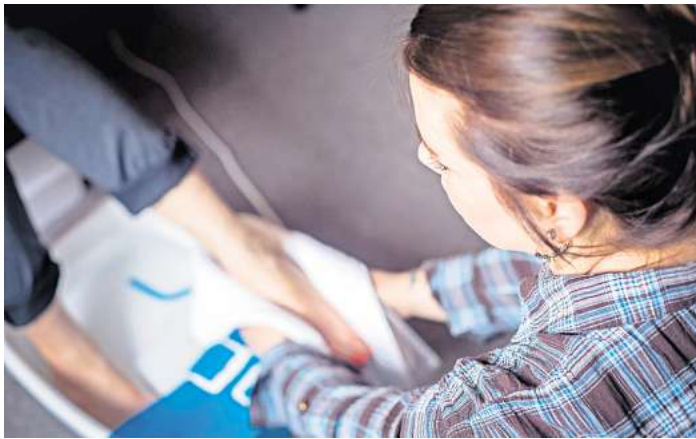
Für ansehnliche Füße im Sommer ist eine gute Fußpflege wichtig.

Im Sommer werden wieder die Füße gezeigt. Mit der richtigen Fußpflege und dem passenden Nagellack aus den Geschäften für Kosmetik sehen sie in den neuen Sommersandalen gepflegt und ansehnlich aus. Während der Wintertage waren sie in dicken Stiefeln und Hausschuhen versteckt, nun gönnen nicht wenige ihren Füßen zum Auftakt des Sommers eine professionelle Pediküre im örtlichen Beautysalon. Die Pflege der Nägel sowie die Entfernung der Hornhaut gehören unter anderem zur kosmetischen Fußpflege. Als Schunden werden die kleinen, spaltförmigen Risse an der Haut bezeichnet, die häufig an den Fersen entstehen. Aufgrund der per-