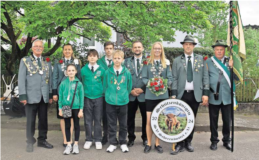
Majestäten und Preisträger in Scherenbostel: Das erste Schützenfest der Saison in der Wedemark war bei bestem Wetter gut besucht.