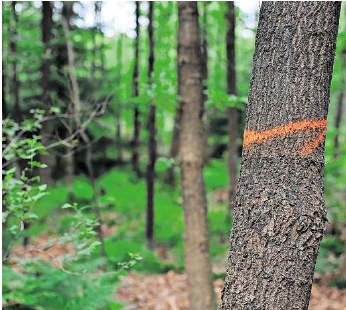
Im Territorium der Revierförsterei Resse müssen einige Eichen gefällt werden, damit die verbleibenden Bäume stark heranwachsen können. Daher sind jetzt umfangreiche Pflegearbeiten mit einem kleinen Harvester geplant. Das gibt auch Brennholz für den Verkauf. Foto: Landesforsten (Symbolbild)

Thomas Deppe setzt bei der Waldpflege auf einen speziell ausgerüsteten kleinen Harvester ein, eine Spezialmaschine. Sehr pfleglich entnimmt dieser zunächst die Kronen der Bäume im oberen Bereich und legt diese vorsichtig ab, damit an den verbleibenden Bäumen keine Schäden entstehen. Danach wird der Reststamm abgesägt und eben-