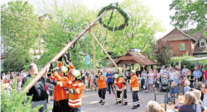
Aktive der Brelinger Feuerwehr richten den Maibaum vor der Brelinger Mitte auf.

BRELINGEN. Ob „Der Mai ist gekommen“ oder „Yellow Submarine“ von den Beatles, der Männergesangsverein Brelingen kann beides. Bei ihrer Maibaumfeier vor der Brelinger Mitte begrüßten die Sänger mit diesen und weiteren Liedern die vielen Besucher. Diese verfolgten zunächst das Aufstellen des Maibaumes durch Aktive der Brelinger Feuerwehr und applaudierten dann den Klängen des Posaunenchores der Kirchengemeinde. Der Vorsitzende des Männergesangsver-