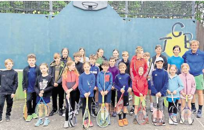
Gut Besucht: Die Saisoneroöffnung bei den Kindern und Jugendlichen des TC Bissendorf.

Nicht-Mitglieder sind ebenfalls herzlich eingeladen, die angebotenen Pizzen, Salate und Pasta-Gerichte auszuprobieren und die gemütliche Atmosphäre auf der Terrasse des TC Bissendorf zu erleben.