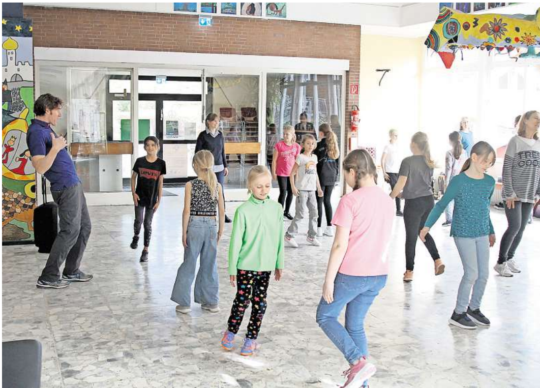
In Bewegung: Die Schüler der Grundschule Resse tanzen den Irish Dance.

O'Malley ist im Rahmen des europäischen Austauschpro-