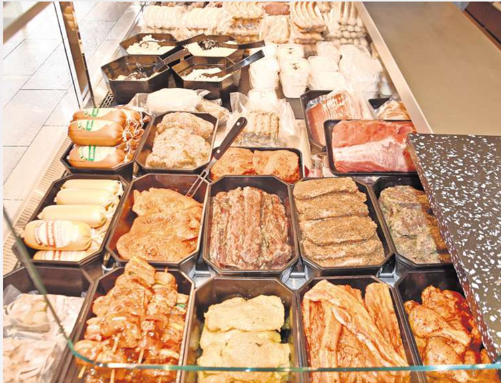
Mit Klemms Spezialitäten in die Grillsaison starten: Die Auswahl an Steaks und Bratwürstchen ist groß.