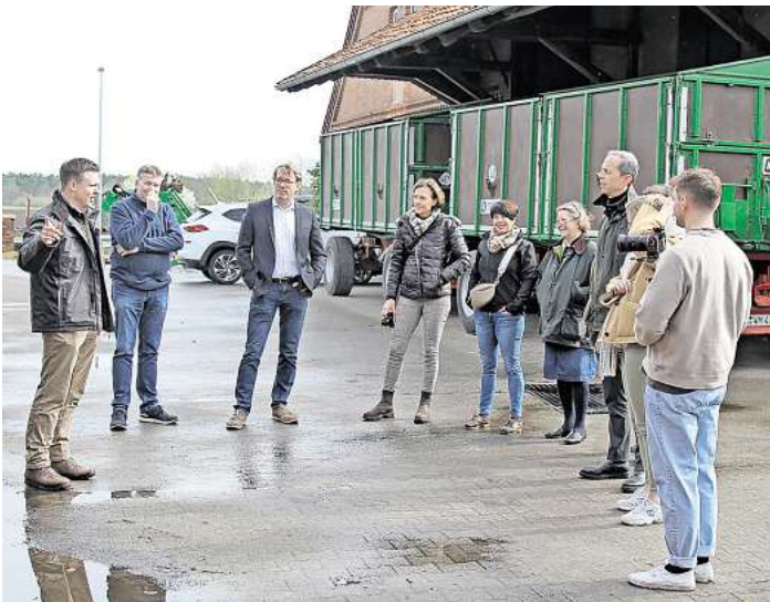
Unterhaltung: Auf dem Hof Klages in Sprockhof fand das Treffen statt.