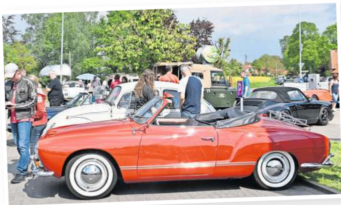
Die gut gepflegten Oldtimer ziehen viele Autofans an.

Eine Anmeldung zu diesem Treffen ist nicht erforderlich. Der Automobil Club Wedemark e.V. im ADAC freut sich auf viele Teilnehmenden mit ihren liebgewonnenen Schmuckstücken auf zwei oder vier Rädern und natürlich auf begeisterte Zuschauer, die sich an der breiten Palette liebevoll restaurierter Fahrzeuge erfreuen und in Erinnerungen an das erste eigene Auto schweifen möchten.