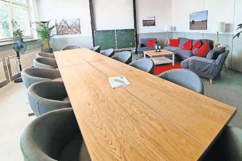
Die Depri-Helden treffen sich im Mehrgenerationenhaus.