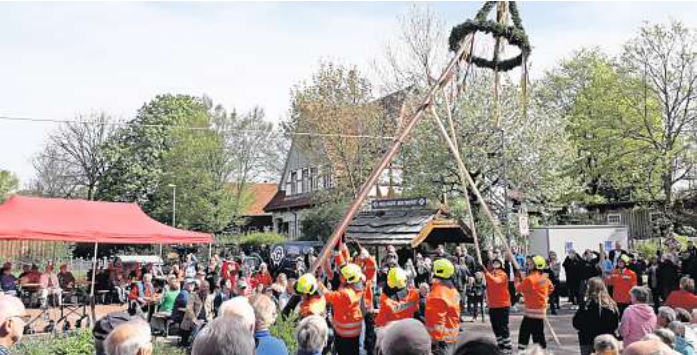
Beim Maibaumaufstellen in Brelingen ist immer was los.

Uhr vor der Brelinger Mitte. Zu dieser öffentlichen Veranstaltung sind interessierte Einwohner eingeladen.