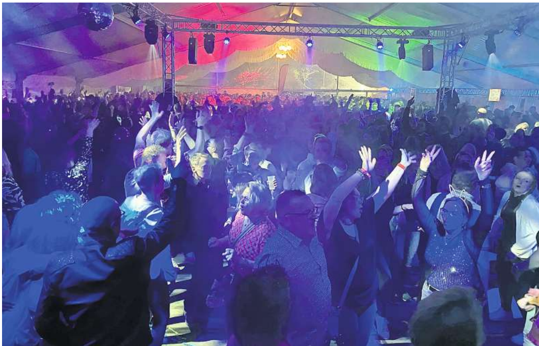
Textsicher: Alle Besucherinnen und Besucher singen auf der Tanzfläche mit.