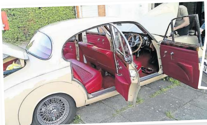
Die DIVA des Ehepaar Heeder trägt ihren Namen zu Recht.