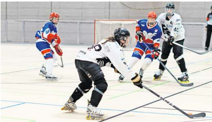
Die Panther zeigten in allen Mannschaften Klasse.

So konnte sich die Bissendorfer Jugend einen 7:5 Sieg erkämpfen und feierte somit den zweiten Erfolg im dritten Auswärtsspiel der Saison. Danach ging es für die Panther Junioren an den Düsseldorfer Bullypunkt. Die Panther-Junioren setzten mit einem 6:10 Sieg ein Statement in