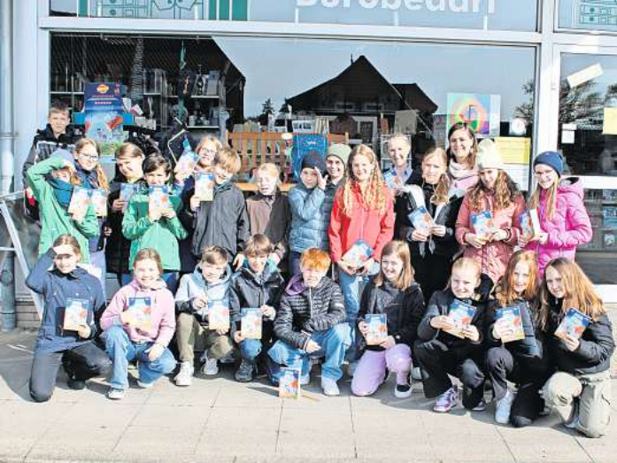
Welttag des Buches: Die Schüler des Gymnasiums machten einen Ausflug zur Mellendorfer Buchhandlung.