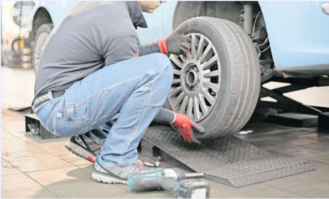
Mit einem Reifenwechsel ist man bestens an die jahreszeittypischen Bedingungen angepasst.

Ähnlich wie mit der Zeitumstellung folgt auch für die Fahrzeugreifen ein Wechsel vom Winter- ins Sommerhalbjahr. Damit man zu jeder Jahreszeit sicher unterwegs ist, müssen die Reifen entsprechend ausgetauscht werden. Doch warum sind überhaupt zwei verschiedene Reifentypen notwendig? Temperaturunterschiede und die Beschaffenheit der Straßen verlangen dem Material viel ab. Sommerreifen bestehen daher aus einem eher härteren Gummigemisch, das auch hohen Temperaturen standhält. Ihr Profil ist so konzipiert, möglichst viel Wasser vom Fahrweg zu verdrängen. Es ist gröber und besitzt mehr Längsrillen.