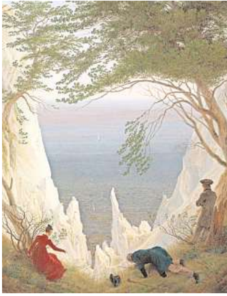
Das Gemälde „Kreidefelsen auf Rügen“ von Caspar David Friedrich.

Abfahrt ist um 7.30 Uhr am Platz vor dem Bürgerhaus, Am