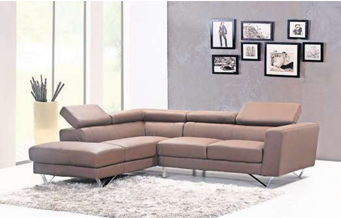
Eine dunkle Wand setzt schöne Akzente im Wohnraum.

Übrigens: Insbesondere kräftige Wandfarben sind eine hervorragende Bühne für gerahmte Bilder. Wählt man helle Rahmen, wird diese Bilderwand zur absoluten Besonderheit im Wohn- oder Schlafzimmer. Ein geräumiger Flur eignet sich ebenfalls. LPS/AM.