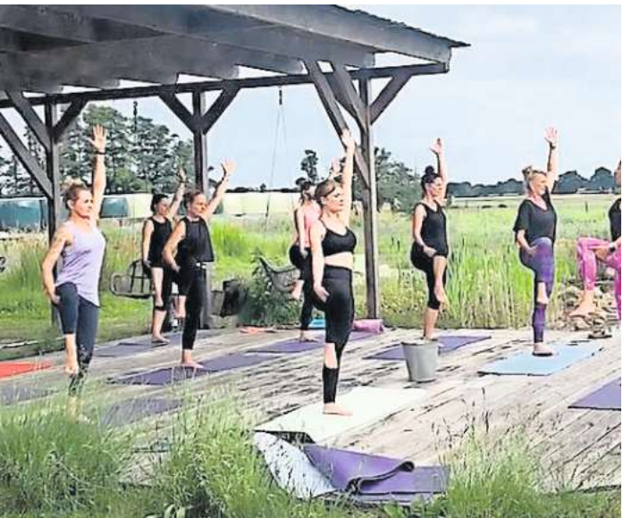
Auf dem Sporthof Schöne Aussicht gibt es interessante Angebote für Yoga-Freunde.

der Sporthof Schöne Aussicht Ausbilderinnen der internationalen Fitnessszene für ein inspirierendes und bewegungsfreudiges Event rund um den Themenkomplex ganzheitliche Fitness. Alle Menschen, die sich für die nachhaltigen positiven Aspekte der ganzheitlichen Bewegung interessieren (Trainer und Teilnehmer von Gruppenfitnesskursen) kommen auf ihre Kosten, denn präsentiert werden die Trends der Branche: BodyART, Spiral Moves, deepWORK, Pilates, 5D-Training und vieles mehr. Mitmachen kann jeder, denn ganzheitliches Training berücksichtigt immer verschiedene Levels. Ein rundes Abendprogramm in dem schönen Ambiente des Sporthofes bietet Möglichkeiten der Vernetzung, der Gemeinschaft und des Austausches. Infos und Anmeldungen bitte unter www.schoene-aussicht-lindwedel.de oder Telefon (0160) 7 75 06 57.