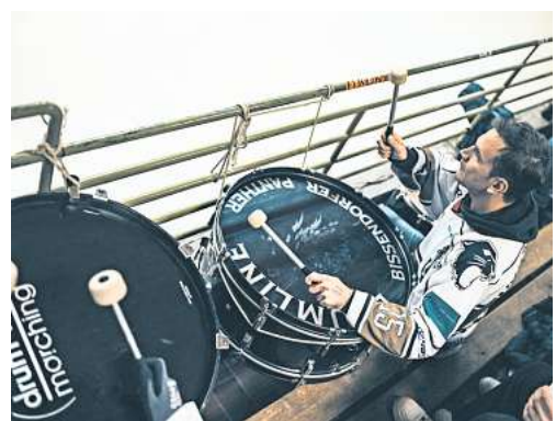
Die 1. Herrenmannschaft der Bissendorfer Panther kann heute Daumendrücker gebrauchen.

Die Bissendorfer Pantherdamen haben am vergangenen Sonntag drei wichtige Punkte in Oberhausen eingefahren. In einer körperbetonten Partie erwischten die Gastgeber den besseren Start und gingen mit 1:0 in Führung. Die Bissendorfer brauchten zunächst ei-