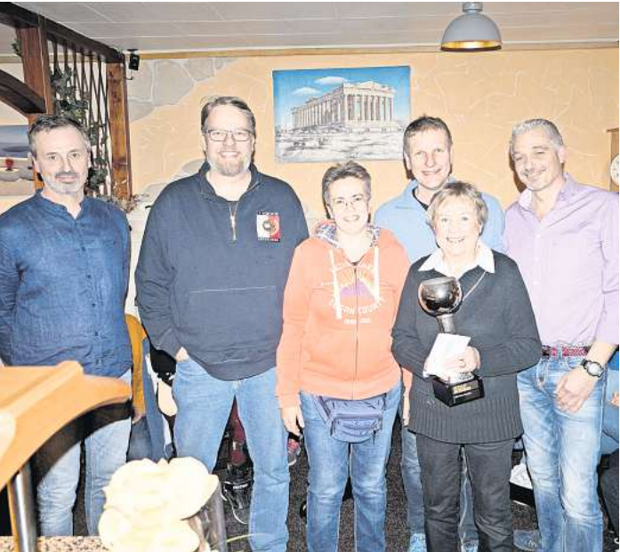
Das Siegerteam beim Ortsbürgermeisterpokal in Resse.

Zwei Vereine sorgen für ein gelungenes Event