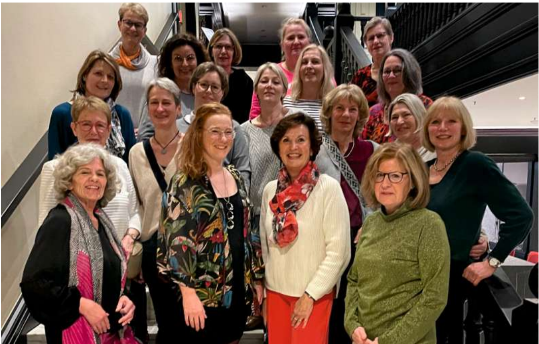
Timmendorf gehört seit Jahren zum festen Programm der aktiven und passiven Spielerinnen.

BRELINGEN. Eine supererfolgreiche Tennissaison liegt hinter den Damen des 1. FC Brelingen. Die Damen 50, angetreten in einer Spielgemeinschaft mit dem TV Badendstedt, schlossen die Wintersaison mit dem ersten Platz in der Bezirksliga ab und besiegelten damit den Aufstieg in die Oberliga. Die Damen 40 beendeten ihre Sommer-Punktspiele mit einem souveränen zweiten Platz in der Bezirksklasse und haben für die neue Saison den Aufstieg fest vor Augen. Die Damen 60 spielten in der Bezirksliga und schlossen die Saison mit einem beeindruckenden dritten Platz ab. Die Erfolge der Damenmannschaften des 1. FC Brelingen resultieren vor allem aus einem tollen Teamspirit, der über den Tennisplatz hinausgeht. Jetzt fand bereits zum 19. Mal in Folge die jährliche Fahrt nach Timmendorf statt, an der sowohl aktive wie passive Spielerinnen teilnahmen. An diesem Wochenende stand nicht nur das Tennisspielen an erster Stelle, sondern vor allem die Gemeinschaft, die Ostseeluft und das gemeinsame Lachen. Dieses einzigartige Wochenende ist jedes Jahr der Start in die gemeinsame Punktspielsaison. Auch für diese Saison sind wieder viele gemeinsame Aktivitäten geplant, bei denen auch neue Mit-