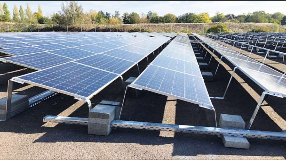
Garten-PV-Anlagen werden wie Freiflächenanlagen gebaut. IBG Solar-Geschäftsführer Marcell Ollesch und sein Team beraten dazu gern.

IBG Solar bietet Lösung bei fehlenden Dachflächen