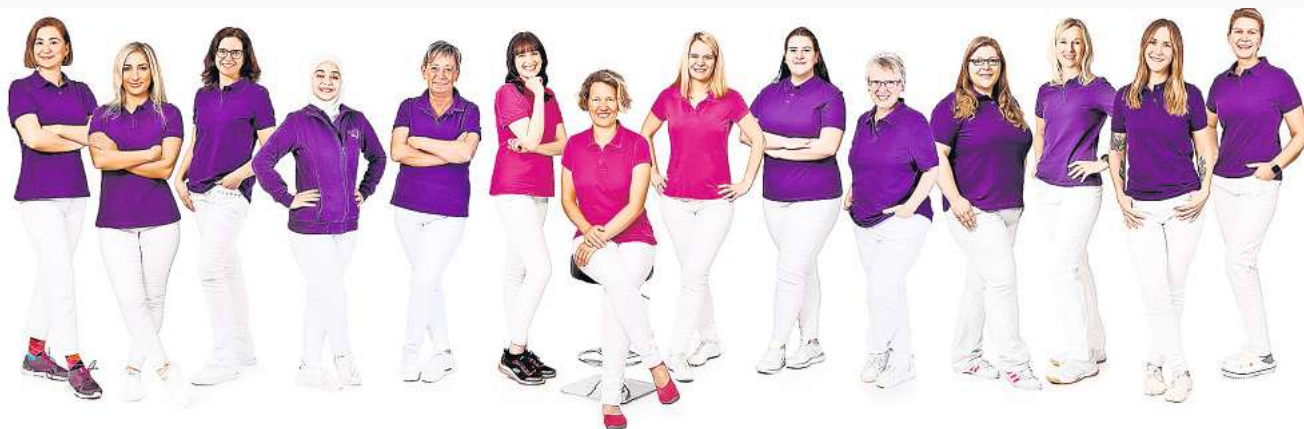
Das komplette Praxis-Team der Bissendorfer Zahnarztpraxis WedeDent.

Der Schwerpunkt von WedeDent liegt auf Vorsorge und Prophylaxe. Speziell geschulte Prophylaxemitarbeiterinnen helfen, die Zahngesundheit nachhaltig zu stärken und geben Tipps für häusliche Mundhygiene. Kinder ab sechs Jahren können die Zahnputzschule absolvieren. Ist Zahnersatz unumgänglich, dann können in den meisten Fällen die Abdrücke digital mit der Intraoralkamera erstellt werden. Ein klassischer Abdruck mit Abdruckmaterial im Mund wird nur noch sehr selten benötigt. Das Cerec Gerät ist seit über fünf Jahren ein fester Bestandteil der Praxis und viele Versorgung (Kronen, Teilkronen und Inlays) können direkt bei einem Termin in der Praxis hergestellt werden. So ist oftmals kein Provisorium notwendig.