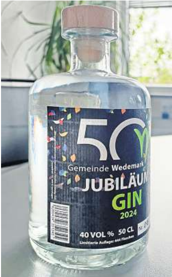
Gemeinde Wedemark sucht den Jubiläums-Gin: Wer hat die Flasche mit der Nummer 50?

WEDEMARK (kra). Der Jubiläums-Gin in nummerierten Flaschen zum 50. Geburtstag der Wedemark verkauft sich gut. Und vermutlich ist auch die Flasche mit der Nummer 50 schon über den Ladentisch gegangen. Die Gemeinde wünscht sie sich zurück und winkt mit einer Belohnung. Neben vielen anderen Jubiläumsprodukten hat die Gemeinde Wedemark anlässlich ihres 50. Geburtstags in Zusammenarbeit mit der Destillerie Rossgoschen auch einen besonderen Gin produzieren lassen. Insgesamt sind 444 Flaschen in den Vertrieb gegangen, entsprechend dem Alter des Amtshauses in Bissendorf für jedes Jahr eine. Jede Einzelne ist von Hand nummeriert. Leider hat die Gemeinde vergessen, sich die Flasche mit der Nummer 50 zu sichern. Jetzt sucht sie nach die-