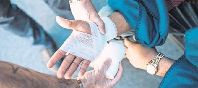
Mit einem einsatzbereiten Verbandskasten kann man helfen, wenn es drauf ankommt.

Es ist besser, vorbereitet zu sein, auch wenn man sich eine sol-che Situation natürlich nicht wünscht. Doch auch ohne kürzliche Ausbildung gilt es vor allem, ins Handeln zu kommen, zumal je-der zur Ersten Hilfe verpflichtet ist. LPS/LK.