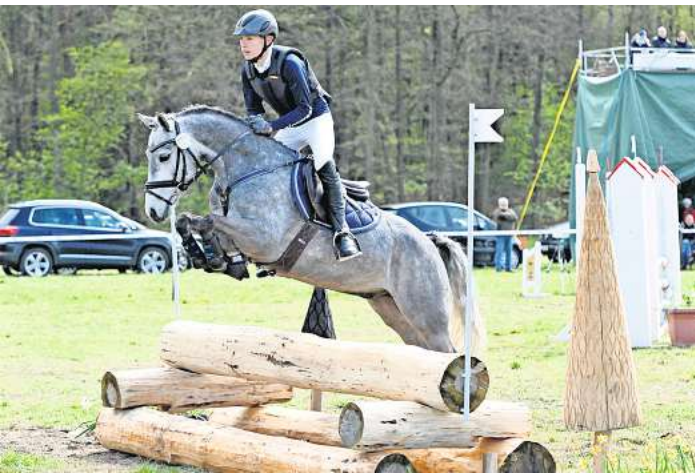
Beim Vielseitigkeitsturnier in Warmeloh bekommen Reitsportinteressierte an diesem Wochenende hochklassigen Pferdesport zu sehen.

Details finden Interessierte auf der Homepage: www.pferdesport-warmeloh.de in der Rubrik Veranstaltungen und dort beim Turnier 2024.