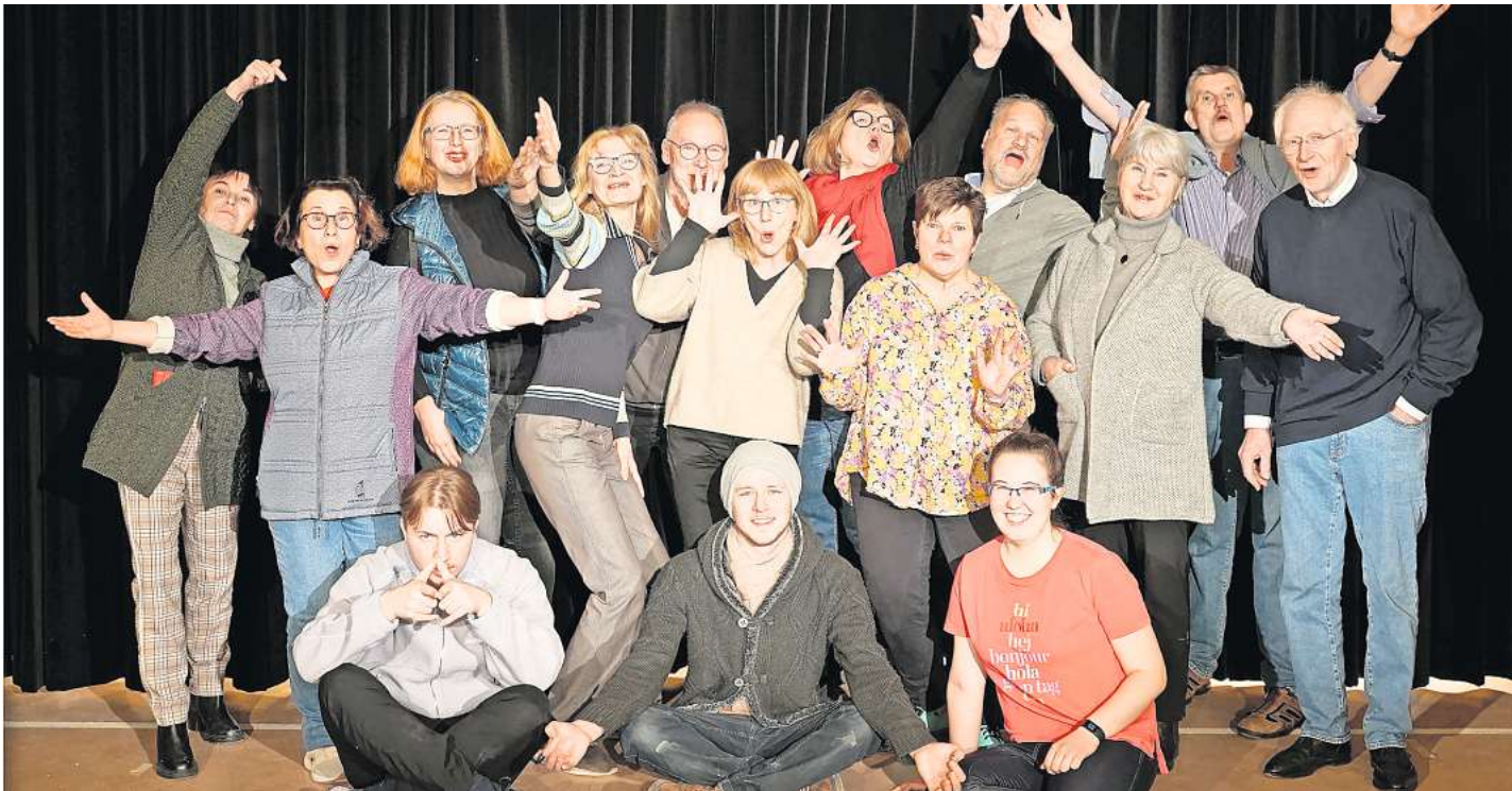
Die Theatergruppe Wedemark ist bereit für ihr neuntes Bühnen-Stück „Top Dogs“.

Die Top Dogs sind skrupellos, knallhart und eiskalt – und plötzlich entlassen