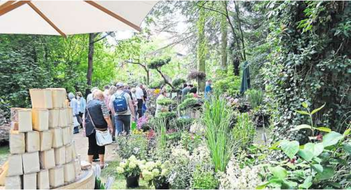
Alles rund um Garten und Genießen gibt es bei der Blumen & Ambiente.