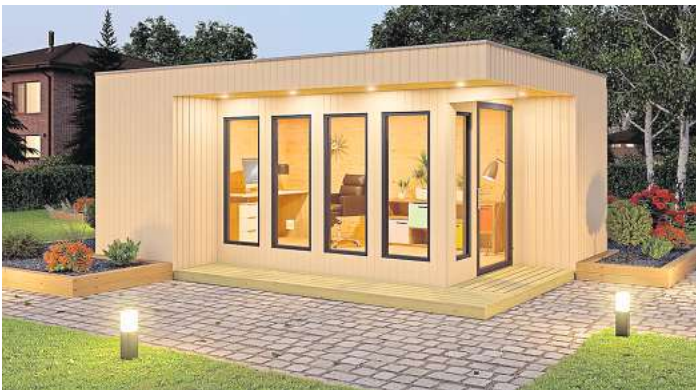
Ein Gartenhaus kann vielseitig genutzt werden.

ob Fitnessgeräte oder Werkstatt: Hier kann man sich auf viele Arten austoben. Wer häufig Gäste bekommt und ihnen einen gewissen