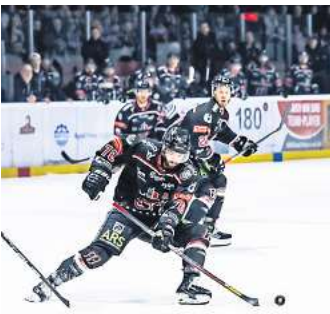
Die Eishockeycracks der Hannover Scorpions kämpfen auch in diesem Jahr wieder um den Aufstieg in die DEL 2.

MELLENDORF. Sonntag, 21. April, 18 Uhr: Das vierte Spiel der Finalserie der Hannover Scorpions gegen die Blue Devils Weiden steht an. Es geht um den Aufstieg in die DEL 2. Wer zuerst vier Spiele gewonnen hat, sichert sich den Titel des Deutschen Oberligameisters und eben den angesprochenen Aufstieg. Tickets für das Spiel in der Mellendorfer ARS-Arena gibt es über die Homepage oder auch in der HAZ/NP/ECHO-Geschäftsstelle im CCL. Wenn es ein sechstes Spiel in dieser Serie geben sollte, findet es am Freitag, 26. April, um 20 Uhr in Mellendorf statt.