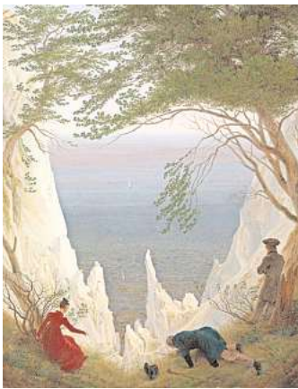
Das Gemälde „Kreidefelsen auf Rügen“ von Caspar David Friedrich.

Abfahrt ist um 7.30 Uhr am Platz vor dem Bürgerhaus, Am