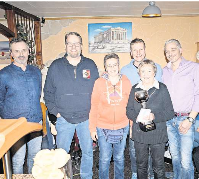
Das Siegerteam beim Ortsbürgermeisterpokal in Resse.

Zwei Vereine sorgen für ein gelungenes Event