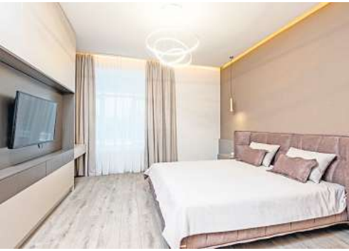
LEDs sorgen für ein ausgefallenes Flair.

Daher ist man nicht auf eine Farbe festgelegt, sondern kann das Umgebungslicht der jeweiligen Stimmung anpassen. Besonders elegant sind LED-Streifen. Dabei handelt es sich um flexible Bänder, die individuell an unterschiedlichen Orten angebracht werden können. So ist beispielsweise eine indirekte Beleuchtung der Küchenzeile möglich. Von knalligem Gelb bis hin zu