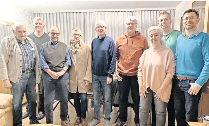
Der neue Vorstand des Bürger- und Verschönerungsvereins Mellendorf.