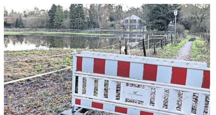
Gesperrt: Das Flüsschen Wietze ist über die Ufer getreten, die Fußgängerbrücke hinter der ehemaligen Christophorus-Kirche in Bissendorf-Wietze ist gesperrt.

Wegen des Starkregens war der Grundwasserspiegel in der Wedemark über Weihnachten und Neujahr stark angestiegen, weshalb viele Keller mit Wasser vollgelaufen waren. Weil das zum Handeln zwingt, hat die SPD-Fraktion im Ausschuss für Klimaschutz, Umwelt und Gebäude einen Antrag gestellt, der die Verwaltung beauftragt, eine Starkregenhinweiskarte samt Oberflächenabflussmodell für die Gemeinde zu erstellen. Beides soll nach Vorstellungen des Ausschusses mithilfe einer Förderung, nämlich der „Richtlinie Kommunaler Klimaschutz“ der Region Hannover, finanziert werden. In Folge des Klimawandels nehmen die Jahresniederschläge zwar ab, gleichzeitig nehmen aber Starkregenereignisse immer mehr zu. Bei Starkregenereignissen fällt innerhalb weniger Stunden eine Niederschlagsmenge, die sonst über Monate verteilt zu erwarten wäre. Im Antrag werden Beispiele genannt: „Dortmund 2021, Hamburg 2022, Berlin 2023, bei denen der Starkregen Fahrzeuge beschädigte und in Bauwerken extrem teure Schäden verursacht hatte.“ Auch die Überflutungen im Ahrtal 2021 seien auf Folgen des Klimawandels zurückzuführen. Aber wie definiert man eigentlich einen Starkregen? Der Deutsche