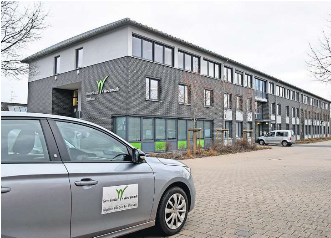
Der Platz reicht nicht mehr aus: das Rathaus in Mellendorf, Sitz der Wedemärker Gemeindeverwaltung.