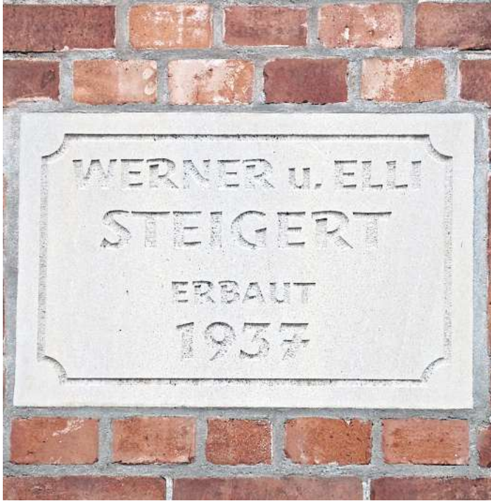
Was wird im Monat März gesucht?