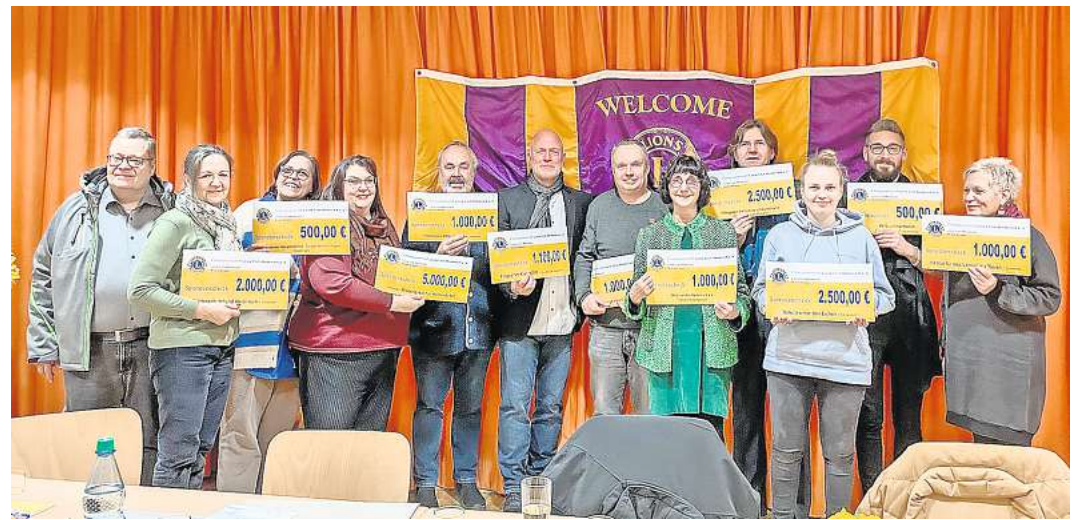
Freudige Gesichter bei der Spendenübergabe. 19.100 Euro spendete der Lions Club Wedemark an gemeinnützige und soziale Projekte.

Eine Spende von 2.000 Euro geht in diesem Jahr an den Kinderschutzbund Wedemark. „Von der Spende finanzieren wir einen mehrwöchigen Sommer-Schwimmkurs für zehn bis fünfzehn Kinder im Grundschulalter, ihr Abzeichen und eine Saisonkarte für das Freibad in Mellendorf. Dadurch, dass immer weniger Schwimmunterricht an den Schulen stattfindet, ist dieses Angebot für finanziell benachteiligte Kinder eine seltene und umso wichtigere Möglichkeit schwimmen zu lernen. Wir freuen uns sehr, dieses Angebot durch die wiederholte Spende des Lions Club Wedemark aufrechterhal-