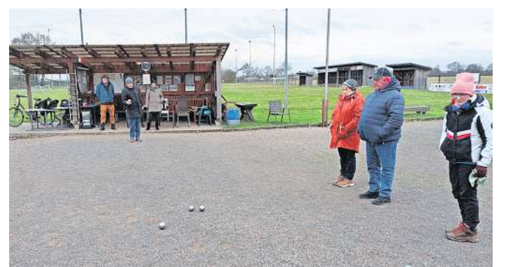
Die Esseler Boule-Spieler freuen sich auf die Saisonöffnung.

kelheit gespielt werden kann. Für Verpflegung (Bockwurst) und Getränke ist gesorgt. Das Startgeld beträgt für Gäste vier Euro, die Bestplatzierten bekommen einige Euro als Siegprämie. Insgesamt stehen in diesem Jahr zehn Miniturniere auf dem Programm. Abgeschlossen wird die Turnierserie im Oktober mit den Endspielen und gemeinsamem Essen und Trinken. Alle Miniturniere finden auf dem Boulodrome des SV Essel, Bothmerscher Weg 8, in Essel statt. Termin des ersten Miniturniers: Mittwoch, 13. März, 18 Uhr. Kurz darauf finden zwei weitere Miniturniere statt: Sonntag, 17. März, und Sonntag, 24. März, Spielbeginn jeweils um 14 Uhr. Infos unter (0173) 600 21 96 bei Robby Lenthe.