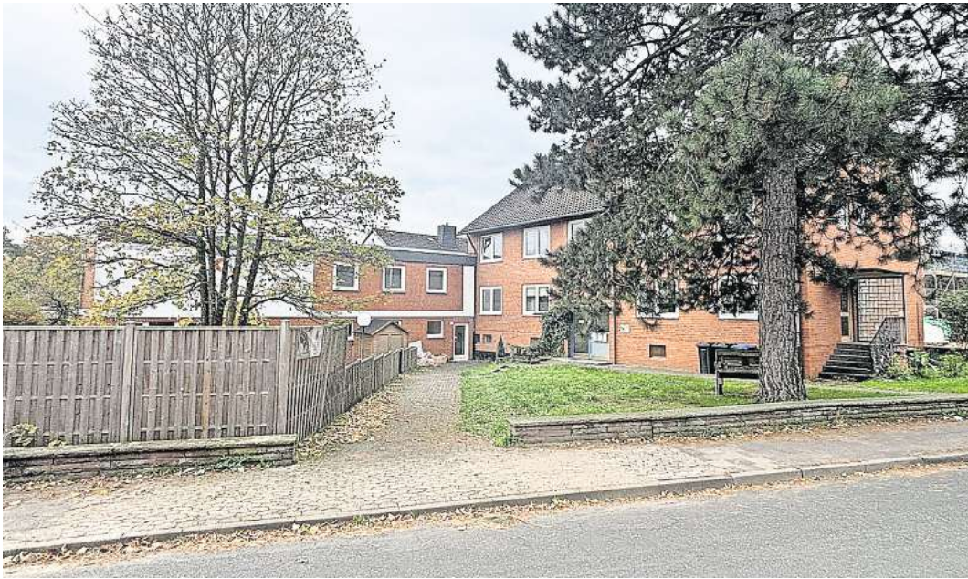
Neue Außenstelle der Gemeindeverwaltung: Das Gebäude Am Sande wird für 15 Büroarbeitsplätze umgebaut.