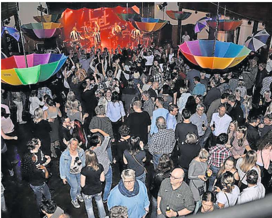
Voll wird es immer bei der Saalfete in Büchten und so ist die Stimmung schon garantiert.

BÜCHTEN. Am Sonnabend, 2. März, ab 20.30 Uhr beginnt die große Saalfete auf dem legendären Saal in Büchten. Musik für jeden Geschmack. Unter diesem Motto werden upSet und in den Spielpausen DJ Lu junior für richtig gute Stimmung sorgen. Das musikalische Highlight bei der Saalfete am März ab 20.30 Uhr ist die Top 40 Partyband „upSet“, seit über 30 Jahren Garant für Super-Stimmung und mit einer mitreißenden Show. Die sechs Musiker sind aus der norddeutschen Partylandkarte nicht mehr wegzudenken. Auf Stadtfesten von Helgoland bis NRW, von Osnabrück bis Duderstadt hinterlassen sie heisere Fans, wenn ein Partykracher auf den nächsten mitgesungen wird. Von sechs bis sechzig ist garantiert für jeden was dabei, topaktuelle Charts, Party Klassiker, Schlager, NDV, 80er, aber auch rockiger Gitarrensound von ACDC bis Kraftclub, alles authentisch und live. Umrahmt wird die mitreißende Darbietung durch eine großartige Lichtshow und perfekten Klang.