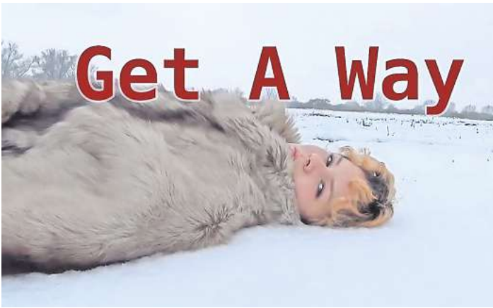
Dieses Plakat haben die Schüler selbst entworfen.

Das Motto „Übernatürliches“ hat der Kurs im Herbst gemeinsam beschlossen, um dann in kleineren Gruppen vier ganz unterschiedliche Filme zu realisieren. Thema und Aufgabe verlangten und trainierten ebenso