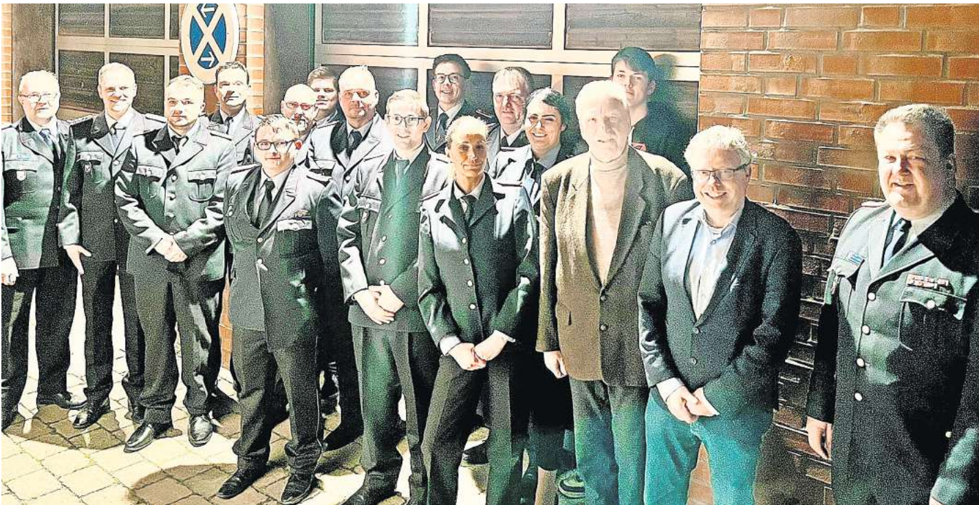
Geehrte und Beförderte mit Honoratioren und Gästen bei der Freiwilligen Feuerwehr Essel.

Im letzten Jahr konnten wieder 26 Lehrgänge durch Kameraden/innen der Einsatzabteilung erfolgreich absolviert werden. Natürlich durfte der Neubau unseres Gerätehauses sowie ein kleiner Ausblick auf das kommende Jahr 2024 und seiner besonderen